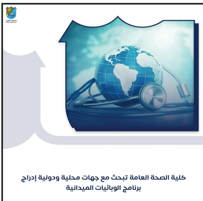
كلية الصحة العامة تبحث مع جهات محلية ودولية إدراج برنامج الوبائيات الميدانية