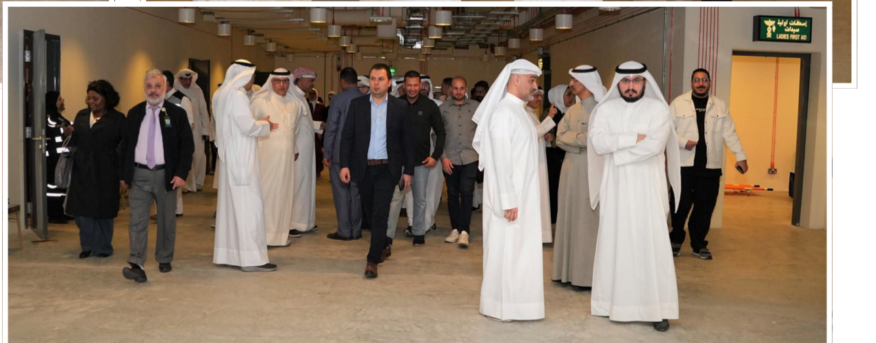
لقطات من تنفيذ تجربة الإخلاء الوهمي في الجامعة