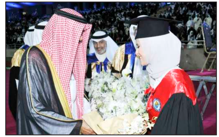
• سمو لي العهد يتلقى باقة ورد لدى وصوله