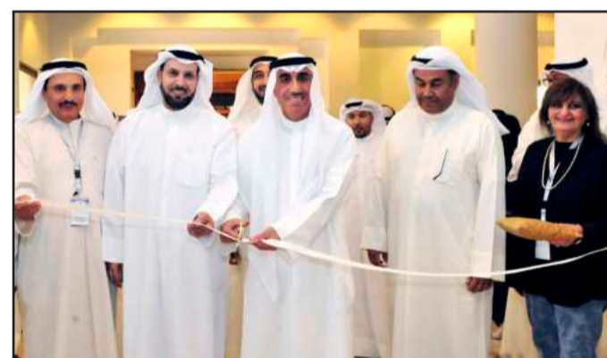
• مدير الجامعة يقص شريط افتتاح الملتقى