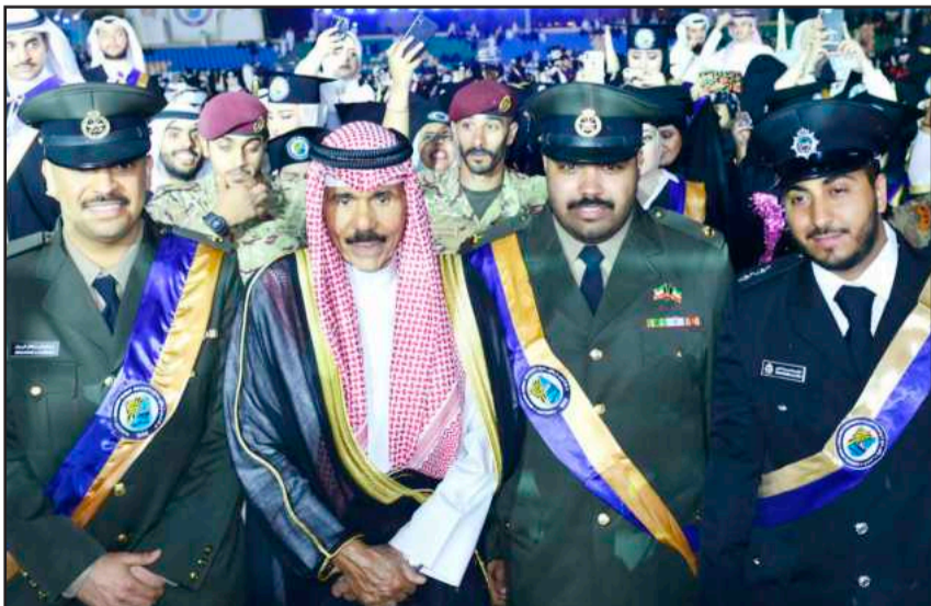
• سمو ولي العهد متوسلاً عدداً من الضباط الخريجين

المقالات المنشورة في أفاق تعبر عن آراء كاتبها لا عن رأي الجامعة أو الجريدة