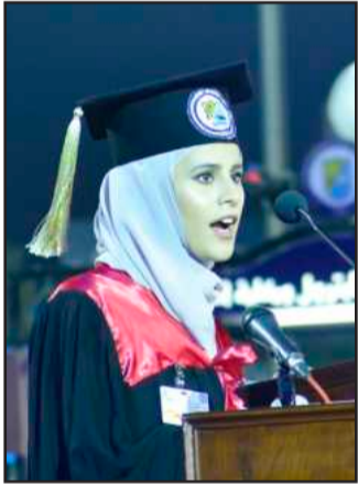
• نور البحر تلقي كلمة الخريجين