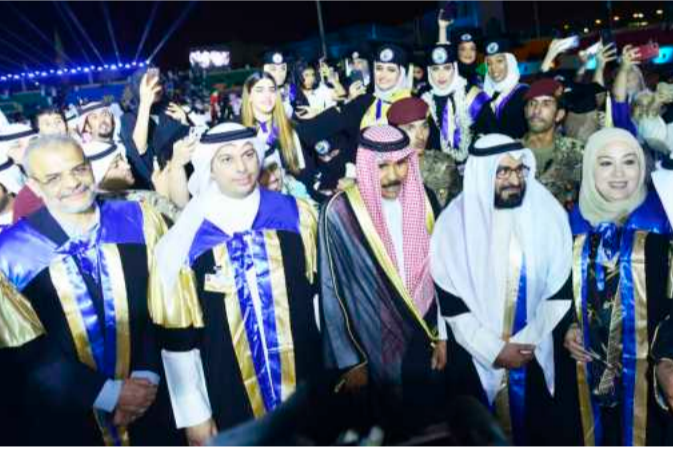
•...ومتوسلاً عدداً آخر من الأساتذة