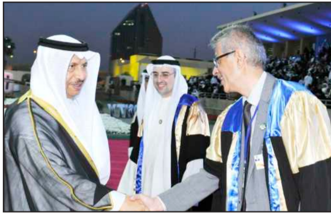
•... و مصافحا قياديي الجامعة