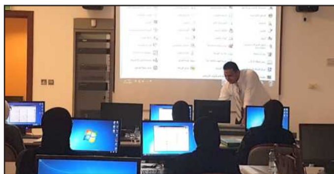
• جانب من إحدى الدورات

مركبة ويصعب التكهن بها حتى لا يتم استغلال البيانات لذا فقد تم تدريبهم على كيفية حماية البيانات ونسخها احتياطياً لضمان عدم ضياعها أو تلفها أو سرقتها مما يبعد المخاطر ويوفر الأمن الرقمي سواء للفرد أو للمنظمة التي يعمل بها. وسيكون هناك اختبار كشرط لحصولهم على شهادة معتمدة من مؤسسة الرخصة الدولية لقيادة الحاسب الآلي لمجلس التعاون الخليجي «ICDL» التي تعمل تحت اشراف أي سي دي ال-العربية.