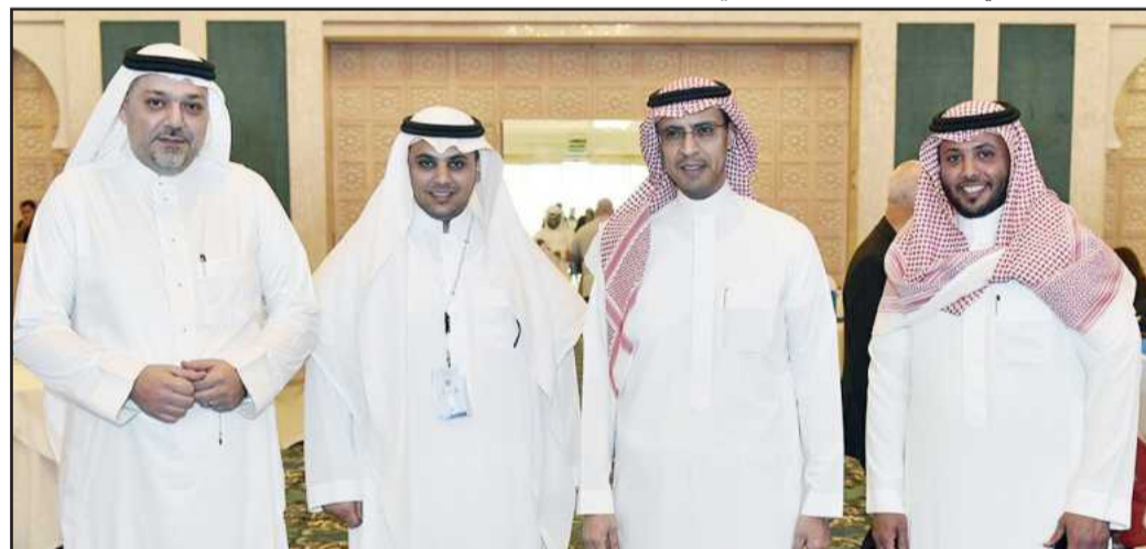
• جانب من حضور المؤتمر