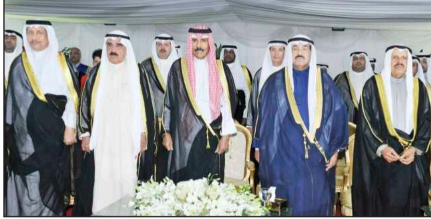
• سمو ولي العهد الشيخ نواف الأحمد والشيخ فيصل السعود وسمو الشيخ ناصر المحمد وسمو رئيس الوزراء الشيخ جابر المبارك