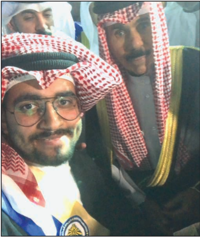
• سمو ولي العهد والخبير عبدالله الفضلي من جولة الجامعة