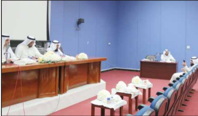
• جانب من مناقشة إحدى الرسائل