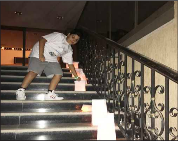
• خفض الإضاءة

استمراريتها كبشر والحفاظ على التنوع البيولوجي والبيئي. وأوضحت أن هدفنا خلال الحدث التركيز على التدابير الصغيرة التي يمكن للأفراد اتخاذها لتقليل استهلاك الطاقة الكهربائية والتي بدورها ستقلل من انبعاث الغازات الحابسة للحرارة في الغلاف الجوي. مؤكدة أن «اختيارنا والتغييرات البسيطة في نمط حياتنا يمكن أن تحدث فرقاً كبيراً في التأثير البيئي للفرد».