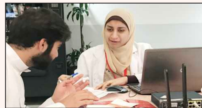
• فحص عينات الدم