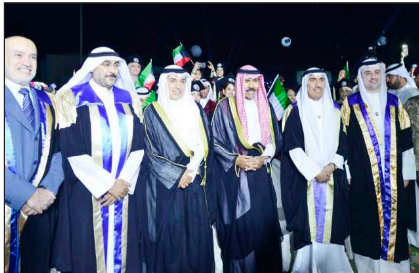
• سمو ولي العهد متوسلاً وزير التعليم العالي وقيادي الجامعة