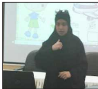
• الطالبة الحواله محاضرة في الورشة

وأضاف أن الطالب يتقدم بمقترح مكتوب عن موضوع ورشته التدريبية ويتم تقييم المقترح من قبل مكتب الاستشارات والتدريب وفي حال تم قبوله أو وضع بعض التعديلات عليه يتم التواصل مع الطالب وترتيب كل ما يحتاجه لإقامة ونجاح ورشته كالإعلان عنها وحجز القاعات وتوفير الأجهزة المطلوبة وغيرها.