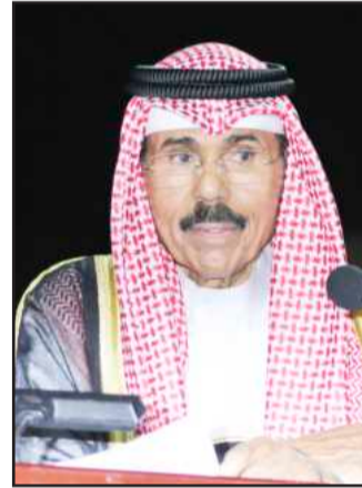
• سمو ولي العهد متحدثاً