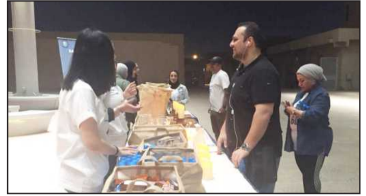
• اضاءة الشموع