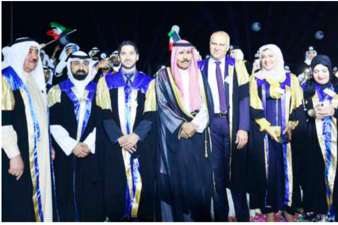
• سمو ولي العهد متوسلاً عدداً من أساتذة الجامعة