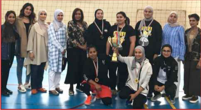
• الطالبات الفائزات