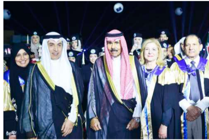
•...ومتوسلاً عدداً آخر