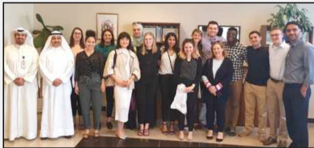
• الوفد لدى زيارته الى الادارية

وبحث الجانبان سبل التعاون بين كلية بوسطن وكلية العلوم الإدارية بجامعة الكويت في مجال استفادة الطالب الجامعي على المستوى الأكاديمي والثقافي والعملية. وقام الوفد بجولة حول أرجاء الكلية للتعرف على إمكانيات تطوير وتنمية الطالب الجامعي والتعرف على متطلبات وإجراءات التقديم في برنامج التبادل الطلابي وبرنامج التدريب الإضافي إلى نظام المقررات الدراسية لدى الطرفين.