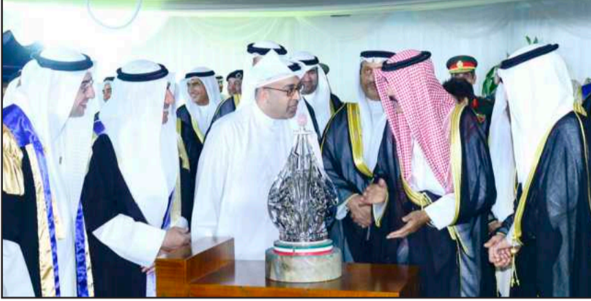
• سمو ولي العهد يتلقى هدية تذكارية

ابتعدوا عن الأفكار المتطرفة المتعارضة مع منهجنا المعتدل وحافظوا على أخلاقنا وتقاليدينا