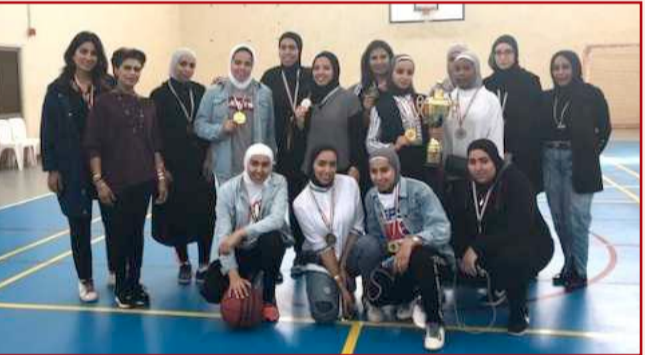
• الحوض بعد الصيانة

تحت رعاية الهيئة العامة للرياضة اقيمت بطولة الكليات لكرة السلة يوم الاثنين الموافق ٢٠١٨/٣/٥ من الساعة ١٢ حتى ٢ على صالة الألعاب الرياضية في كلية الآداب. حيث شارك في البطولة عدد (٤) فرق من مختلف الكليات، لعبت المباريات على طريقة الدوري وكانت النتيجة كالآتي: كلية العلوم الإدارية - المركز الأول - كلية العلوم - المركز الثاني وفي الختام تو توزيع المديليات والكؤوس على الفرق الفائزة.