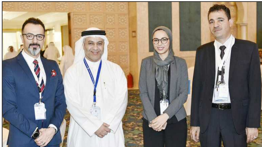
• وجانب آخر

رأس المال البشري القادر على المساهمة في التنمية. افتتح المؤتمر بمحاضرة رئيسية للأستاذ د. منير بشور، الخبير في مجال التعليم المقارن ورسم السياسات التعليمية في الجامعة الأميركية في بيروت وعضو الهيئة اللبنانية للعلوم التربوية، بعنوان «التعليم النوعي تحت ظروف قسرية: بعض نوافذ الفرص» تحدث فيها عن معنى التعليم النوعي ومتطلباته المسبقة وآثاره المحتملة على المستقبل في العالم العربي، ثم ربط ذلك بالتحديات والفرص التي يواجهها العالم العربي في هذا الصدد، بما في ذلك ارتفاع أعداد الطلاب والإدراجية بين القطاع العام والقطاع الخاص، ومتطلبات السوق. وافتتحت الجلسة الأولى للمؤتمر والتي تحورت حول تحديات تنفيذ الممارسات الجيدة في المنطقة العربية، بمحاضرة للدكتورة نادية بدرابي، نائب رئيس الشبكة العربية لضمان الجودة في التعليم العالي، بعنوان «تحديات ضمان الجودة في المنطقة العربية» تناولت فيها التحديات التي تواجهها الدول العربية لتنفيذ الممارسات الجيدة في مجال ضمان الجودة في التعليم العالي، وتعزيز التعاون في مختلف المجالات للتغلب على التحديات الحالية.