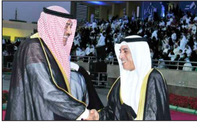
• وزير الخارجية الشيخ صباح خالد مصافحا د. العازمي