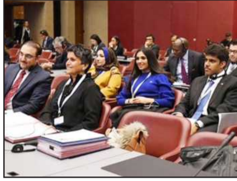
• النائب صفاء الهاشم والطلبة أثناء أحد الاجتماعات