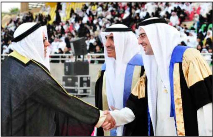
• وزير الديوان الأميري الشيخ علي الجراح مصافحا د. الرفاعي