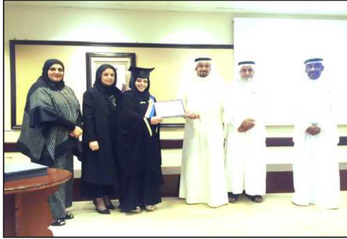
● خريجة من مملكة البحرين

وبين العتيبي أن الاتحاد سيساهم بدعم البحث العلمي في المجالات الكيميائية حتى يتمكن من أداء دوره كاملا في تطوير الصناعات الكيميائية بدول الخليج ونقل التكنولوجيا الحديثة إليها، مع الإسهام في خلق مبتكرات كيميائية جديدة. وعن أهداف الاتحاد ذكرانه يسعى لتوحيد برامج التعليم والتدريب، وكذلك استحداث برامج تخصصية متعددة في الكليات والمعاهد التي تدرس بها علوم الكيمياء مع تطويرها بما يتماشى مع البرامج الحديثة المماثلة في الدول المتقدمة، وكذلك توفير الكفاءات الكيميائية العالية مع حث الجهات المسؤولة بدول الخليج على توفير كافة الإمكانيات التي تضمن ذلك. أيضاً العناية بالتعليم المهني والتدريب لتخريج الفنيين الذين يتميزون بحسن الأداء للعمل في ميادين الكيمياء المتعددة. وبين العتيبي أن من أولويات اتحاد