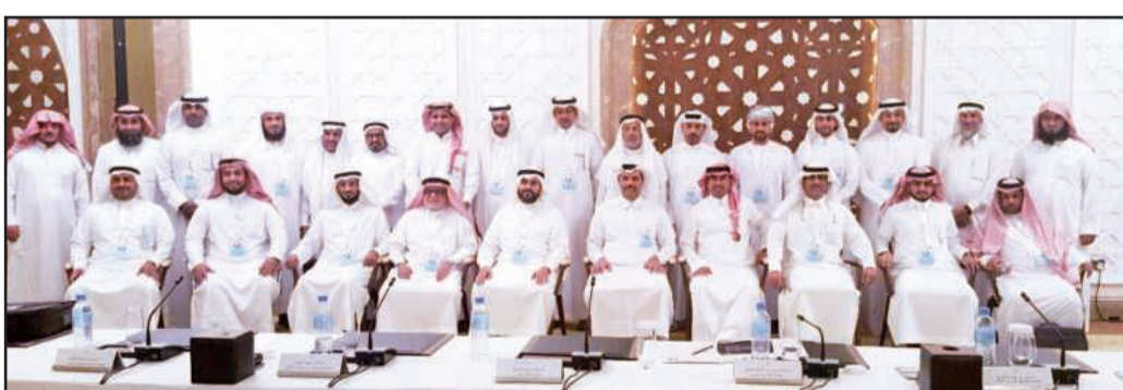
● لقطة تذكارية لحضور الاجتماع