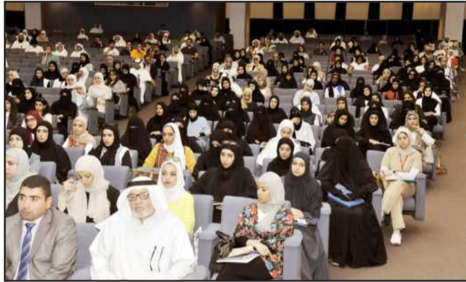
● جانب من الحضور

وأضاف أنه قام بعد ذلك بزيارة إلى مستشفى MDA CANCER CENTER بهيوستن -الولايات المتحدة الأمريكية وهو أكبر وأعظم مستشفى في علاج وأبحاث السرطان في العالم، وقابل دكتورة باحثة هناك لها نفس الاهتمامات بعد أن نصحوه بمقابلتها للخروج بنتائج بحثية جيدة، خاصة أن لديها اهتمامات بحثية في مجال السرطان والالتهابات، وأخبرها أن المواد المستخلصة من السمكة (الصلور) ذات تأثير عجيب حيث تزيل التورم خلال ساعات وليس لها مثل في العالم، ونظرت إليه باستغراب، وبينت له أن هناك نوعين من الالتهابات (الالتهاب الحاد) وهذا النوع من الممكن علاجه، والنوع الثاني (الالتهاب المزمن) وعلاجه مستحيل تقريباً، ومع المدة يتحول هذا الالتهاب إلى سرطان، مشيرة إلى أنه لديها اهتمام كبير بالالتهابات لأنه إذا استطعنا أن نمنع الالتهاب نمنع تحوله إلى سرطان لدى الإنسان، وقام بإحضار عينة من تلك المواد وقامت بتجربتها للتعرف على كيفية عمل هذه المواد، واستخدمت ٤ مواد وكلها دهون مستخلصة من السمكة، وقامت بتجربتها على خلايا معزولة من سرطان الرئة، ووجدت