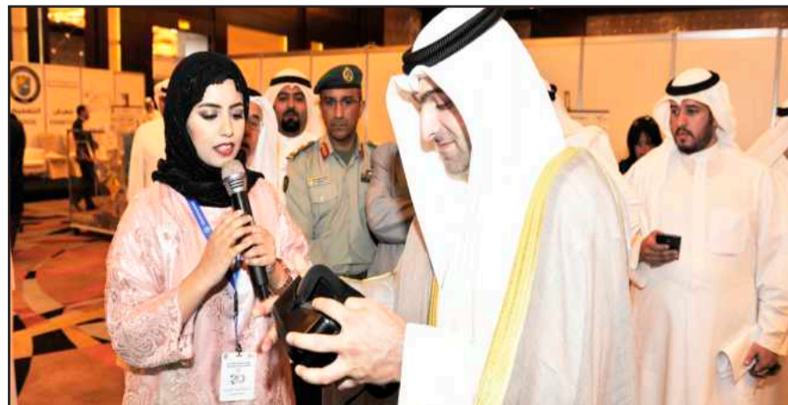
● راعي الحفل يعاين احد ابتكارات الطلبة