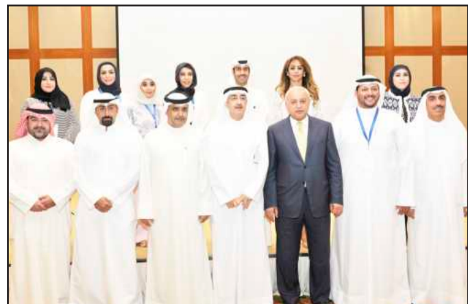
• وزير التربية ومدير الجامعة يتوسطان اللجنة المنظمة

كتب محمد الفودري: برعاية وحضور وزير التربية والتعليم العالي الرئيس الأعلى للجامعة د.بدر العيسى نظمت كلية الهندسة والبتترول حفل الشراكة الاستراتيجية بين جامعة الكويت وشركة نفط الكويت، في قاعة الماسة بفندق جميرا بحضور مدير جامعة الكويت د.حسين الأنصاري وعدد من الأساتذة والمسؤولين في الجامعة ومن شركة نفط الكويت. وعقب الحفل قال مدير جامعة الكويت د. حسين الأنصاري في تصريح للصحافيين «بدأت هذه الشراكة عام ١٩٩٣ من خلال ١١ طالبا بمبادرة من جامعة الكويت وشركة نفط الكويت، لتدريب طلبة جامعة الكويت وصقل مهاراتهم في حقول البترول وقطاعات النفط والغاز المختلفة، واستمرت هذه العلاقة العريقة لـ ٢٥ عاما امتدت ما بين التدريب والاستشارات والبحث العلمي، وحل المشكلات التي تواجه القطاع النفطي، ونحن سعداء بهذه المشاركة التي تعتبر من أعرق الشراكات المبرمة ما بين الجامعة وما بين مختلف الجهات بالدولة».