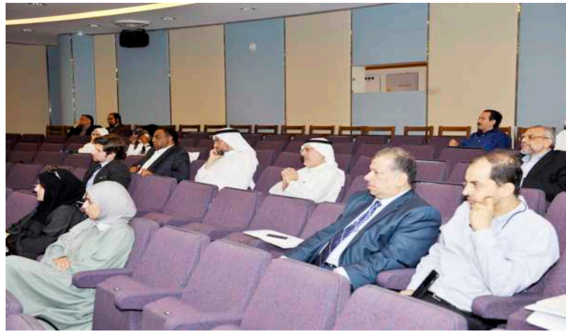
During the workshop