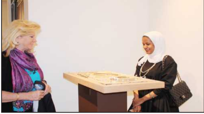
● طالبة ونموذج لتصميمها