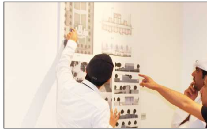
● مخطط لتصميم اسطبل

في مثل هذا المعرض خارج الجامعة يعتبر جزءاً من خدمة المجتمع، كون عضو هيئة التدريس مطلوب منه التدريس والبحث العلمي إضافة إلى خدمة المجتمع، وتأتي هذه المشاركة خاصة لمربي الخيل في الكويت والسبب في الاتجاه نحو هذه الفئة، هو كونه