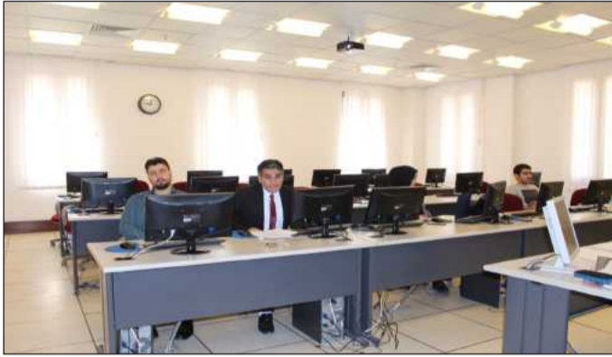
● جانب من التدريب

يقدم لكافة أفراد المجتمع ممن يرغبون بتطوير مهاراتهم باستخدام الحاسب الآلي مع العلم أنه يتكون من ٧ مواد أساسية في مجال الحاسب الآلي وشهادته معتمدة دولياً. وذكر كرم أن المركز قام بتدريب مجموعات متعددة من الأفراد بأوقات مختلفة على فترتين صباحيتين وفترتين مسائليتين ويتم تدريبهم باللغة التي يرغبونها سواء الإنجليزية أو العربية مع تقديم خصم خاص للطلبة.