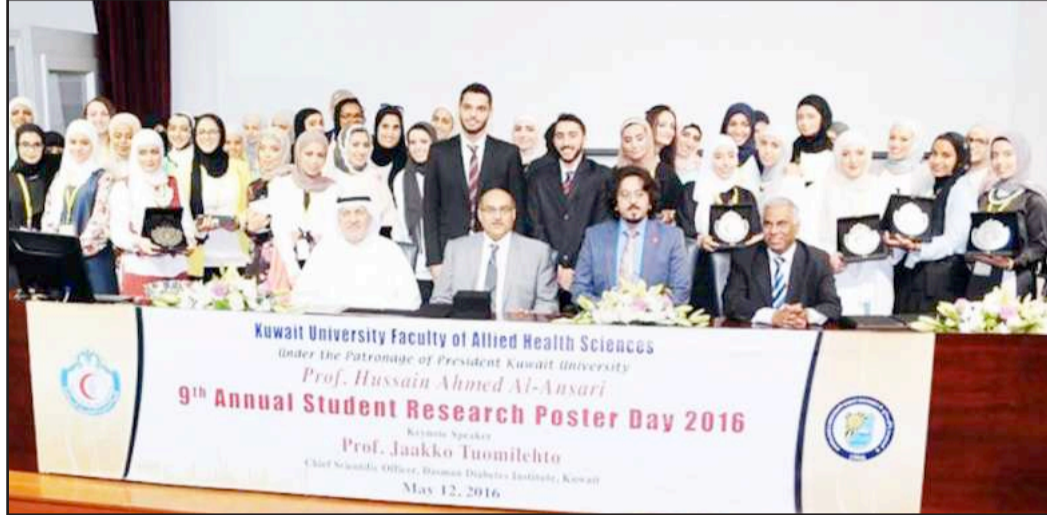
● لقطة تذكارية للمشاركين والمنظمين