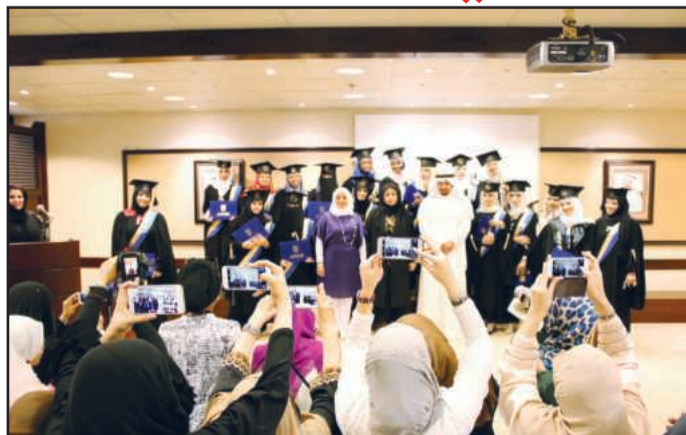
● توثيق لحظة التخرج

المسعود: الجامعة لا تألوا جهداً في توفير كافة الامكانيات لطلبة السكن في تحقيق النجاح