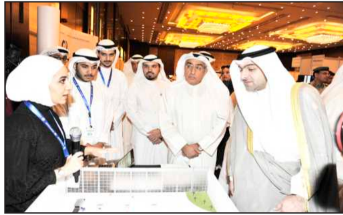
● ويتابع احد المشروعات المشاركة