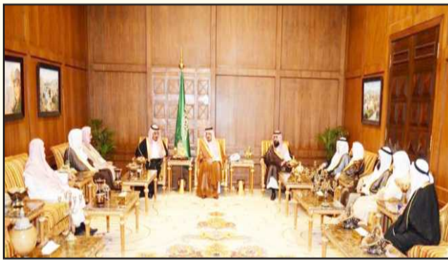
● جانب من استضافة أمير عسير

ومؤشرات الأداء، التعليم عن بعد وموقع الأمانة على الشبكة العنكبوتية، والتوسع بقبول طلاب المنح ومقترح اعتماد برامج الشريعة في الخليج كميّار للتقييم العالمي في الدراسات الشرعية إضافة إلى مقترح إنشاء مكتبة إلكترونية للرسائل العلمية في الكليات الشرعية ومقترح تأسيس جمعية مستقلة لنشر العلوم الشرعية إلكترونياً بصيغة المقررات المفتوحة المبسطة. كما ناقش الاجتماع مقترح إقامة مؤتمر دولي لمناقشة أهم القضايا والمستجدات في دول مجلس التعاون.