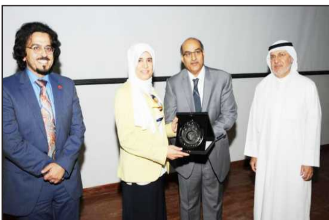
● درع تذكارية