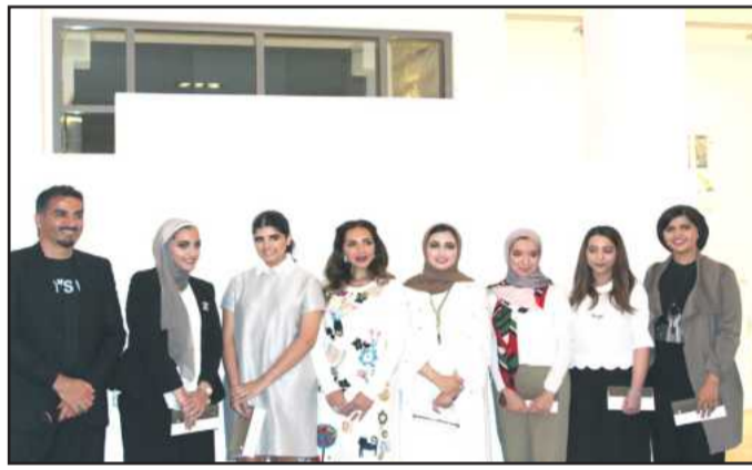
● الطالبات المشاركات مع استاذ المقرر

إقامة لمربي الخيل وقيادة خاصة للخيل ومخزن يضم الاكل الخاص بالخيل والاسطبلات وغيرها». وأكد دشتي أنه تم الاهتمام بالجانب البيئي والاستدامة فيما يتعلق باستغلال الظروف المناخية في هذه المشروعات، مشيراً إلى اختيار منطقة الوفرة التي تم توزيع مساحات زراعية لمربي الخيل، مضيفاً: «يزالنا في هذا الجانب» بيت العرب» الذي يسعى لتقديم خدمات لمربي الخيل، وله اسهامات كثيرة من خلال عقد المحاضرات المتخصصة من داخل وخارج الكويت، وهذه تعتبر سابقة لنا بالمشاركة في تقديم نماذج وتصميمات معمارية لاسطبلات الخيل ونتمنى أن يستفيد مربي الخيل من هذه المشاريع وتنفيذها على أرض الواقع، ونحن نفتخر بطلبتنا الذين قدموا خدمة للمجتمع من خلال هذه المشاريع.