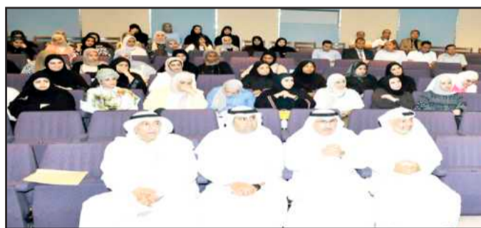
● جانب من الحضور