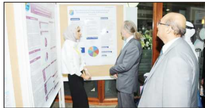
● نقاش علمي

وتخلل هذا اليوم محاضرة ألقاها المفتش العلمي في معهد دسمان للسكري البروفيسور جاكو توميلهااتو والتي تضمنت خطر الإصابة بمرض السكري والسمنة، ودراساته التي أقامها على عدة سنوات عن مرض السكري ومخاطره على أفراد المجتمع سواء في منطقة الخليج وحول العالم. ويعتبر حضور البروفيسور جاكو في يوم الملصق العلمي الطلابي التاسع دعماً وتشجيعاً للطلبة للاستمرار في