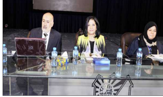
المتحدثون في الندوة •