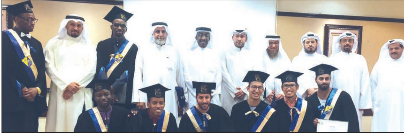
● لقطة تذكارية للخريجين مع مسؤولي السكن