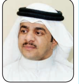
اعداد مهدي العجمي

يتنافس الكثير من الشعراء على نشر قصائدهم في هذه الصفحات في كل اسبوع، ويحرص كل منهم على تقديم ما هو افضل من السابق وهذا امر طبيعي جدا في مسيرة اي شاعر. ربما يكون الشعراء الشباب مبدعين وقادرين على كتابة القصائد القريية من افكارهم ومشاعرهم وعواطفهم واعمارهم!! ليخرجوا من ذلك بتجارب تتزايد في نضجها