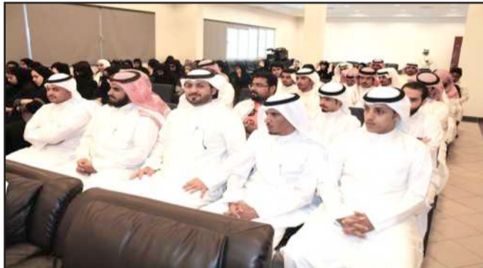
● جانب من حضور الندوة

ذكر الشيباني أن الطلبة -الذكور خاصة- الأشقياء ينشغلون في