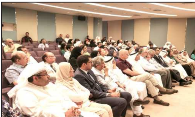
● متابعة واهتمام من الحضور

المحلية الكويتية التي تعتبر فريدة من نوعها، ولم يتم البحث بها من قبل، وذلك للتعرف عن إمكانية الاستفادة منها في خدمة العلم والبشرية، وقد فكر بالبحث في سموم بعض المخلوقات في البيئة البحرية، كونه غواصاً ومحباً للبحر، فنظر إلى الأفاعي البحرية التي كانت درجة السمية فيها عالية جداً (أكثر من ١٠ مرات من الكوبرا البرية)، ووجد أن هناك من قام بالبحث في هذا الموضوع، وبعد ذلك جاء إلى سمكة اسمها (الفريلة) السامة، ووجد أن سمها قليل وعددها قليل ويحتاج إلى مواد مستخلصة كثيرة لتحقيق نتائج، حتى توصل إلى سمكة اسمها باللغة العربية (الصلور) وبالعامية (الجمه) وهذه السمكة لها ٣ شوكات سامة - واحدة بالظهر، ٢ بالزعانف الصدرية وكل زعنفة فيها شوكة سامة، ولم يسمع من قبل عن موت أي شخص في منطقة الخليج بسببها، ويعتبرون محظوظين لأن سمها يسبب الشلل حتى وإن كان مؤقتاً، كما يؤثر على دقات القلب ويؤدي إلى تسارعها، ويسبب حرارة ودوخة ولوعة، ومن هنا اختار أن يكون بحثه حول هذه السمكة المتواجدة في المنطقة.