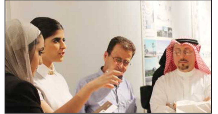
● شرح لمكونات احدي التصاميم

إقامة لمربي الخيل وقيادة خاصة للخيل ومخزن يضم الاكل الخاص بالخيل والاسطبلات وغيرها». وأكد دشتي أنه تم الاهتمام بالجانب البيئي والاستدامة فيما يتعلق باستغلال الظروف المناخية في هذه المشروعات، مشيراً إلى اختيار منطقة الوفرة التي تم توزيع مساحات زراعية لمربي الخيل، مضيفاً: «يزالنا في هذا الجانب» بيت العرب» الذي يسعى لتقديم خدمات لمربي الخيل، وله اسهامات كثيرة من خلال عقد المحاضرات المتخصصة من داخل وخارج الكويت، وهذه تعتبر سابقة لنا بالمشاركة في تقديم نماذج وتصميمات معمارية لاسطبلات الخيل ونتمنى أن يستفيد مربي الخيل من هذه المشاريع وتنفيذها على أرض الواقع، ونحن نفتخر بطلبتنا الذين قدموا خدمة للمجتمع من خلال هذه المشاريع.