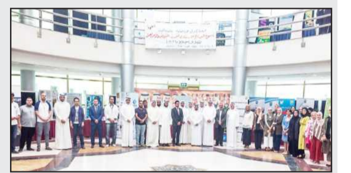
● لقطة تذكارية للمنظمين والمشاركين