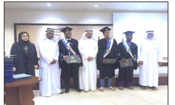
● تكريم خريجي النيجر