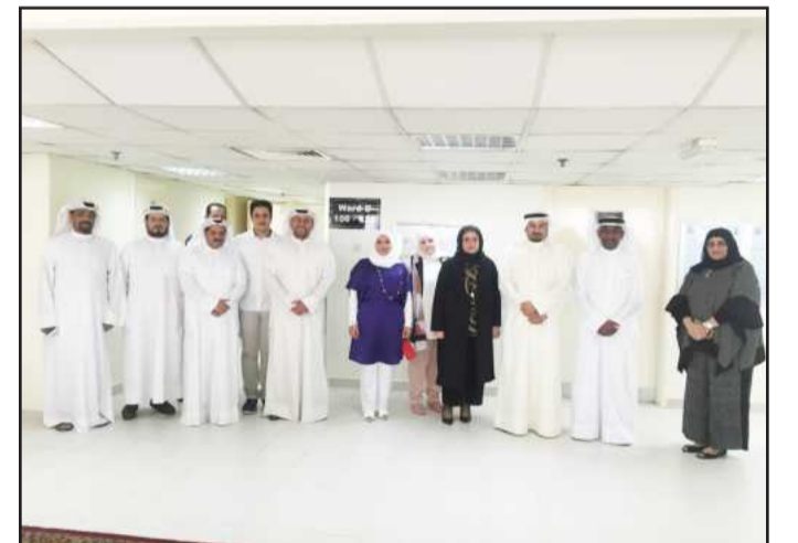
● موظفو السكن في الدور الجديد

المسعود: الجامعة لا تألوا جهداً في توفير كافة الامكانيات لطلبة السكن في تحقيق النجاح