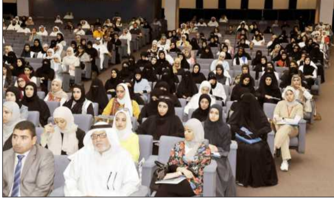
حضور الندوة • تصوير: بنز جوزيف

وأعربت د.العوضي عن سعادتها لمساهمة كلية الدراسات العليا بأن تحظى جامعة الكويت موقعاً متقدماً عن موقعها الحالي وذلك عن طريق زيادة عدد طلبة الكلية لراقي بمستوى وتصنيف جامعة الكويت عالمياً علماً بأن نسبة عدد طلبة الدراسات العليا للمجموع الكلي لطلبة الجامعة لأعلى مائة جامعة في العالم يبلغ من ٣٠ إلى ٦٥٪.