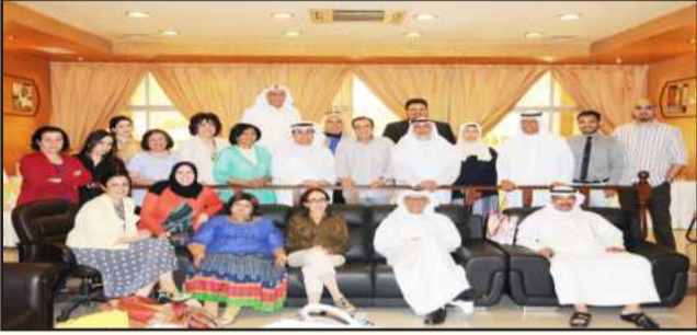
● لقطة تذكارية بحضور المحتفى به