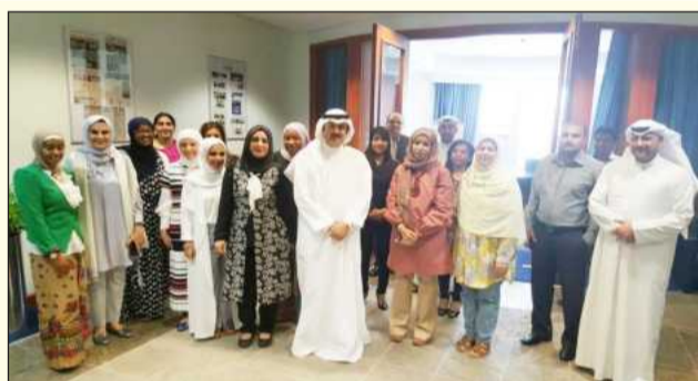
● لقطة تذكارية لحضور الحفل