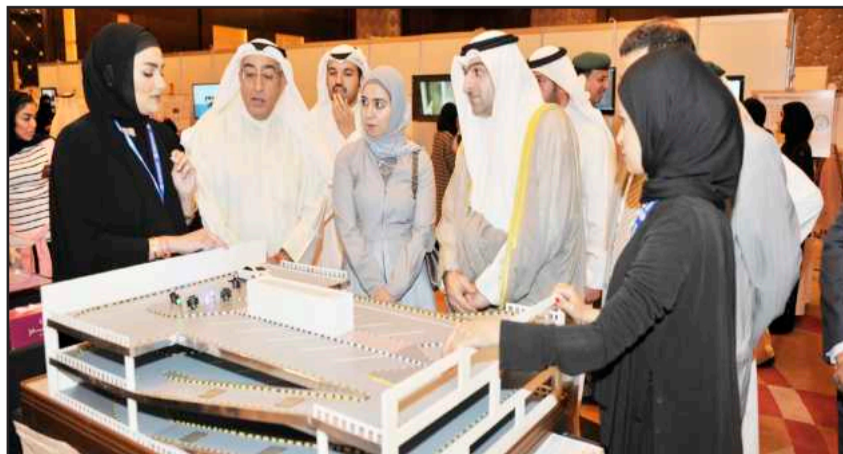
● عرض لمشروع موقف متعدد الأدوار