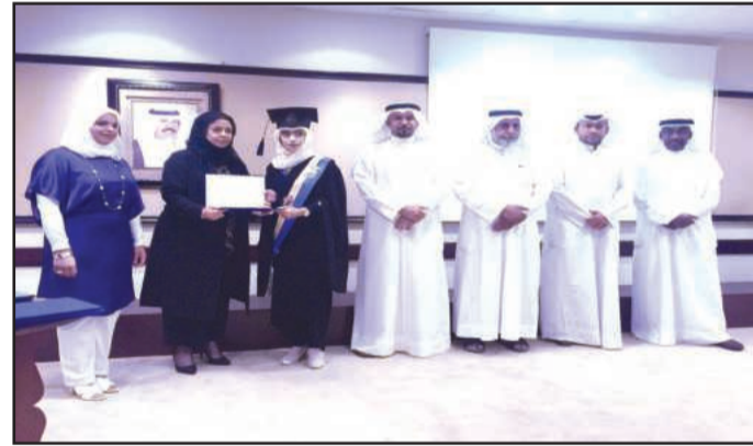
● تكريم احدى طالبات سلطنة عمان