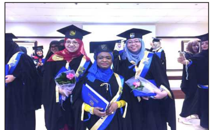
● ابتسامة التخرج