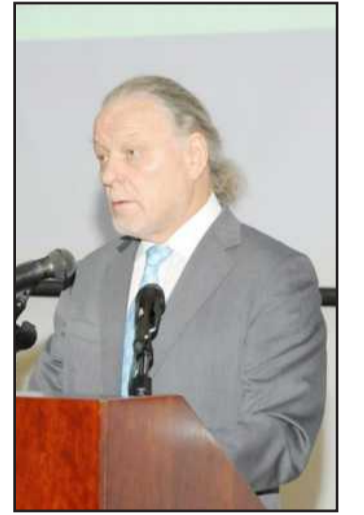
● البروفيسور جاكو توميلهااتو