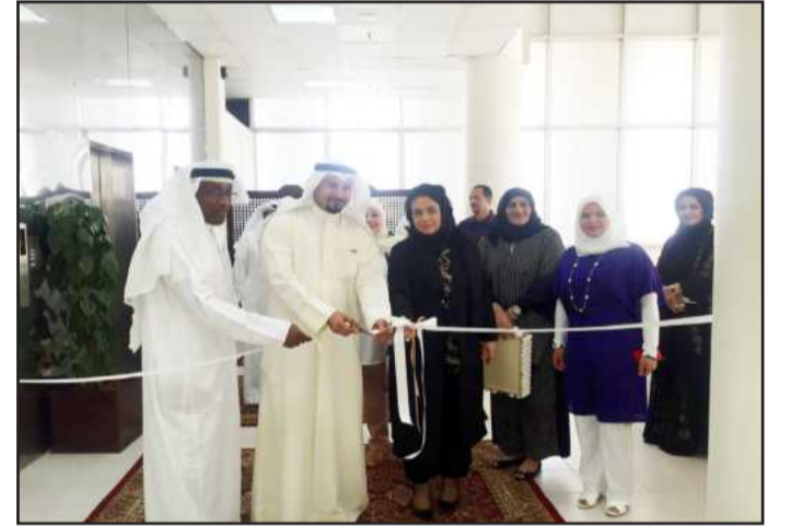
● العنزي مفتحاً الدور السادس