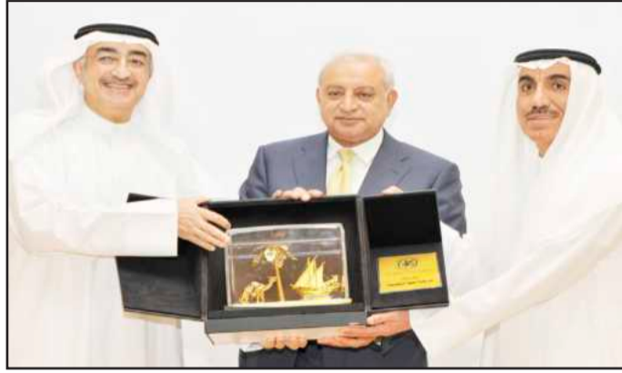
• درع تذكاري من نفط الكويت