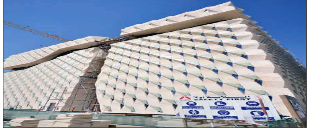
● السلامة أولا

من خلال الاجتماعات الرسمية التي تعقد دائما لتلافي المشكلات وحلها، بالإضافة إلى بعض الاجتماعات الأخرى التي تناقش كل محتويات المشروع من مكاتبات رسمية وداخلية، وأيضا تعقد اجتماعات ودية فيما بين المقاول والمستشار بإشراف المالك بصفة يومية وذلك لخلق روح المودة والتعاون بينهم وأحيانا تعقد اجتماعات مستقلة لكل بند من البنود المهمة.