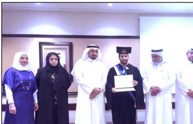
● تكريم خريج من المملكة العربية السعودية