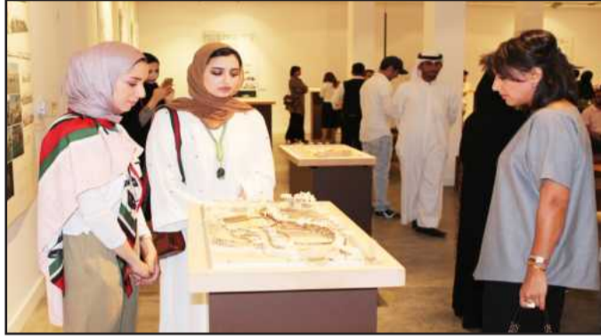
● متابعة واهتمام