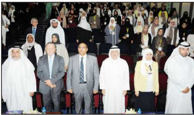
● أثناء عزف السلام الوطني