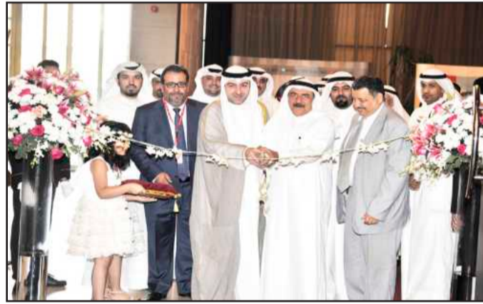
● الوزير ياسر أبل مفتتحا المعرض

تظهر الجانب المهني للطلبة ورؤيتهم العملية وان المعرض يهدف الى تقوية قدرات الطالب وهذا ما تحرص الكلية على إظهاره، إلى جانب تعاون الطلبة لإنجاح مشاريعهم فكون مجموعة من الطلبة يقومون بالعمل هذا من شأنه أن يفيدهم ويجعلهم يعملون بروح الفريق الواحد. وبين أن مقرر مشاريع تخرج الطلبة هو المرحلة النهائية