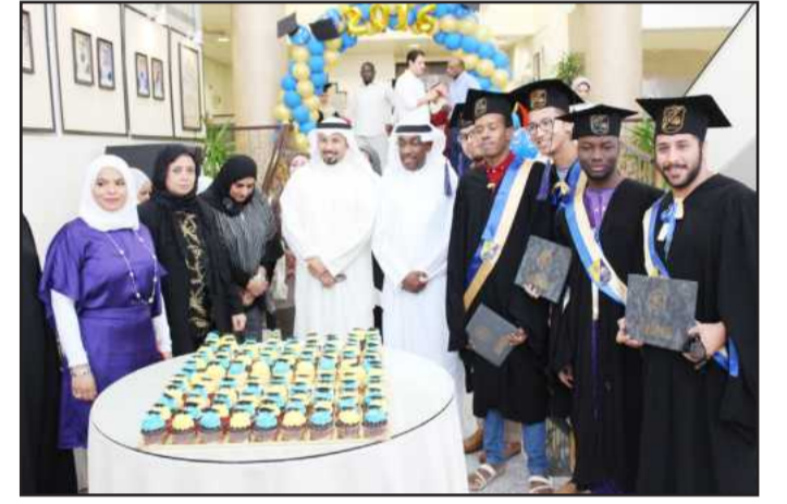
● توزيع كعكة الحفل

الجاد وإثبات الكفاءة، مع استحضر الثقة بالقدرة للعطاء. وأوصى العنزي الخريجين بأن يكونوا على ثقة بقدراتكم، وأن ينطلقوا نحو النجاح، مع ضرورة إبقاء الصلة القوية بالمعرفة، لأن من لا يسير تجدد المعرفة المتسارع سيتفاجأ بظلمة الجهل تحيط به، وأن ما جواه من العلم في السابق لم يعد قادراً على إضاعة واقعه الجديد.