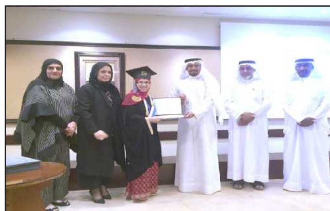
● تكريم خريجة من اندونيسيا