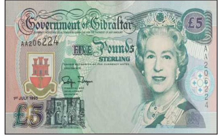
ورقة نقدية تحمل صورة الملكة اليزابيث والقائد المغربي طارق بن زياد