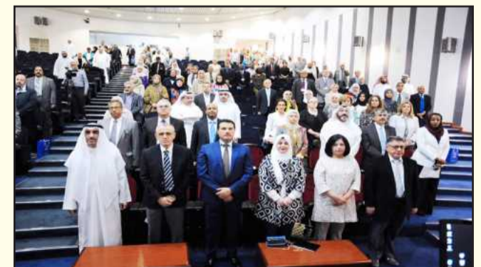
During the playing of National anthem