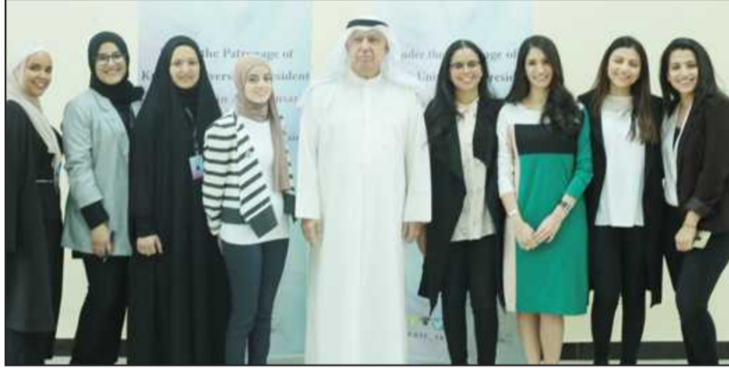
● الفريقين المتاهلين للنهائي