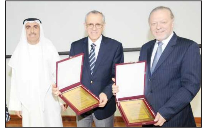
A group smile To AFAQ's lenses