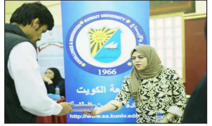
● توزيع المطويات