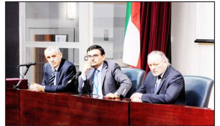
The Speakers in the Conference

including all Arab countries , its neighboring countries ( the Eastern Mediterranean Region) as well as the Gulf states faces many challenges. He added that a series of health challenges that threaten health should be addressed in the Gulf region , as these challenges have been discussed with the ministers of health in 2012, where all health ministers of the region agreed on: The control of communicable or infectious diseases (health security in the states) Noncommunicable diseases (cardiovascular, diabetes, cancer, chronic lung disease) The health of mothers and children. Health Systems strengthening of private health information. Crisis response and crisis