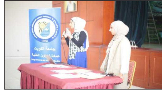
● حديث حول اللوائح الجامعية

خلال المعلومات المقدمة لهم. ودعت الجيعان الطالبات لزيارة معرض الفرص الدراسية الذي سيقام في يونيو تحت رعاية البنك الوطني الاستفادة من فرصهم الدراسية من خلال هذه المعرض الذي سيجتمع تحت سقفه أكبر عدد ممكن لمؤسسات التعليم العالي المختلفة.