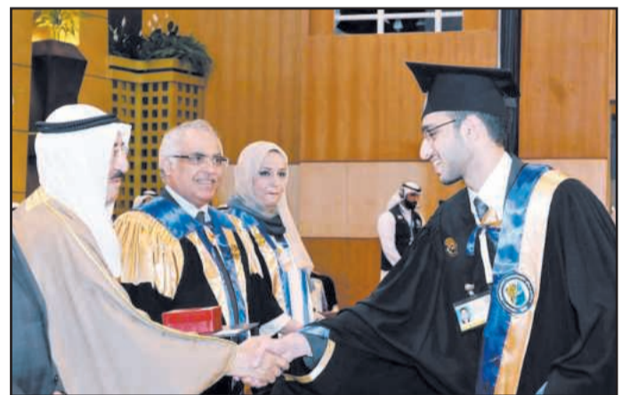
H.H the Amir greeting a graduate from Faculty of Medicine

pride to give back to Kuwait achievement. concluding her speech by As part of the ceremony, thanking the students and a short film made by the their families and professors Department of Public Relations and Media at the who have supported them and were part of this great KU was screened.