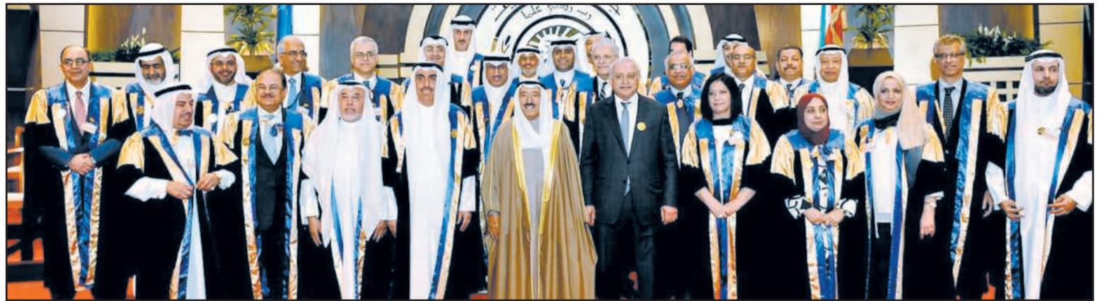
H.H the Amir in a group photo at the graduation ceremony