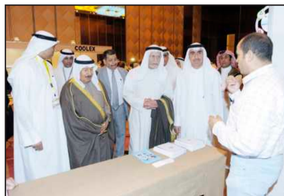
● جانب من المعرض