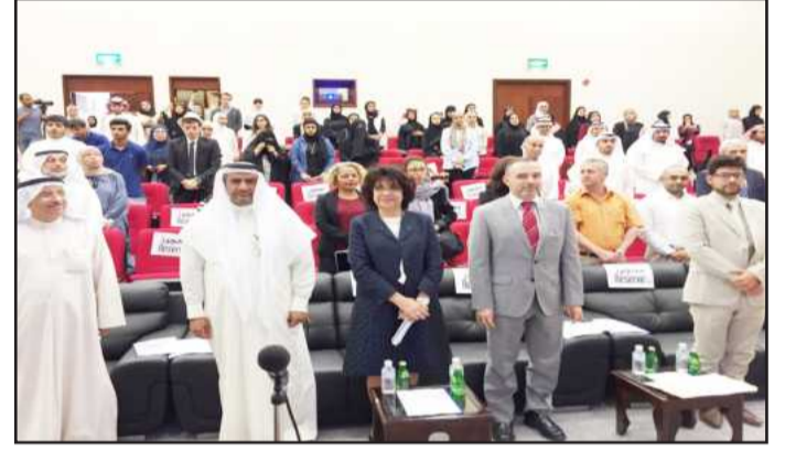
● أثناء عزف السلام الوطني

بالتقافة الفرنسية في معظم تجلياتها. وبينت د. المدني أن قسم اللغة الفرنسية فتح أطراً جديدة لطلبة الجامعة من أجل توسيع معارفهم باستشراف الحضارة الفرنسية والفرنكوفونية لغة وأدباً وفكراً في إطار إرساء سبل التواصل الثقافي معها، مؤكدة أن مشاركة القسم في هذه الاحتفالية هي خطوة راسخة باتجاه فضاء فرانكوفوني يكون للمتقفي الكويتي دور في إغنائه.