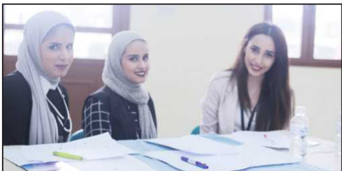
● فريق العلوم الاجتماعية