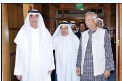
KU President and Dean of CBA walking with Dr. Yunus towards the Conference Hall