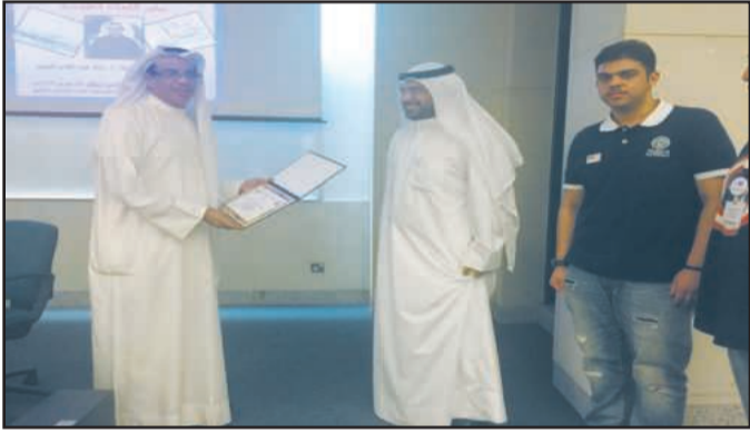
● تكريم المحاضر

اللغوية حيث يهتم هذا الفرع بدراسة اللغة واللهجات من مفهوم اجتماعي وثقافي، حيث تحمل كل لهجة، هوية اجتماعية أو تكشف عن علاقة تجارية الى جانب وظيفتها الرئيسية وهي المخاطبة. وفي النهاية قام طلبة الانثروبولوجيا بتكريم المحاضر.