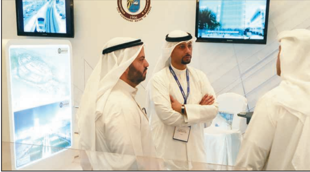
● جانب من الملتقى