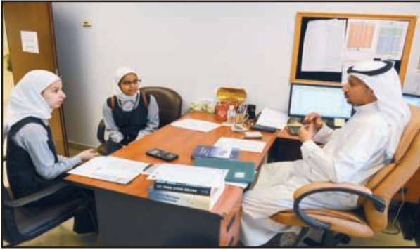
● جانب من زيارة الطالبات للكلية

الكلية استقبلت طالبات مدرسة ليلي الغفارية