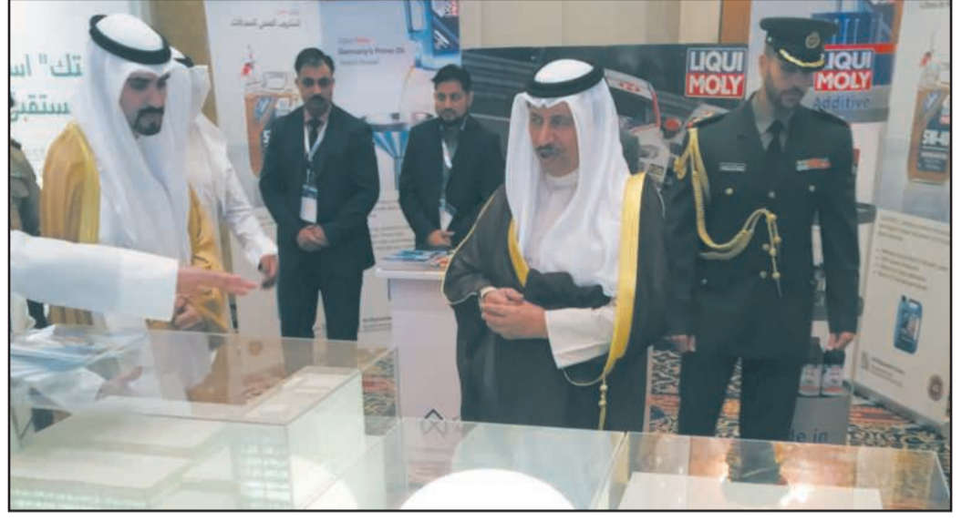
● سمو رئيس مجلس الوزراء يتفقد مجسم المدينة الجامعية