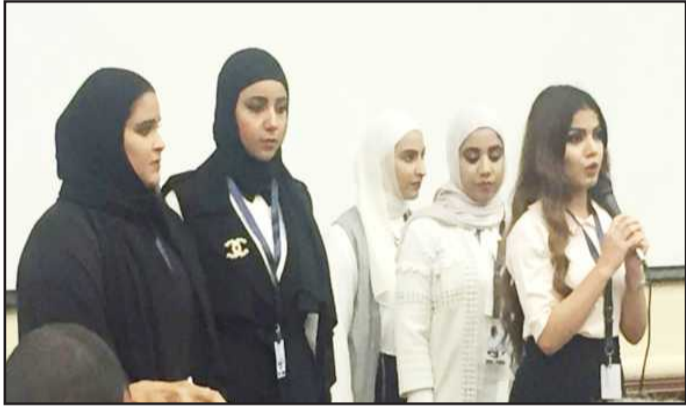
● فقرة تقدمها طالبات اللغة الفرنسية