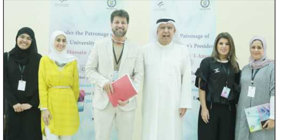
● صورة جماعية مع لجنة التحكيم