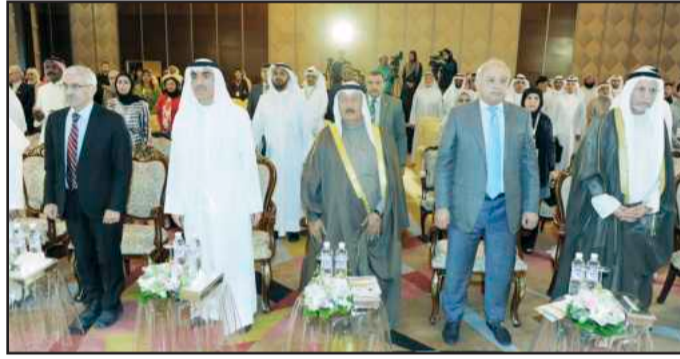
● أثناء عزف السلام الوطني