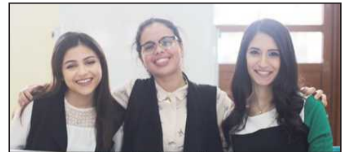
● فريق طالبات الطب

وبينت ان اللجنة العليا وضعت مواضيع متنوعة مرتبطة بالمجتمع الكويتي يتنافس فيها الطلبة خلال الجولات وذلك تحت اشراف عميد شؤون الطلبة د. عبدالرحيم نياب، مؤكدة على حرص اللجنة أيضا في اختيار المواضيع الهادفة للطلبة. وذكرت ان الفرق الطلابية المشاركة كانت على مستوى راق من الطرح والاقناع وتقبل الرأي الاخر، لافتة الى ان المناظرات شهدت جو أكاديميا علميا وتنافساً شريفاً مما يؤكد نجاحها للعام الثالث على التوالي. هذا وقد تغلب فريق كلية الآداب «طالبات» على فريق كلية العلوم الاجتماعية «طالبات» وفاز فريق كلية الطب «طالبات» على فريق كلية الآداب «طلاب» وبلغا الى نهائي مناظرات كليات الجامعة.