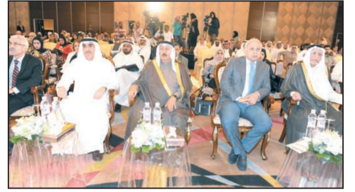
● مقدمة الحضور

يشمل سمو ولي العهد الشيخ نواف الأحمد، برعايته حفل التخرج السنوي الموحد لخريجي جامعة الكويت الدفعة ٤٥ للعام الأكاديمي ٢٠١٤/٢٠١٥، والبالغ عددهم ٥٨٨٦ خريجاً وخريجة موزعين على ١٤ كلية بعد غد الثلاثاء ٢٢