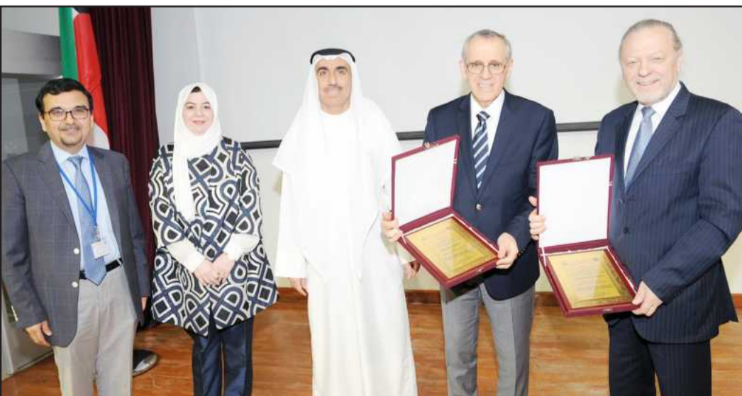
توزيع الدروع التذكارية