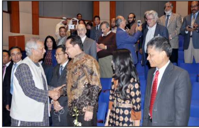
Dr. Yunus with Ambassadors of different countries attending the lecture