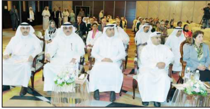
● جانب من حضور المؤتمر