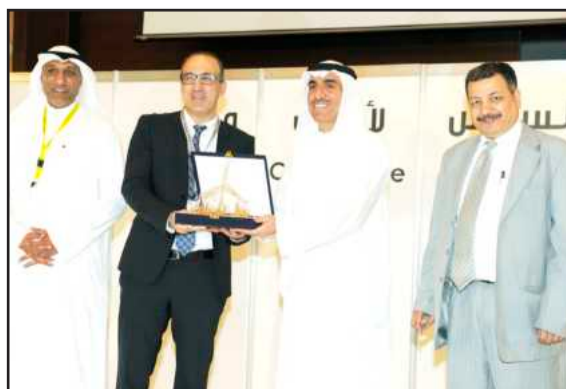
● درع تذكارية