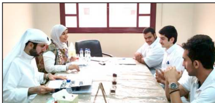
● جانب من المناقشة مع طلاب المدارس المشاركة