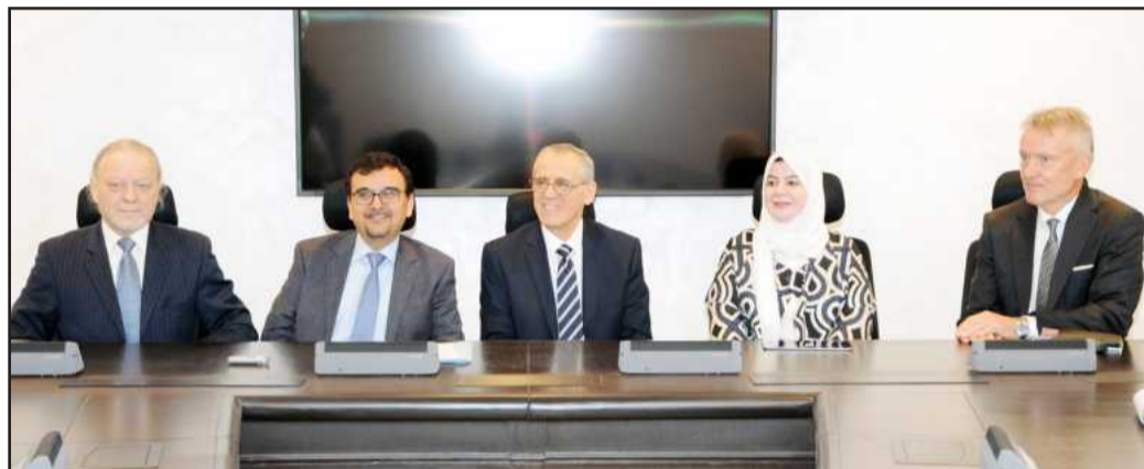
● جانب من الندوة العلمية