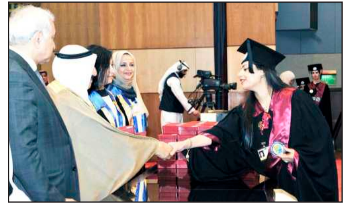
H.H the Amir greeting a graduate from Graduate Studies