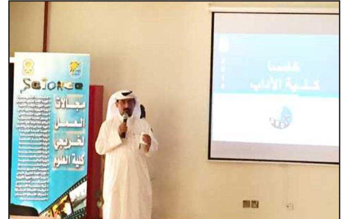
● جانب من الورشة

مع الكليات المشاركة في الورشة وهم كلية الهندسة والبتترول - كلية العلوم الحياتية - كلية العلوم الإجتماعية وكلية الآداب حيث تم طرح جميع البنود لتحليلها تحليل جزئي وعام ليتم الاستفادة والتبادل الفكري بين مكاتب التوجيه والإرشاد . وقد تم تكريم الحضور من قبل رئيسة وحدة شؤون الطلبة