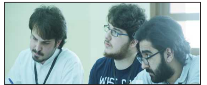
● فريق طلاب الآداب