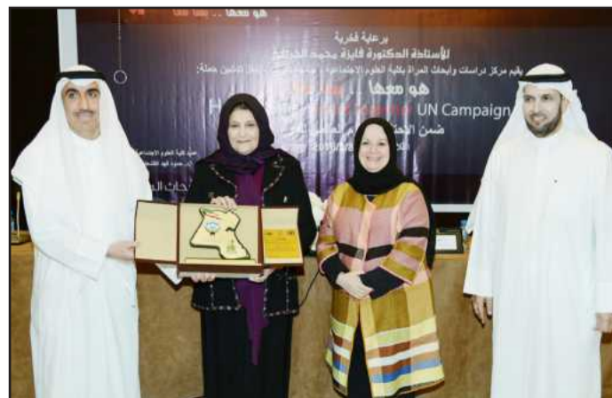
● ابتسامة لعدسة «أفاق»