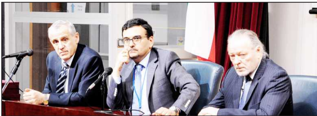
● المتحدثون في الندوة

بدأت الأمانة العامة أولى خطوات تسكين الوظائف الإشرافية الشاغرة بالجامعة من خلال نشر إعلان الوظائف الإشرافية لتعيين ( مدير إدارة ) و ( مراقب ) والذي أغلق باب التقديم فيه أمس، كما سيتم نشر إعلانات للوظائف الإشرافية الشاغرة الأخرى لنفس المستوى، وكذلك لفئة ( رئيس قسم ) و ( رئيس شعبة ) في الفترة القادمة على مراحل متتالية. وذكر أمين عام جامعة الكويت د. محمد الفارس بأن الإعلان الذي تم نشره قد تضمن نقلة نوعية تمثلت في إجراءات التقدم على الوظيفة الإشرافية من خلال الدخول على نظام الخدمة الذاتية المعمول به بالجامعة دون الحاجة إلى الحضور شخصياً إلى إدارة الشؤون الإدارية، وهو ما يمثل بداية لرؤية الأمانة العامة في التطبيق الفعلي لميكنة العمل الإداري وتماشياً مع أهداف الموضوع.