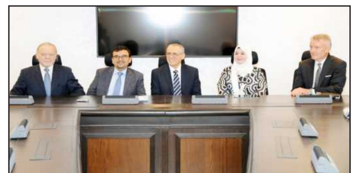
During the workshop

Tel: +965 – 2484 4189 Fax: +965 – 2484 9562