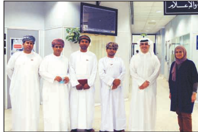
● جانب من الزيارة

حول قضايا النشر العلمي كتحكيم البحوث، وآليات النشر، والانضمام لقواعد البيانات والفهارس العالمية، كما تم إطلاع الوفد على اللوائح والنظم والقواعد المنظمة وآليات العمل، وكيفية توظيف التكنولوجيا واستخدامها في تسيير أعمال المجالات العلمية ولجنة التأليف والتعريب والنشر. وقد أشاد الوفد الزائر بالجهود المبذولة والمستوى اللائق والمتطور الذي وصل إليه مجلس النشر العلمي بجامعة