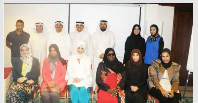
● المشاركون بورشة التصوير

هذا و شملت الورشة التدريب العملي و التطبيقات النظرية في كل ما يخص الإضاءة و العدسات إضافة إلى التطبيق العملي الذي كان له دور في تعزيز المعلومة لدى المتدربين .