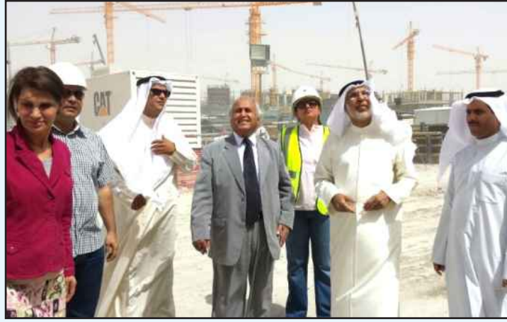
● مدير الجامعة و نوابه يتفقدون الموقع