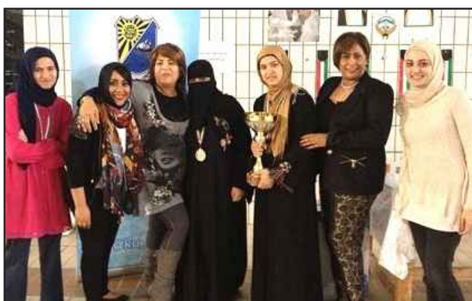
● موظفات ادارة الأنشطة الرياضية في احدى المسابقات

يبلغ طول الحوض ٢٥ مترا بينما يبلغ عرضه ١٢,٥ مترا ويتدرج العمق من مبتدئ إلى عميق ، و في السباقات يقسم الحوض إلى ٦ خانات. يقوم مدربي و مدربات الحوض بإعطاء