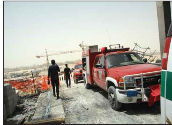
● استجابة سريعة للاطفاء