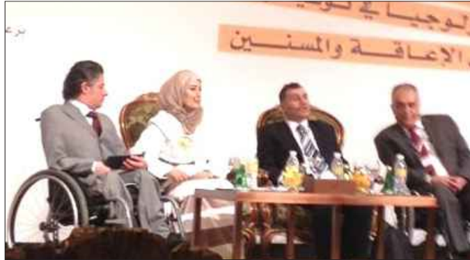
● .. و جانب من المشاركين