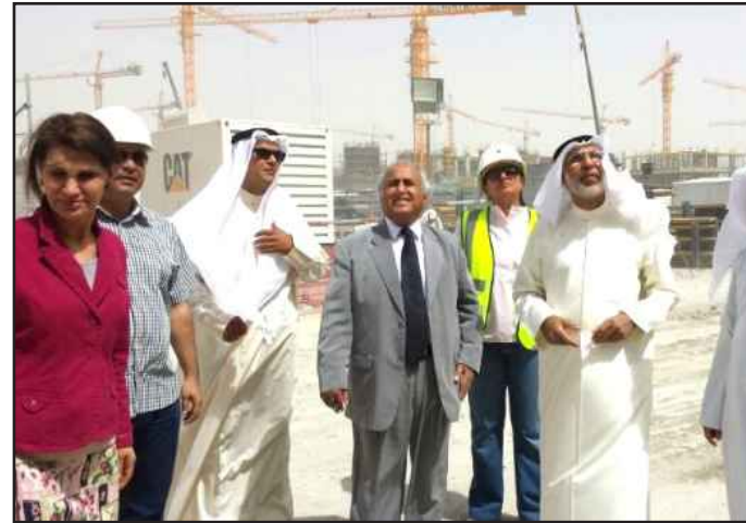
● مدير الجامعة و نوابه يتفقدون آثار الحريق