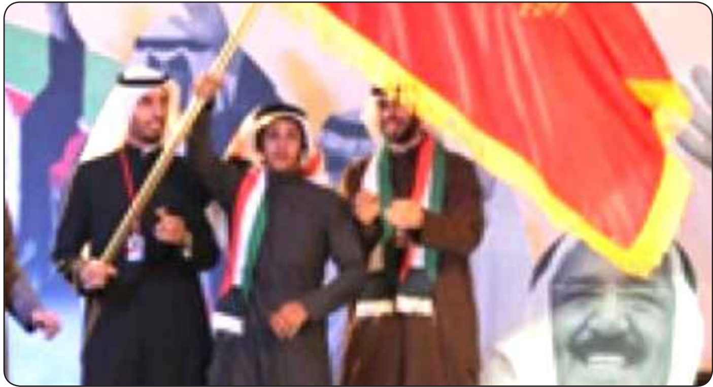
فهد بن رتيان رافعاً بیرق شاعر البيعة