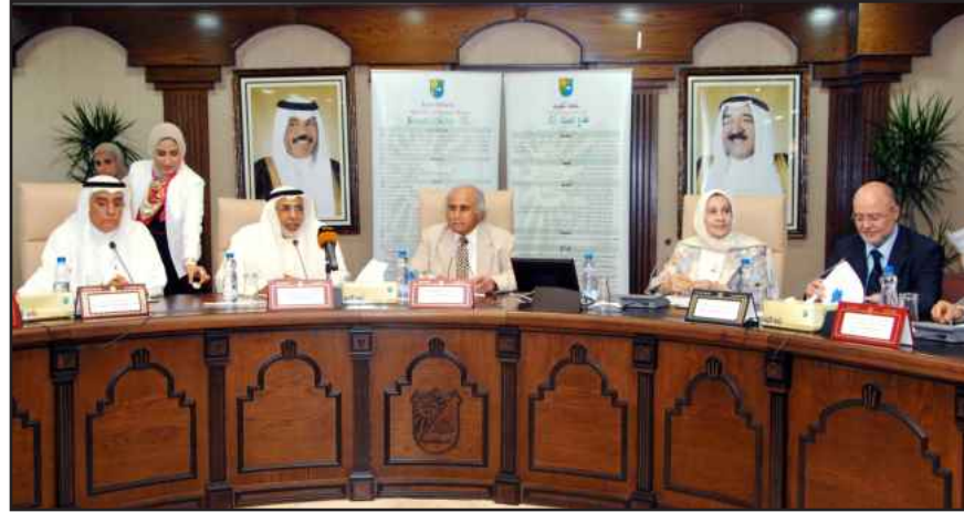
● قيادات الجامعة