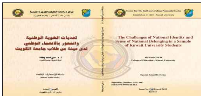
● غلاف العدد

الجدير بالذكر بأن سلسلة الإصدارات الحديثة يساهم فيها باحثون ومختصون ويضم كل عدد منها بحثاً علمياً متخصصاً في دراسة أحد المجالات العلمية المتنوعة التي حددتها قواعد النشر، على أن يكون موضوع البحث معنياً بمنطقة الخليج والجزيرة العربية.