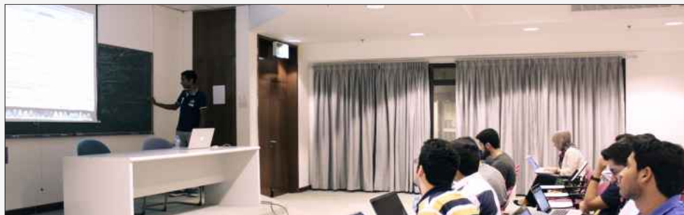
جانب من الدورة

مركز الدولية لرعاية الخيل لطالبات كلية الهندسة و البترول، وقد شارك في هذا النشاط عدد من أعضاء هيئة التدريس وطالبات الكلية، مما ساهم هذا النشاط بخلق بيئة ترفيهية ما بين الطالبات وأعضاء الهيئة التدريسية، و جرى برنامج الرحلة ما بين زيارة إلى أرجاء المركز وتجربة لركوب الخيل، واختتمت الجمعية فعاليتها بسحب على جهاز ميني آيباد للحضور مما خلق جواً من التشويق والحماص.