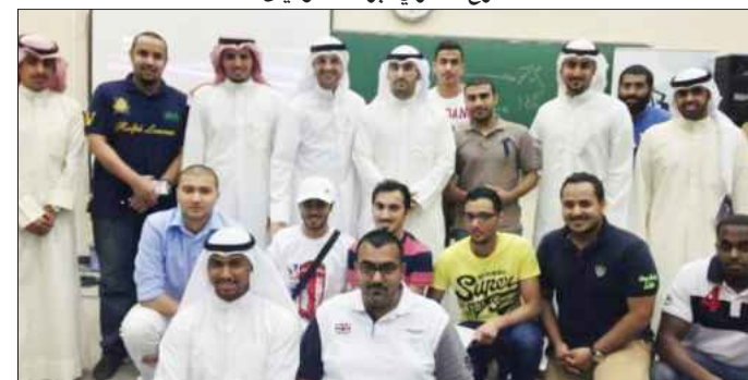
● .. ولقطة تذكارية