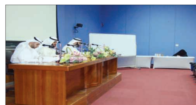
● جانب من المناقشة