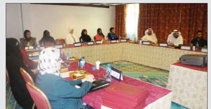
● جانب من دورة قانون التأمينات

وتناول هذا العدد الجديد دراسة جاءت تحت عنوان «تحديات الهوية الوطنية والشعور بالانتماء الوطني لدى عينة من طلاب جامعة الكويت» ناقشت مختلف القضايا والجوانب التي تتعلق بإشكاليات الهوية الوطنية وتحدياتها السياسية والاجتماعية والثقافية، وتعالج الدراسة آراء عينة من طلاب جامعة الكويت في قضايا الانتماء والولاء الوطني في سياق التحديات التي تفرضها الهوية الوطنية في عصر العولمة والميديا وما