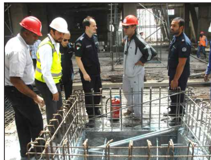
● معاينة للأضرار التي خلفها الحريق

قدم وساق في المباني الأخرى وهي: العلوم - الهندسة والبتترول - العلوم الإدارية - البنات - الآداب (ذكور) - التربية (ذكور)، بالإضافة إلى الحزم السبع من البنية التحتية، مؤكدة أن المشروع ماض وفق الجدول الزمني للموقع بشكل عام، مشيرة في الوقت ذاته إلى أهمية عدم إطلاق الإشاعات والأحاديث غير الصحيحة حول أسباب اندلاع الحريق، لعدم التأثير على سير عملية التحقيقات.