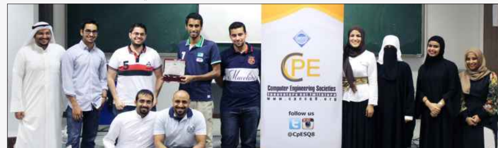
المشاركون مع أعضاء الجمعية