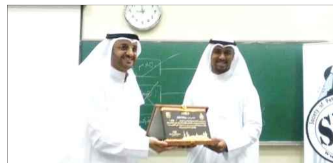
● درع تذكاري لبركات الوقيان