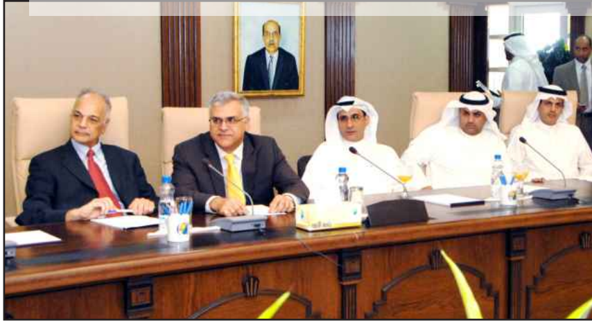
● جانب من المكرمين