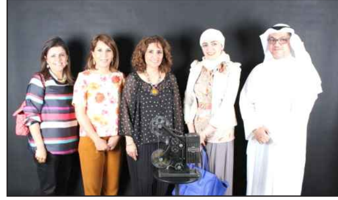
● لقطة تذكارية في الاستديو

والفنية إلى إنشاء استوديو التصوير الفوتوغرافي للطلبة أكدت النجدي أن هواية أو موهبة التصوير باتت من أكثر الهوايات التي يمارسها عدد كبير من الطلبة في الوقت الحالي، وقد قرر القسم الفني أن يوفر للطلبة المهتمين في هذا المجال استوديو تصوير فوتوغرافي يرسم لهم أساسيات التصوير التي من خلالها يتم التقاط أجمل اللحظات بعدساتهم الإبداعية للحصول على أفضل الصور الفوتوغرافية، داعية هواة التصوير في جامعة الكويت للالتحاق بالورش التدريبية التي يقدمها الاستوديو.