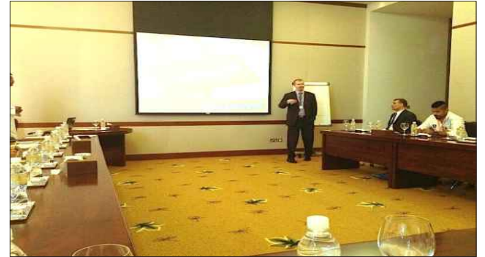
● جانب من المؤتمر

اليومية التي تواجه الاشخاص ذوي الاعاقة والمسنين في سبيل تحقيقهم الاعتماد الذاتي والتطورات التكنولوجية التي يمكن ان تساهم في مواجهة تلك المعوقات ، وعرض لآخر التطورات التكنولوجية والمعلوماتية التي توفر حياة افضل للأشخاص من ذوي الاعاقة.