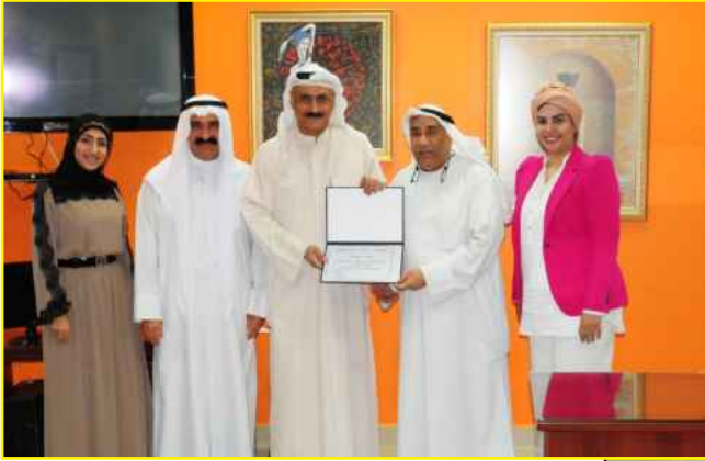
● شكر و تقدير للمستشار نبيل الخضر