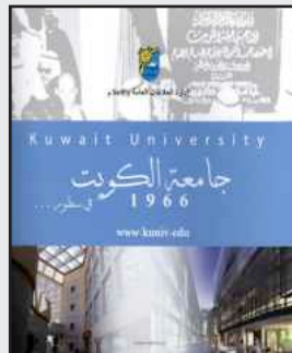
● كتاب جامعة الكويت في سطور

بغنوان (جامعة الكويت في سطور) وتضمن معلومات تعريفية عن جامعة الكويت وكلياتها وأقسامها المختلفة باللغتين العربية والإنجليزية بالإضافة إلى مواقع الكليات الإلكترونية ومواقع التواصل الاجتماعي الخاصة بالجامعة. وبمناسبة حفل متفوقي