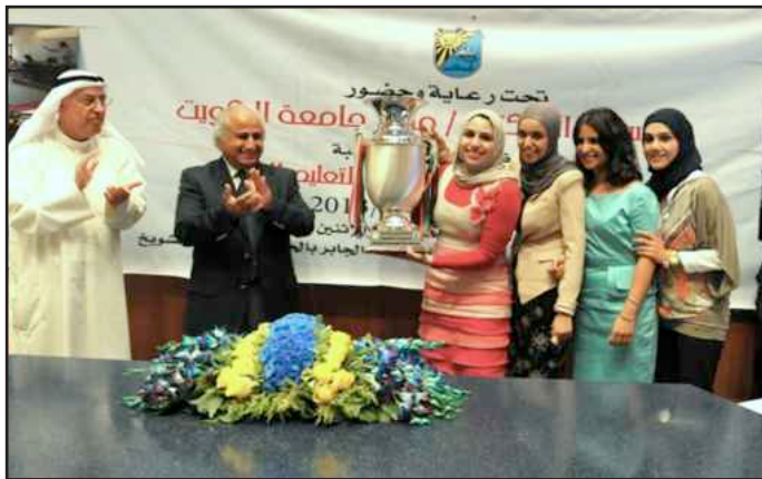
● طالبات الجامعة يحملن كأس دوري المناظرات

شاركت فيه ٥ مؤسسات تعليمية تميزت بتقديم إبداع وأسلوب باهر في فن التناظر