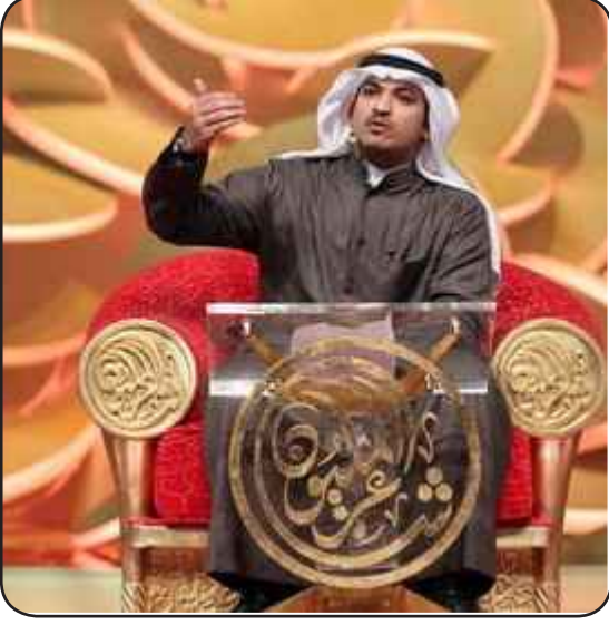
خالد الربيدة أثناء مشاركة في برنامج شاعر المليون