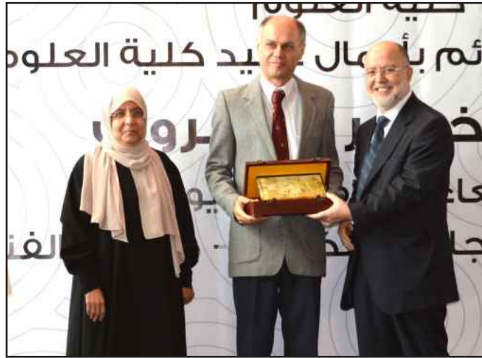
● .. تقدير وتكريم