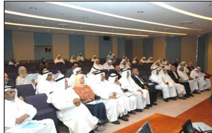
● جانب من الورشة