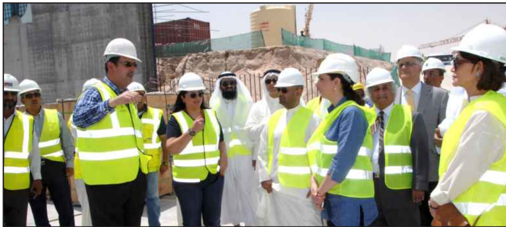
● شرح حول سير البناء