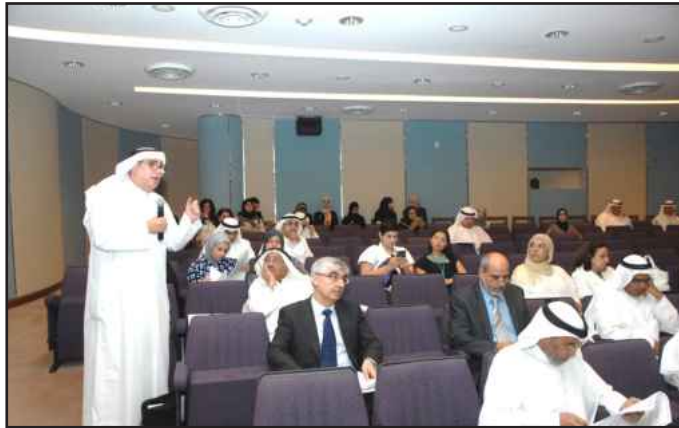
● مداخلة وملاحظة