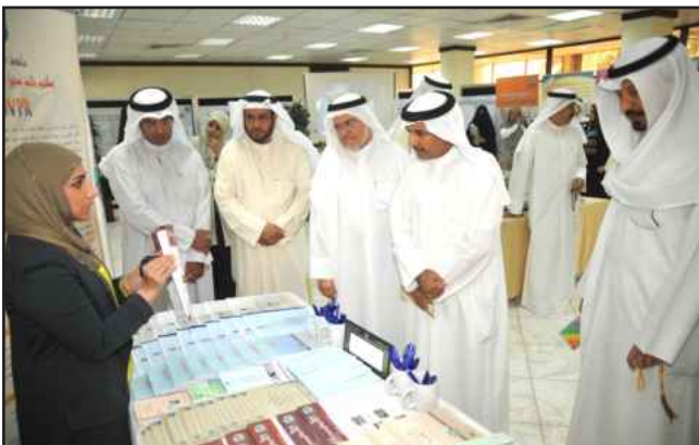
● عرض لاصدارات المجلة