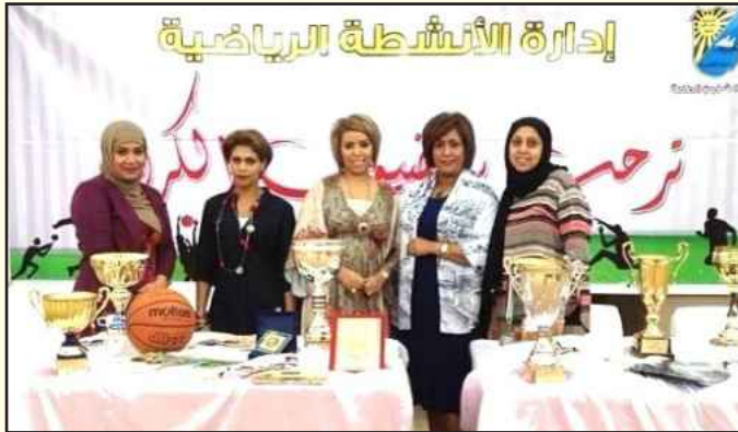
● موظفات إدارة الأنشطة الرياضية في المهرجان