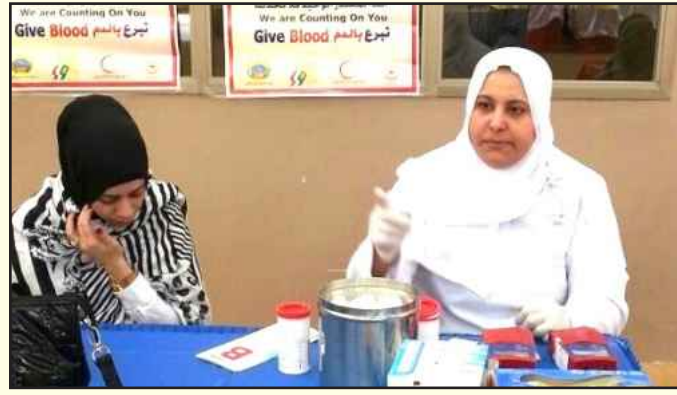
● مشاركة بنك الدم

العقل السليم في الجسم السليم، مبيّنة في الوقت ذاته أن الطالبات يمارسن الرياضة للترفيه عن النفس والتخلص من الأعباء الدراسية فهي بمثابة المتنفس