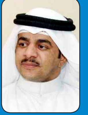
إعداد مهدي العجمي