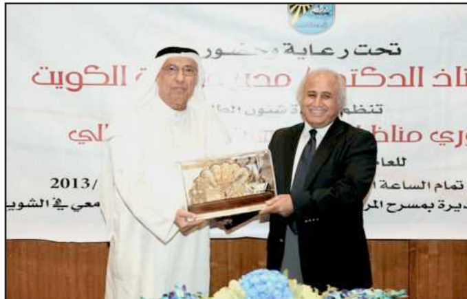
هدية تذكارية لمدير الجامعة