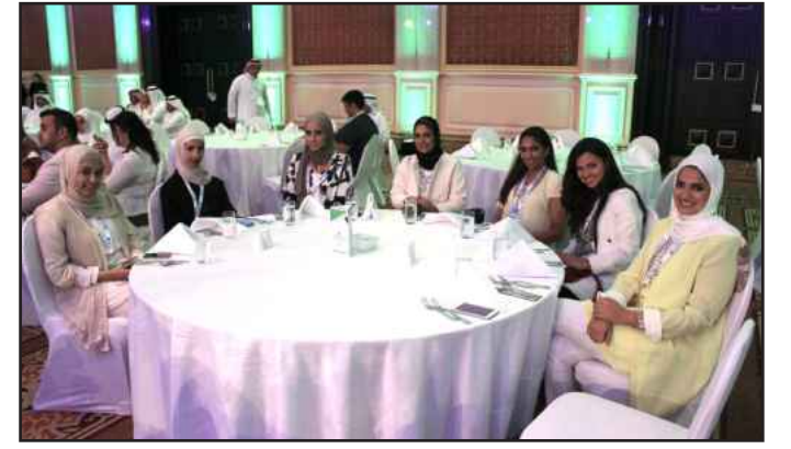
● الطالبات في اجدى الجلسات

شارك طلبة قسم الإعلام بكلية الآداب في المؤتمر الإقليمي الثالث للعلاقات العامة والمقام في دولة قطر وذلك على مدار يومي ١٥ و ١٦ مايو الحالي ، بمشاركة ٢٠ طالباً وطالبة من القسم و برئاسة وإشراف أستاذ الاعلام د. أحمد الشريف.