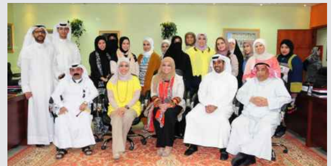
● المشاركون بالبرنامج

الماضي سلسلة من برنامج «الإشراف والقيادة وتطوير الأداء» بالتعاون مع شركة الانجاز ، خصصت للفئة الإشرافية بالجامعة على أن تختتم فعالياتاتها الأربعاء المقبل .