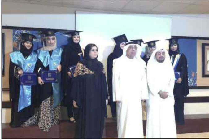
● لقطة تذكارية

وفي الختام تم اخذ جولة في معرض المشغولات اليدوية للطالبات الخريجات والفائقات.