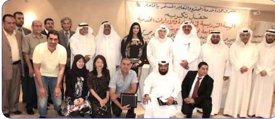
العميد بتوسط المكرمين