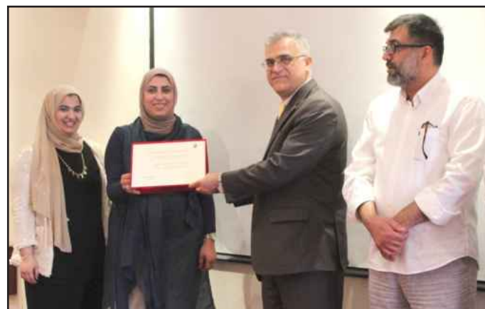
● تكريم وتقدير