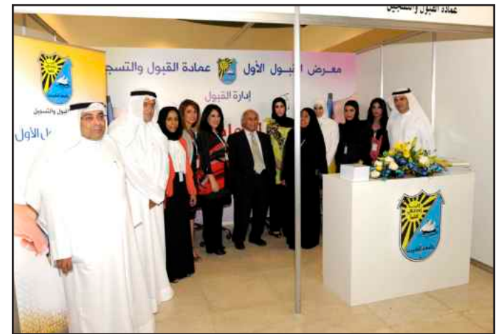
● مدير الجامعة في جناح عمادة القبول