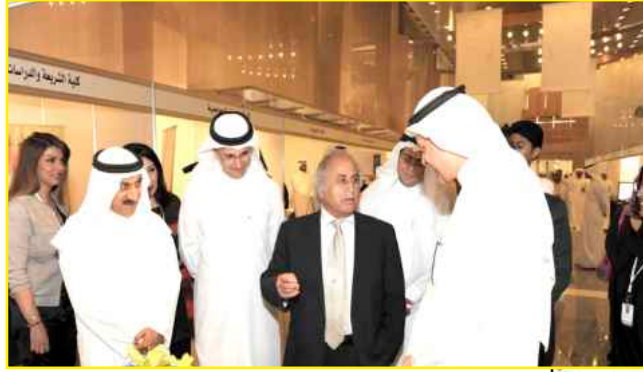
د. البدر متحدثاً

الكلية. وخلال المعرض تم عرض فيلم يوضح القواعد الأساسية للقبول الجامعي واللوائح الجامعية للطلبة، فضلاً عن مساعدة الطلبة على التعرف على كافة تخصصات الجامعة ومتطلبات الدراسة في كل كلية ومجالات العمل بعد التخرج، حيث أن جميع كليات جامعة الكويت ستشارك في هذا المعرض إضافة إلى مركز التقييم والقياس وعمادة شؤون الطلبة وإدارة العلاقات العامة وإدارة الأمن والسلامة بالتعاون مع عمادة القبول والتسجيل الجهة المنظمة لهذا المعرض.