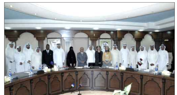
● أسرة العمادة مع الوفد القطري

سعادته بتوقيع اتفاقية تفاهم مع مركز مناظرات قطر، واصفا إياها بالخطوة الإيجابية والتي نبني من خلالها آفاق التعاون، مبيناً أن العمادة قامت بالعديد من المباحثات مع مركز مناظرات قطر قبل توقيع الاتفاقية. وبين د. ذياب أن العمادة نجحت في تنظيم دوري مناظرات جامعة الكويت لمؤسسات التعليم العالي من خلال مشاركة ٥ مؤسسات تعليمية بواقع ١٠ فرق. وأشار د. ذياب إلى أن عمادة شؤون الطلبة تسعى إلى عمل مركز مناظرات جامعة الكويت كخطوة مستقبلية لتطوير دوري مناظرات جامعة الكويت، متقدماً بالشكر الجزيل إلى مركز مناظرات قطر على دعمهم لإ محدود