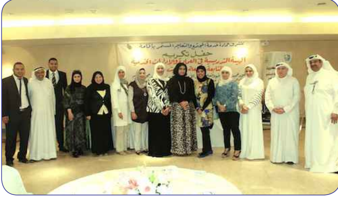
اللجنة المنظمة للحفل