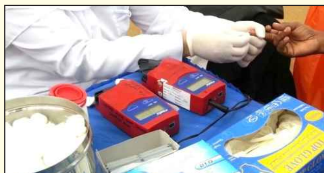
● تحليل عينة من الدم