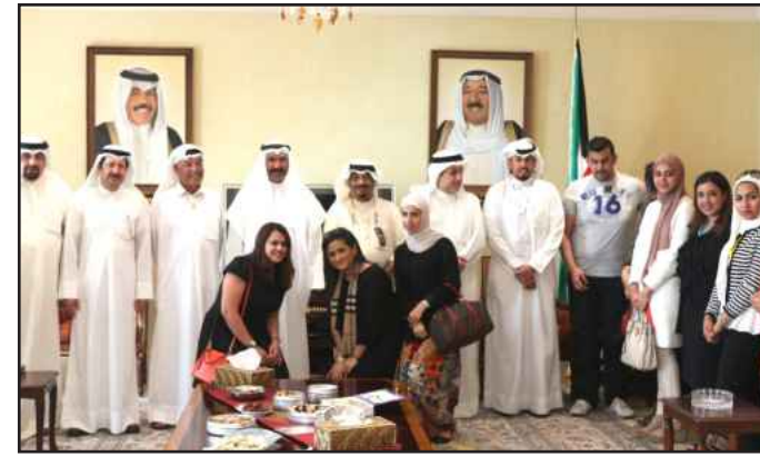
● وفي السفارة الكويتية في الدوحة

مضيفا ان العقاقير المصرح بها من قبل جمعية الدواء والغذاء الامريكية لمعالجة السمنة هي دواء الزنيكال والذي يعتبر من الادوية الامنة والفعالة لكنه غير ناجح لكثرة المضاعفات الجانبية والتي من الممكن القضاء عليها باتباع حمية عالية بالألياف الغذائية عند استعماله والعقار الاخر هو ريدكتيل والذي يعمل على كبت الشهية وسحب من الاسواق مؤخرا لخطورته . واكد د.ضاري العون ان عمليات جراحة السمنة يجب أن تجرى وفق معايير معينة منها ان يكون معدل كتلة الجسم للأشخاص الإصحاء ٤٠ و لأصحاب الأمراض المزمنة كالسكر ٣٥ ، مشيراً الى ان النمط الامثل لتخفيف الوزن هو تغيير نمط الحياة قليل مستمر خير من كثير منقطع .