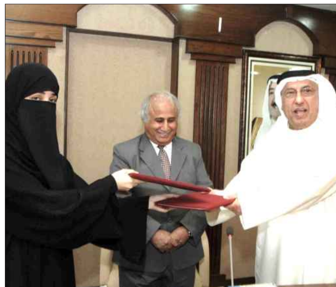
● تبادل الاتفاقيات بحضور مدير الجامعة