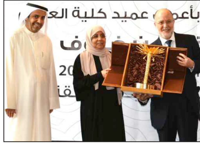
● تكريم عميدة الكلية السابقة