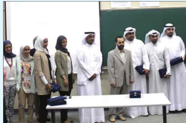
● لقطة تذكارية

تعاونها في نجاح المشروع، كما على جهودهم المبذولة في الدراسة لتطوير الشركة.