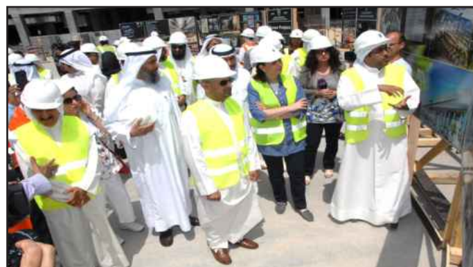
● .. و اطلاع على آلية العمل