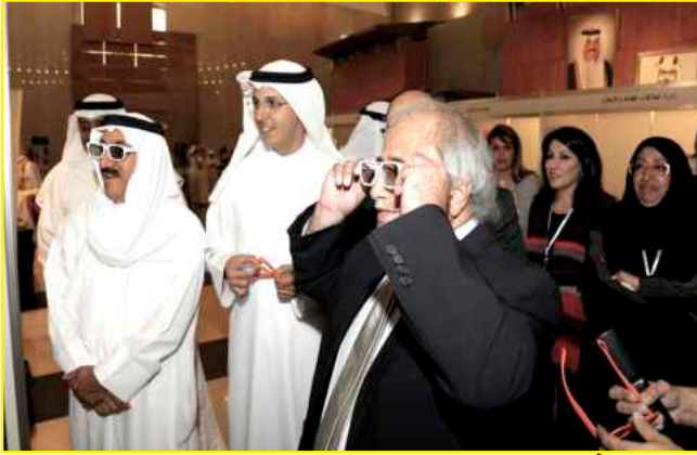
عرض ثلاثي الأبعاد