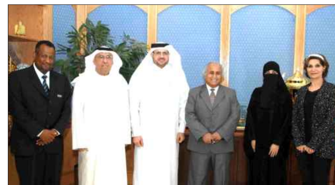
● لقطة تذكارية