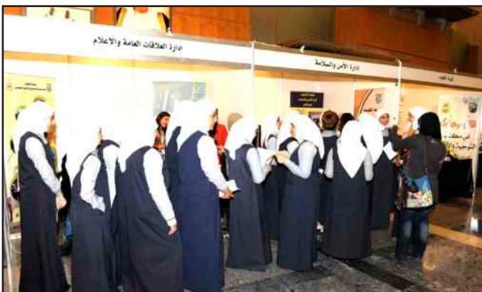
● أقبال على المعرض