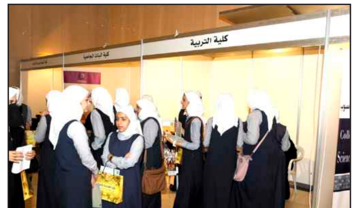
● طالبات الثانوية في جناح كلية التربية