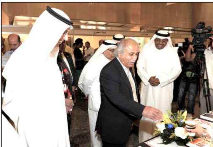
● القهوة حاضرة بالترحيب

الكلية. وخلال المعرض تم عرض فيلم يوضح القواعد الأساسية للقبول الجامعي واللوائح الجامعية للطلبة، فضلاً عن مساعدة الطلبة على التعرف على كافة تخصصات الجامعة ومتطلبات الدراسة في كل كلية ومجالات العمل بعد التخرج، حيث أن جميع كليات جامعة الكويت ستشارك في هذا المعرض إضافة إلى مركز التقييم والقياس وعمادة شؤون الطلبة وإدارة العلاقات العامة وإدارة الأمن والسلامة بالتعاون مع عمادة القبول والتسجيل الجهة المنظمة لهذا المعرض.