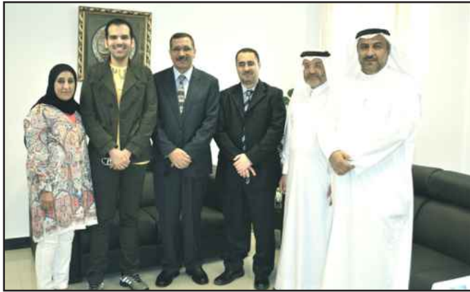
● المشاركون في المؤتمر

وجدير بالذكر أن الزيارة تخللها اجتماع تعريفى بأهم أنشطة واختصاصات المركز بالإضافة إلى تسليط الضوء على أهم أدوار المركز البحثية على مستوى دولة الكويت ضمن إطار البحث العلمي الخليجي والعربي والدولي.