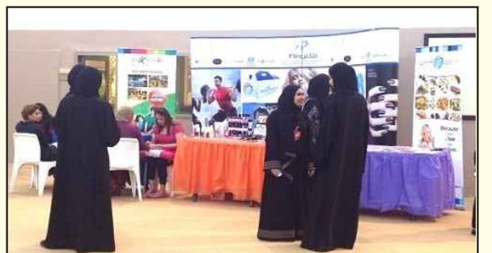
● مهرجان بالرياضة صحة