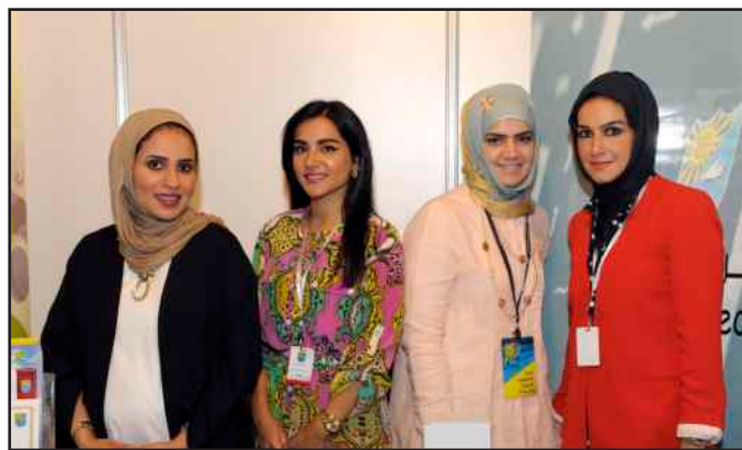
● موظفات العلاقات العامة