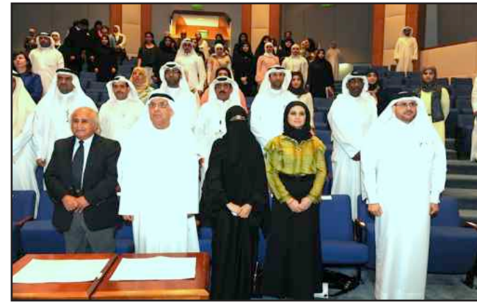
● أثناء عزف السلام الوطني

تجربة دوري المناظرات ناجحة بكل المقاييس، موضحاً أن الفريق المعارض في الجولة النهائية استطاع أن يفند الحجج ويقنع لجنة التحكيم في أن يكون معارضاً لحرية الإعلام. وبين د. البدر أن هذا النوع من الحوار مطلوب ويجب أن يكون ليس فقط في الكويت وإنما على مستوى الخليج والوطن العربي، مشيراً إلى أن الدول أصبحت تتحاور مع بعضها البعض