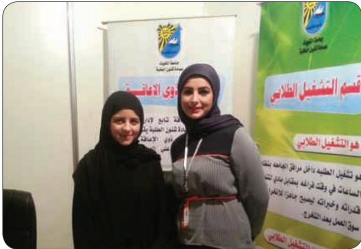
• مشاركة إدارة الإرشاد الأكاديمي في المعرض