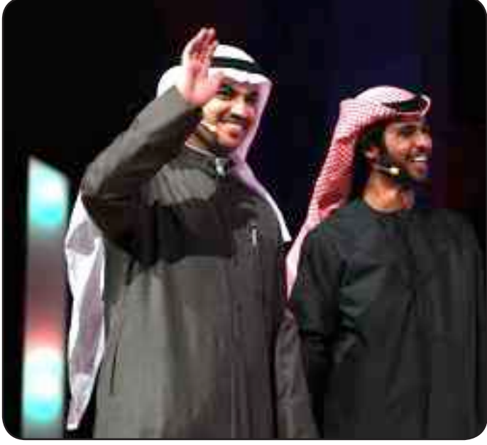
الهيبة يحيي الجمهور في شاعر المليون