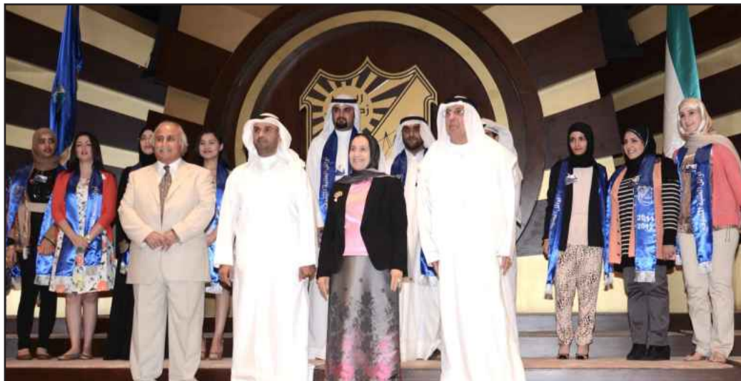
● لقطة تذكارية لفائحي كلية الآداب