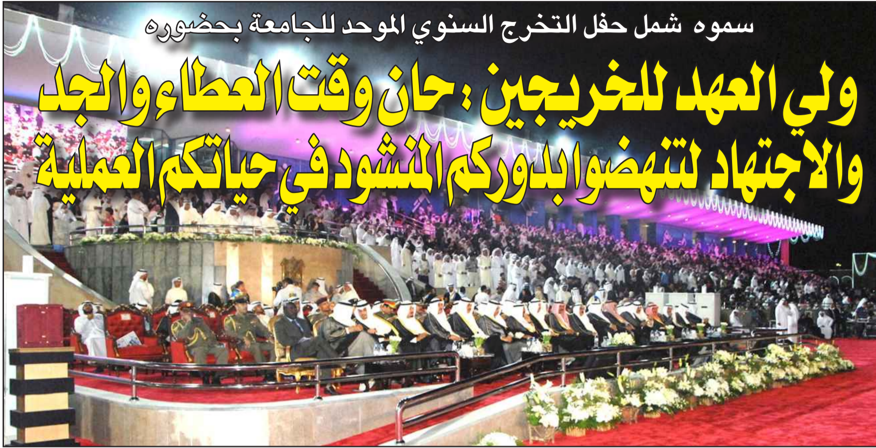
● كبار الحضور في المنصة الرئيسية

في ظل حضرة صاحب السمو الشيخ صباح الأحمد الجابر الصباح، أمير البلاد المفدى، قائد مسيرتنا وراعي نهضتنا، حفظه الله ورعاه، وأبقاه ذخرا للبلاد..