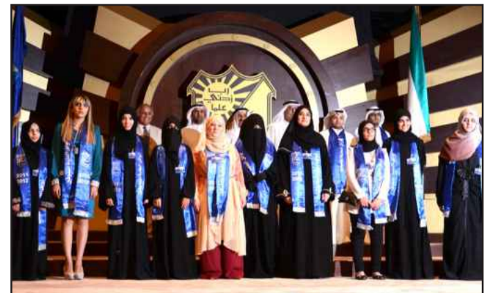
● كوكبة من متفوقي العلوم الاجتماعية

التي لم تخل أبدا من مسيرة الجامعة، مؤكدا قدرة الجامعة الكبيرة في كل مرة على التعامل مع هذه الصعوبات وتخطي العقبات لتستمر بذلك بأداء رسالتها الخالده والتميزه كما هي دائما مصدر أمل ونور ومعرفة وثقافة للكويت. وتقدم د. الجحرف بالشكر الجزيل إلى جامعة الكويت لتكريمها هذه النخبة المتميزة منها من أوائل الطلبة المتفوقين، داعيا الطلبة المتفوقين إلى مواصلة التفوق والتميز، مبينا أن هذه المرحلة أتت بعد مشوار طويل في تحصيل العلم والمعرفة، كما تقدم بالتهنئة الخاصة لأولياء الأمور مباركا لهم شعور الفرح الممزوج بالفخر والاعتزاز وهم يرون أبناءهم قد تميزوا وتفوقوا، سائلا الله أن يحفظ الكويت وأميرها وشعبها من كل مكروه وأن يبقيا دائما دار أمن وأمان وواحة معطاء تحتضن العلم والعلماء بقيادة صاحب السمو أمير البلاد المفدى الشيخ صباح الأحمد الجابر الصباح وولي عهده الأمين الشيخ نواف الأحمد الجابر الصباح. وبدورها قالت مساعد عميد شؤون الطلبة للخدمات الطلابية ورئيس اللجنة العليا للحفل د. هيفاء الكندري: إننا نحتفل اليوم بتكريم كوكبة جديده من صفوف طلبة الجامعة لتشجيعهم وتحفيزهم على التفوق العلمي والاستمرار فيه، مبينة أن فكرة التكريم تهدف لتحفيز الطلبة وإشعارهم بأن هناك من يشاركون تفوقهم العلمي وتميزهم الأكاديمي ليكونوا شموعا مضيئة لأقرانهم في الأعوام القادمة يهجون نهجهم ويحذون حذوهم مبشرين بغد مشرق واعد.