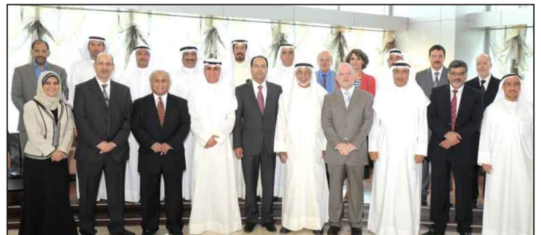
● لحظة تذكارية لقيادي البترول والجامعة