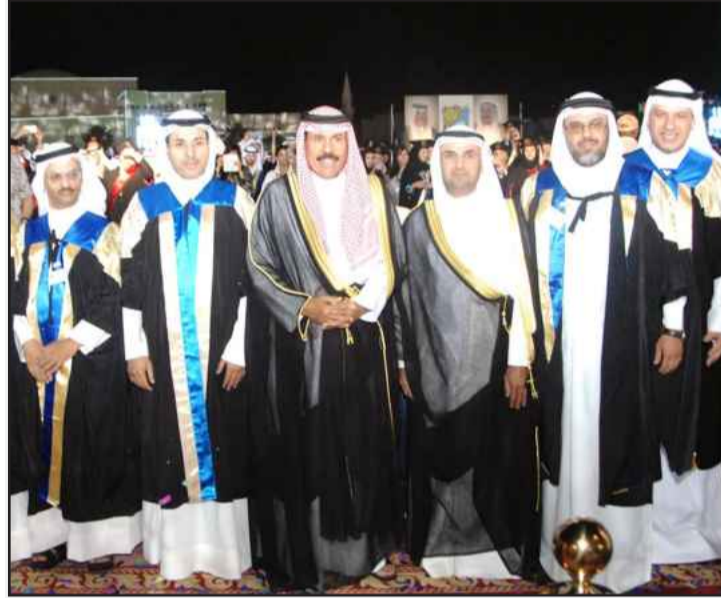
• سمو ولي العهد متوسلاً أساتذة كلية العلوم الإدارية

شرف حفل التخرج هو تشريف للطلاب والطالبات، حيث إن وطنكم يكرمكم، يناديكم برد الجميل لبلدكم المعطاء، تمنياتنا لكم بالتوفيق المستمر، وتذكروا دوماً أن هذا التخرج هو بداية الطريق.