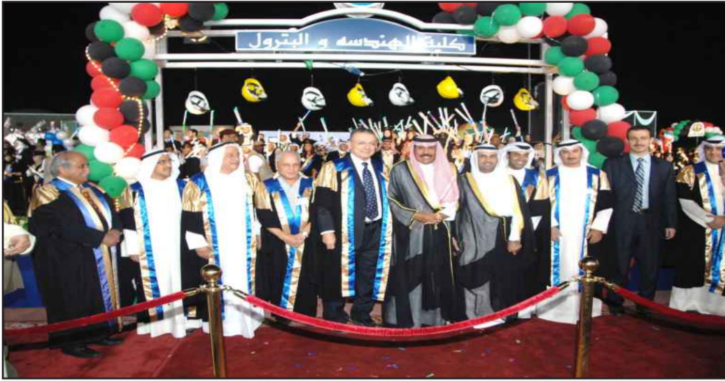
● سمو الشيخ نواف الأحمد مع دكاترة الهندسة و البترول