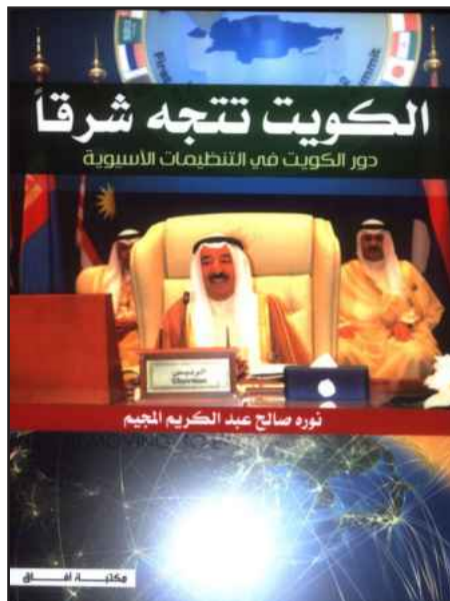
● غلاف الكتاب

رابطة دول جنوب شرقي آسيا (الاسيان) ورابطة جنوب آسيا للتعاون الاقليمي (الساك) ومنظمة التعاون الاقتصادي (الايكو)، هذا بالإضافة الى التنظيمات الإقليمية الجديدة وهي مجلس التعاون الاقتصادي لدول آسيا - المحيط الهادي (الابيك)