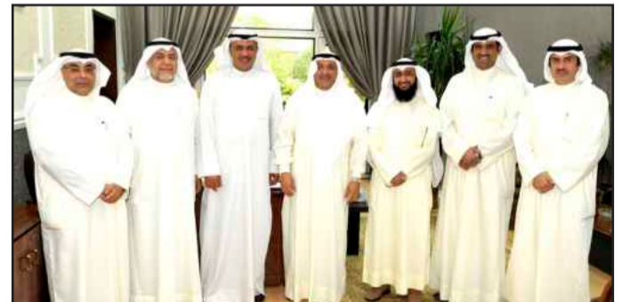
• د. نبيل اللوغاني متوسلاً مهنيين

استقبل أمين عام الجامعة د. نبيل اللوغاني عدداً من قياديي الجامعة وأعضاء هيئة التدريس ومديري الإدارات في مراكز العمل المختلفة الذين باركوا له بمناسبة توليه مهام منصبه الجديد، متمنين له دوام التوفيق والنجاح في مهامه وأن تحقق جامعة الكويت كل ما تصبو إليه من تقدم وازدهار. وخلال اللقاء أكد د. اللوغاني أن جامعة الكويت ماضية في مسيرتها بما يحقق الأهداف والتطلعات التي تسعى إليها، وبأن تكون جامعة ذات مكانة علمية وأكاديمية يشار إليها وسط الجامعات العريقة والمتميزة.