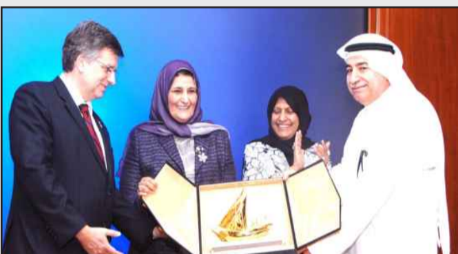
● درع تذكارية