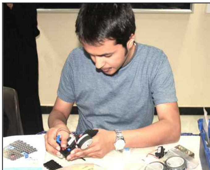
● جانب من ورشة التصنيع