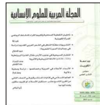
● غلاف العدد

جنوب الأردن خلال الفترة البيزنطية (٣٢٤ - ٦٣٦ م) الأدلة التاريخية والأثرية» من خلال الاعتماد على الأدلة التاريخية والأثرية التي وردت في المصادر البيزنطية والحفريات والمسوحات الأثرية.