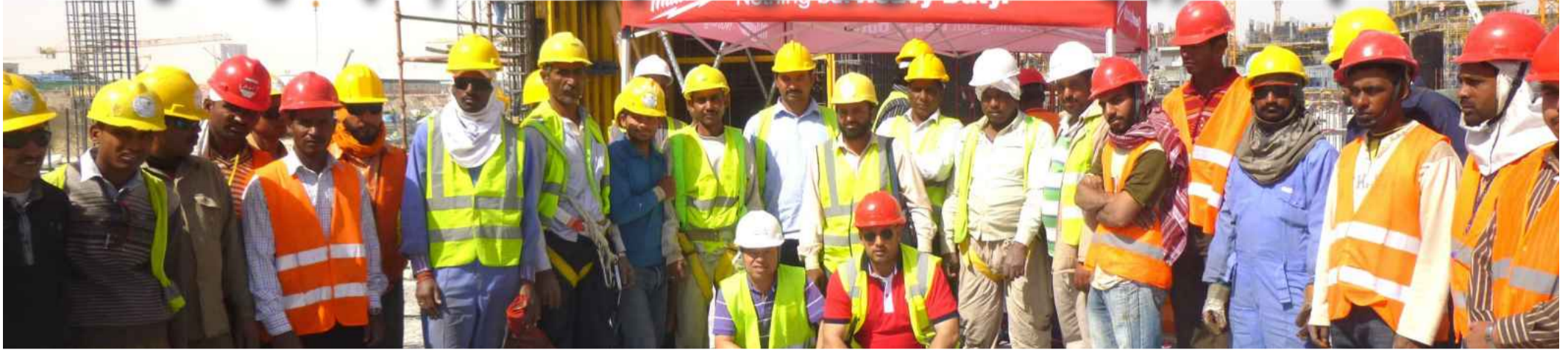
● لقطة جماعية لبعض العاملين في مدينة صباح السالم الجامعية

قبلهم أثناء العمل لمنع إصابات العمل التي تواجههم بشكل يومي والحد منها، منطلقاً إلى اتباع سبل الترغيب والترهيب التي تقوم بها الشركة عن طريق عمل الاجتماعات الأسبوعية مع العمال لرصد الأخطاء التي يقوم بها العمال طوال الأسبوع ومن ثم مخالفتهم، ومن جهة أخرى تقدم الشركة مكافآت مادية شهرية وشهادة شكر للعامل الأول المتبع لإرشادات الأمن والسلامة على أكمل وجه.