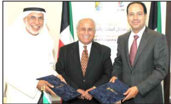
• تبادل الاتفاقيات بحضور مدير الجامعة

المشتركة وتبادل الخبرات والأفكار العلمية والعملية بالإضافة إلى تطوير برامج متخصصة يستفيد من نتائجها كل من جامعة الكويت وشركة البترول الوطنية على حد سواء، مبيناً أنها سوف تقلص المعوقات التي تؤخر إنجاز الأبحاث المباشرة والتي لا يتطلب تنفيذها أي أمور تعاقدية أو قانونية. طالع ص ٧