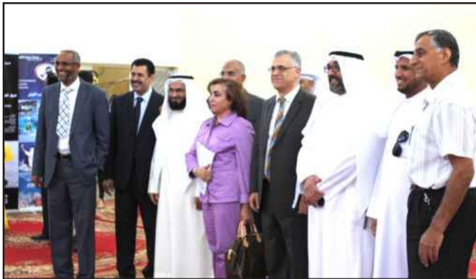
● ولقطة تذكارية