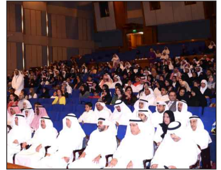
● جانب من حضور الحفل

في البداية قال وزير التربية ووزير التعليم العالي الرئيس الأعلى للجامعة د. نايف فلاح الحجرف: إن التفوق ما هو إلا ثمرة جد وكفاح ومسؤولية لبداية عملية بكل حزم وجد، موضحاً أن هذا التفوق والنجاح يحسب في نهاية المطاف