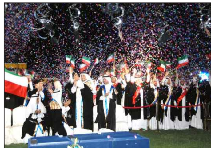
● فرحة غامرة

وزاد أ.د. البدر: « إن المجتمعات المتعلمة تتعطش للمزيد من العلم والحصول على الشهادات العالية . ولا يمكن اشباع ذلك باستمرار الابتعاث إلى الخارج عند تواجد جامعة بمستوى جامعة الكويت ونوعية أعضائها الأكاديمية . لذا تعمل الكليات جاهدة لتفعيل الدراسات العليا