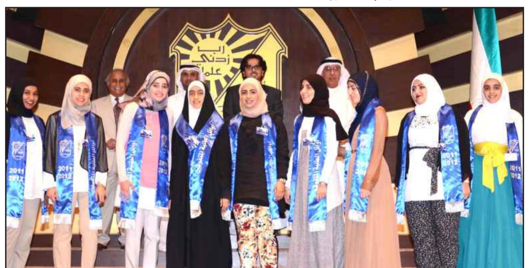
● .. ومتفوقو كلية العلوم الطبية المساعدة