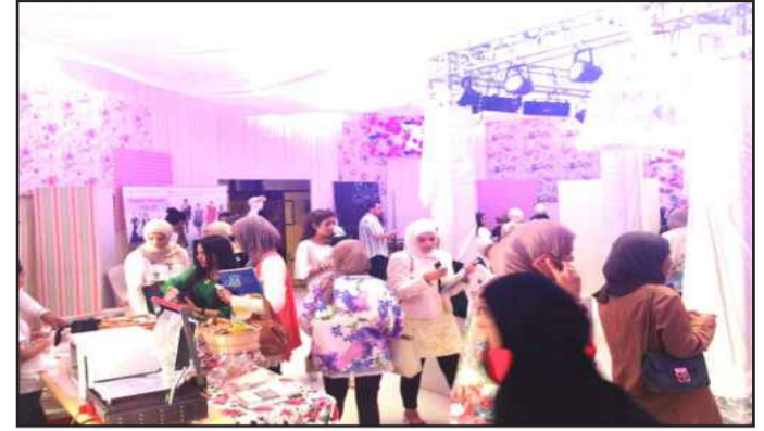
● إحدى الفعاليات