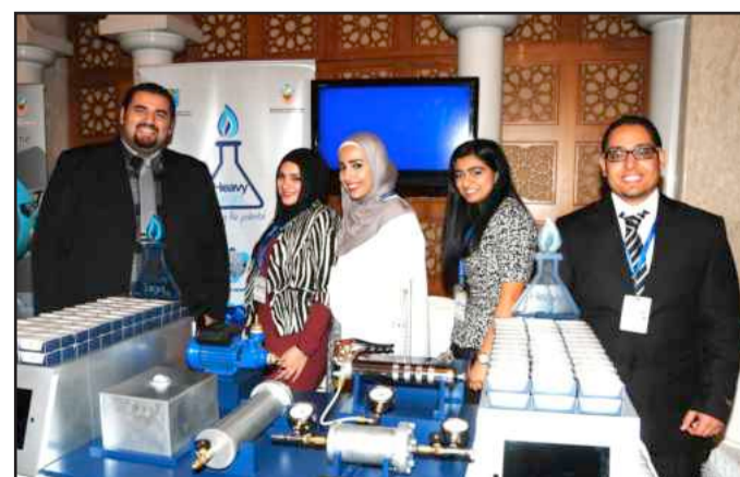
● عرض المشروع

بالتزامن مع المؤتمر بمسابقة أفضل مشروع على مستوى الشرق الأوسط وشمال أفريقيا Regional Paper Contest متنافسين بذلك مع أفضل تسعة أفرقة على هذا المستوى. الجدير بالذكر أن هذا