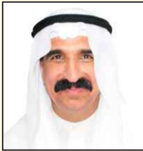
بقلم: د. بدر الحجي

ما من شك في أن تخرج الطالب في الجامعة هو الهدف الذي يسعى إليه الطلاب على مختلف ثقافتهم وتباين أفكارهم، فهذا الحلم يظل يراود الفرد الملتحق بالتعليم، فمذ دخوله المراحل الأولى للتعليم وهو يمني النفس بمجيء ذلك اليوم الذي يتخرج فيه في الجامعة، حيث إن اجتيازها يضمن له إتمام المراحل الدراسية كلها، ومن دون التخرج في الجامعة تضيق عليه سنوات الدراسة السابقة هباء دون الاستفادة المادية والمعنوية منها.