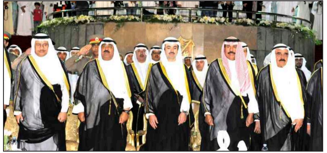
● سمو ولي العهد و علي الراشد و الشيخ فيصل الحمود و الشيخ مشعل الأحمد و سمو الشيخ جابر المبارك