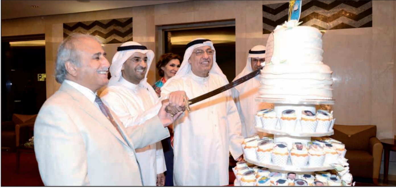
● وزير التربية و مدير الجامعة و عميد شؤون الطلبة يقطعون كعكة الحفل