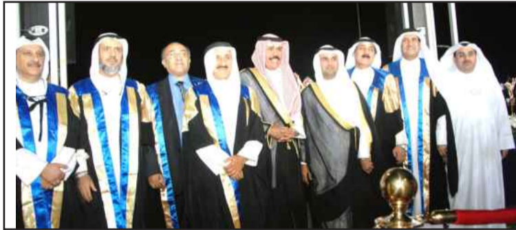
● سموه مع أساتذة العلوم الاجتماعية