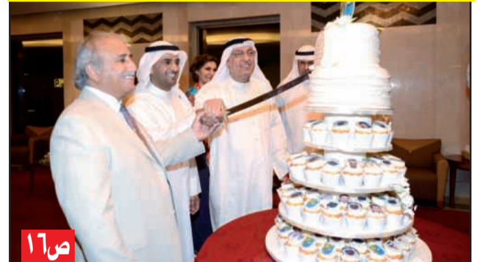
• وزير التربية ومدير الجامعة وعميد شؤون الطلبة يقطعون كعكة الحفل