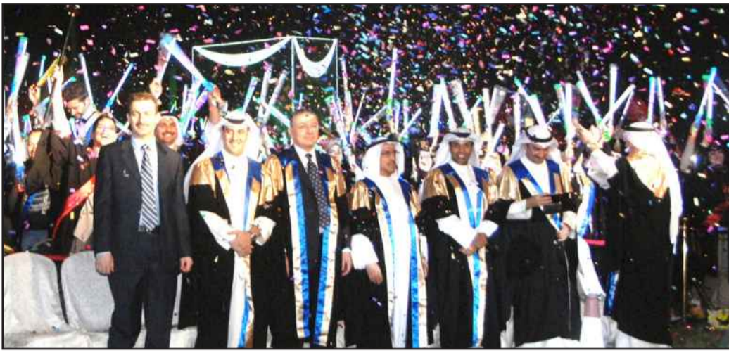
● خريجو الهندسة والبتترول