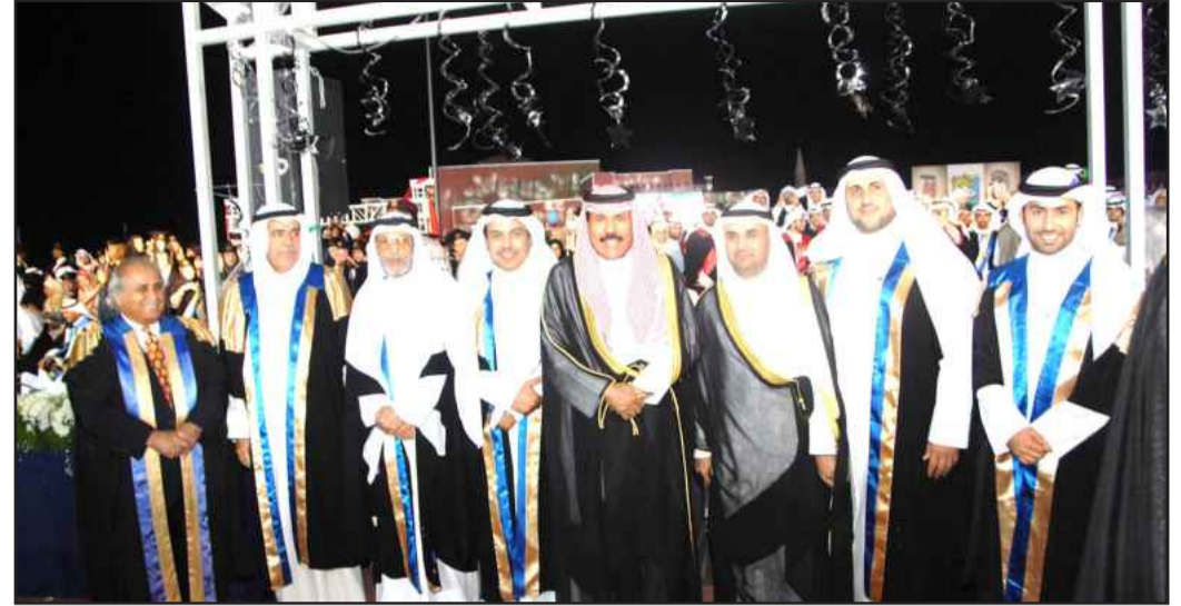
● سمو ولي العهد يتوسط أساتذة الحقوق بحضور وزير التربية و مدير الجامعة