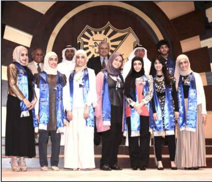
● لقطة تذكارية

لجامعة الكويت التي تفخر بمرور ٥٠ عاما على تأسيسها والتي أثبتت أنها المركز الأمثل لتجهيز الشباب وتزويد سوق العمل بكفاءات وطنية متميزة أثبتت مكانتها ومهنتها العالية في مواقع عدة، موضحاً أن ابتعاثها الخارجي لعدد كبير من الطلبة لرسائل الماجستير والدكتوراه ما هو إلا تأكيد لاستمرارية مسؤوليتها الكبيرة والتي تؤكد بذلك دورها في النهوض بمستوى مخرجات التعليم المؤهلة تأهيلاً عالياً يخدم من خلاله المجتمع و الوطن.