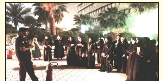
● جانب من الورشة