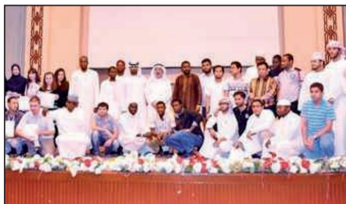
● الطلبة الوافدون في مسرح الهيئة الخيرية