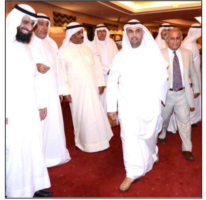
● ترحيب بوزير التربية و مدير الجامعة

خلال حفل تكريم أوائل الطلبة للعام الجامعي ٢٠١٢/٢٠١١