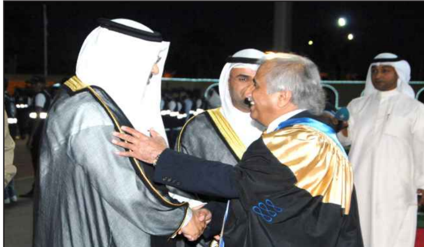
● سمو الشيخ جابر المبارك مصافحا مدير الجامعة أ.د. عبداللطيف البدر