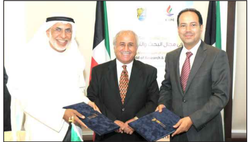
● تبادل الاتفاقيات بحضور مدير الجامعة

الكويت ستساهم في هذا المجال وخاصة أن الجامعة بدأت من الاقتراب بالاحتفال على مرور ٥٠ عاما على تأسيسها. وأكد على استعدادهم وتعاونهم من خلال توفير وتبادل المعلومات التي سيحتاجها البحث العلمي والباحثين في عملهم، للمساهمة في حل أية مشاكل تواجه القطاع النفطي، بل والتغلب عليها بمراحل مبكرة من العمل والمساهمة في تطوير الصناعة النفطية، وأن هذه المذكرة بداية لانطلاق جديدة بين الطرفين.