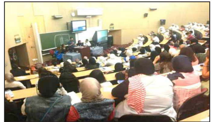
● جانب من ندوة المرأة