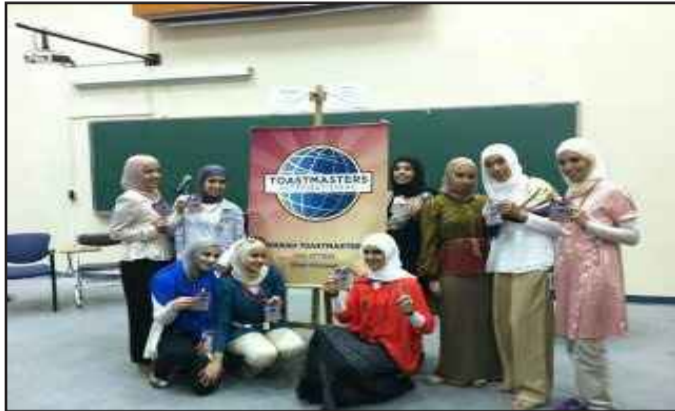
● أعضاء النادي في لقطة تذكارية