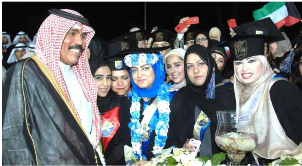
● سمو ولي العهد مع كوكبة من خريجات الدفعة ٤١