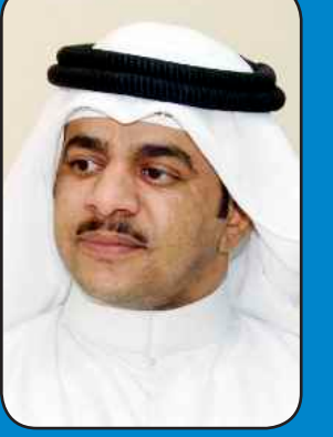
إعداد مهدي العجمي

قلبي يناشدني يبي شي مفقود عن حاجة من غير وده فقددها يسأل وانا دنقت من دون مردود عجزت اطلع كلمة يعتمددها ماقلت لا ضايح ولا قلت موجود سكت ماكنه لروحي نشدها اخفيت ماكنيت والجوف ملهود والنار في روحي تزايد وقدها عليك ياللي تفتن الناس بالسود