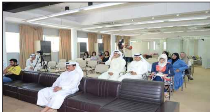
● لقطة تذكارية في مدرج المطار