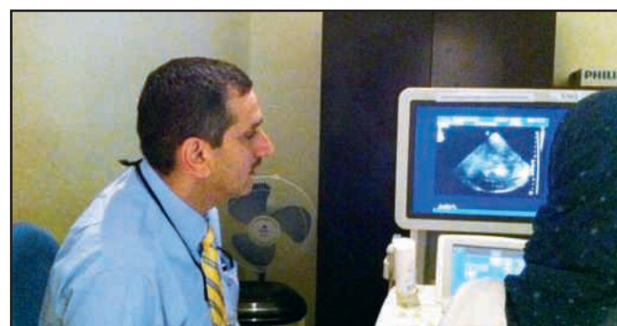
● جانب من الورشة