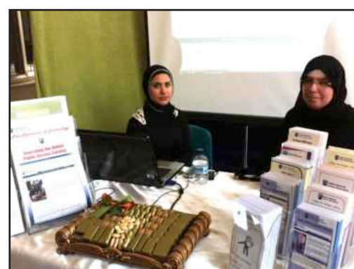
جناح المكتبة في المعرض

شاركت مكتبة كلية البنات الجامعية في معرض «تخصصي مستقبلي» الذي أقامه مكتب العميد المساعد للشؤون الطلابية بكلية البنات الجامعية في بداية أبريل الحالي ايماناً منها بأهمية فتح قنوات التواصل بين المكتبة والمجتمع المحلي للكلية من اعضاء هيئة التدريس والطلابات. واستعرضت مكتبة كلية البنات الجامعية في المعرض مصادر المعلومات الالكترونية المتاحة من خلال الموقع الالكتروني لإدارة المكتبات ( http://library.kuniv.edu.kw ) بدءاً من الفهرس الآلي والكتب الالكترونية والدوريات الالكترونية مع توضيح كيفية استخدامها.