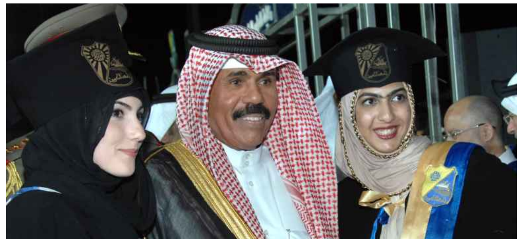
● خريجتان مع سموه