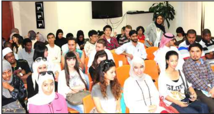
● جانب من الحضور