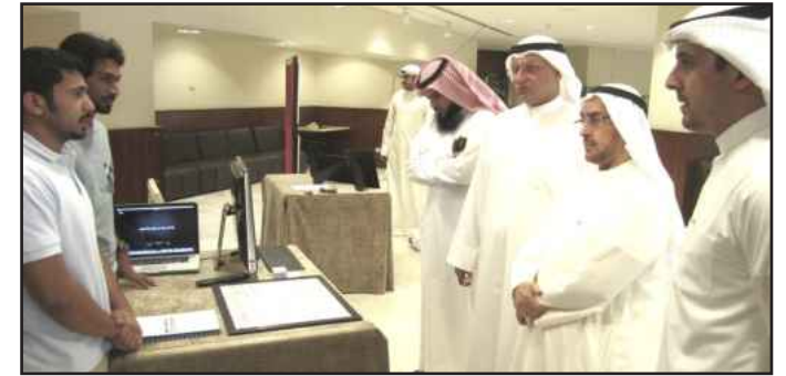
● عميد الكلية في حديث مع أحد الفنانين