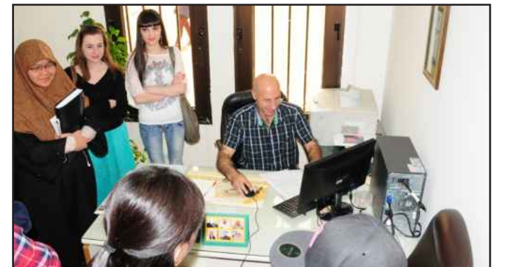
.. و الزميل فيصل المتني في التدقيق اللغوي