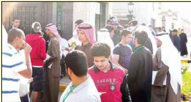
● الطلبة بعد تقديم الامتحان