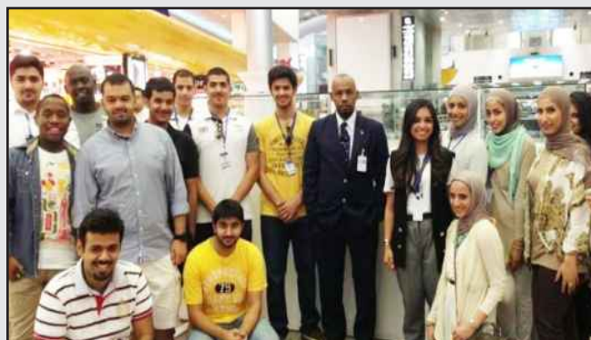
● .. داخل المطار

وفي الختام توجه أعضاء الجمعية بالشكر إلى فريق العمل في المطار على استقبالهم وترحيبهم وعلى ما قدموه من معلومات مفيدة.