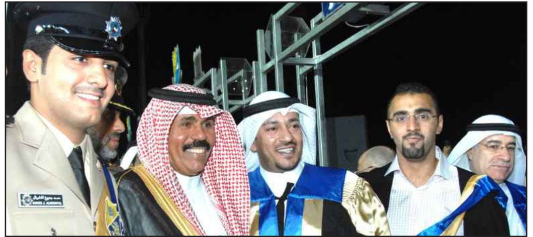
● ... ومع أبناء الخريجين

مضيفا الخريجين والخريجات يقفون اليوم على أعتاب الحياة العملية بعد أن أتموا بكل توفيق ونجاح دراستهم الجامعية في رحاب جامعة الكويت. وتقدم مقصيد بكل الشكر والتقدير لكل من دعم أو يدعم الجامعة في مسيرتها لتحقيق رسالتها السامية في ظل قيادة حضرة صاحب السمو أمير البلاد المفدى وسمو ولي عهده الأمين حفظهما الله ورعاهما.