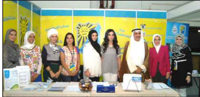
● لقطة تذكارية

ومركز الخوارزمي وإدارة العلاقات العامة والإعلام في معرض التعليم والتوظيف ٢٠١٣، لإتاحة الفرصة لعرض الخدمات التعليمية والأكاديمية والبحثية التي تقدمها جامعة الكويت في مختلف الكليات ومراكز العمل بها للجماهير الخارجية، وذلك انطلاقاً من دورها في إنتاج المعرفة الإنسانية ونشرها، وإعداد الثروة البشرية والقيادات الواعية لثرائها، للوفاء باحتياجات ومتطلبات العصر الحديث، لتحقيق أهداف التنمية واحتياجات المجتمع.