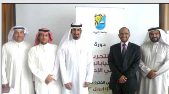
● المحاضر مع موظفي البلدية