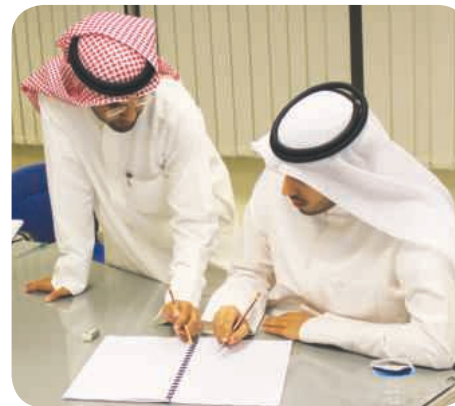
المشاركين اثناء الدورة