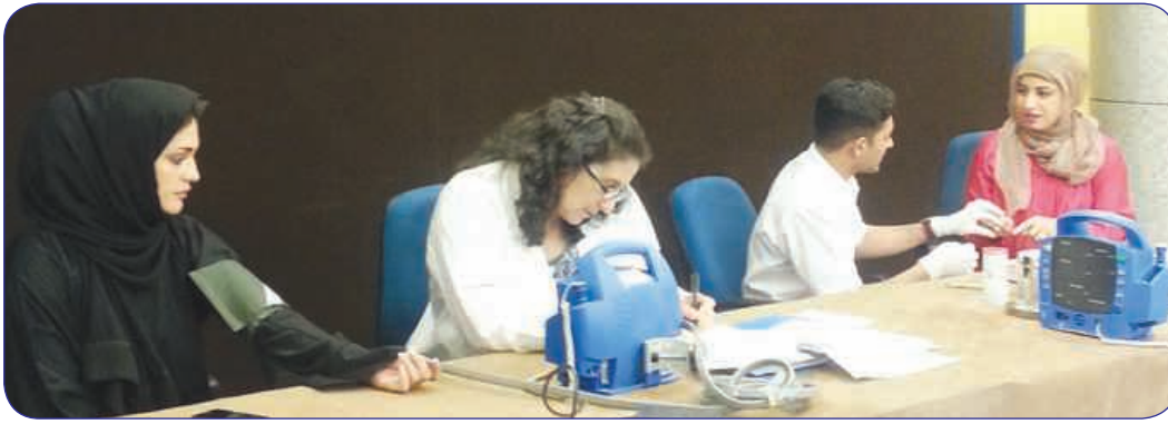
موظفات خدمة المجتمع يشاركن بالحملة