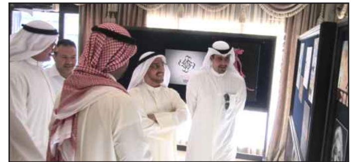
● .. و يطلع على لوحة فنية