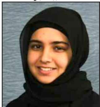
● وضحة المطوع

أجرى التحقيق: القسم الاعلامي بعمادة شؤون الطلبة