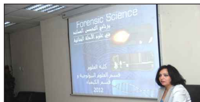
● عرض البرنامج