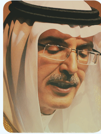
بدر بن عبدالمحسن

أيدي أشخاص يخدمونه لمحبتهم لهذا الشعر وليس للربح السريع علي حساب الشعر ، ولا يريد انتشاؤم ولكن تجربة شاعر المليون هي دليل علي اهتمام الفضائيات بالشعر رغم ان برنامج شاعر المليون الان هل هو متابع مثل الموسم الاول والثاني ولكن يبقى انه جهة أغلب الشعراء للبروز لذا اقول وأؤكد ان مستقبل الشعر في أيدي الشعراء الحقيقيون ، نعم الفضائيات تخدم ولكن لابد ان يكون صاحبها مهتم بالشعر وليس بالسعر .