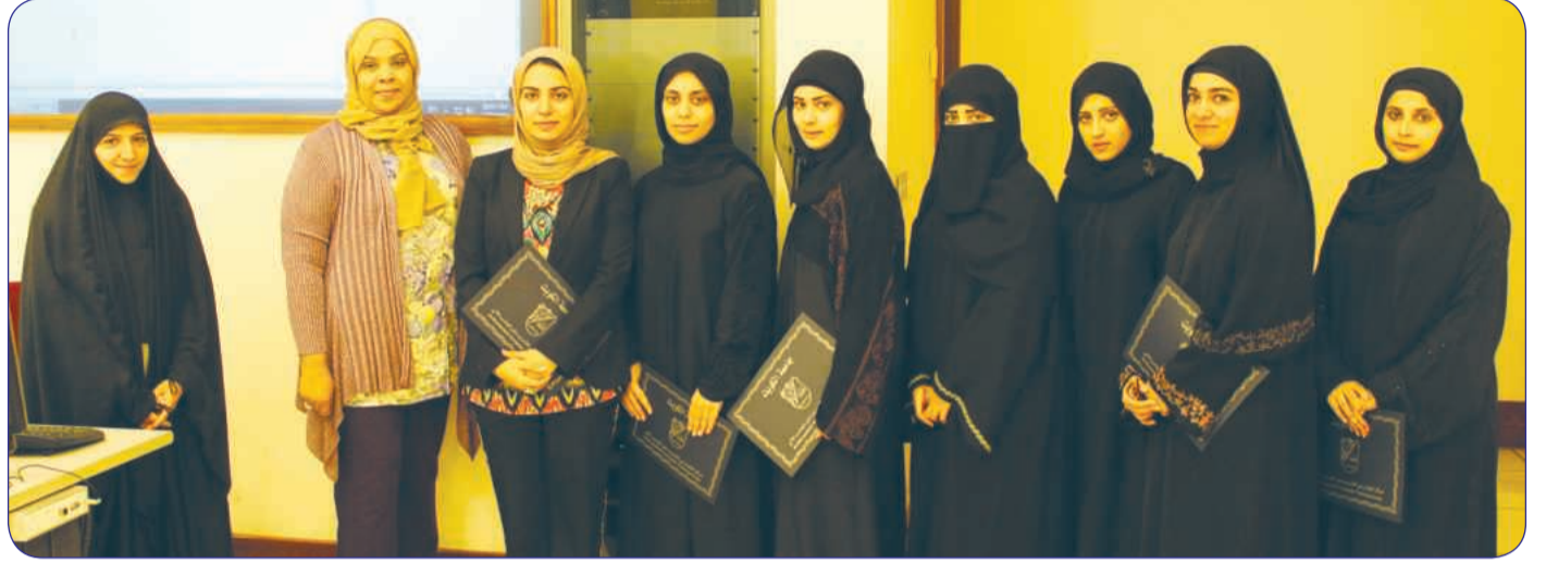
المشاركات في الدورة