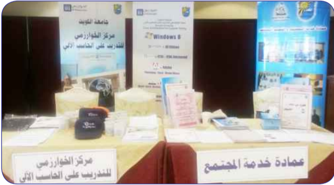
عمادة خدمة المجتمع و الخوارزمي

طلاب وطالبات وفق جدول زمني منظم بالتعاون مع إدارة الأنشطة المدرسية بوزارة التربية . من جانب آخر اختتم مركز الخوارزمي في عمادة خدمة المجتمع والتعليم المستمر بجامعة الكويت دورة STAADPRO والموجهة لموظفي وموظفات وزارة الأشغال ، حيث استغرقت الدورة أسبوعين ، وقد لاقت الدورة استحسان المتدربات .