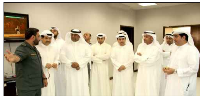
● شرح حول آلية العمل

الطبية وأوجه التعاون الأخرى المنشودة في مجال السلامة والصحة العامة في حالات الطوارئ وبصفة عامة، كما تمت مناقشة الموضوع الخاص بطلب الجامعة من وزارة الصحة توفير سيارات إسعاف دائمة في بعض مواقع الجامعة.