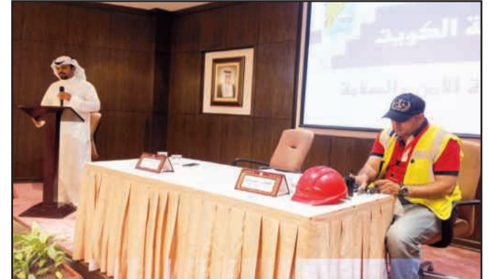
● جانب من الندوة

قد تحدث خلال العمل في المواقع الإنشائية.