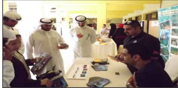
● اهتمام بالمطبوعات