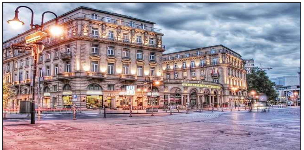
● تصوير لشوارع المدن