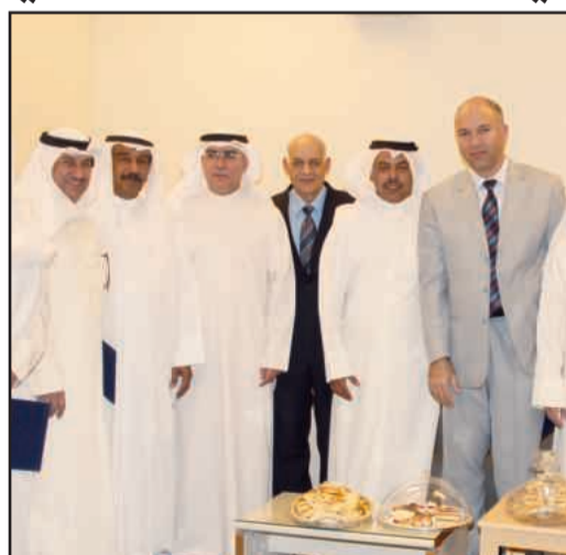
● لقطة تذكارية للمكرمين