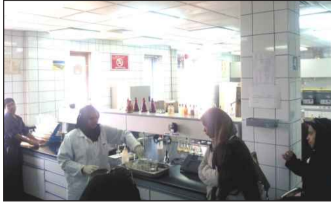
● الطالبات يطلعن على مراحل المعالجة

الأمرين يساعد الطالبات على ربط المفاهيم النظرية التي تدرس في الفصل بالواقع العملي ليتكون لديهم الحس الكامل للمعلومة. إضافة لذلك أن مثل هذه الزيارات تتيح الفرصة للطالبات لمعرفة مجالات العمل التي تساعدنهم مستقبلاً على اختيارهم لمكان الوظيفة التي يرغبن بها.