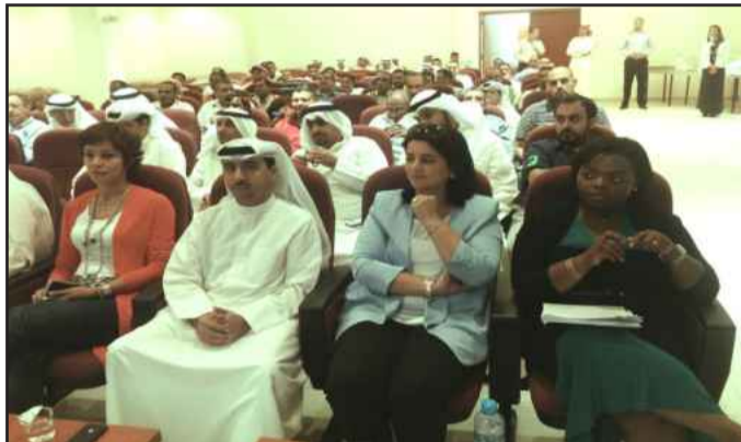
● مقدمة الحضور