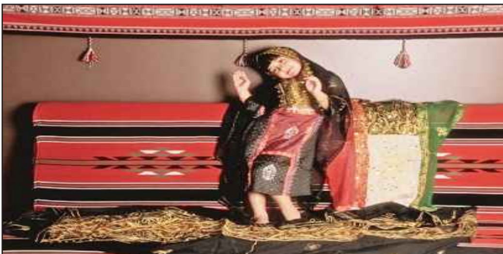
● من التراث