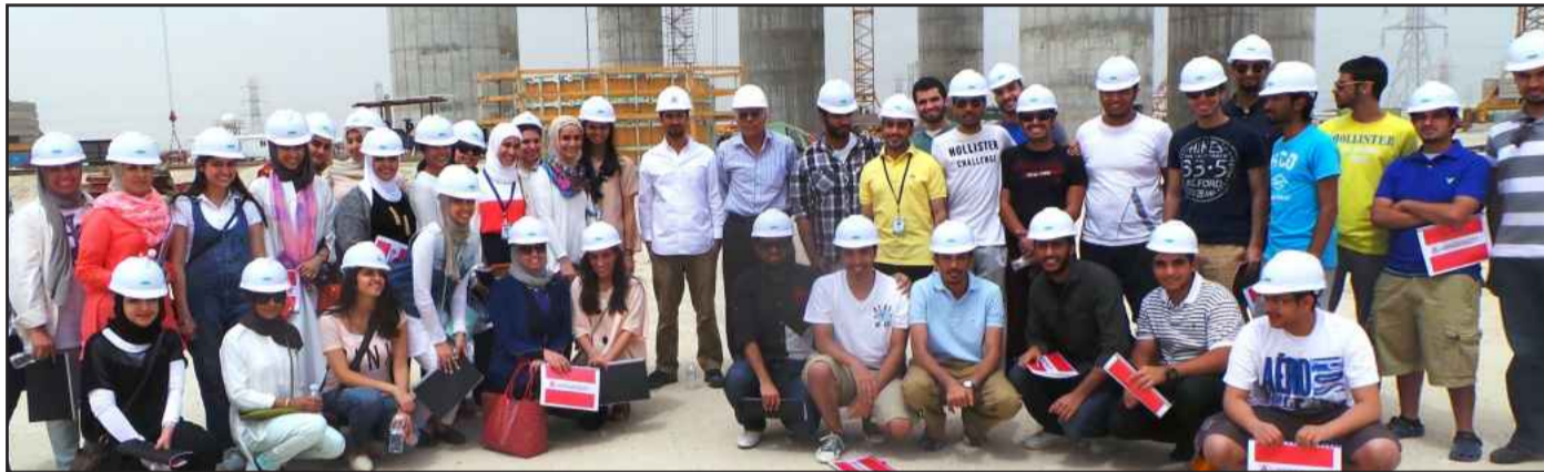
● جانب من زيارة الجمعية الأمريكية للمهندسين المدنيين إلى أبراج المياه في مدينة جابر الأحمد