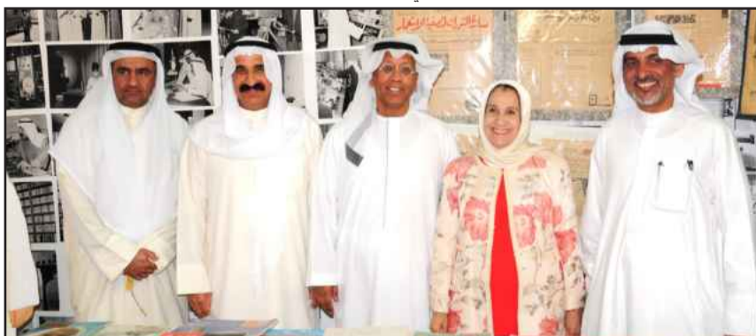
● لحظة تذكارية