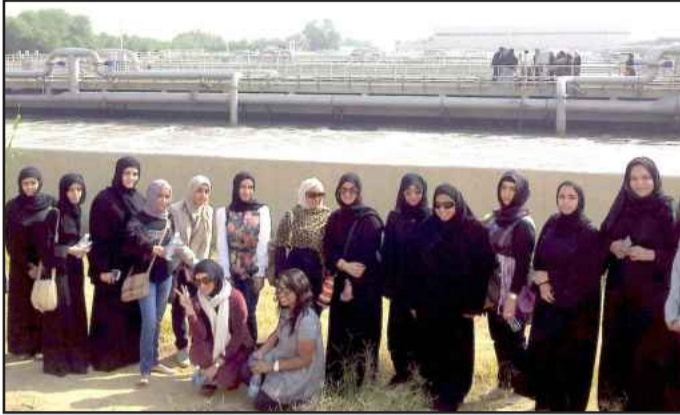
● لقطة تذكارية