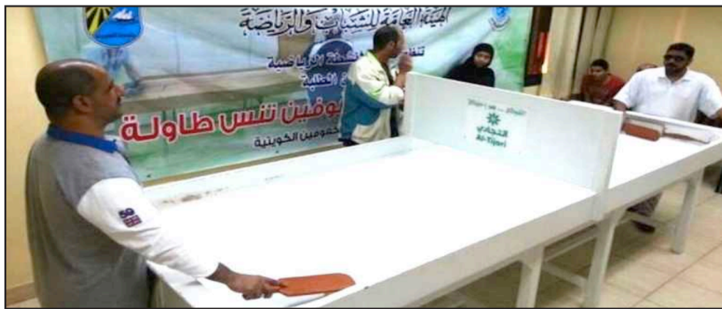
● جانب من المباريات