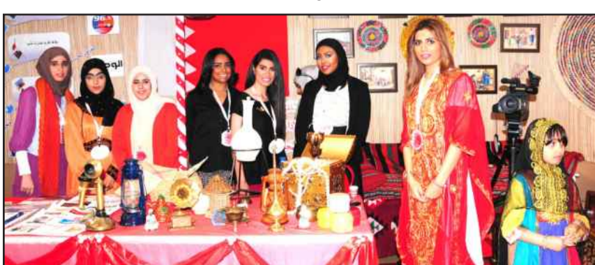
● جناح مملكة البحرين