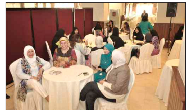
● جانب من الحفل