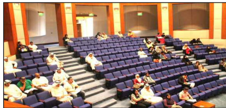
● جانب من الحضور