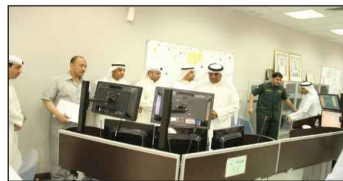
● أعضاء اللجنة يطلعون على التجهيزات