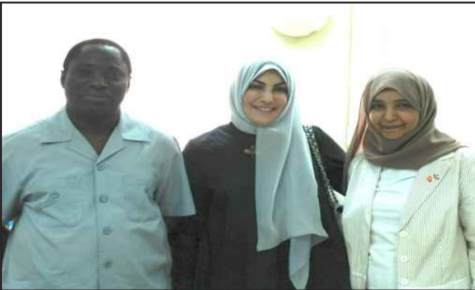
● لقطة تذكارية