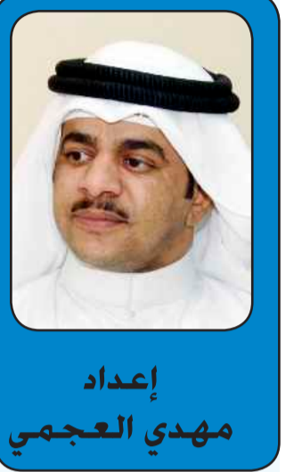
إعداد مهدي العجمي

التسعينات من المراحل الجميلة التي كانت الأبرز ثقافياً وتراثياً في المجتمع الجامعي