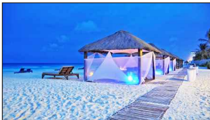
● تجسيد للراحة والاسترخاء