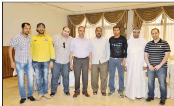
● لقطة تذكارية