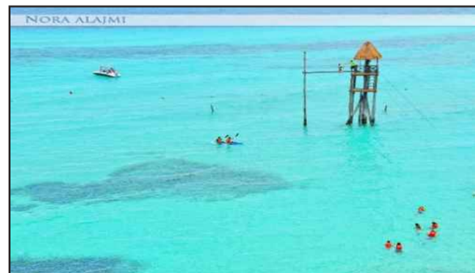
● لقطة من عدستها