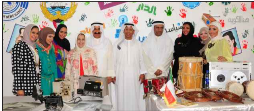
● جناح دولة الكويت