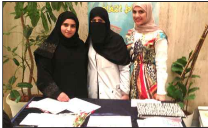
● مكتب الأنشطة الثقافية في الجابرية