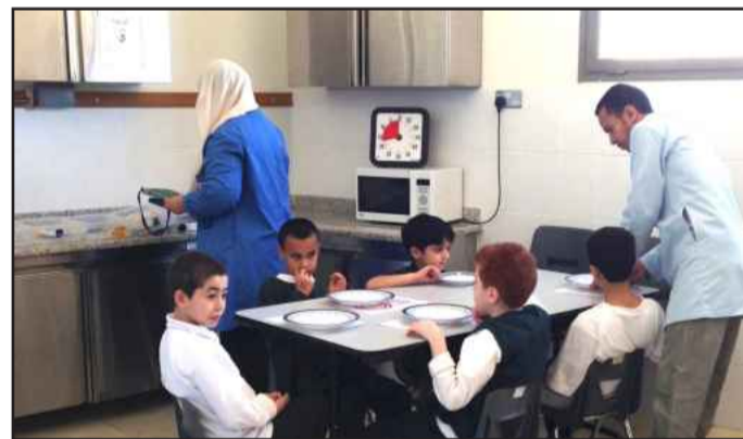
● أثناء تناول الأطفال لوجبة الإفطار