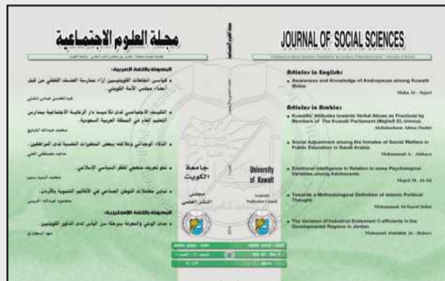
● غلاف العدد الجديد