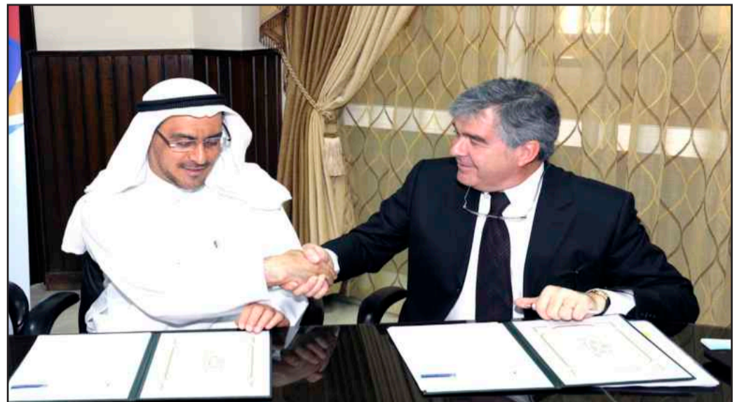
● جانب من توقيع الاتفاقية