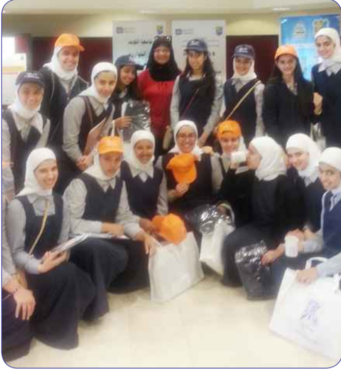
طلبة ثانوية قرطبة مع الخوارزمي