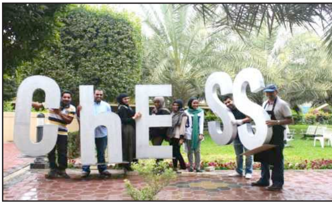
● من فعاليات حفل الباربيكو

الجمعية الأمريكية للمهندسين الميكانيكيين نظمت مسابقة rubber band car racing