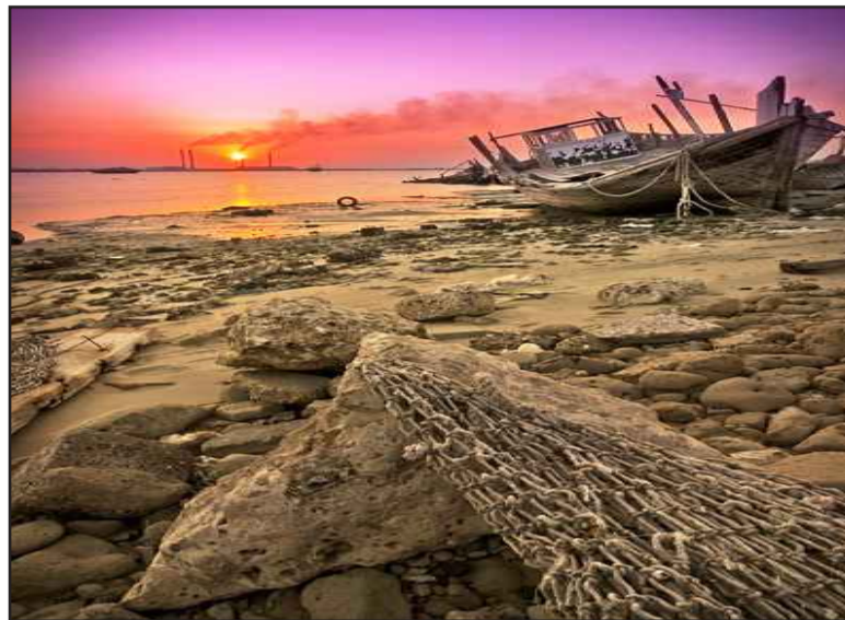
● شاطئ وغروب