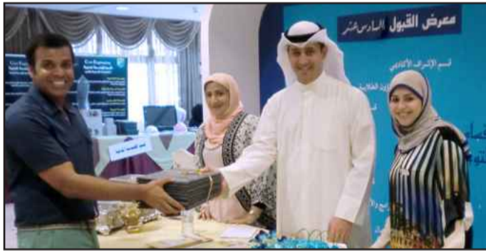
● الفاضل يكرم اللجنة المنظمة للمعرض