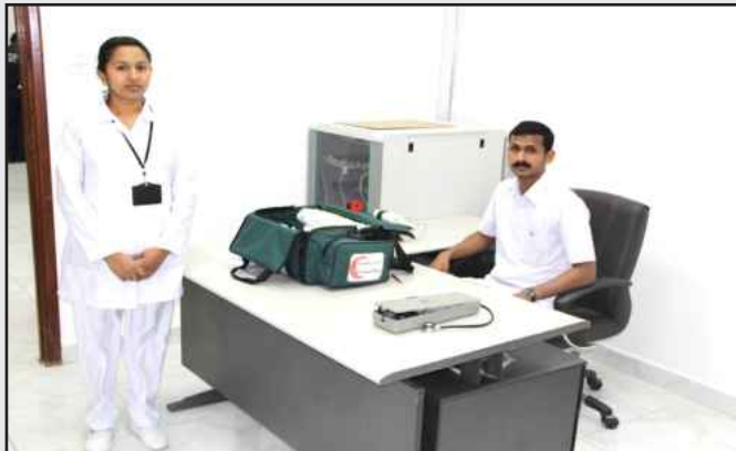
● خدمات الإسعافات الأولية اللازمة للطلبة

من جانب آخر أوضح مراقب التخطيط والمتابعة بالإدارة قيس النورة أن الإدارة تسعى جاهدة للعمل على تخفيف معاناة مرتادي الجامعة بالشيوخ من الازدحام والاختناقات المرورية على بوابات شارع الغزالي، موضحاً أن الإدارة أصدرت تعليماتها التي من شأنها المساهمة في تخفيف هذه الاختناقات المرورية ، حيث يقوم رجال الأمن والمشرفين في موقع الشيوخ بتوجيه قائدي المركبات باستخدام بوابات شارع الجاحظ و شارع جمال عبد