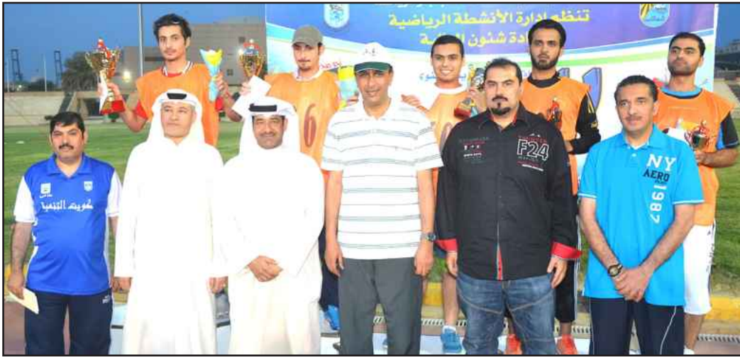
● الفائزون بالمراكز الاولى