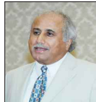
د. عبد اللطيف البدر

بداية أكد مدير الجامعة الأستاذ الدكتور عبد اللطيف البدر أن الرعاية الكريمة التي تتجلى بتفضل حضرة صاحب السمو أمير البلاد الشيخ صباح الأحمد الجابر الصباح حفظه الله ورعاه، ليشمل برعايته حفل تكريم خريجي جامعة الكويت الفائقين للعام الجامعي ٢٠١١/٢٠١٢، لتعبر في أجلي وأصدق معانيها عما يحظى به التعليم العالي في وطننا الغالي الكويت من اهتمام القيادة السياسية العليا ومدى حرصها على أن تدفع به إلى مصاف الارتقاء والتقدم والتطور، لإيمانها بأنه السبيل الأمثل للتنمية المجتمعية الشاملة التي تحقق العزة والازدهار لوطننا العزيز.