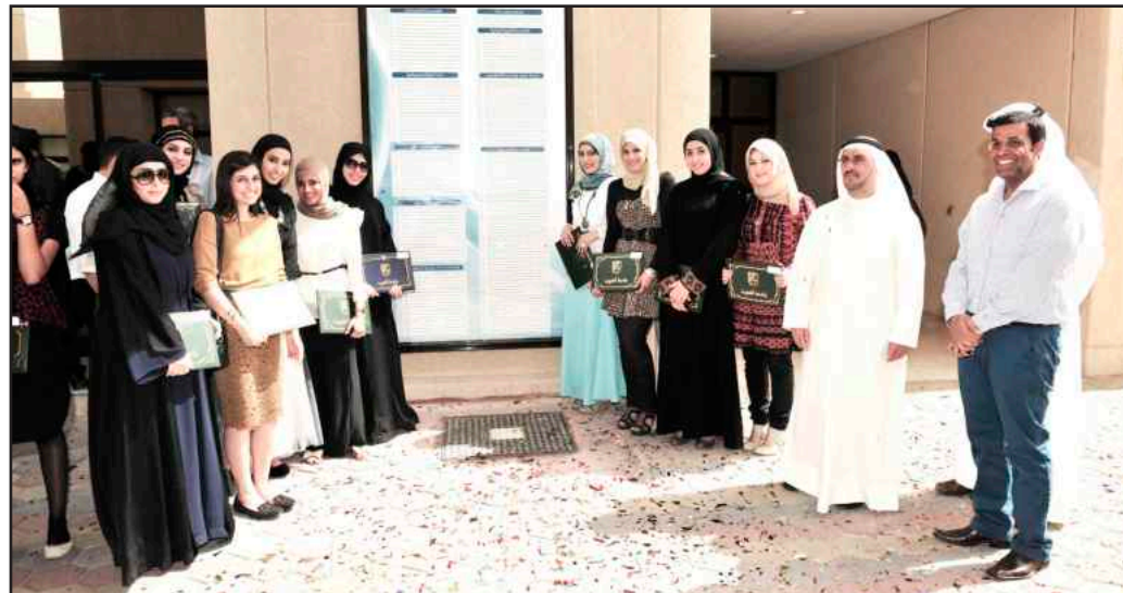
● ..و الطالبات مع عميد الكلية