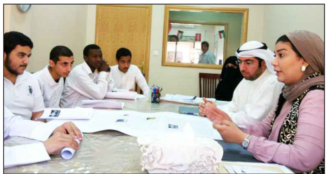
● مناقشة الطلبة مع لجنة التحكيم

لمنطقة الأحمدية التعليمية ، وتأتي هذه الخطوة إيماناً منا بدعم الطاقات الشبابية في المرحلة الثانوية اعلاميا، وتأهيلهم مهنيا حتى وان كانوا هواة صحافة .