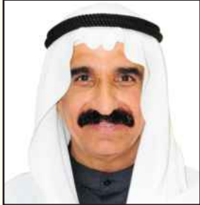
بقلم: د. بدر الحجي

التفوق غاية ينشدها غالبية الدارسين، ويحاول الدارس الجاد والحريص على التفوق البحث عن الآليات التي تضمن له ما يريد، وتتضارب الرؤى حول أسباب التفوق الدراسي، هل يرجع إلى حفظ الدارس للمواد الدراسية أم أنه يعود إلى أسباب أخرى منها أن يسعى الدارس إلى الفهم المتعمق للمواضيع المراد استيعابها.