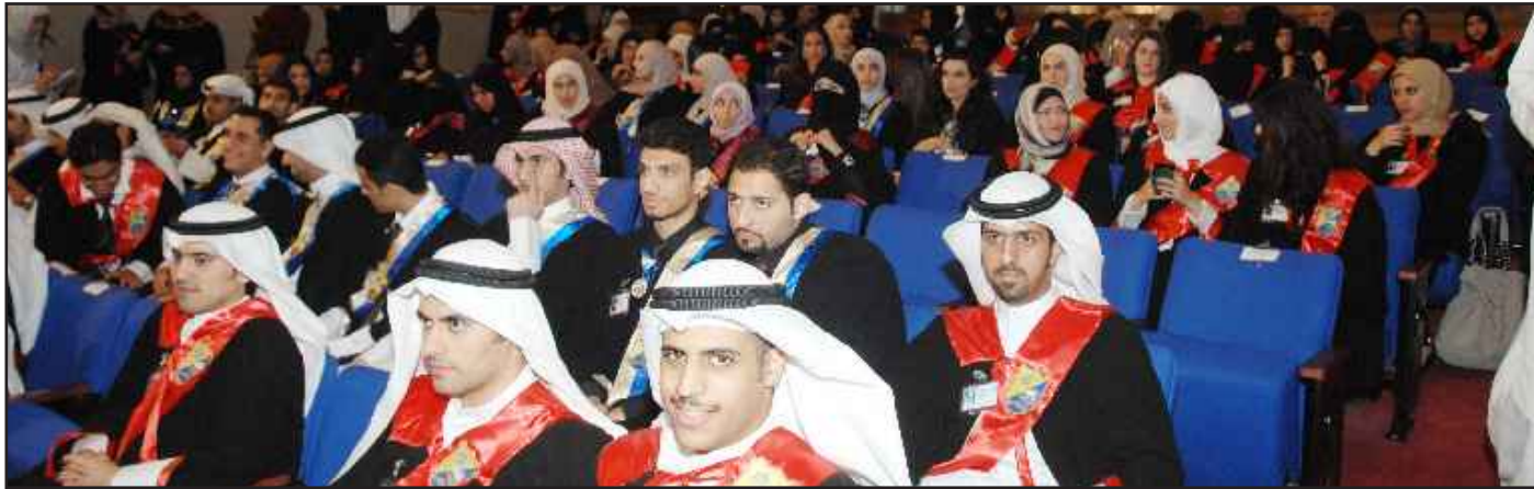
● متفوقو ومتفوقات الدفعة الـ ٤١

للمساهمة في رفع المستوى العلمي والثقافي والاجتماعي في المجتمع الكويتي، متعاونات مع زميلاتهن وزملائهن من خريجي جامعة الكويت يشاركنهم كل مخلص لبناء مستقبل أفضل لوطننا الكويت.