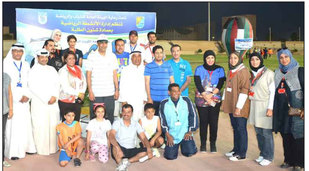
● لقطة جماعية

المشاركات الفاعلة وعدد الفرق التي تنافست في البطولات، مشيدا بالجهود التي تقوم بها الهيئة العامة للشباب والرياضة في تقديم كافة الخدمات والدعم لإدارة الأنشطة الرياضية.