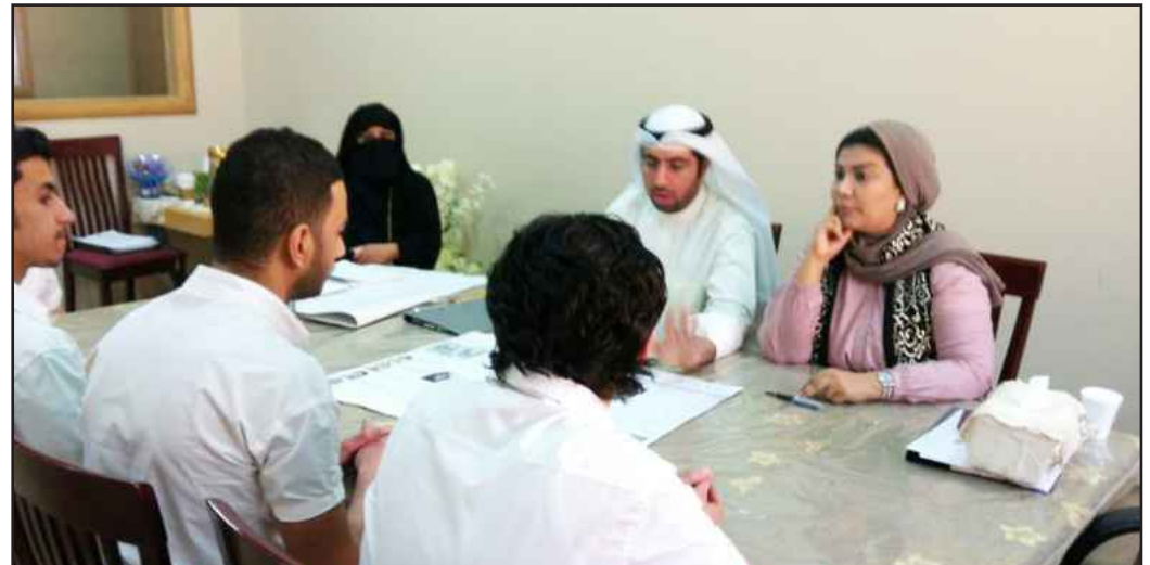
● شرح الطلبة لملاحظاتهم