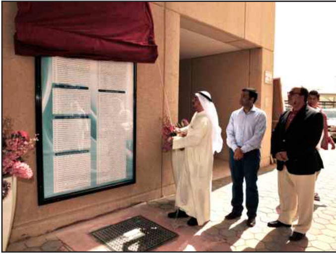
● أ.د. الخياط يزج الستار عن القائمة