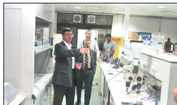
● جولة في المختبر

استقبلت كلية الهندسة البروفيسور مصطفى السيد أستاذ الكيمياء بجامعة جورجيا للعلوم والتكنولوجيا بأمريكا . وقام بزيارة بعض مختبرات النانو تكنولوجي بالكلية كما قام بالقاء العديد من المحاضرات . ومن الجدير بالذكر أن البروفيسور السيد هو أول عالم عربي يحصل على قلادة العلوم الوطنية الأمريكية، كما عمل البروفيسور في العديد من الجامعات الأمريكية مثل جامعة هارفارد وويل ومعهد كاليفورنيا للتكنولوجيا وحالياً بمعهد جورجيا للتكنولوجيا حيث يشغل منصب رئيس كرسي جوليوس براون وكذلك رئيس مركز أطياف الليزر بذات المعهد ، كما عُيّن مستشاراً لدى العديد من مراكز الأبحاث مثل مختبر تقنيات الفضاء ومختبر الإلكترونيات التابعة للقوات البحرية الأمريكية وكذلك أصبح مستشاراً لدى مؤسسة العلوم القومية ومستشاراً لفرع الكيمياء الفيزيائية في IUPAC ومستشاراً اجنبي لمعهد العلوم الجزيئية الياباني، كما أنه أول من طبق النانو في استخدام مركبات الذهب المتناهية الصغر في علاج مرض السرطان .