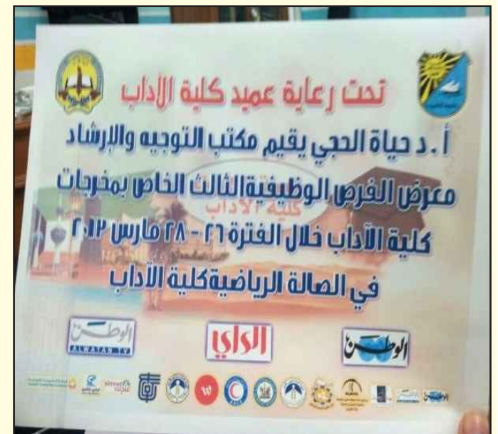
● بوستر المعرض

يبدأ بعد غد الثلاثاء معرض الفرص الوظيفية الثالث للعام الجامعي ٢٠١٣-٢٠١٢ في كلية الآداب . أعلن ذلك مكتب العلاقات العامة بالكلية مبيناً أن المعرض سيستمر حتى يوم الخميس المقبل في الصالة الرياضية في كلية الآداب . من جهته أكد مكتب التوجيه والإرشاد أن استمرارية معرض الفرص الوظيفية تأتي للفائدة التي يعود بها على الطلبة ، معرباً عن أمله بأن يحقق نجاحه المعهود كل سنة مؤكداً استمراره بكل نشاط يفيد طلبة الكلية.