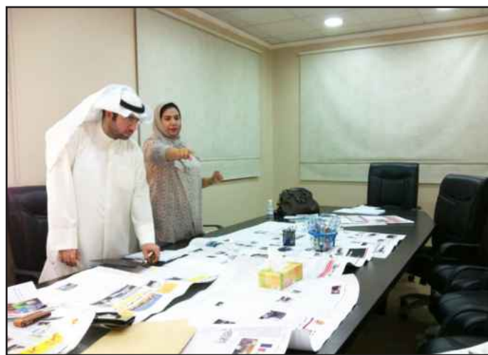
● تحكيم مواد المسابقة

وتأتي مشاركة صحيفة آفاق الجامعية ضمن مسؤوليتها الاجتماعية في تبني الطاقات الشبابية و صقلها في إدارة الأنشطة التربوية بالإدارة العامة هذا المجال.