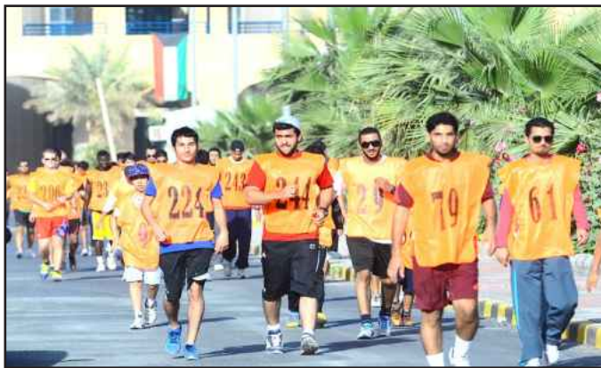
● المشاركين في السباق