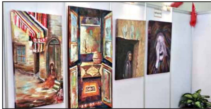
● لوحات تشكيلة تجسد الماضي