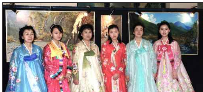
● جانب من الطالبات المشاركات