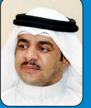
إعداد مهدي العجمي

الشعر من ريشته الجزل ارسمه المعاني من بحر فكري صفو والرجال اهل الوفا والمكرمه عن خطايا من يعزونه عفو والشجاع اللي غنا الوقت قسمه نص ربه بالشدايد ما وفو شأن وقته والمواجه تصدمه والضلوع العوج بالحنن اكتفو الرجال اللي حسبهم محزمه