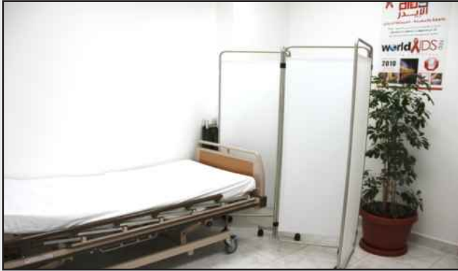
● تجهيزات طبية