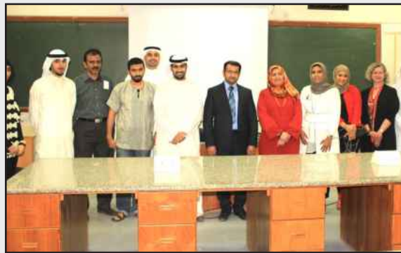
● لقطة تذكارية