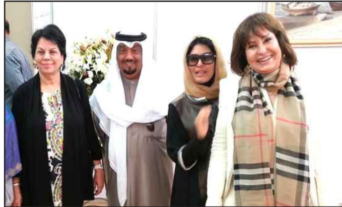
● لقطة تذكارية للفنانين المشاركين