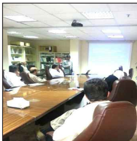
● البروفيسور هيرا كول متحدثاً

الزيارة بأعضاء هيئة التدريس وطلبة الدراسات العليا بالقسم العلمي، وألقى خلال زيارته محاضرات علمية تخصصية في الإحصاء بعنوان “Model Diagnostics via Khmaladzes Martingale Transform” “Model Diagnostics in the Presence of incomplete” “Observation