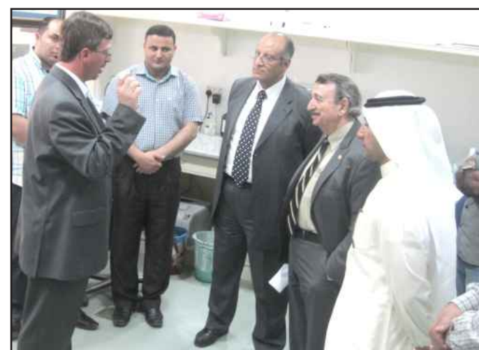
● د. السيد يستمع للشرح