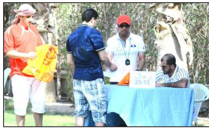
● تسجيل اسماء المشاركين