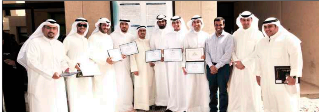
● المتفوقون في لقطة تذكارية