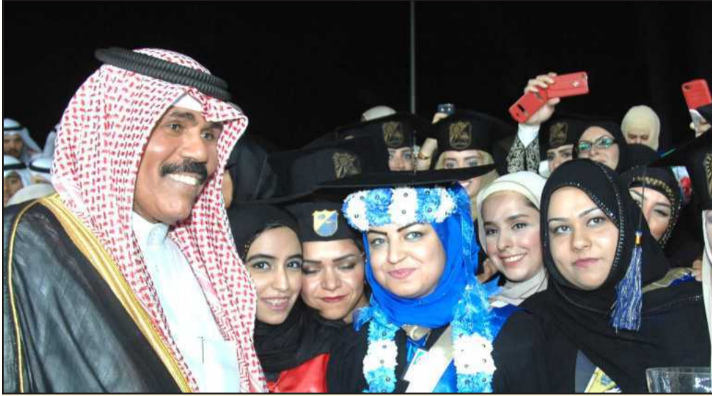
خريجات مع سمو الشيخ نواف الأحمد

وزير الإعلام افتتح دورة الصالح و أكد أن الحرية مسؤولية