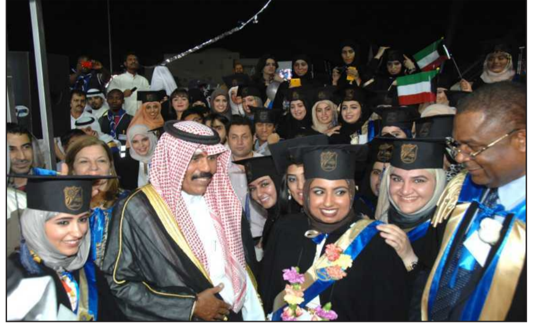
● سمو ولي العهد يشارك الخريجات فرحتهن