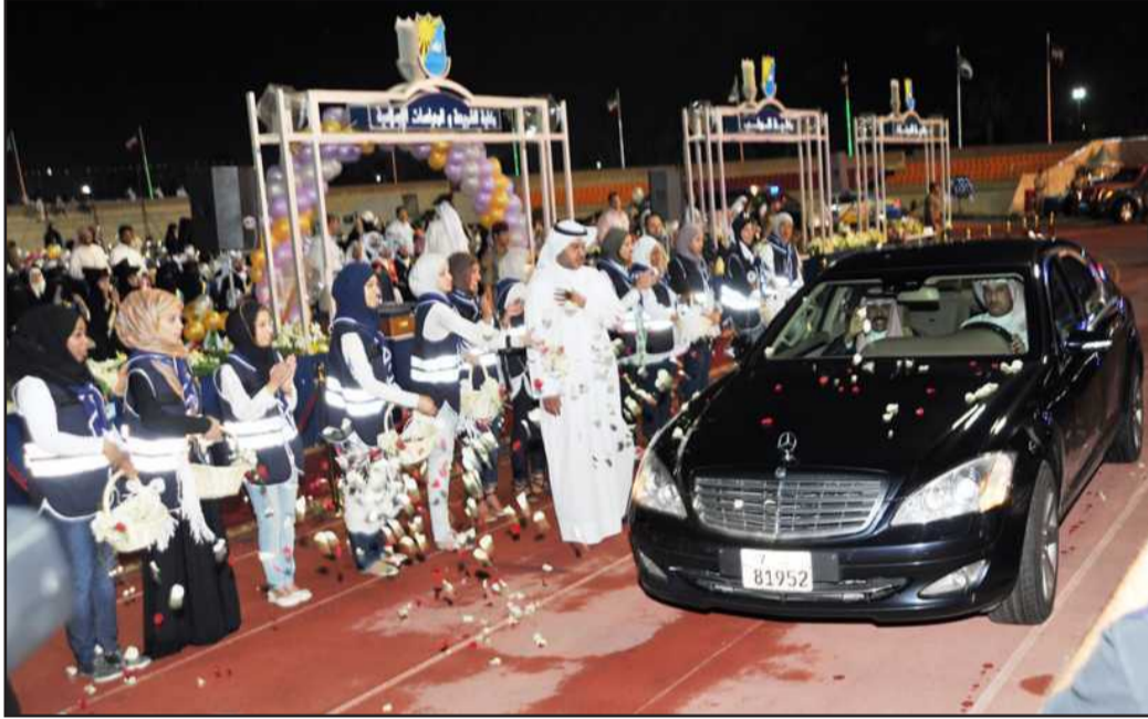
● الجوالة ينثرون الورود على سمو ولي العهد