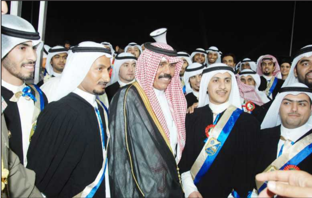
● ابتسامة أبوية