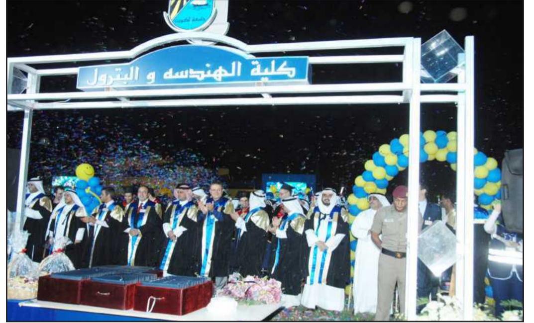
● خريجو الهندسة و البترول