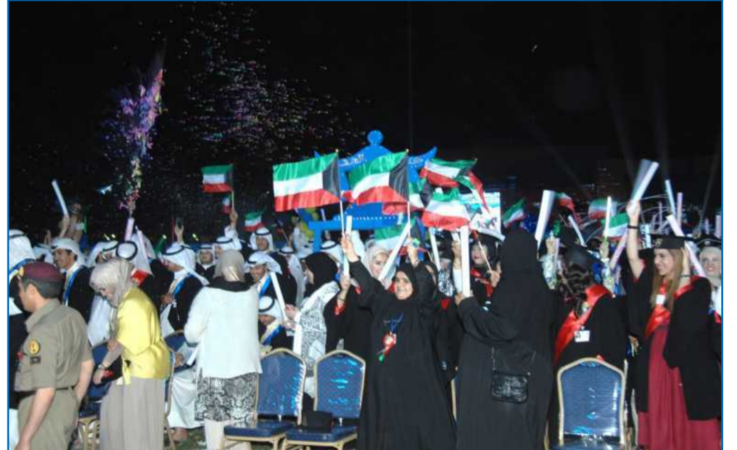
● أعلام الكويت رفرفت عاليا