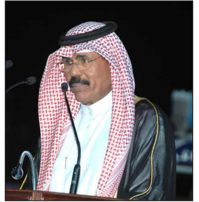
● سمو ولي العهد الشيخ نواف الأحمد يلقي كلمته