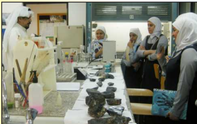
● زيارة لأحد المختبرات