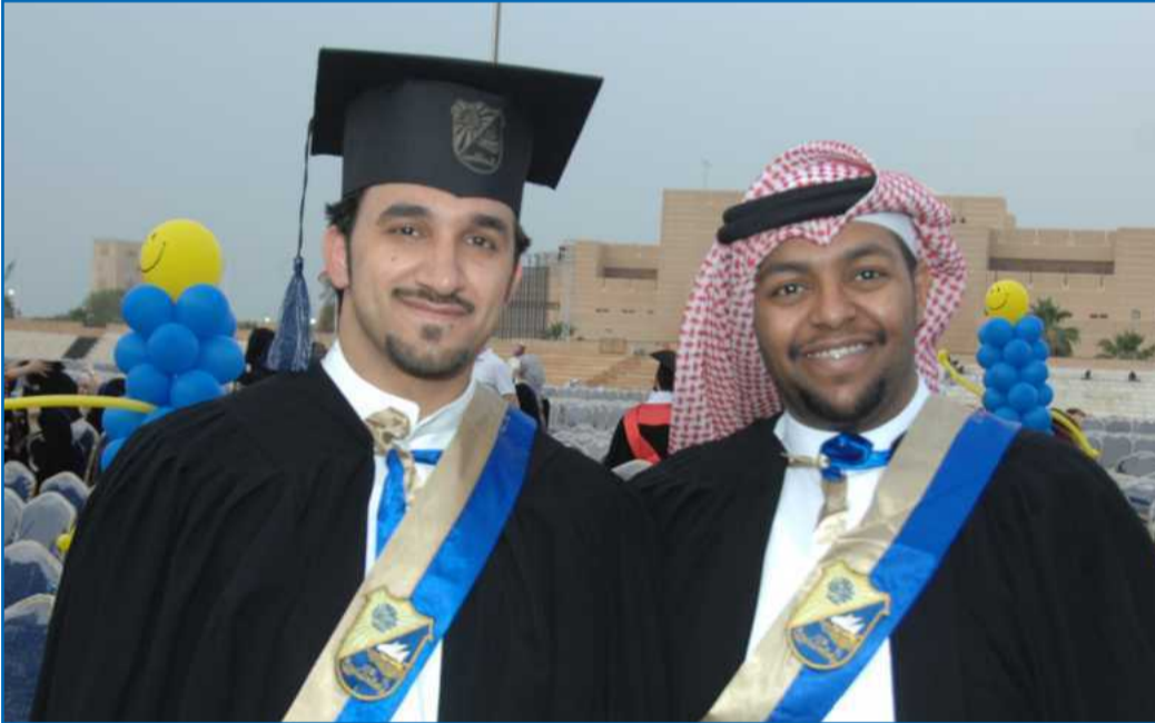
● فرحة ونظرة للمستقبل