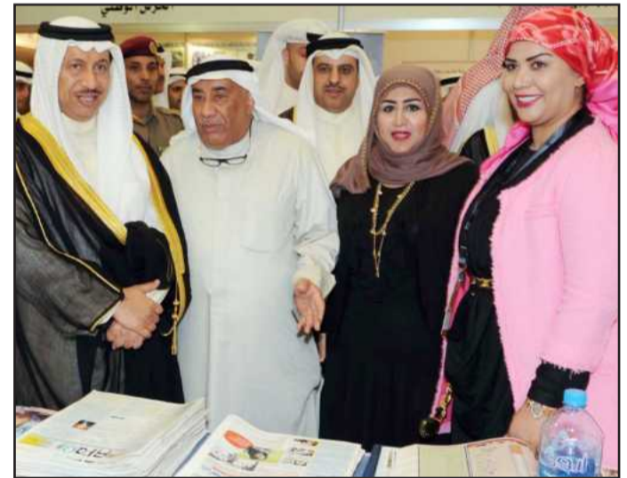
سمو رئيس مجلس الوزراء في جناح آفاق

حظي جناح جريدة آفاق الجامعية بزيارة رئيس الوزراء سمو الشيخ جابر المبارك ونائب رئيس مجلس الوزراء و وزير الخارجية و وزير الدولة لشؤون مجلس الوزراء الشيخ صباح الخالد و وزير الإعلام الشيخ محمد عبدالله وذلك ضمن فعاليات الملتقى الإعلامي العربي التاسع و ملتقى الكويت الإعلامي العربي الثاني للشباب «دورة محمد مساعد الصالح»