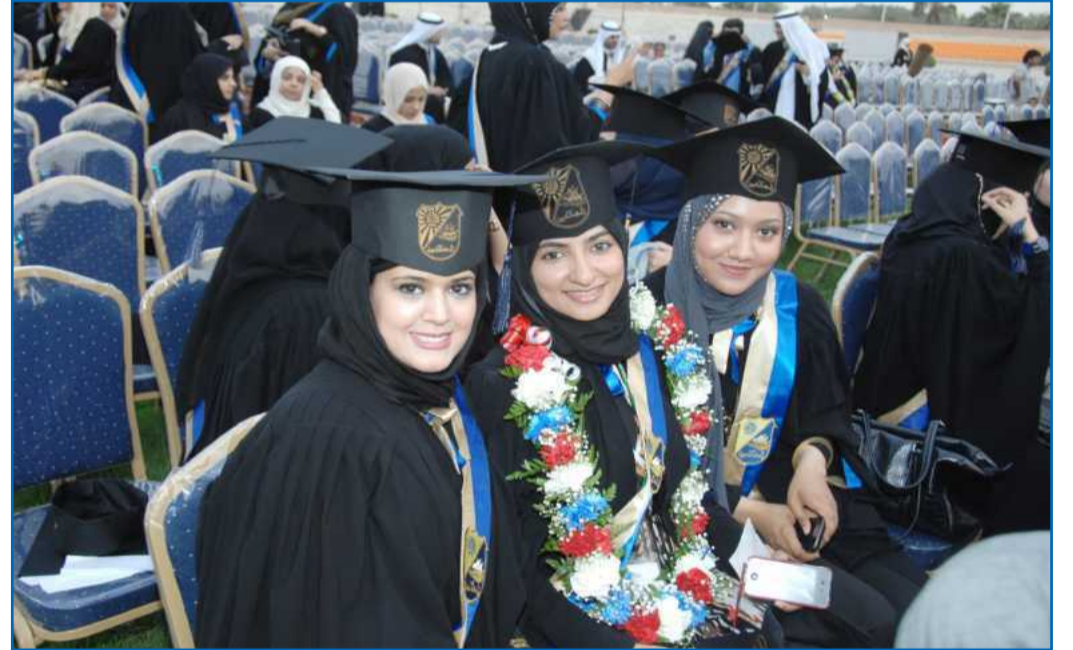
● ابتساماة ثلاثية مفعمة بالأمل