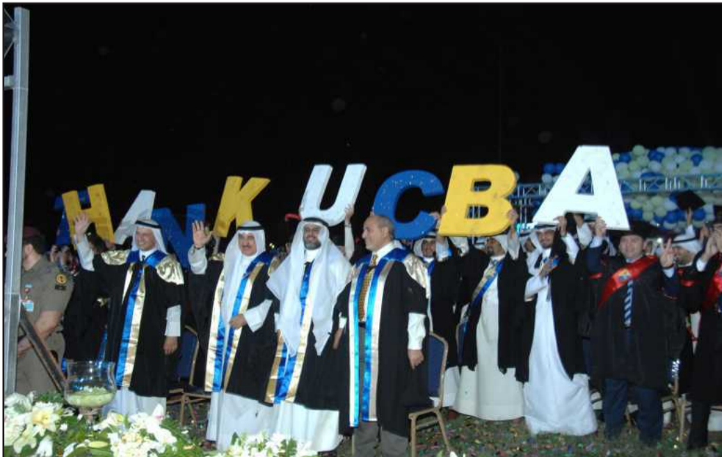
● .. وخريجو العلوم الادارية