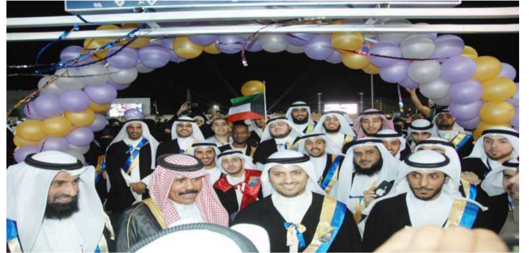
سمو ولي العهد يتوسط خريجي كلية الشريعة