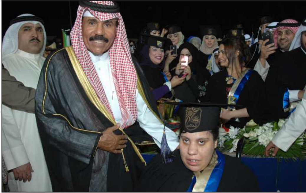
● سمود مع خريجة من ذوي الاحتياجات الخاصة