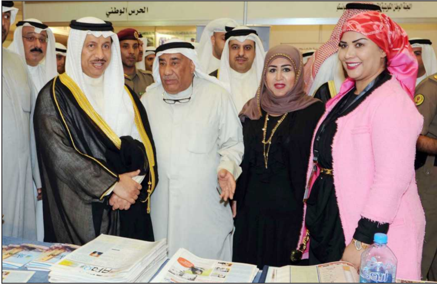
• سمو رئيس مجلس الوزراء في جناح آفاق مع مستشار التحرير طارق إدريس و الزملتان أمينة البناي و هبة الطويل

حظي جناح جريدة آفاق الجامعية بزيارة رئيس الوزراء سمو الشيخ جابر المبارك الصباح و نائب رئيس مجلس الوزراء و وزير الخارجية و وزير الدولة لشؤون مجلس الوزراء الشيخ صباح الخالد و وزير الإعلام الشيخ محمد عبدالله المبارك و ذلك ضمن فعاليات الملتقى الإعلامي العربي التاسع و ملتقى الكويت الإعلامي الثاني للشباب « دورة محمد مساعد الصالح » الذي أقيم الأسبوع الماضي في فندق شيراتون الكويت .