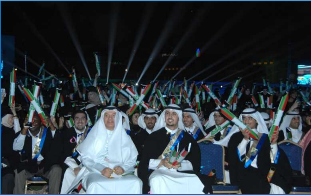
● الفرحة لانتع الخريجين