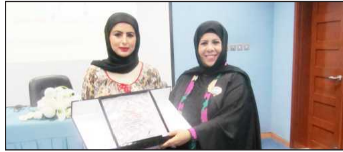
● توزيع الدروع التذكارية

الفريح: التجهيز المسبق قبل المقابلة الشخصية يزيد من فرص النجاح