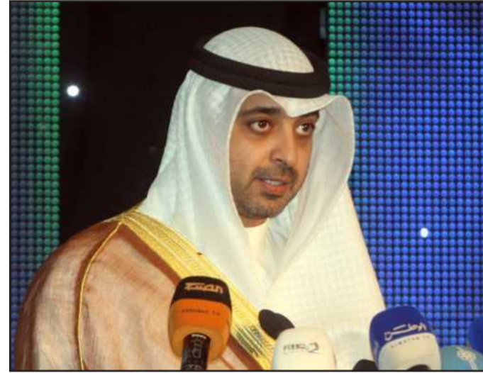
● الشيخ محمد عبدالله

وأكدت الجمعية حرصها على مصلحة أبنائنا الطلبة والحفاظ على حقهم في استكمال تحصيلهم العلمي والحصول على الشهادة الجامعية وما فوقها وأن يصلوا إلى أعلى مراتب العلم والتميز من أجل رفعة وطنهم الغالي الكويت، وأضافت من هذا المنطلق نجد لزاما علينا طرح الحلول التي من شأنها عدم انتقاص حقوق الطلبة وفي نفس الوقت ضمان الجودة والسمعة الأكاديمية لجامعة الكويت وضمان حصول الطلبة على تعليم نوعي متميز لا يتأثر بأزمة القبول الطلابي التي تعاني منها