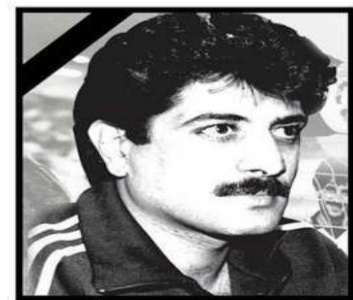
رحمك الله يا سمير وجعلك الله من السعداء

يعتزم قسم البحوث و الدراسات بإدارة الإرشاد الأكاديمي التابعة لعمادة شؤون الطلبة بجامعة الكويت، إقامة استطلاع الكتروني تأبيني للمرحوم بإذن الله تعالى سمير سعيد تحت شعار «حامي شباك الوطن» وذلك عبر موقع التواصل الاجتماعي @academic-ku يأتي هذا من منطلق تخليد ذكرى كابتن المنتخب الكويتي و فريق نادي العربي و لما قدمه لجامعة الكويت من المشاركات و ما قدمه للكويت، هذا و سيتم الاستطلاع التأبيني لمدة أسبوعين ابتداء من اليوم الأحد حتى ١٧ مايو الجاري . و دعا القسم جميع العاملين و طلبة جامعة الكويت للمشاركة في الاستطلاع الإلكتروني التأبيني .