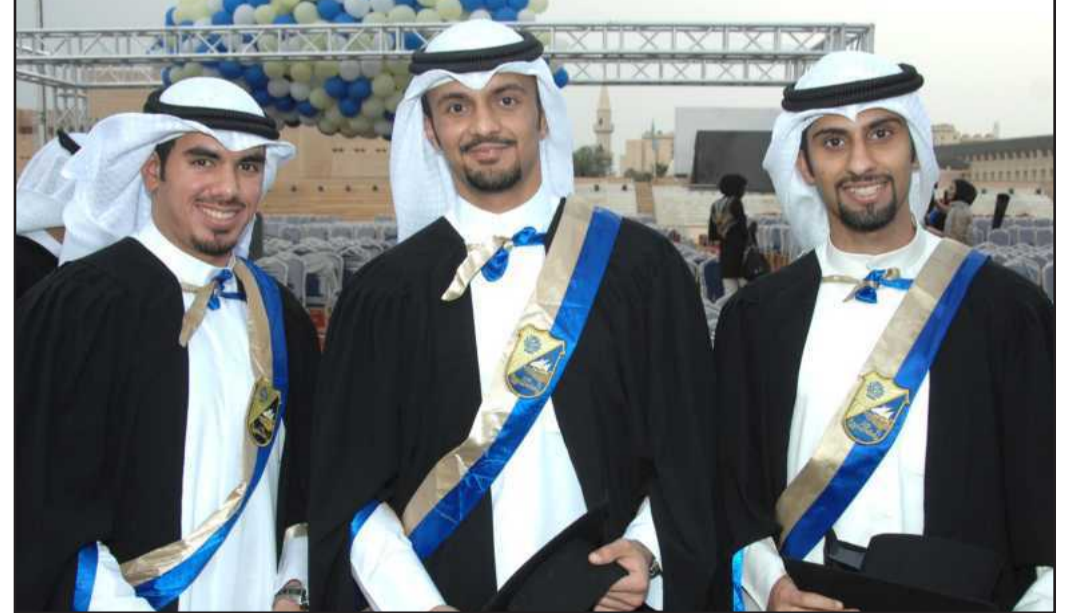
● نظرة للمستقبل