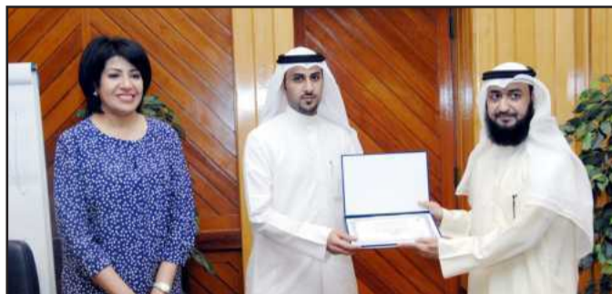
● تكريم أحد المشاركين