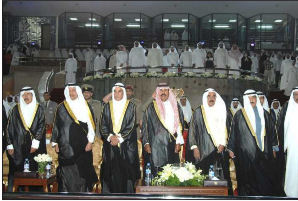
● أثناء عزف السلام الوطني