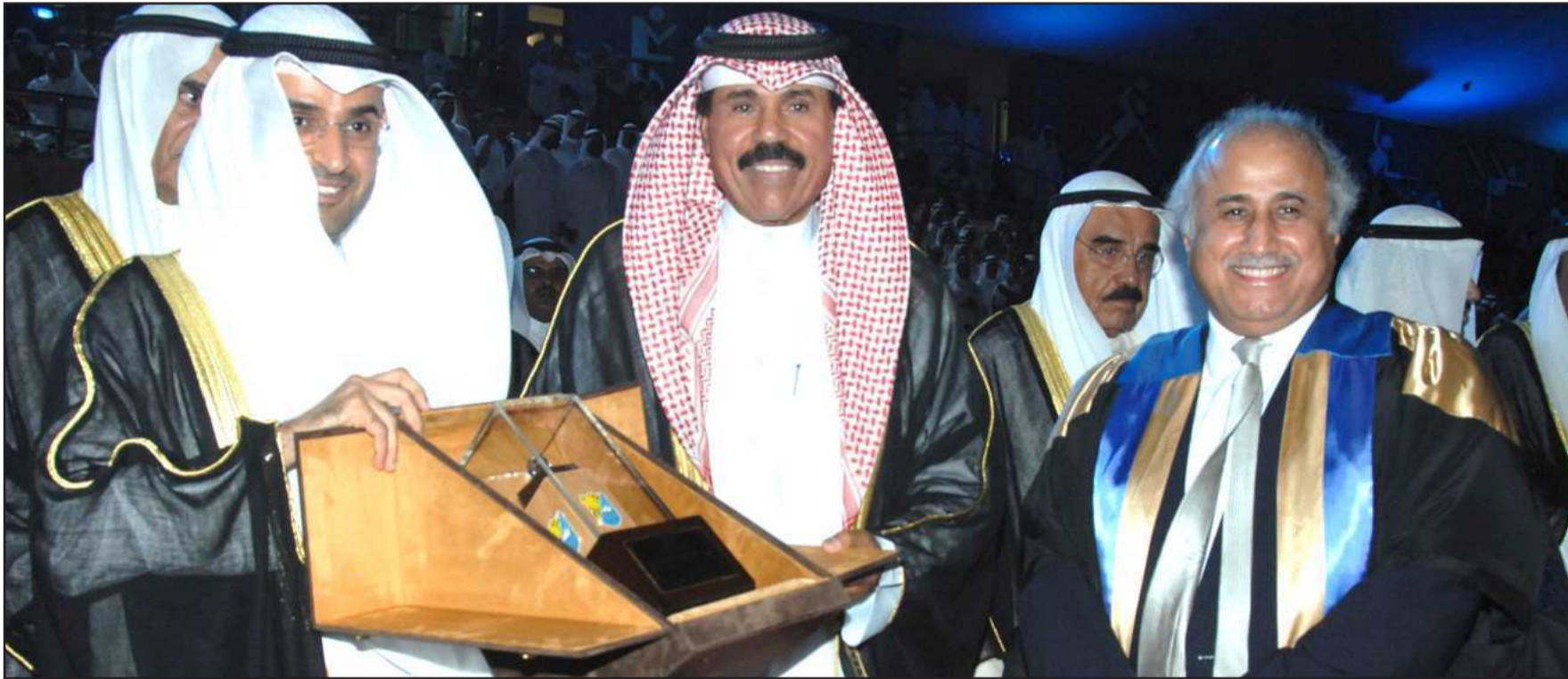
● وزير التربية ومدير الجامعة يقدمان هدية تذكارية لسمو ولي العهد

يسبغها الوطن من كافة قياديه ومسؤوليه على أبنائه في مختلف مراحل حياتهم وما يستوجب ذلك من تبعات وطنية ومسؤوليات مجتمعية تجعل العطاء الصادق للوطن ديناً مستحقاً والعمل الدائم والمثابرة المتواصلة فريضة واجبة».