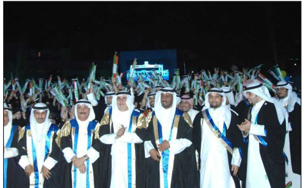
● خريجو كلية التربية