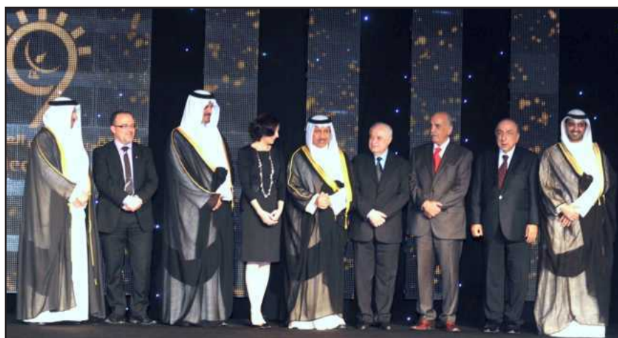
• سمو الشيخ جابر المبارك يتوسط بعض الضيوف