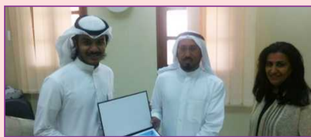
● تكريم رئيس إحدى الروابط

العصفور يغرد حينما يشاء وإنما داخل القفص» وكان الفيلسوف الفرنسي البير كامو يقول: «الصحافي هو مؤرخ اللحظة»، فهل يستوي تاريخ اللحظات على حدود القفص؟ وهذا السؤال انتم الأقدر على الإجابة عنه. بدوره استهل الأمين العام لهيئة الملتقى الإعلامي العربي كلمته بتقديم الشكر إلى أمير البلاد الشيخ صباح الأحمد على رعايته السامية للملتقى وحرص سموه على تمكين الشباب، وفتح أبواب الغد أمامهم، مرحبا بممثل راعي الحفل وزير الإعلام الشيخ محمد العبد الله، وضيوف دولة الكويت. وقال إن المتغيرات التي يشهدها عالمنا العربي، والتي ألقت بظلالها الكثيفة على العمل الإعلامي، تدفعنا لإعادة النظر في الممارسة الإعلامية وارتباطها الوثيق بما يشهده العالم من فوران تكنولوجي، بالإضافة إلى انعكاسات المشهد السياسي العربي، والتحديات التي يحملها المستقبل، ولكننا مؤمنون بقدراتنا، وقدرة شبابنا الذين لمسنا إبداعاتهم، وطاقاتهم، وافتاحتهم على العالم، بأنفسنا.