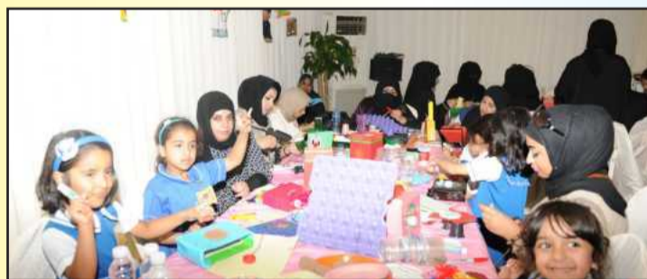
● جانب من الورشة