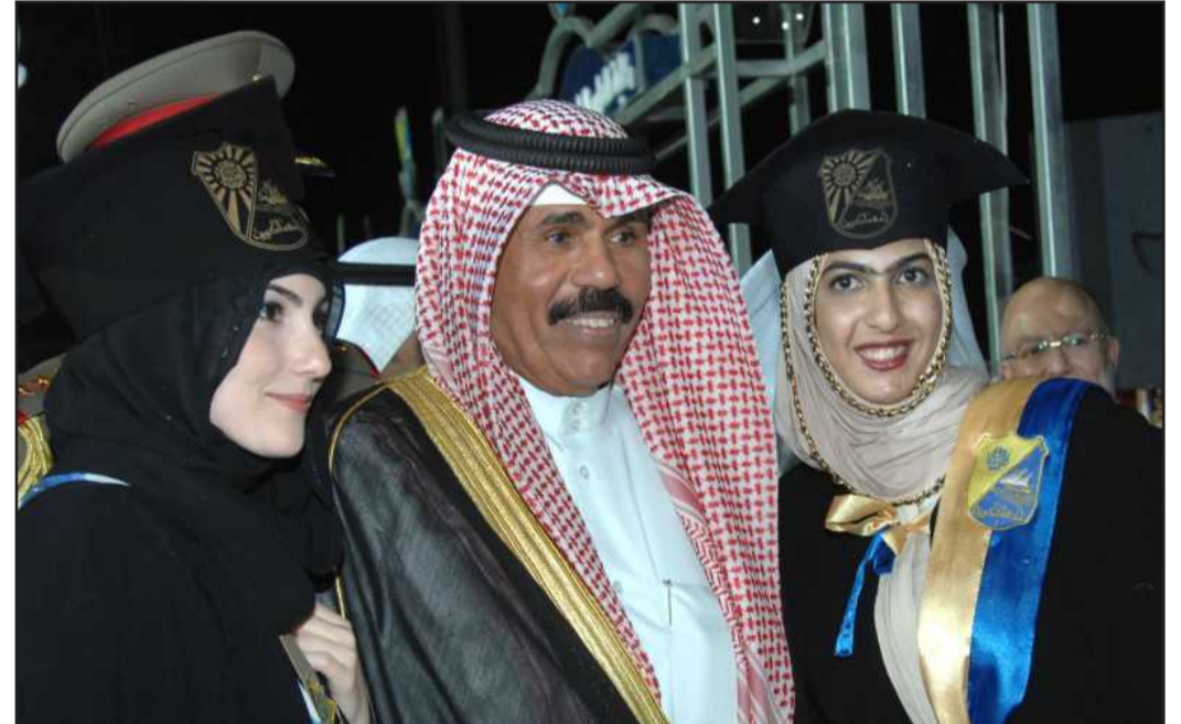
● سمو ولي العهد يتوسط خريجتين