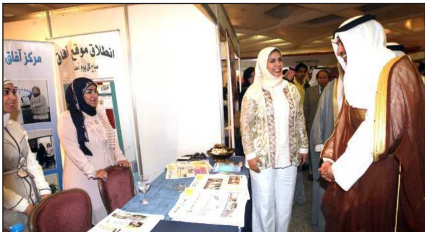
• وزير الإعلام متفقدنا جناح آفاق

الخميس: لا مستقبل بلا شباب مؤهل قادر على الإبداع