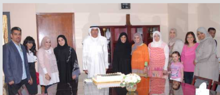
● لقطة جماعية

كتبت بتول بولند: نظمت إدارة الإرشاد الأكاديمي في عمادة شؤون الطلبة بالجامعة بالتعاون مع مكتب العلاقات العامة لكلية العلوم في الخالدية رحلة لطالبات ثانوية لطيفة الشمالي - بنات إلى كلية العلوم بالخالدية الأحد الماضي وذلك مع نخبة من موظفات عمادة شؤون الطلبة وموظفات قسم العلاقات العامة في كلية العلوم في الخالدية. وقد تخلل هذه الزيارة التجول في مرافق كلية العلوم ومشاهدة ما تحتويه من أقسام وتخصصات مختلفة بمساعدة من موظفي كلية العلوم الذين قاموا بدورهم بتعريف الطالبات على المجسمات التوضيحية والاستعانة بشاشات العرض وغيرها. وفي الختام تهدف الجامعة من هذه الزيارة بتعريف الطالبات على التخصصات المتاحة لهم في كلية العلوم لاختيار المجال المناسب لهم..