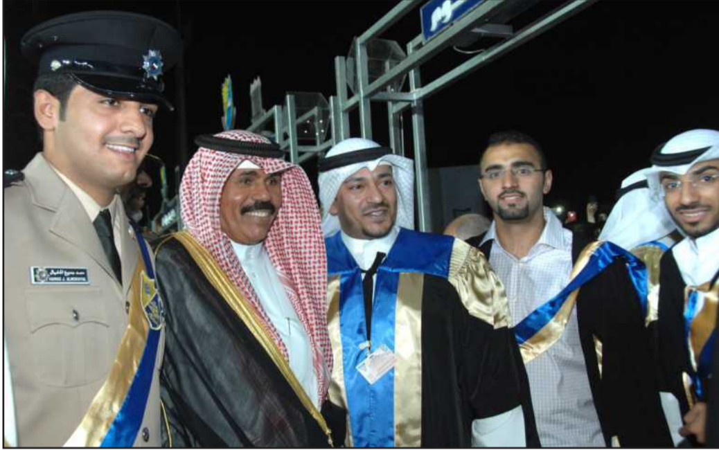
● .. والخريجين ايضا