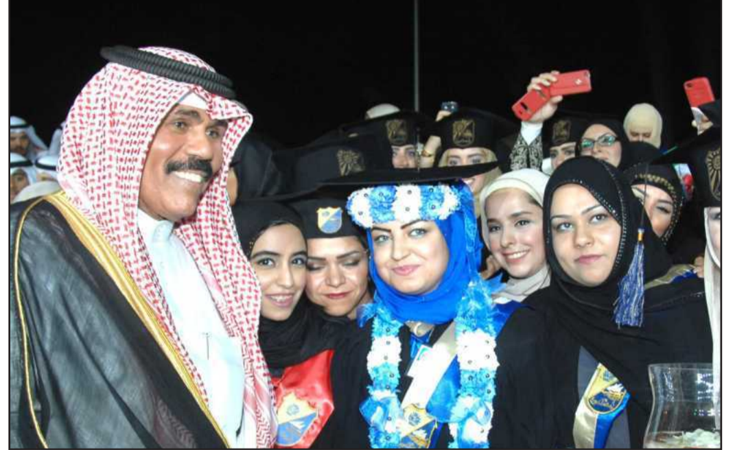
● خريجات مع سمو الشيخ نواف الأحمد