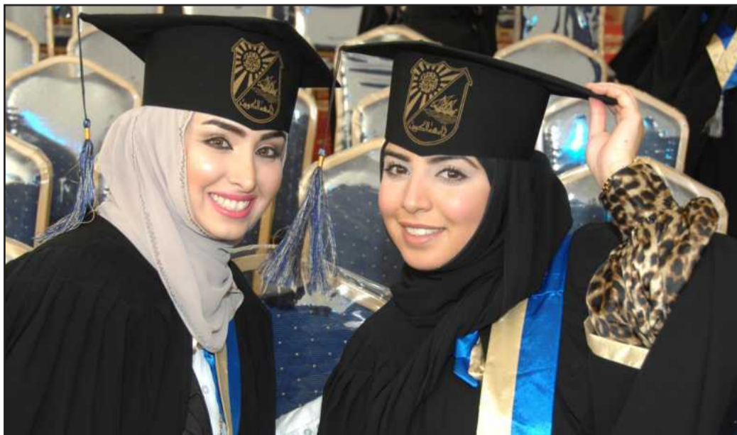
● ابتسامة للكاميرا