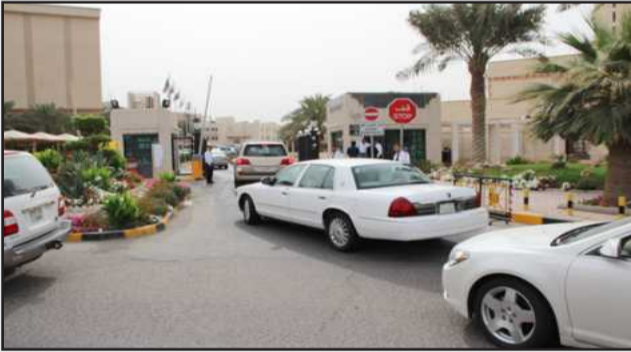
● تنظيم الدخول في موقع الخالدية

قامت إدارة الأمن والسلامة بنقل وتأمين اختبارات القدرات الأكاديمية التي أجريت لطلاب وطالبات المدارس الثانوية السبت قبل الماضي وذلك من خلال التعاون والتنسيق مع مركز التقييم والقياس . فقد خاطبت وزارة الداخلية ونسقت معهم لتوفير دوريات مرور لتنظيم حركة السير في الشوارع المحيطة والمؤدية لمواقع الجامعة التي أجريت فيها الاختبارات ( الخالدية - الشويخ - كيفان ) .