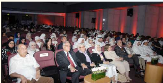
● حضور كثيف