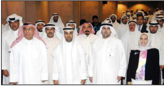
وزير التربية وعميد شؤون الطلبة وعميدة الآداب

فاطمة الفرحان في المدة الزمنية ذاتها، تلاها المتحدث الثاني من فريق الموالة «أحمد النويبي» للرد على خطاب الفريق المنافس، ومن ثم جاء المتحدث الثالث من فريق الموالة «عبدالله الصباح» الحجج والبراهين التي تم طرحها من قبل الفرق، وأخيرا المتحدث الثالث من فريق المعارضة «نورة النوس» لتشرح أيضا حجج وبراهين فريقها المعارض، وقد ألقى خطاب الرد كل من «عبدالعزیز ذياب» و «دلال الكنيشم» في ثلاث دقائق راجين بقدر المستطاع إقناع لجنة التحكيم بحججهم وبراهينهم للفوز بالمركز الأول في مناظرات جامعة الكويت ٢٠١١-٢٠١٢، استمرت بعدها فعاليات الحفل إلى تقوم لجنة التحكيم باختيار الفريق الفائز، ومن الجدير بالذكر أن اختيار لجنة التحكيم تمت بناء على الخبرة والثقافة والمؤهلات من موظفي وموظفات جامعة الكويت بمختلف كلياتها وإداراتها، في هذا الوقت قدم طالب كلية الحقوق المشارك في برنامج شاعر المليون ماجد الديحاني فقرة شعرية متميزة، تلتها مشاركة موسيقية للطلاب متعب الفضلي أمتع بها الحضور، إلى أن جاءت اللحظة الحاسمة التي أعلن بها المشرف العام نبيل المفرح الفريق الفائز بدوري مناظرات جامعة الكويت وهو فريق طلاب كلية العلوم الاجتماعية، وفي ختام الحفل قام وزير التربية ووزير التعليم العالي د. نايف الحجرف وعميد شؤون الطلبة د. عبدالرحيم ذياب بتكريم كل من ساهم في إنجاح هذه الفعالية الثقافية.