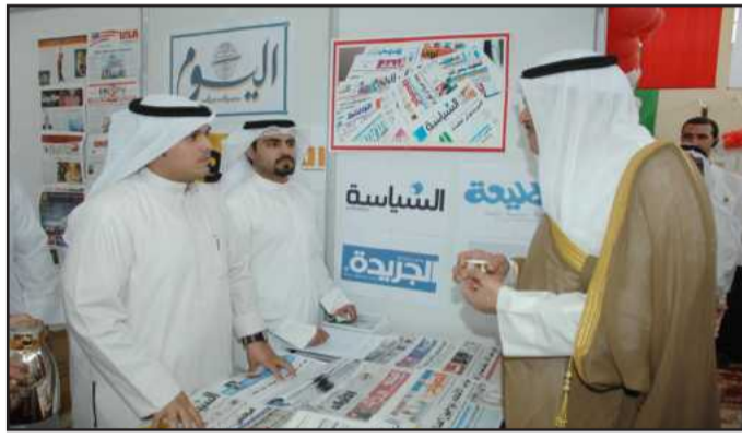
●... و يزور جناح احدى الصحف