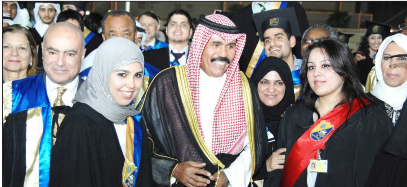
سموه مع بناته الخريجات في حفل سابق