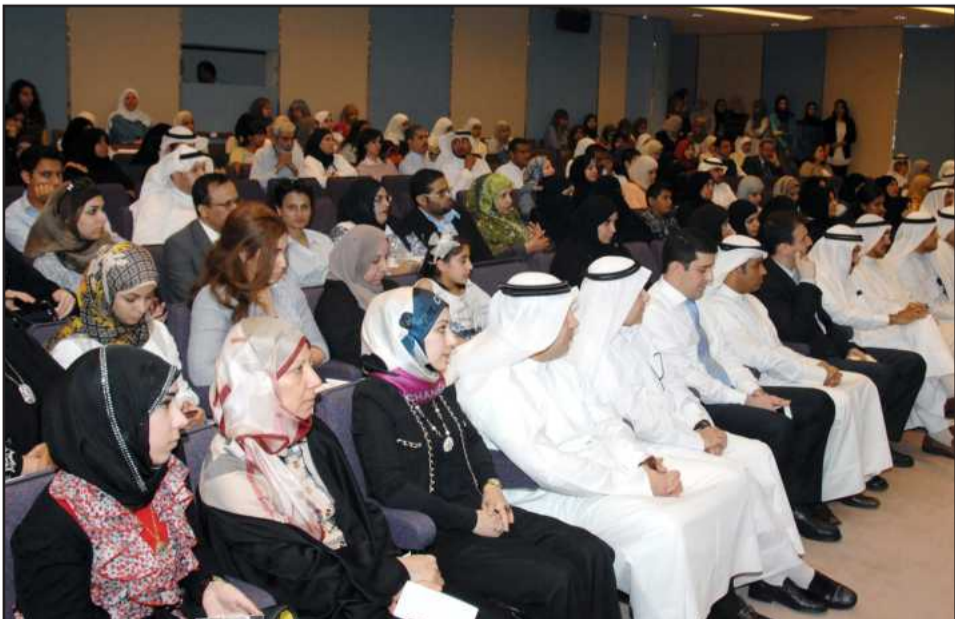
● جانب من الحضور

المنال أو كلمة تقال بل جهد ومثابرة وتعب ومشقة، هو سباق محموم مشحون بالمنافسة ظهرت نتيجته اليوم الذي نفخر به بتميزنا بفضل من المولى عز وجل ثم بفضل جهود أساتذتنا الكرام الذين ذللوا لنا العقبات من أجل أن نصل ونواصل السير في درب النجاح والتفوق، وأيضا لأمهاتنا وأبائنا الذين كانوا لنا خير عون في الحياة وما التفوق اليوم إلا ثمرة جهدهم واهتمامهم، فشكرا لهم جميعا من القلب وعسى ان يسدد خطاهم ويجعل جهودهم في ميزان أعمالهم حسنة».