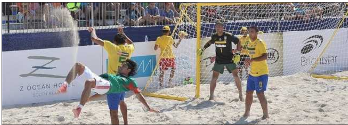
● سقوط على الرمال

إلا أن نجوم السامبا استدرکوا ما ضاع منهم في النسخة الأولى، حيث أحرزوا اللقب العالمي في بطولة العام التالي، والتي شهدت مشاركة ١٦ منتخباً لأول مرة في تاريخ المسابقة. وفازت البرازيل بكل سهولة على منتخب أوروغواي في المباراة النهائية، لتحمل أول لقب كأس العالم FIFA لكرة القدم الشاطئية في تاريخها، بعدما كانت قد توجت فيما قبل بطلاً للعالم قبل انضمام اللعبة إلى لواء الاتحاد الدولي.