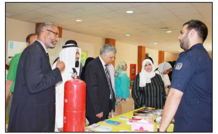
● .. و يطلع على إحدى المطبوعات

الأفراد ذوو النشاط البيئي والمهتمين بتحسين والحفاظ على بيئتنا المحلية، وشكر د. السندي جميع الجهات على جهودها على رأسهم الهيئة العامة للزراعة والثروة السمكية، الهيئة العامة للبيئة، معهد الكويت للأبحاث العلمية، فريق الغوص الكويتي، شركة الخليج لصناعة الورق، جمعية المهندسين، شركة KOC، وشركة KNPC، والإدارة العامة للإطفاء، مشروع مليون نخلة، شركة عالم البيئة، والفنانة