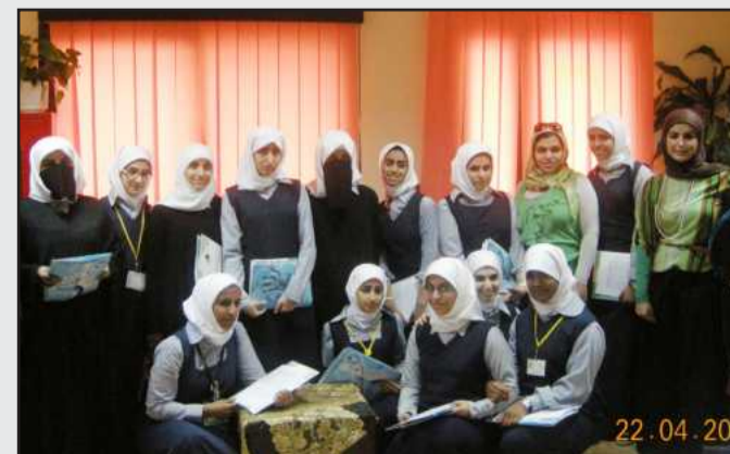
● .. ولقطة تذكارية