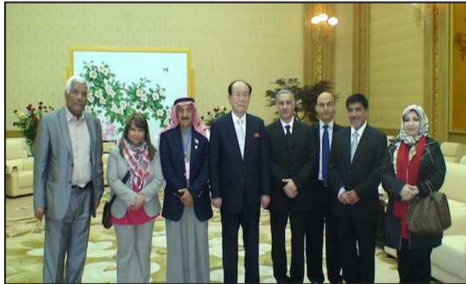
... و يتوسط وفد الكلية