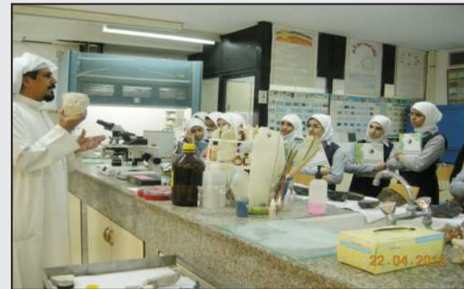
● الطالبات في أحد المختبرات