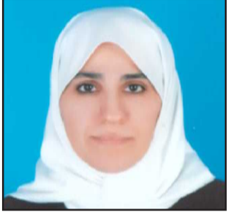
● اعتماد الكندري

تحت شعار « تكنولوجيا التعليم .. خطوات نحو المستقبل »