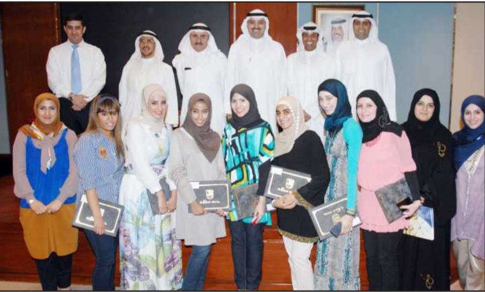
● لحظة تذكارية