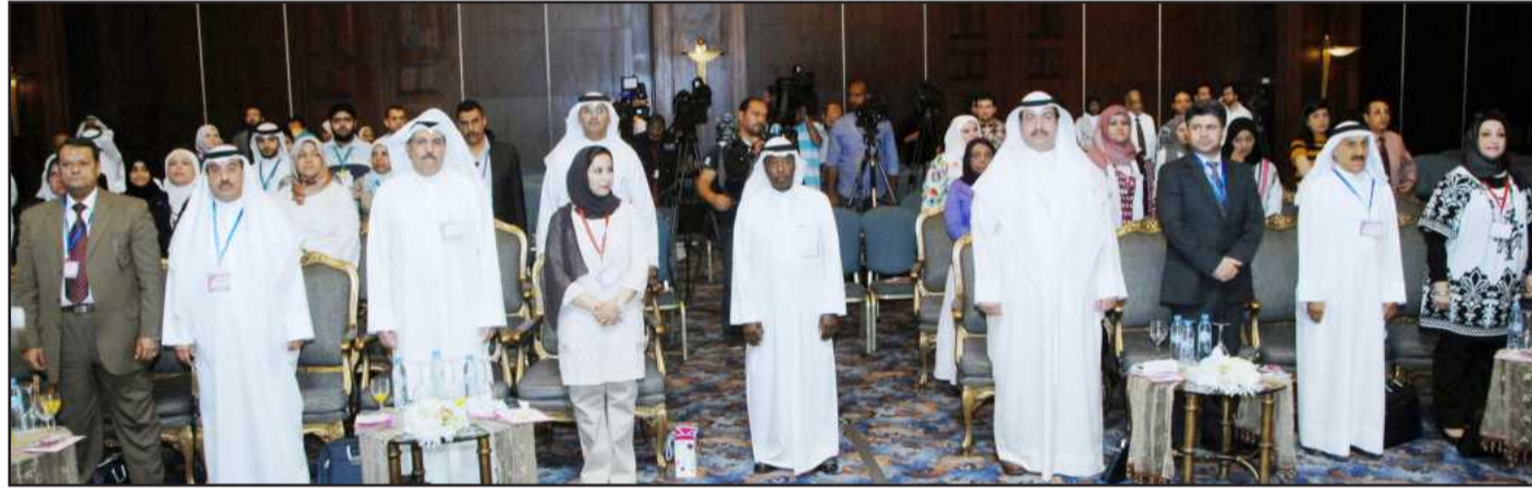
الحضور أثناء عزف السلام الوطني

أسيري: المؤتمر له أبعاد تشمل التوعية الثقافية ودعاماتها في المجتمع