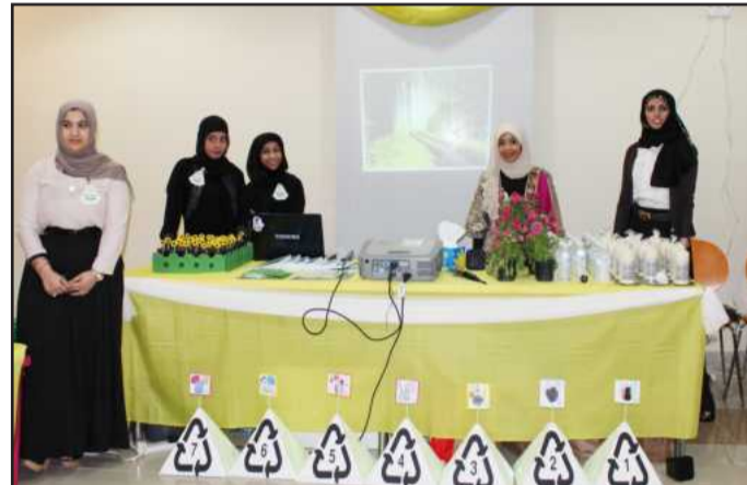
● عرض تقديمي حول البيئة