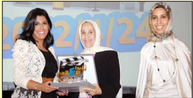
●... و تكرم متميزة