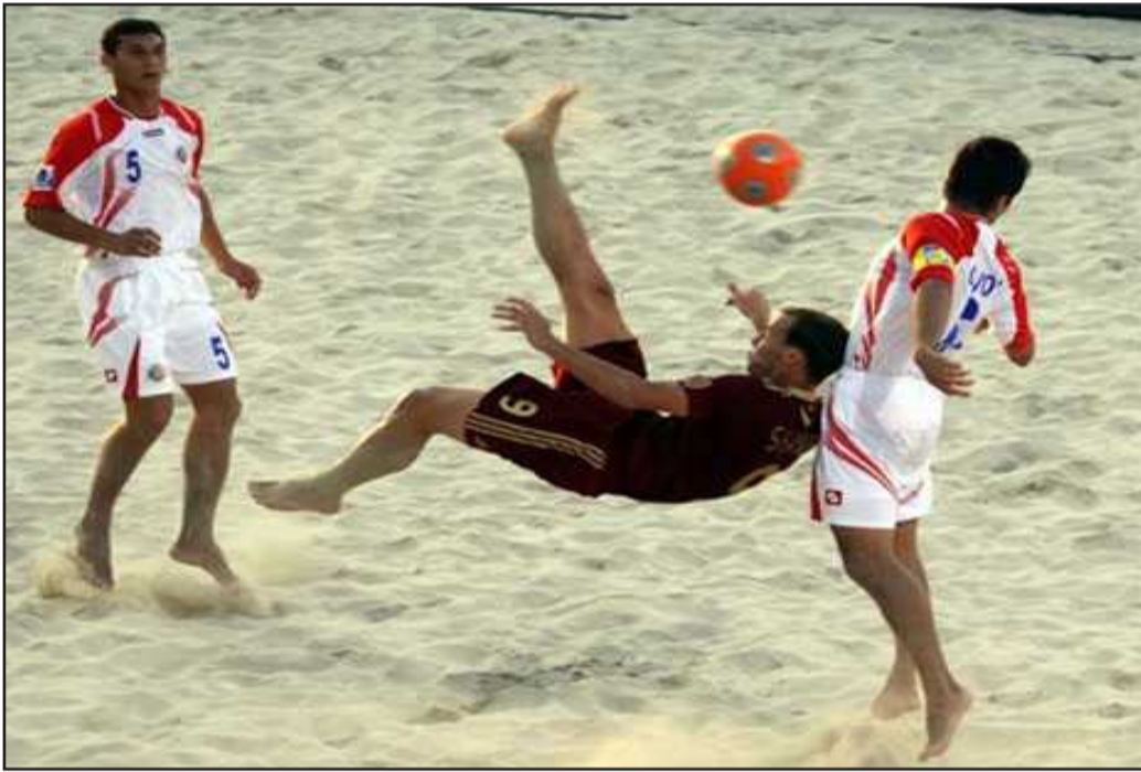
● استعراض بـ «دبل كيك»