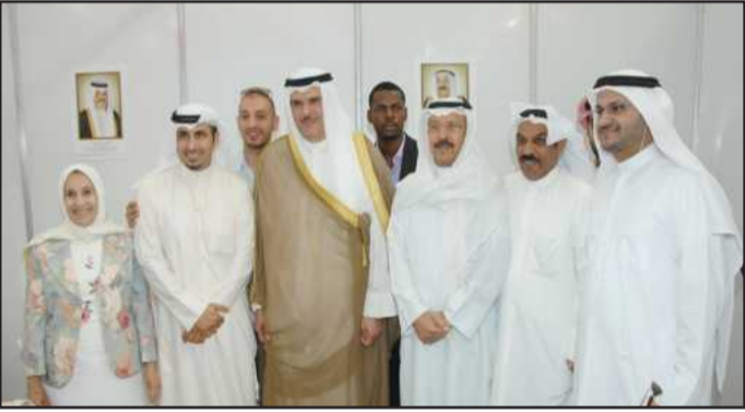
● لقطه تذكارية

على تنظيم معرض الإعلام الخليجي في جامعة الكويت، وعلى رأسهم وزير التربية ووزير التعليم العالي د. نايف الحجرف، ومدير جامعة الكويت أ.د. عبداللطيف البدر، وعميد كلية الآداب أ.د. حياة الحجي، والشكر موصول لطلبة قسم الإعلام بجامعة الكويت، متمنياً أن يكونوا في محل تحمل المسؤولية المستقبلية في دعم المؤسسات الإعلامية بدولة الكويت، وتقديم بالشكر الجزيل لكل من ساهم في تنظيم هذا الحدث الإعلامي المهم الذي يسعى لدعم الإعلام الخليجي.