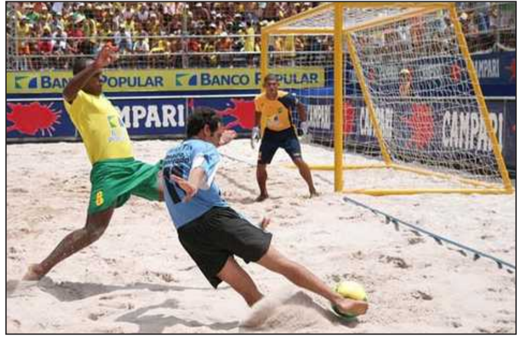
● هجمة علي المرمى

الدولي، إذ خرج إلى الوجود ١٧ منتخباً وطنياً خلال سنة ٢٠٠٤، فيما وصل عدد الفرق القومية إلى ٢٠ فريق في عام ٢٠٠٥، علماً أن أكثر من ٧٠ دولة أبدت رغبتها في استضافة بطولات دولية.