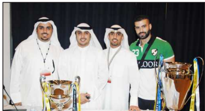
طلبة العلوم الاجتماعية

كتبت إسراء الكندري : فاز فريق طلاب كلية العلوم الاجتماعية على طالبات كلية الحقوق في المنافسة النهائية لدوري مناظرات الجامعة الذي انعقدت منافسته النهائية الأحد الماضي تحت رعاية وحضور وزير التربية ووزير التعليم العالي الرئيس الأعلى للجامعة د. نايف فلاح الحجرف، ونظمتها عمادة شؤون الطلبة بالجامعة. وقال مساعد عميد شؤون الطلبة ورئيس اللجنة العليا للمناظرات د. علي سيف النامي: إن الهدف من تنظيم دوري مناظرات كليات جامعة الكويت يكمن في ممارسة فن الحوار في إطار ثقافي بين طلاب وطالبات جامعة الكويت والاستماع لوجهات النظر حول القضايا المختلفة باستخدام الحجج والبراهين المنطقية، مشيراً إلى أن دور الجامعة في أي مجتمع هو تقديم كل ما هو إيجابي لخدمة الوطن، مؤكدا أهمية المناظرات في تشجيع الطلبة على العمل الجماعي حيث أنه الفريق الواحد يتكون من ثلاثة طلبة، بالإضافة إلى تحفيز سبل الإقناع والاستماع إلى الرأي المعارض وتشجيع ثقافة الحوار من خلال استخدام الحجج والبيينة والإقناع والإنصات للرأي الآخر المعارض من خلال مناظرة علمية بين فريقين يتكون كل منهما من ثلاثة أشخاص يتحاورون في مواضيع علمية تهم المجتمع. وذكر د. النامي أن الدور التمهيدي لهذه المناظرات كشف مدى الحماس بين الطلبة في مثل هذه الأنشطة الإيجابية مما يجعل عمادة شؤون الطلبة تعد العدة للمستقبل لأنشطة مماثلة في الأعوام