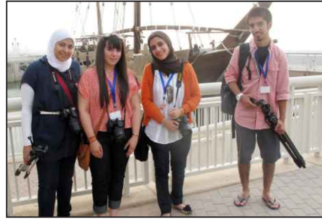
● لحظة تذكارية

الدورة الصيفية ٣٤ بالهندسة اشتملت على ٥ ورش عمل