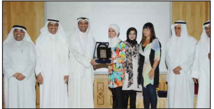
● تكريم موظفة متميزة

عليها الأمانة العامة بالجامعة لتكريم المتميزين الذين عبروا بصديق عن حبهم لجامعتهم من خلال التزامهم وعطائهم اللا محدود لتحقيق الرسالة الجامعية بتطوير العنصر البشري واستثماره والإيمان بروح العمل الجماعي من أجل نجاح المؤسسة التي ننتمي إليها.