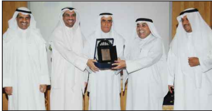
● تكريم إدارة العلاقات العامة والإعلام