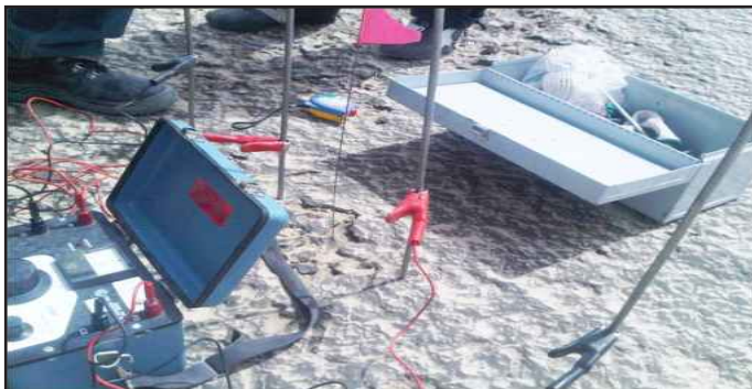
● أجهزة قياس تلوث التربة