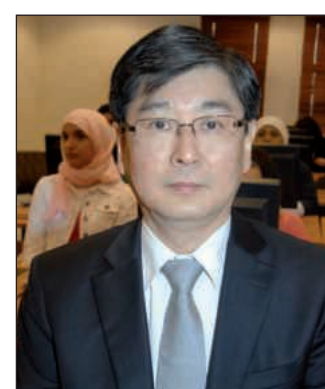
● السفير الكوري