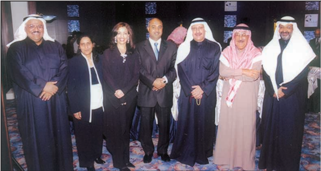
● مع الادارة العليا لبيت الاستثمار العالمي

الفائز في حق الطرف الخاسر ! ورغم ان هذا هو الصراع الظاهر للعيان الشيوعي - البعثي فإن كان هناك صراع اخر خفي كنت أئس في حلقات الانصار هو حرص البعثيين على التأكيد على مطالب عبدالناصر وتضخيم أخطائه والقول انه ليس القائد الذي يعول عليه .. صراع بدأ خفيا وسرعان ما ظهر للعيان واعلن عنه مع واقعة انفصال الوحدة بين مصر وسورية والذي كان الحزب احد اطرافها . كان الحدث الفارق بالنسبة لعلاقتي بهذه الحلقة مطالبة عبدالكريم قاسم بضم الكويت الى العراق ووقفه ضد انضمامها الى الامم المتحدة بتأييد من الاتحاد السوفياتي اذ كان رفضه لانضمامها الى جامعة الدول العربية ايضا وقد ايدت بعض الدول العربية مجاملة للعراق ! وبعودتي الى بريطانيا قمنا - كرابطة للطلبة الكويتيين - بحضور اجتماع رابطة الطلبة العرب التي كانت تضم الاتحادات والروابط العربية في بريطانيا وكان يسيطر فيها