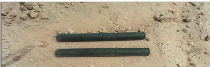
● قذيفتان في مدينة صباح السالم الجامعية