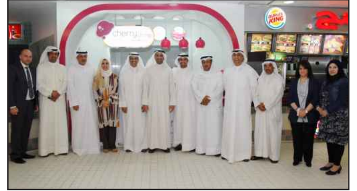
● لحظة تذكارية