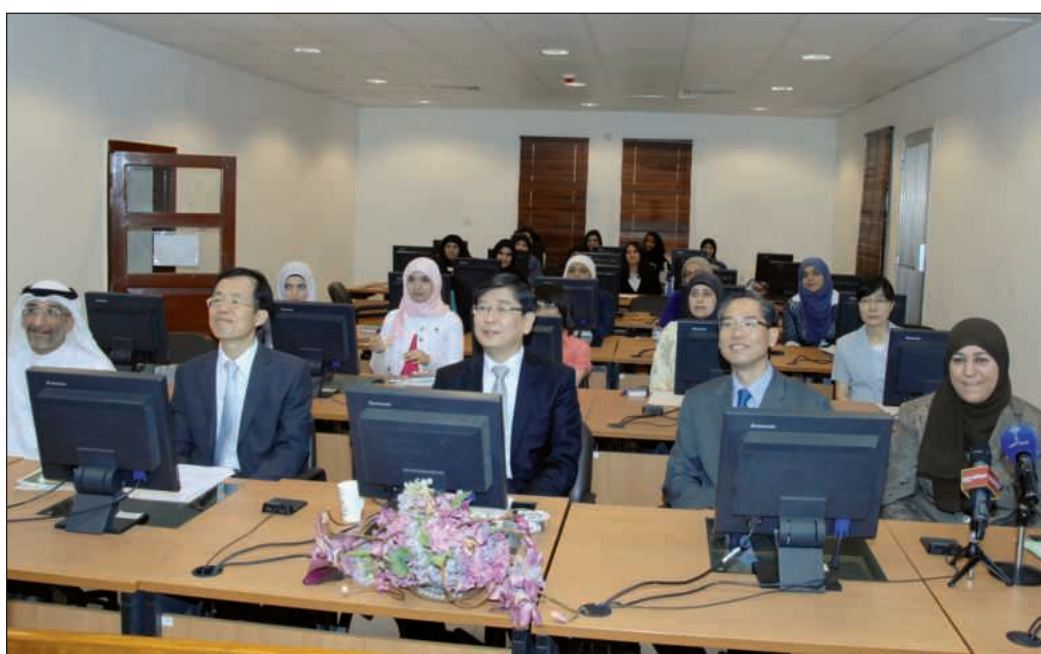
● جانب من الحضور