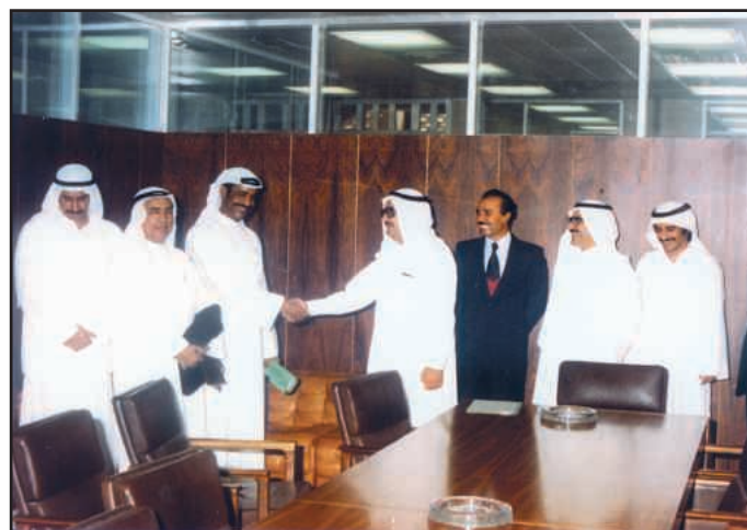
● عندما تم توقيع عقد تأسيس إنشاء شركة الاستثمارات الصناعية

كنت تواقا للعودة إلى بريطانيا لأبدأ مرحلة جديدة من حياتي