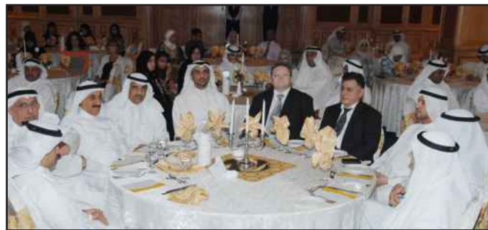
● قيادي الجامعة

وزيادة القدرة الاستيعابية للتسجيل في هذا النظام . كما تم إنشاء قسم النشر الإلكتروني بإدارة العلاقات العامة والإعلام لاستخدام التكنولوجيا ، وتفعيل موقع الجامعة والبريد الإلكتروني . وأضاف : « في عام ٢٠١٠ بدأنا نقطف ثمرات النظام الإداري وهو نظام التوظيف عن طريق الإنترنت ، وتعيين السنوي عن طريق الإنترنت ، وتعيين ذوي الاحتياجات الخاصة بالجامعة » . وفي عام ٢٠١١ بدأنا في الخدمة الذاتية لموظفي الجامعة ، وتطبيق نظام الإجازات عن طريق الإنترنت ، أما عن المشاريع الجاري تطبيقها حالياً بالجامعة فهو