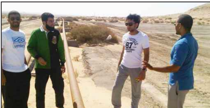
● أعضاء الفريق في الميدان

المشروع دراسة لتحديد الأعماق الملوثة بالتربة بفعالية وسرعة من دون الإضرار بالبيئة