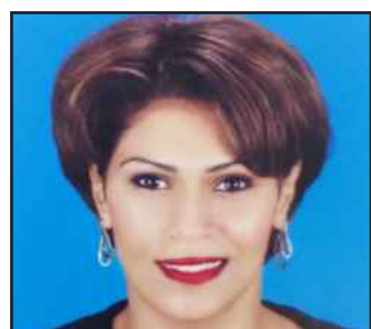
● ربوع الفهد

الأنشطة الرياضية وقلة الوعي الرياضي لدى بعض الطالبات وعدم توفر مدرّبات لبعض الألعاب الرياضية وعدم توفر أجهزة رياضية متنوعة هي أبرز المشاكل والعقبات التي تواجه مشرفة الأنشطة الرياضية والطالبات الراغبات في المشاركة في الأنشطة