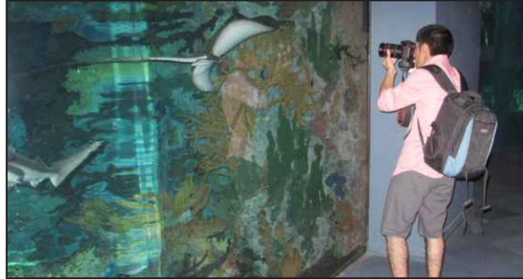
● اندماج خلال التصوير

كما ادعو من الله سبحانه ان يكون هناك أصحاب القلوب البيضاء الناصعة التي لا تحمل الحقد والضغينة على الآخرين وتصفية الحسابات وتكيد الكيد ، وإنما التسامح والحب هو الأقوى والله يحب المؤمن القوي الذي يغفر ما بداخله ولا يحب المؤمن الضعيف الذي يخزن الكراهية والانتقام من الآخرين . وأرجو ان تكون هناك نظرة الاحترام والحب والعرفان للآخرين من الوفاء والاحترام للمقام الذي يستحقه دون نكران لذات الآخرين . ومهما اختلفنا سيبقى الحب بيننا