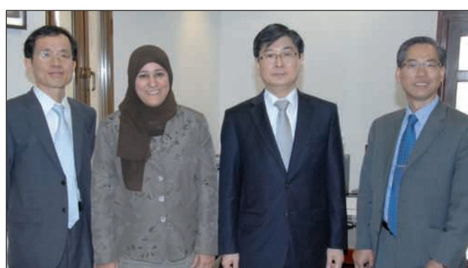
● لقطة تذكارية