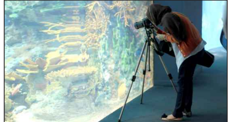
● تركيز على الإكواريوم