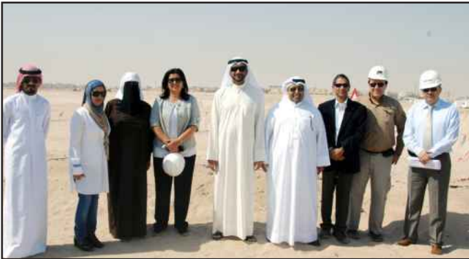
● أمين عام الجامعة يتوسط فريق العمل