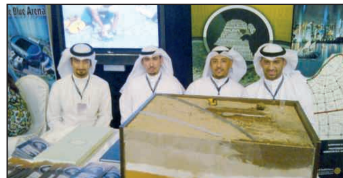
● فريق العمل