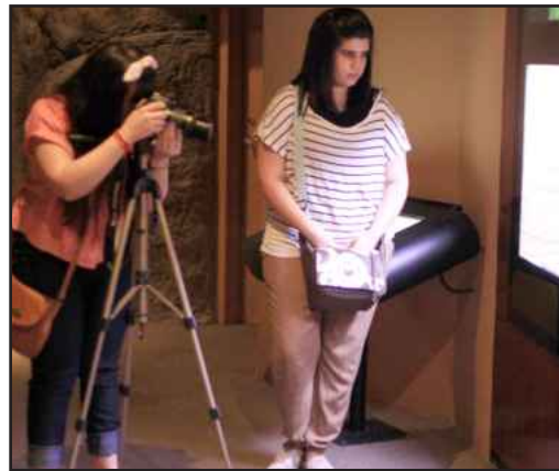
● طالبتان أثناء التصوير