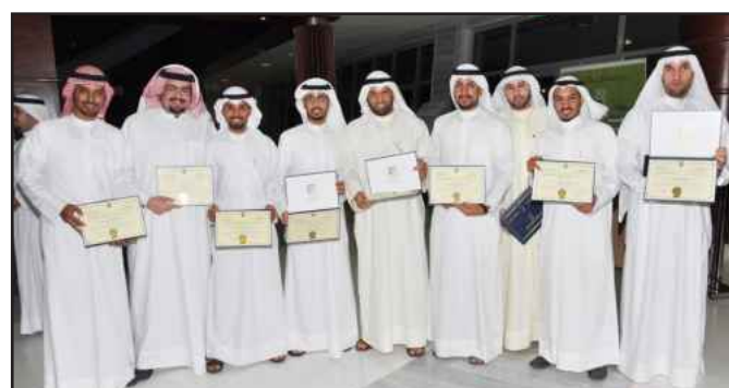
● المهندسون في لقطة جماعية