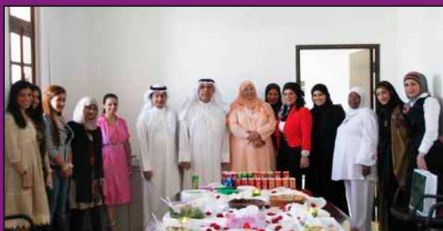
● د. ذباب و د. النامي بتوسطان موظفات العمادة