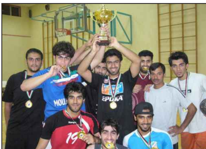
● فریق طلابی فائز