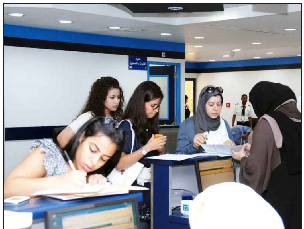
● تعبئة استمارة التسجيل لخريجي المدارس الانجليزية و الأمريكية