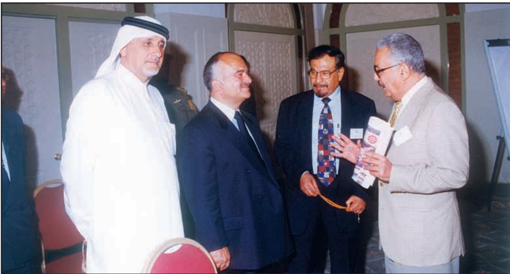
● مع سمو الأمير الحسن بن طلال رئيس في منتدى الفكر العربي عمان - الأردن

رحلة العودة إلى ريكسم بعد شهر بالكويت حفلت بالتنقل وزياره أماكن لم أشاهدها من قبل بدءا من القاهرة