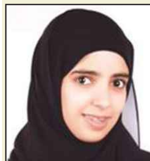
● مها بورحمة

فاز عضو هيئة التدريس بقسم الإدارة و التسويق بكلية العلوم الإدارية بجامعة الكويت أ.د. محمود الجمل بجائزة البحث المتميز في المؤتمر الذي نظمه معهد الأبحاث الإدارية و المالية في كوستاريكا خلال شهر مايو ٢٠١١ ، حيث قدم الدكتور الجمل بحثا بعنوان ( أنماط القيادة التنظيمية : ظاهرة صعود القيادات النسائية ) و قد شملت عينة البحث قيادات من دولة الكويت ، جمهورية مصر العربية و الجمهورية التونسية و أفاد بان البحث ممول من قبل جامعة الكويت . أشارت نتائج الدراسة إلى وجود درجة ثقة عالية لدى القيادات العربيات في قدرتهن على التمييز و تحقيق النتائج التنظيمية ، كما أوضحنت النتائج قدرة القيادات على استخدام أنماط قيادية مختلفة من بينها قيادة الصفقات و القيادة التحويلية و الاهتمام بالعمل و بالناس و القيادة القائمة على الرعاية