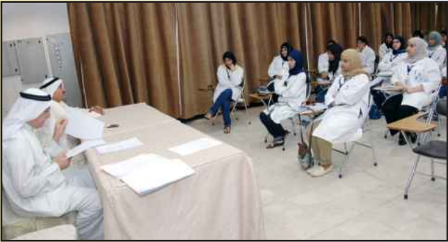
● متابعة من الحضور