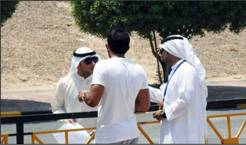
● اجابة عن استفسار