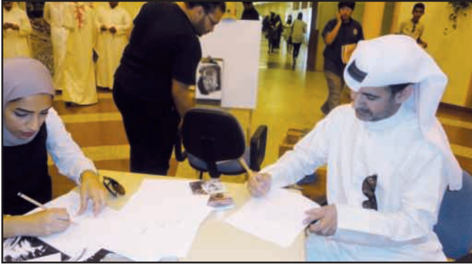
● التدريب على رسم البورتريه