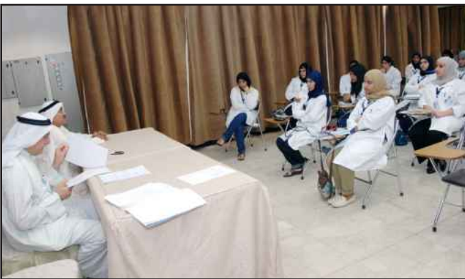
● جانب من إحدى المحاضرات