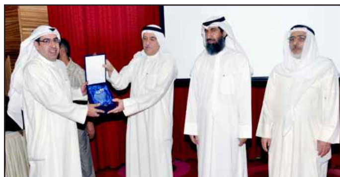
● توزيع الدروع التذكارية

وأكدت على حرص كلية الهندسة والبتترول على إبقاء المهندسين المتدربين على قمة هرم المعلومات المعاصرة كل في مجاله، بالإضافة إلى تزويدهم بآدوات التواصل التي يحتاجونها لإدارة تلك المهام، مشيرة إلى أن المهندس الذي اجتاز هذا البرنامج أصبح ملماً بدرجة عالية وحسب طبيعة عمله بالمهارات اللازمة لنظم تصميم وتشغيل محطات تحلية المياه ووحداتها الأساسية وكذلك شبكات المياه والتوزيع والنقل الكهربائية.