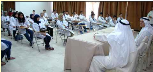
● جانب من احدى المحاضرات