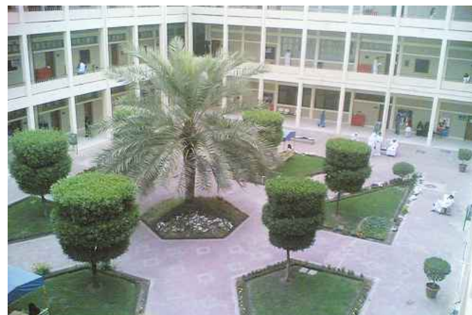
● حديقة الكلية