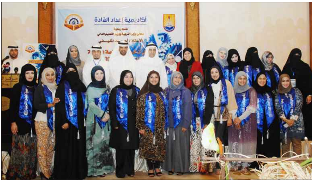
● لقطة جماعية للخريجات مع الوزير