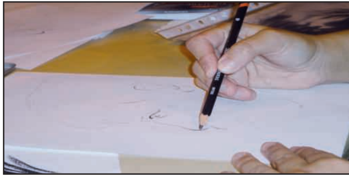
● رسم لوحة بالقلم الرصاص