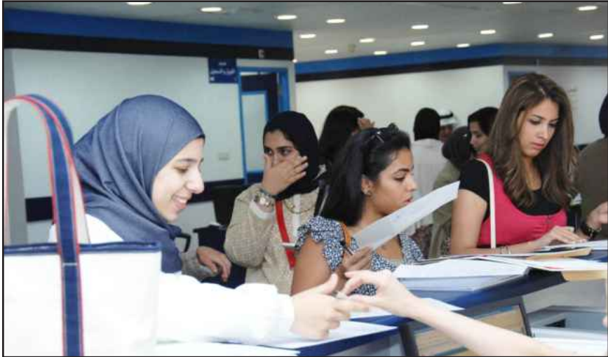
● مبروك القبول

لتلقي كافة استفسارات الطلبة حول آلية القبول الجامعي . وأكد الياقوت أن إدارة الأمن والسلامة قامت بزيادة أعداد المشرفين وموظفي الأمن بالحرم الجامعي بالشويخ ، موضحاً أن هناك تقارير ترفع للإدارة الجامعية بين فترة وأخرى عن الوضع الخارجي لعملية القبول والتسجيل ، لتدارك حدوث أي فوضى فيما بين الطلبة والموظفين ، مضيفاً إلى أنه تم استدعاء عيادة خاصة بما فيها الطاقم وغرفة لحالات الطوارئ الطبية ، وتوفير سيارة إسعاف بالتعاون مع وزارة الصحة .