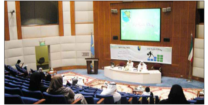
● ورقة اتحاد الطلبة حول التعثر الدراسي والحلول

دور مكاتب التوجيه والإرشاد للحد من ظاهرة التعثر الدراسي والتوصيات وقد أدار الجلسة د. عيسى الظفيري مدير إدارة الإرشاد الأكاديمي بمشاركة عدد من مكاتب التوجيه والإرشاد بورقات عمل واطروحات أثرت الحلقة .