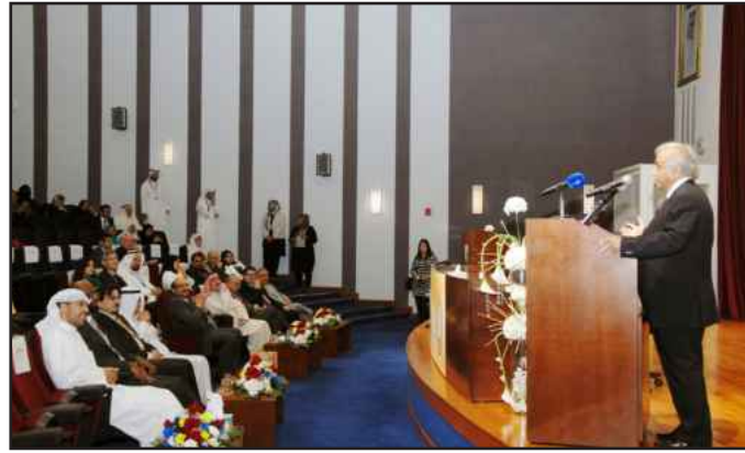
● أ.د. عبداللطيف البدر متحدثا