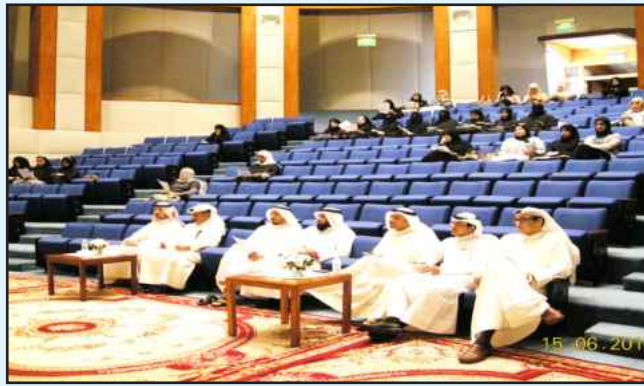
● جانب من الحضور