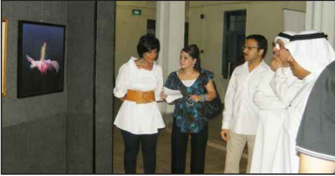
● إحدى المشاركات تشرح مفهوم لوحاتها

محمد شداد : مركز ثقافي وفني شامل يجمع كافة المراكز في الجامعة