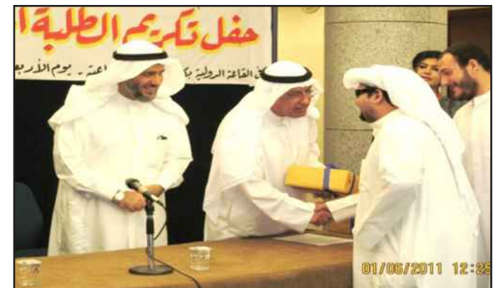
حديث ودي مع احد المتفوقين