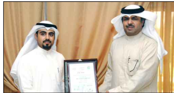
● تكريم أحد الإعلاميين