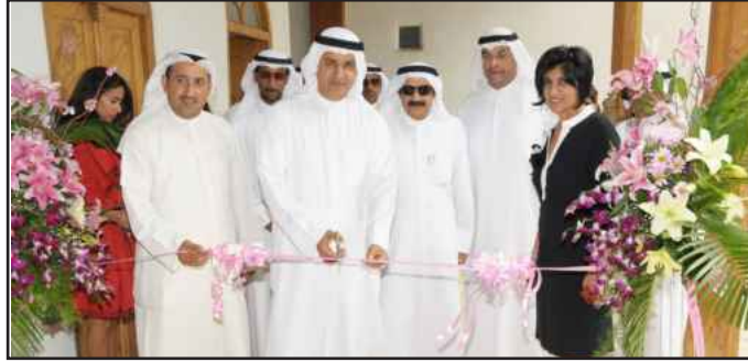
● اليوحة مفتتحة المعرض

الوطني للثقافة والفنون والآداب الذي يؤكد على دعمهم للمواهب الطلابية وتشجيعهم على عرض أعمالهم في الرسم الحر وشكرت المقلد جميع من أتاح الفرصة لطالبات المرسوم بالمشاركة وإبراز أعماله إضافة إلى