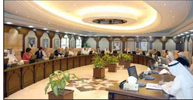
• جانب من الورشة