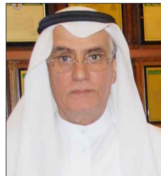
● د. حسين المحمود

موك « إن فكرة البث المباشر لدورة اللغة الكورية لغير الناطقين بها هي فكرة مميزة ومهمة بالفعل في نشر وتوصيل الثقافة الكورية إلى المجتمع الكويتي ، واني أتوقع الكثير من هذا الانجاز لعمادة خدمة المجتمع وأطمح بالفعل بأن يتم اعتمادها كمقرر أساسي يدرس في جامعة الكويت في المستقبل » ووجه القنصل الدعوة للمهتمين بالثقافة الكورية للحضور والمشاركة في هذه الدورة المميزة لأنها فعلا تجربة مميزة وفريدة .