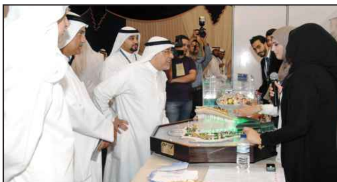
● أمام محسم لإحد المشارع الهندسة