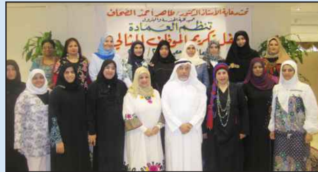
● مع مجموعة أخرى