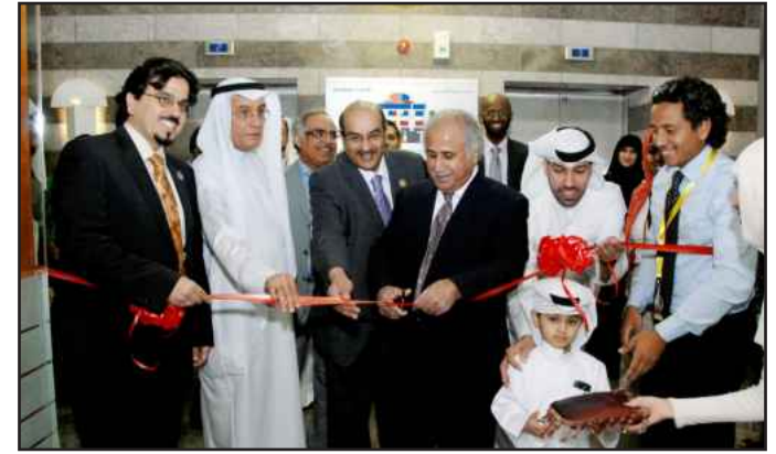
● مدير الجامعة يفتتح المعرض

أقسام علمية ووصل عدد المشاركات ٧٣ ملصقا علميا من قسم المختبرات الطبية، وقسم العلاج الطبيعي، وقسم إدارة المعلومات والملفات الصحية، وقسم علوم الأشعة.