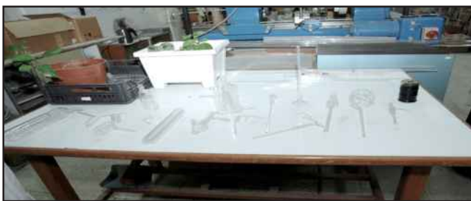
● نماذج انابيب اختبار زجاجية

علي الصالح: الورشة تصنع وتشكل نماذج عديدة ومختلفة تزود بها كليات الجامعة العلمية