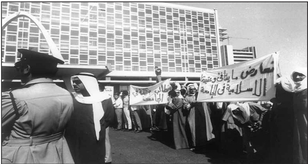
● تظاهرة ضد الجامعة أمام مجلس الأمة احتجاجاً على الدراسة المشتركة التي سميت خطأ بالاختلاط

استقبلتنا في لندن امراة كبيرة في السن وأخذتنا للفندق