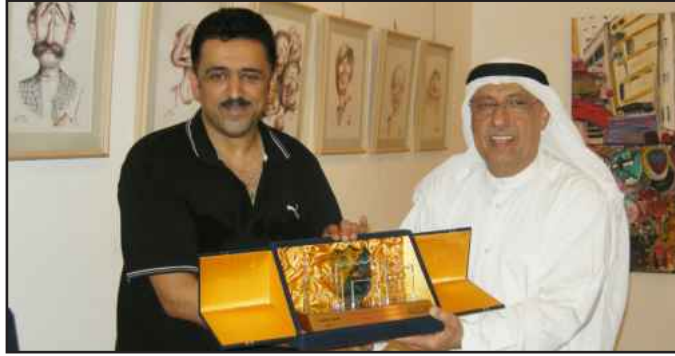
● ... ودرع تذكاري