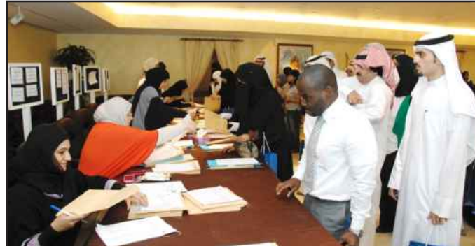
● توزيع مطبوعات الكلية

وأوضح اللوغاني أنه يجب أن تحظى أبحاث طلبة الدراسات العليا باهتمام كبير وتوجيه صحيح، لتكون قادرة على تلبية الحاجات الفعلية للتنمية في البلاد، داعياً جميع أعضاء هيئة التدريس وطلبة الدراسات العليا إلى مضاعفة الجهود ليعمل الجميع سوياً في إطار التوجه الجديد بهدف ربط أنشطة كلية الدراسات العليا بالأهداف التنموية لدولة الكويت.