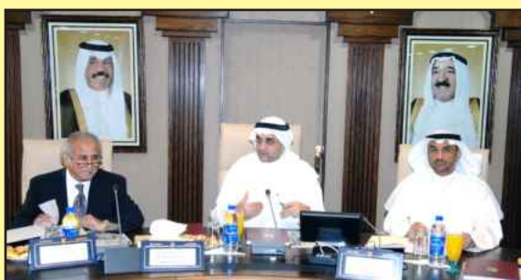
● المليفي متوسطا مدير الجامعة و الأمين العام

بالجامعة. كما الغى المجلس الاستثناءات المعطاة لمدرسي كلية طب الأسنان من بعض الشروط لفتح المكاتب الاستشارية والمهنية. و أقر المجلس التعديلات الجديدة على لائحة الدراسات الصيفية ومشروع باحثي ما بعد الدكتوراه وإنشاء منصب كرسي الباحث. طالع ص ٢