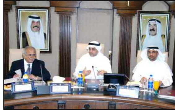
● المليفي متوسطاً مدير الجامعة و الأمين العام