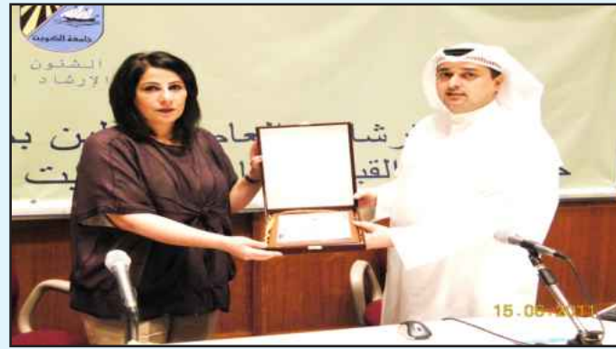
● توزيع الدروع التذكارية