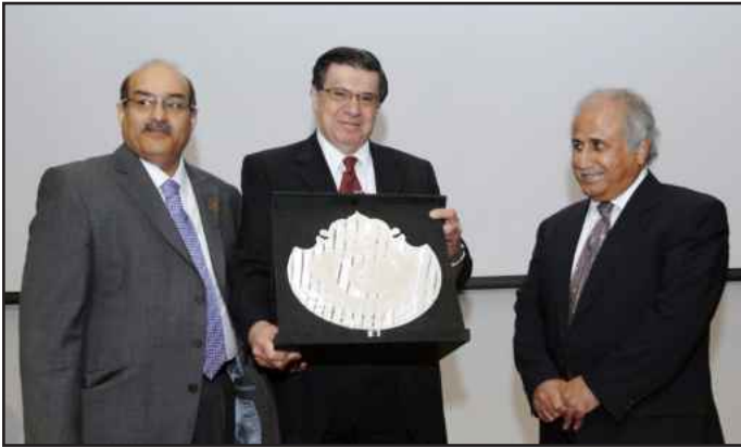
● درع تذڪاري

العبيدي: استلام ٧٣ ملصقا علميا تحوي بين طياتها ملخصات بحثية علمية