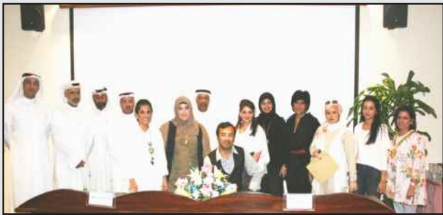
● لقطة جماعية