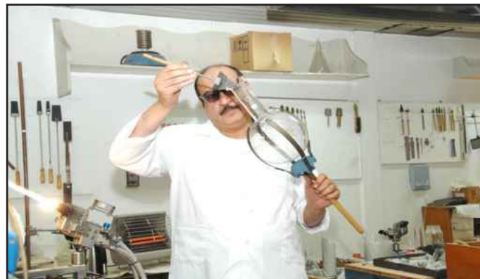
● تشكيل الزجاج