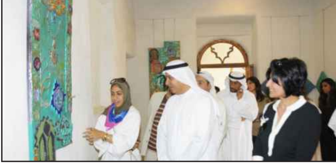
● إحدى الطالبات تشرح فكرة لوحتها