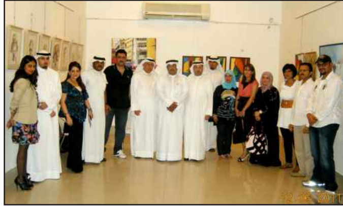
● لحظة تذكارية