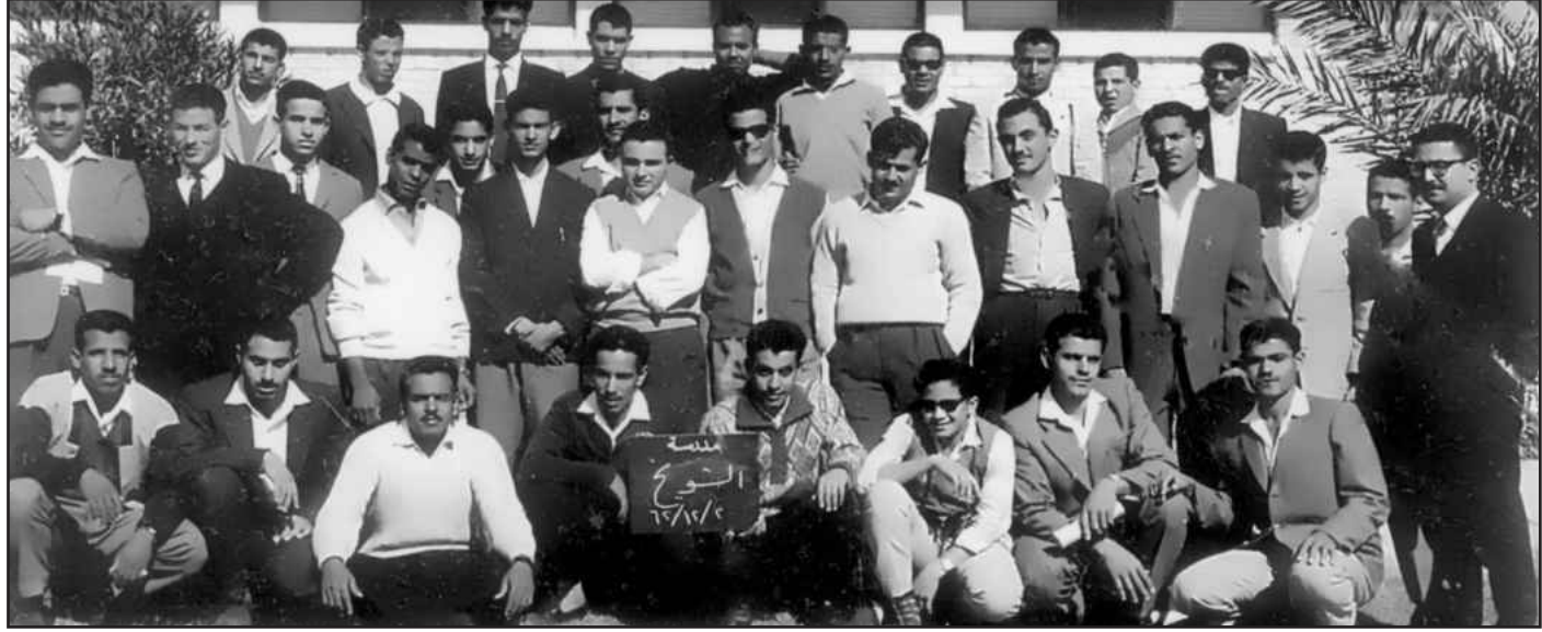
● مع طلبة الثالث ثانوي في ثانوية الشويخ في زيارة للمنشآت النفطية

كان علينا في ريكسم اجتياز شهادة الثقافة العامة البريطانية «CCE» وهي الشهادة التي من دونها لا تستطيع الالتحاق بالجامعة، وكان هذا أمرا شائع الحدوث، سواء بالنسبة للطلبة الكويتيين، أو حتى البريطانيين، فقد علمنا انه ما لا يزيد على ٥% فقط من الطلبة الذين ينجحون آخر مرحلة في التعليم العام يلتحقون بالجامعة، اما البقية فإما ان تتجه لسوق العمل أو الى التعليم الفني، وهو ما كان يحدث للطلبة الكويتيين، فكثيرون ممن جاءوا معي لدراسة الطب انتهى بهم الأمر الى الحصول على دبلوم فني في الأشعة أو المختبرات أو العلاج الطبيعي، اما من التحق بالجامعة فكانوا قلة، لذلك كان اجتياز أحد الطلبة الكويتيين لامتحانات شهادة الثقافة العامة البريطانية، وحصوله على قبول في جامعة ما حدثا يتناقله الطلبة، وتطير به الرسائل مبشرة الأهل في الكويت .