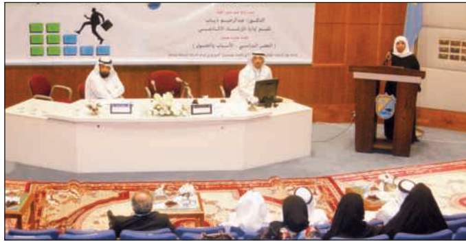
● جلسة التوصيات