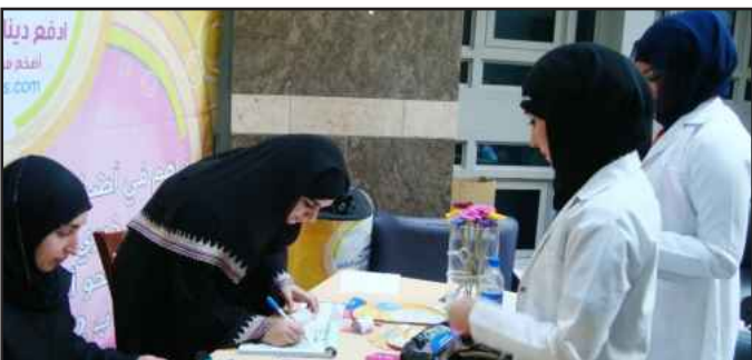
● استقبال المتبرعات

الأمية في البلدان الإسلامية، وأشارت الميمنى الى أن باب التبرع لهذا المشروع التعليمي مفتوح لكل من يود المساهمة والمشاركة إما من خلال استقطاع أو ايداع المبلغ الذي يراه مناسباً في الحساب الذي تم تخصيصه للمشروع في بنك الكويت الدولي ٠٨٢٠١٠١٤٧٨٠