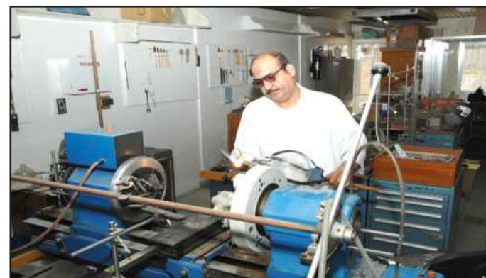
● الصالح خلال العمل

ليضعوا فيه عينة البترول ويقدمونه لسمو الأمير الراحل عن زيارتهم له، وكان لهم ما أرادوا.