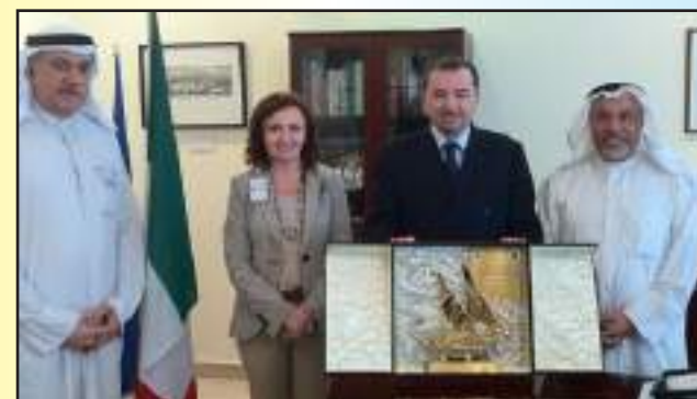
● د. الصحف مكرما السفير الإيطالي

كرمت عمادة كلية الهندسة والبتترول في الجامعة السفير الايطالي لدى دولة الكويت انريكو جرنارا وذلك بمناسبة رعايته لمقرر مشاريع طلبة العمارة الذي أقيم في الكلية في الفصل الدراسي الماضي تحت شعار اليوم الايطالي.