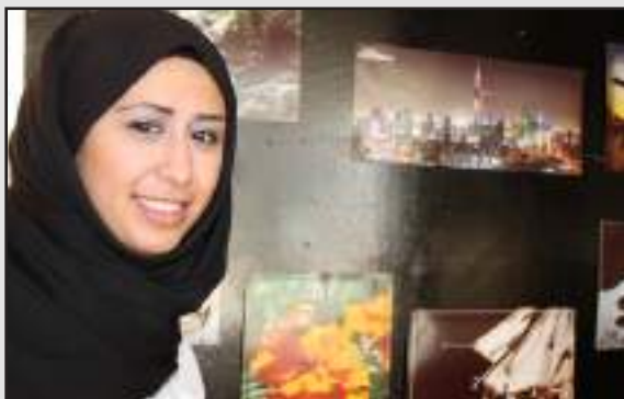
● لوحات فوتوغرافية

السنوات القادمة بناء على رغبة جميع المشاركات . مؤكدة أن إدارة الكلية تولي الاهتمام لمثل هذه الملتقيات الخاصة بالموظفات و ذلك لتحقيق النتائج المرجوة من خلال بيئة عملية صحية و متجددة .