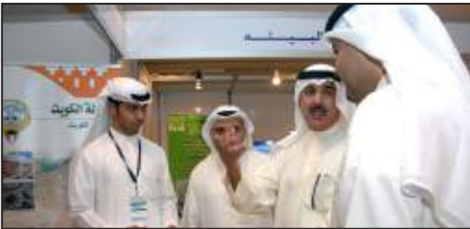
● حوار و نقاش

الملا: المعرض توعية للخريجين بنوعية العمل والوظائف التي تقدمها البلدية