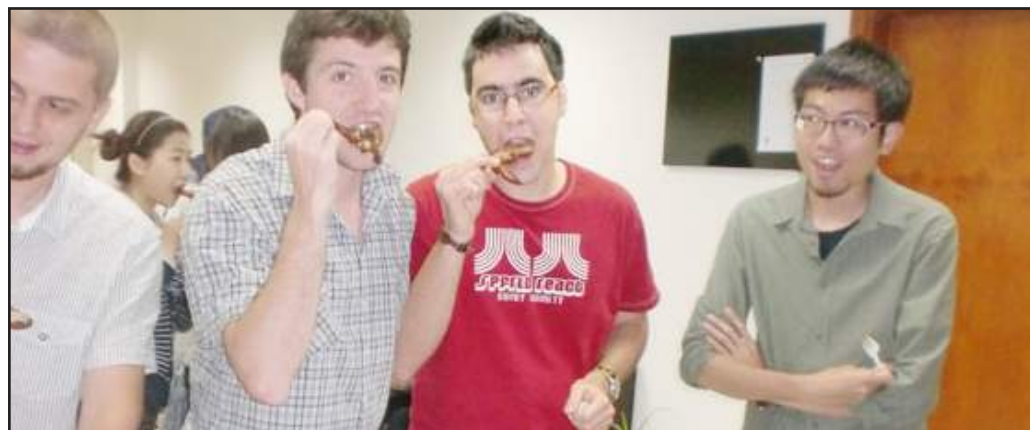
● طلبة الملتقى يتذوقون الاكل الصحي