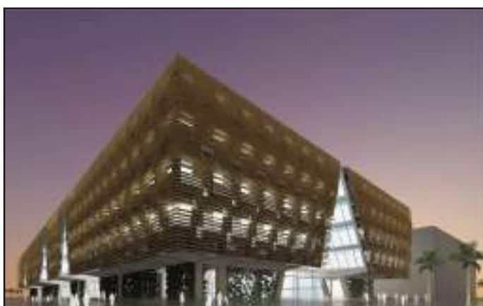
● مبني كلية التربية

مشيدا بروح المبادرة لديها والعمل بفكر تنموي والتناسق والتنظيم و أشار إلى أن الإدارة منفتحة تماما على الاقتراحات التي يقدمها أعضاء هيئة التدريس، وقد نفذت بعضها منها وهي تعد بدراسة الاقتراحات الأخرى، فهي لا تتردد بالموافقة على ما يسهل ويشجع على البحث العلمي بما لا يخالف اللوائح والقرارات الجامعية المنظمة.