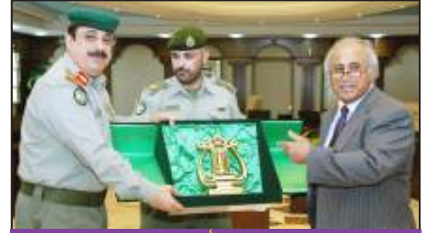
مدير الجامعة استقبل وفداً من الحرس الوطني ص ٢