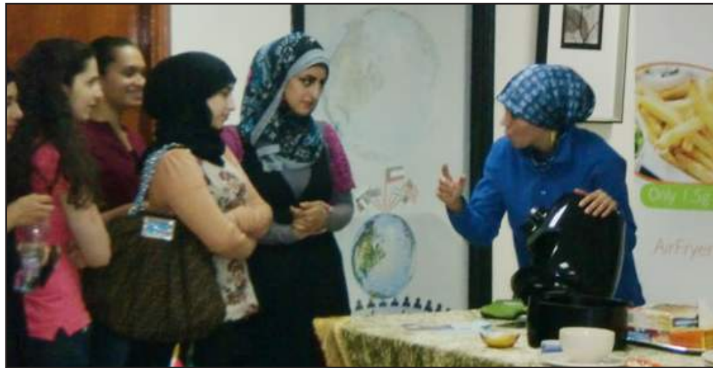
● شرح كيفية عمل المقلاة

الطعام و مؤقت داخلي يتيح امكانية تحديد وقت الطهي مسبقاً وصولاً إلى ٣٠ دقيقة بالإضافة الى ضبط التحكم في درجة الحرارة يطهو الطعام بمعدل ثابت يصل الى ٢٠٠ درجة مئوية ، مع ملحقات لفصل الأطعمة عن بعضها، يمكنك من اعداد أنواع عدة في الوقت نفسه و فلتر هواء متكامل، يشتمل الروائح الكريهة.