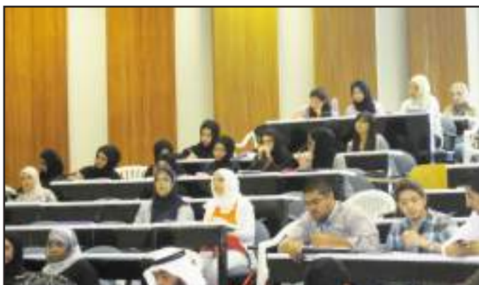
● حانف من حضور الندوة