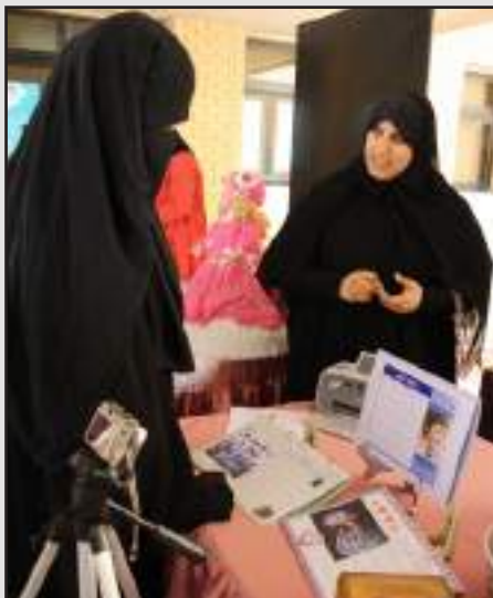
● شرح لاحدى المعروضات