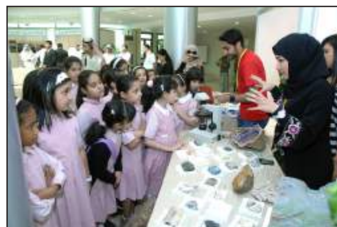
● تعرف بإعادة تدوير النفايات

أعضاء الجمعية الكويتية لحماية البيئة، وطلبة المدارس من مختلف الأعمار، والجهات الراعية والمشاركة في المعرض.