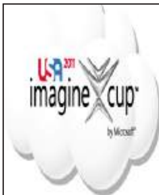
● شعار المسابقة