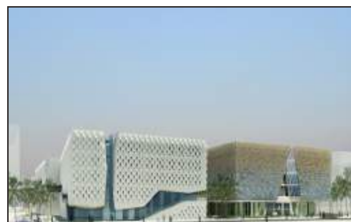
● مبنيان في كلية الآداب

وأخرى للطالبات واستراحات لأعضاء هيئة التدريس و طلاب الدراسات العليا كما تشمل المباني مواقف في سرداب المبنى لخدمة أعضاء هيئة التدريس والجهاز الإداري إضافة إلى ما سبق فإن هذه المباني ستوفر خدمات مشتركة لمستخدمي الموقع ومنها كافيتريا ومكتبة و استديو بث تلفزيوني / محطة إذاعية. و بينت د. الفارس أنه روعي في تصميم هاتين الكليتين ما توصل إليه العلم الحديث من تكنولوجيا في أعمال العمارة انطلاقا من