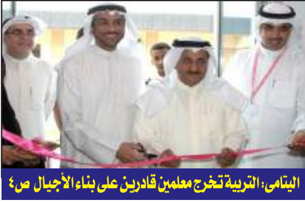
اليتامي: التربية تخرج معلمين قادرين على بناء الأجيال ص ٤