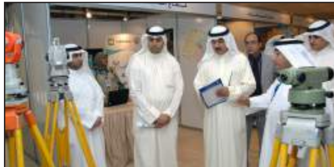
● الصباح و د. الملا يطلعان على المعارضات