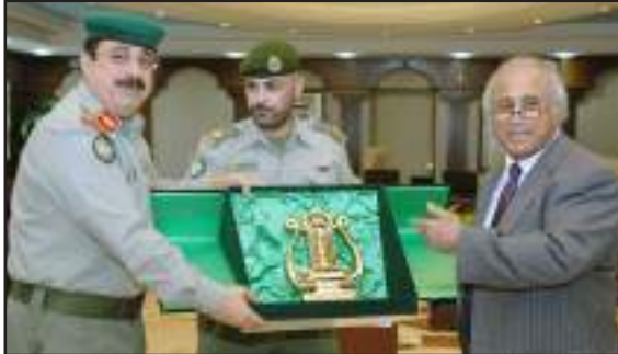
درع تذكاري لمدير الجامعة