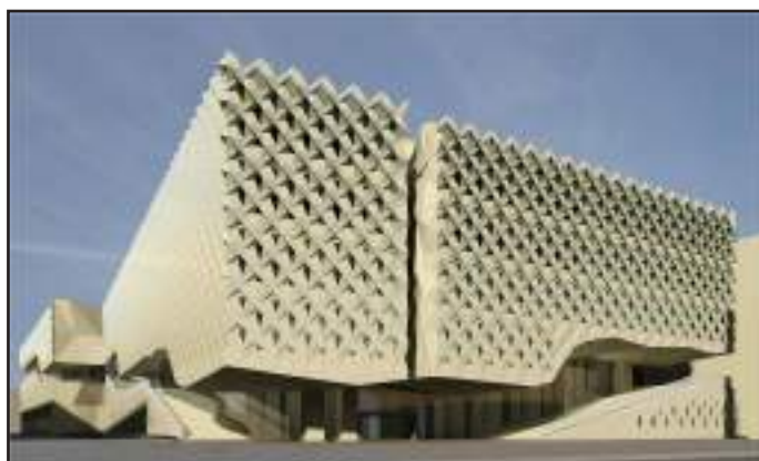
● مبني يشمل القاعات والمدرجات والمختبرات الدراسية

وأخرى للطالبات واستراحات لأعضاء هيئة التدريس و طلاب الدراسات العليا كما تشمل المباني مواقف في سرداب المبنى لخدمة أعضاء هيئة التدريس والجهاز الإداري إضافة إلى ما سبق فإن هذه المباني ستوفر خدمات مشتركة لمستخدمي الموقع ومنها كافيتريا ومكتبة و استديو بث تلفزيوني / محطة إذاعية. و بينت د. الفارس أنه روعي في تصميم هاتين الكليتين ما توصل إليه العلم الحديث من تكنولوجيا في أعمال العمارة انطلاقا من