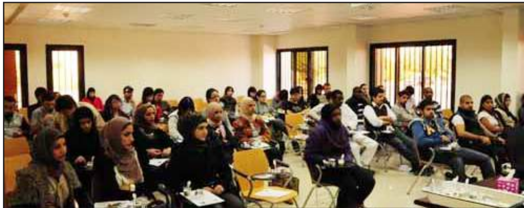
● أساليب التعليم تطورات في جامعة الكويت