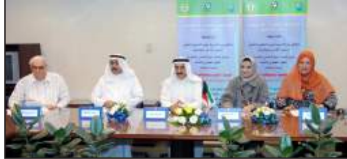
المحتشدون في المؤتمر