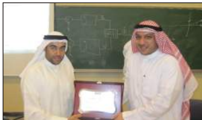
●..و تکریم آخر