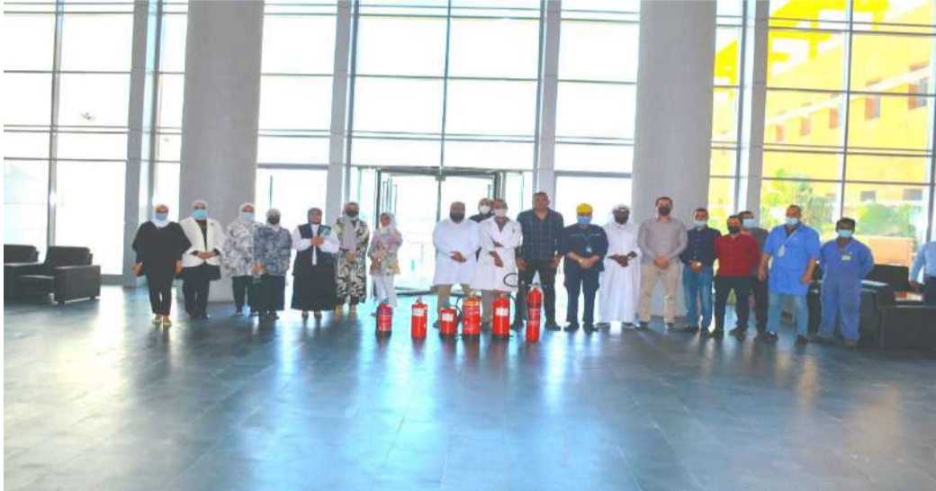
... وجانب آخر