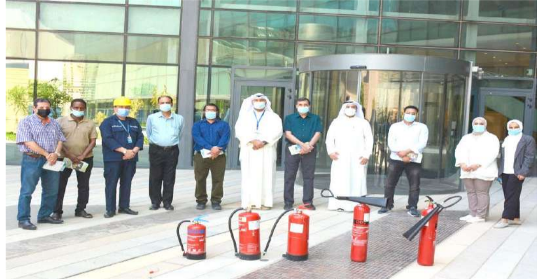
جانب من الورشة

اقامت إدارة الأمن والسلامة بالجامعة ورشة عمل لكل من موظفي كلية العلوم ومركز علوم البحار لتعريفهم بأنواع مطفأة الحريق وكيفية استخدامها.