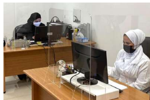
عمل مستمر في إدارة التسجيل

قامت إدارة التسجيل بتوجيهات من عميد القبول والتسجيل بتحديد احتياجات ومتطلبات مواجهة فيروس كورونا بشأن الإجراءات والتدابير الوقائية والاحترازية عن طريق تقديم الخدمات الطلابية الكترونية حتى لا يضطر الطالب لمراجعتنا وواجهتنا تحديات وامال كبيرة اثناء فترة كورونا خاصة أن الوضع لأول مرة يمر على جامعة الكويت وبفضل الله تغلبنا على الصعوبات من خلال تحويل المعاملات الورقية إلى الكترونية بالتعاون مع الحاسب الالي وحتى يتم تحقيق واستيفاء الاحترازات الصحية تم اعداد نموذج طلب خدمة الكتروني ونظام حجز مواعيد للمراجعة والاستفسار