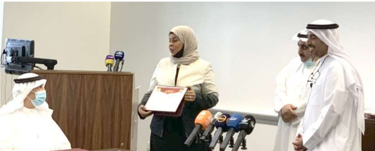
..و تكريم آخر