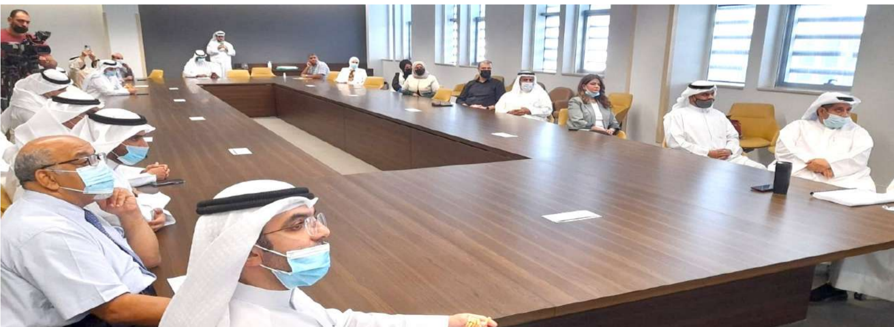
جانب من حفل التكريم