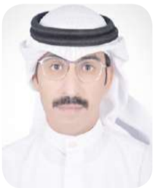
كتب - جراح القزاع موظف كلية الاداب

عبارة عن دراسة وتفوق وممارسة لم يتفق الى هذا اليوم اي من المؤسسات الإعلامية والكلية الجامعية بأساتذتها في ما يخص المسمى الحقيقي للعاملين تحت هذه المؤسسات لان هناك متخصصين دراسياً وممارسين مهنياً. مسمى الإعلامي أصبح بالمجان لان جميع الدول لم تنظم هذا الموضوع من قبل الجهات الرسمية وعدم اهتمامهم بهذا الشأن، هناك اتفاق من قبل جمعيات مهنية لتشعب الصحافة مثال على ذلك توجد (جمعية الصحفيين الكويتية) وتعتمد هذا الأمر من خلال كتاب رسمي من المؤسسات الإعلامية الورقية فقط لعضوية الصحفي واعطائه هوية خاصة باعتماده صحافي، السؤال الذي نحتاجه هو هل تعتبر هذه الهوية رسمية ومعتمدة ويسمح له من قبل جميع الوزارات ممارسة عمله حتى في مجلس الامة ام لا؟ لو كل دول العالم تنظم هذا الأمر وتقوم بإصدار هوية رسمية من قبل الجهات الرسمية للدولة دون تمييز ومن خلال اختبارات ورقية وشفهية لما تجرأ اي شخص