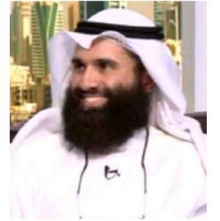
د. عبدالله المطوع

حذر نائب مدير الجامعة للخدمات الأكاديمية المساندة بالإنابة د. عبدالله المطوع من تزايد الاختراقات السيبرانية، داعياً لمواجهتها باستراتيجيات حديثة ومستقبلية. جاء ذلك في كلمة له نيابة عن مدير الجامعة بالإنابة د. بدر البديوي، في المؤتمر الافتراضي للأمن السيبراني وأمن المعلومات، الذي عقد الاثنين الماضي بمشاركة 550 خبيراً من داخل الكويت وخارجها. أوضح د. المطوع، إن موضوع الأمن السيبراني يعتبر من أهم موضوعات الساعة، لافتاً إلى الانفتاح الكبير على استخدام تقنيات الإنترنت والاتصالات في جميع مؤسسات الدولة الخاصة والعامة وإجراءاتها. وذكر أن العالم اليوم على أعتاب ثورة صناعية رابعة باستخدام أدوات الذكاء الاصطناعي وتقنيات الجيل الخامس من الاتصالات وإنترنت الأشياء والبيانات الهائلة والمدن الذكية وغيرها من التقنيات. ص 3