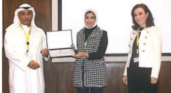
• د. رزوقي يوزع الشهادات