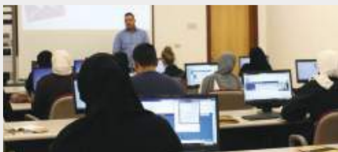
• جانب من المتدربين