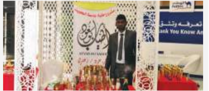
• أحد المبادرين يعرض مشروعه

والجدير بالذكر أن هذا الملتقى يعتبر بادرة جديدة، تحرص من خلالها كلية العلوم الإدارية على تحفيز للشباب نحو العمل الحر والابتكار، وتعزيز دورهم في المشروعات الصغيرة، تأكيداً على أهمية دورهم كدعامة للمجتمع، وإيماناً بأنهم ثروة الكويت ورقبها.