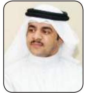
اعداد مهدي العجمي

الا على طاري الحميه والقريب ياكيف حال اللي يضام ويكتوي دواك يا دكتور للجرح العطيب ماحرك الساكن بوجه الملتوي إذاك في فعلك تخيب وما تصيب يجوز عن درب المراجل تنزوي لا لا اتعذر بالظروف وبالنصيب قصرت يدك من واجب الفعل السوي أتعس شعور يمر في ليل الغريب لا شانته الهقوه ولا حوله خوي