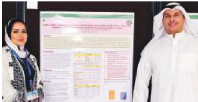
• مشاركون بالمصق