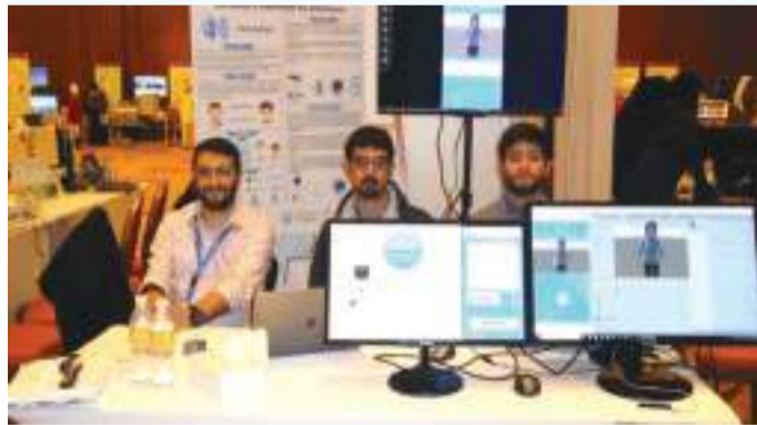
• المهندسون أمام مشروعهم

التي واجهتهم هي كيفية تدريب الذكاء الاصطناعي بحيث يتطلب قدرة حاسوبية عالية الكفاءة ، وقد تم إنجاز المشروع بنجاح وكفاءة، كما أنهم وجهوا جزيل الشكر للمشرفين على المشروع وكل الأساتذة الذين ساهموا في إنجاح هذا المشروع، والشكر الأخص للنادي الرياضي للصم وفريق "بالإشارة" لما قدموه من مساعدة في شرح إشارات الصم ومتطلبات المشروع.