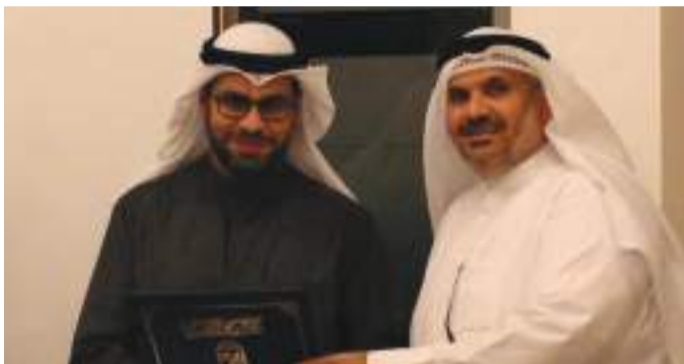
• وجانب آخر

وكل من لديه مشكلة تواجهه فيما يتعلق بالمادة العلمية لهذا المشروع ما عليه إلا التواصل معنا.