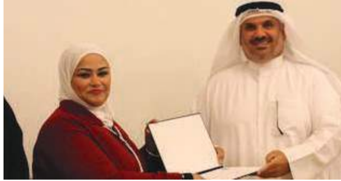
• الشمروخ تتسلم شهادتها