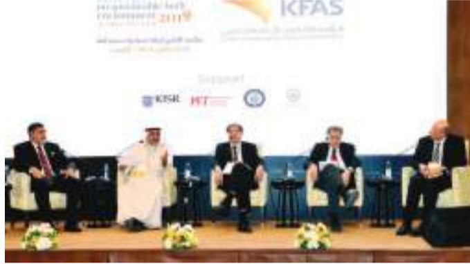
• المتحدثون في إحدى الجلسات