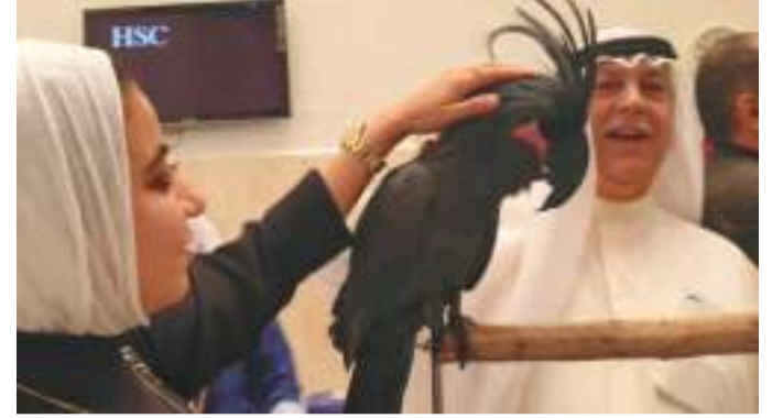
• تفحص احد الطيور