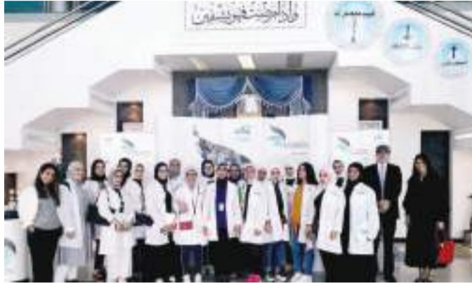
• لقطة تذكارية

استضاف استاذ جامعة الكويت الرياضي ، الكائن في الحرم الجامعي بالشويخ ، طلبة و طالبات مدرسة البيان ثنائية اللغة ، في يوم رياضي مفتوح للصفوف الابتدائية ، شاركت فيه فرق الطلاب و الطالبات ، متعة اللعب مع فرق الأساتذة ، في أجواء تنافسية ، اتسمت بالتشجيع على تنمية الروح الرياضية ، و التحفيز على تقبل الربح و الخسارة أمام الجماهير .