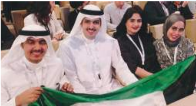
• فريق الجامعة يرفع علم الكويت