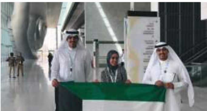
• فريق الجامعة في مطار الدوحة