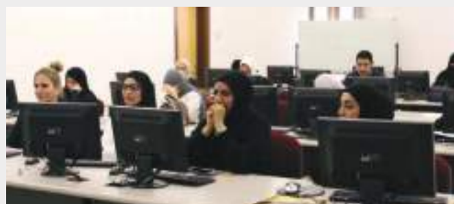
• جانب من افتتاح الدورة

وقد تم تدريبهم على كيفية حماية معلوماتنا من المتطفلين في المجال التقني المعلوماتي، وتم تدريبهم كذلك على معرفة أساسيات الأمن الرقمي ليحموا أعمالهم من أي استغلال إلكتروني على شبكة الانترنت.