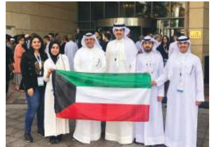
• فريق الجامعة