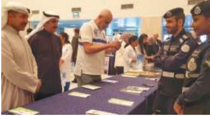
• الاطلاع على المعارض