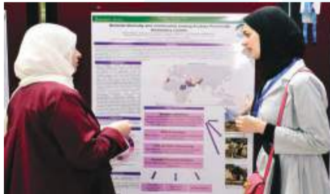
• إحدى المشاركات