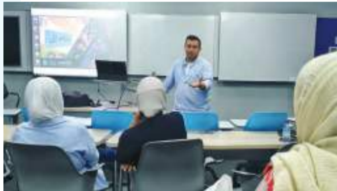
• النصر متحدثاً

وذكرت ان اقبال الطلبة على النشاط المسرحي بالجامعة واضح وهناك فعلا عدد من الطلبة المهووبين بالكلية والذين يشغلون اوقات فراغهم بهواياتهم الفنية، موضحة ان باب النشاط مفتوح لتلقي الطلبة اصحاب المواهب الطلابية من خلال التسجيل بالنشاط عن طريق المشرفين بالكلية.