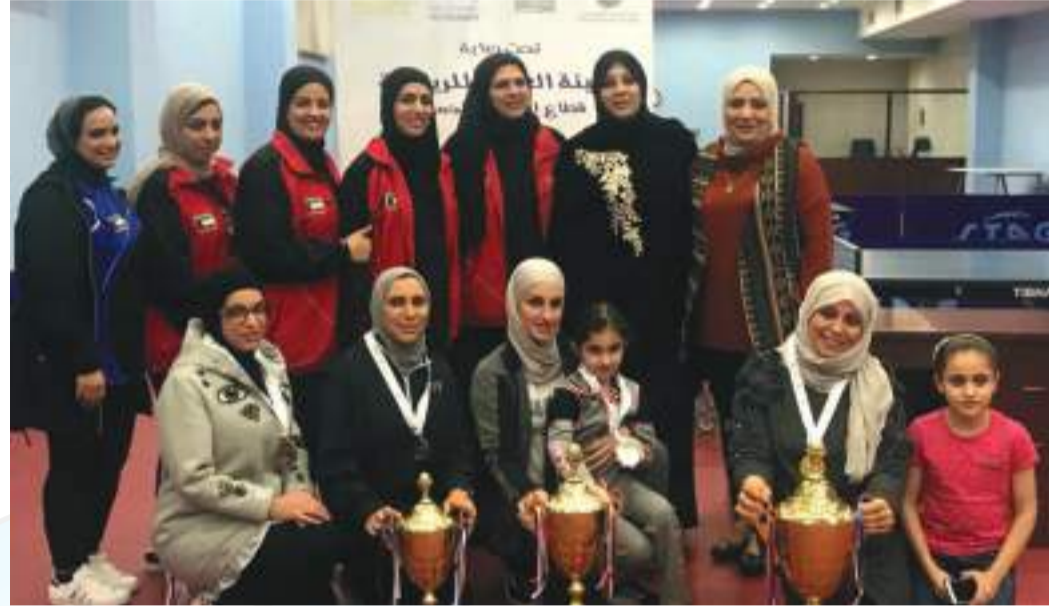
• جانب من تكريم الفائزين