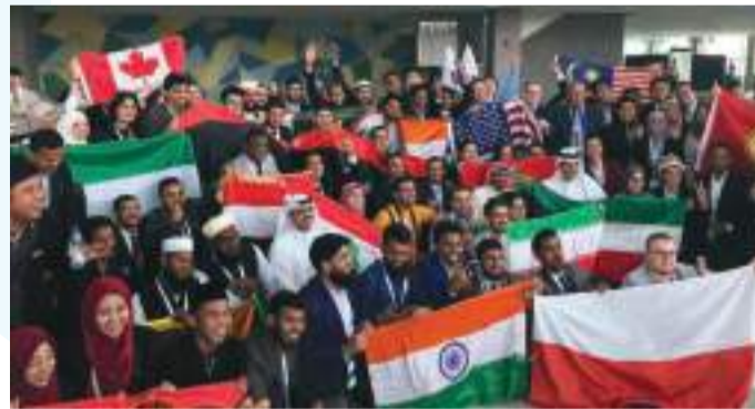
• الفرق المشاركة