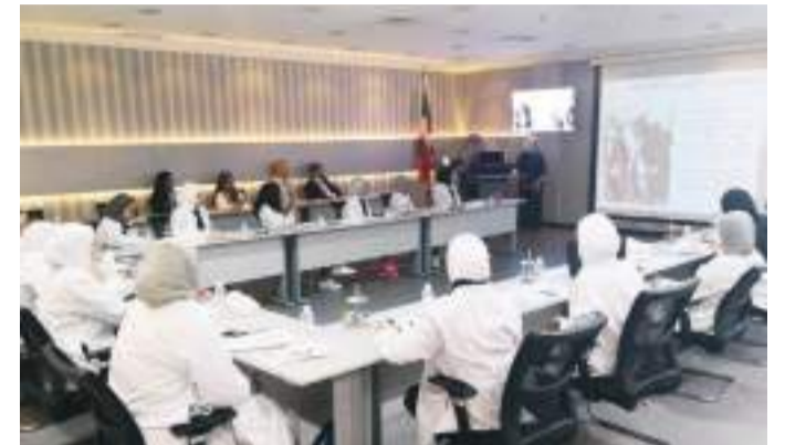
• أثناء العرض التقديمي

على 9 محاور تشمل جميع الخدمات المقدمة بالمنطقة ابتداء من سلامة الهواء والغذاء والتنمية الصحية ومرورا بالتعليم حتى الأنشطة الصغيرة والأمن، الأمر الذي استغرق جهودا مشتركة عديدة استمرت 11 عاما.