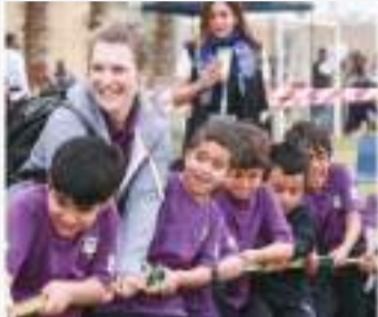
• الطلبة يشاركون بشد الحبل