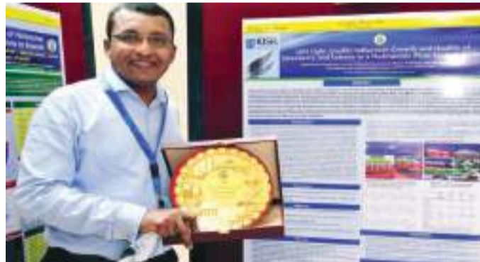
• أحد الفائزين

بدوره، قال نائب مدير الجامعة للأبحاث أ.د. جاسم الكندري إن المصق العلمي يشكل أحد الأنشطة الرئيسية والأساسية والتي تقام سنوياً فيما بين الكليات الإنسانية والعلمية من منطلق أنها تعكس مهام الجامعة الأساسية، معظم الدول المتقدمة تستند على البحث العلمي وعلى التعليم لتنمية المجتمعات وتطويرها وبناء مستقبلها. وأكد على أهمية الحرص على إعطاء الأهمية الكبرى للبحث العلمي والذي يرتبط ارتباط كبير بما يسمى اقتصاد المعرفة سواء كان في الكليات العلمية أو الكليات الإنسانية، متمنياً أن يؤدي قطاع الأبحاث الدور المطلوب منه من خلال تشخيص علل وظواهر المجتمع الكويتي، وطرح تصحيح مسار فيما يخص مختلف التخصصات.