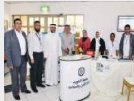
جناح الامن والسلامة