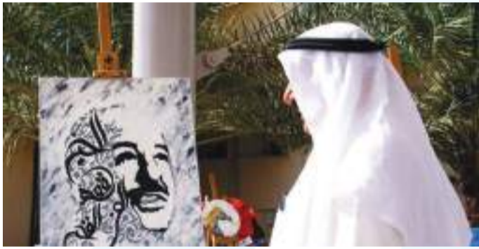
• لوحة سمو الأمير

للهندسة المدنية وبأنه مخترع سابق منذ المرحلة الابتدائية في النادي العلمي، موضحاً أن تعلقه بالرسم جاء كونه يشكل تصوراً ذهنياً لمجموعة اختراعاته، وأنه بدأ بتطوير مهاراته بممارسة الرسم منذ عام 2016 ويسعى لتطويرها حتى الآن.