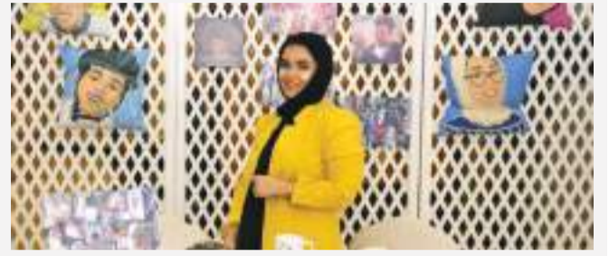
• إحدى المبادرات تعرض مشروعها