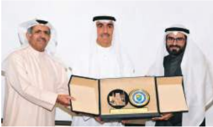
• تكريم مدير الجامعة