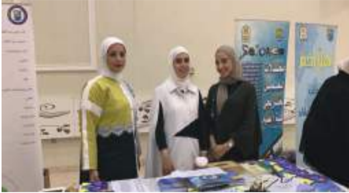
• جانب من المشاركة