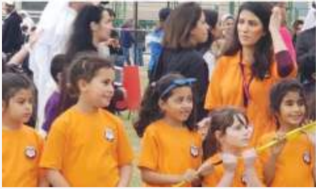
• لعبة شد الحبل