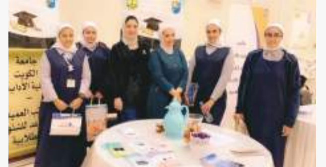
• طالبات في جناح الإرشاد بملتقى الجامعات