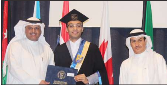
● تكريم أحد الطلبة

التي تساهم بدعم الشؤون الطلابية منها إدارة الإنشاءات والصيانة وإدارة الأمن والسلامة ودارة الخدمات العامة وإدارة التغذية وإدارة التأثيث والإسكان وإدارة مطبعة الجامعة.