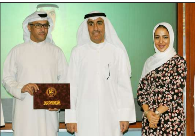
● ..وتكريم جهة أخرى