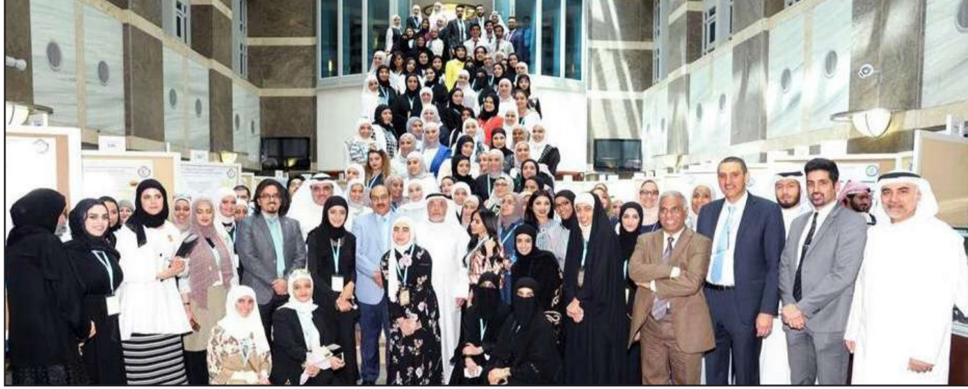
● لقطة تذكارية