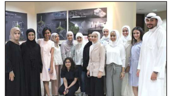
■ طلبة العمارة في لقطة جماعية

د.دلال قاسم على أهمية المحافظة والاهتمام بالمباني التاريخية القديمة، مؤكدة أن التراث الحضاري المعماري وغيره على اختلاف أنواعه وأشكاله مبعث فخر للأمم واعتزازها ودليلاً على عراقتها وأصالتها، وذلك لأنه يعبر عن الهوية الوطنية وصلة وصل بين الماضي والحاضر. وبينت قاسم أن المباني التاريخية في الكويت ترمم بطرق تخالف المعايير العالمية، لذا تعتبر هذه المقررات فرصة لنشر التوعية من خلال الطلبة بأهمية الالتزام بالمعايير والمقاييس العالمية في التصميم والترميم. وأشارت أن المعرض احتوى على مشروعات طلبة «تصميم4»