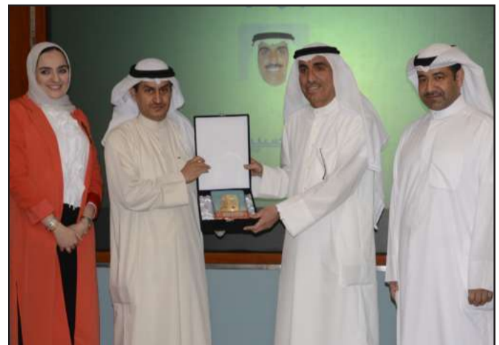
● تكريم مدير الجامعة