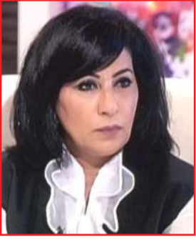
● هند السالم

للكويتيين وأبناء الكويتيات ومواطني مجلس التعاون والمقيمين بصورة غير قانونية المستوفين لشروط القبول