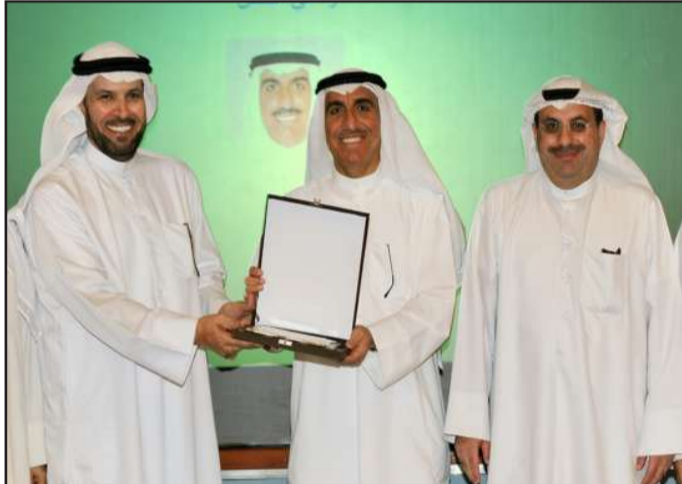
● تكريم عميد الاجتماعية