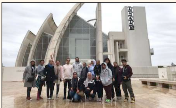
■ المشاركون في الرحلة أمام أحد الأوابد التاريخية