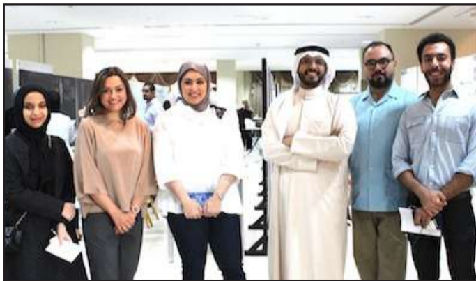
■ لقطة تذكارية

العميم: التعليم في كلية العمارة اكتمل بمنظومة تمزج الجانبين النظري بالعملي