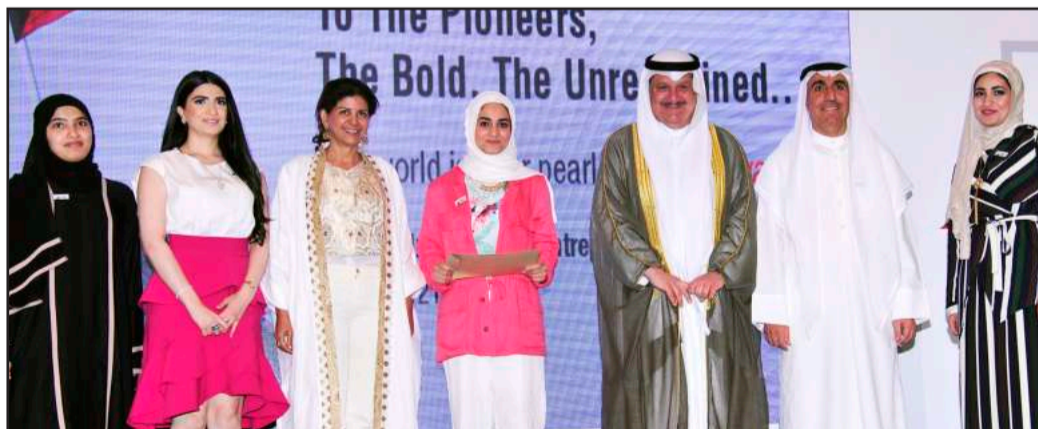
● لحظة تذكارية