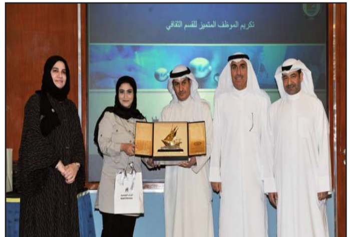
● احدي المكرمات