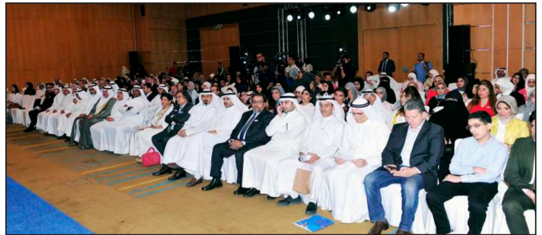
● جانب من الحضور

وقد استهل الحفل بكلمة من مدير الجامعة بارك خلالها للخريجين وشجعهم على نقل خبراتهم لسوق العمل كما