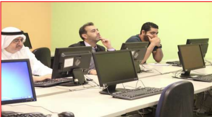
■ تدريب موظفي وأساتذة الطب المساعد

مايكروسوفت وفرتها في السحابة التخزينية الإلكترونية، وهذه الميزة تخدم الموظفين والأساتذة والطلبة على حد سواء لأنها من التطبيقات الأساسية التي يحتاجها أغلب المستخدمين في أعمالهم اليومية.