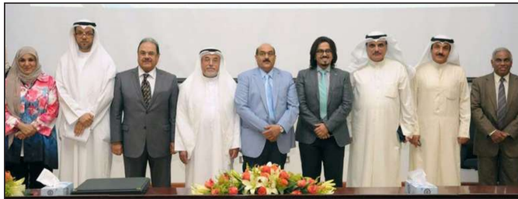
● د. الصحف يتوسط الحضور

كتبت: بدور طارق أكد مدير جامعة الكويت أ.د. حسين الأنصاري أن مشاركة الطلبة الخريجين بيوم البحث الطلابي لعرض أبحاثهم على الملصق يعزز من مستوى التحصيل العلمي وجودة مخرجات الكلية ويربطها بسوق العمل. جاء ذلك خلال افتتاح يوم البحث الطلابي العاشر في كلية العلوم الطبية المساعدة للعام الجامعي ٢٠١٦/٢٠١٧ بمسرح عبدالمحسن عبدالرزاق في مركز العلوم الطبية - الحرم الجامعي الجابرية، وذلك بحضور عميد كلية العلوم الطبية