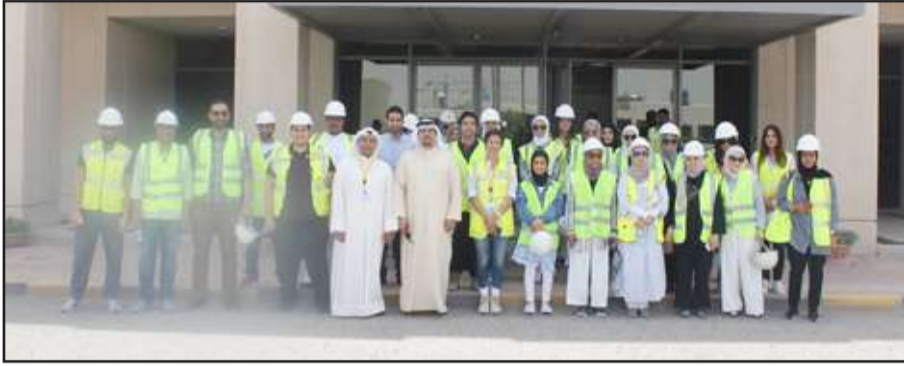
● وفد الأشغال لدى زيارته البرنامج الإنشائي

الجامعية والمرافق المختلفة بالمدينة الجامعية حيث عبر الزوار عن إعجابهم بالتصاميم المعمارية لمكونات الحرم الجامعي والتي وصفوها بالتحف المعمارية التي تتباين من حيث هوياتها المعمارية والهندسية ، مثنين نسبة الإنجاز الكبيرة التي قطعها المشروع ، كما تمنوا أن تستثمر كافة الجهود لإنهاء المشروع وتسليمه في الوقت المحدد .