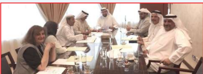
● جانب من توقيع المذكرة

والفنون والآداب بالمؤهلين علمياً في مجال الآثار والمتاحف. واتفق الجانبان على تبادل التعاون في إقامة المؤتمرات والندوات المتخصصة وتبادل المعلومات العلمية ذات الاهتمام المشترك، بالإضافة إلى تكوين فرق عمل مشتركة وتبادل الخبرات العلمية والمهنية بما يعود بالفائدة على الباحثين والدارسين.