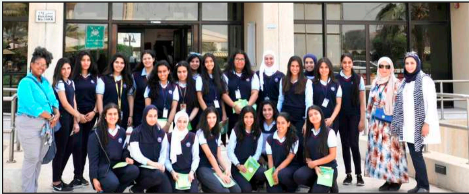
الطالبات أمام كلية الهندسة و البترول

وبدأت الزيارة بالذهاب لبعض المختبرات والتعرف على محتوياته والأجهزة العلمية التي تخدم طالباتنا بالكلية والتعرف على أحدث الأجهزة والتقنيات المستخدمة.