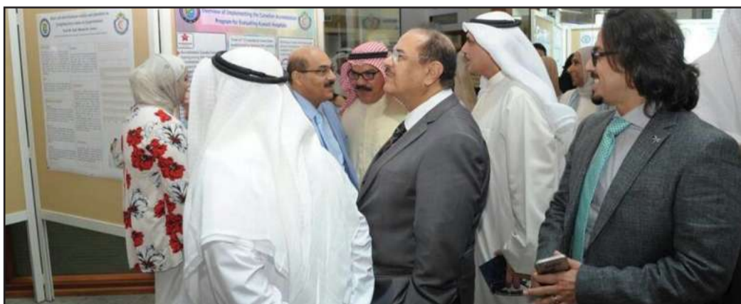
● تصوير: زيد التميمي