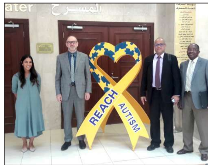
لقطة تذكارية لأساتذة الكلية في مركز الكويت للتوحد

وتضمنت عدة محاضرات علمية إضافة إلى معرض لأنشطة الطلبة المصابين بالتوحد.