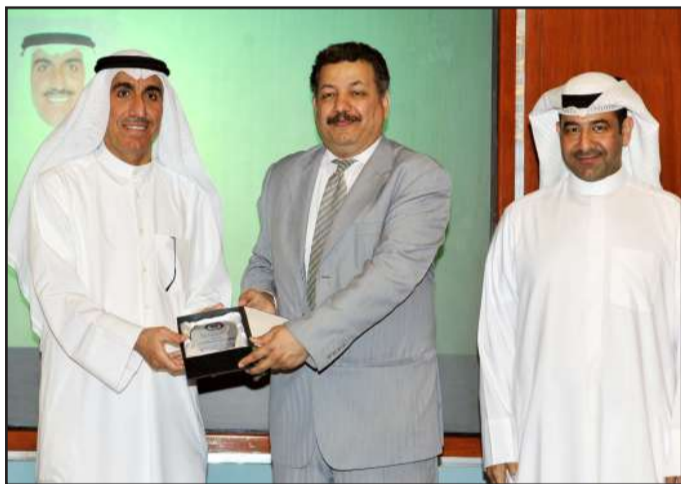
● تكريم عميد الهندسة

وأشار د.النامي أن عمادة شؤون الطلبة حرصت على وضع خطة ثابتة ومتكاملة للنهوض بالشباب ورعايتهم