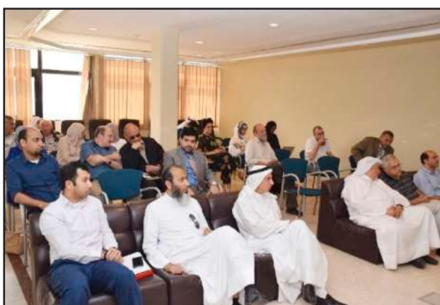
● حضور الندوة

في الحوسبة الموزعة، والحوسبة الموجهة نحو الخدمات والأمن متعدد الوسائط واستكشاف فرص التعاون وآثار العمل البحثي الجماعي والمصالح المرجوة التي من شأنها رفع اسم جامعة الكويت وكلية علوم وهندسة الحاسوب عالياً في المحافل الدولية وأوساط البحث العلمي العالمية.