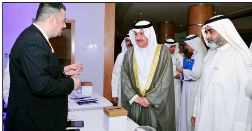
● ويتفقد أحد المشاريع