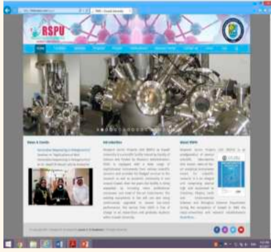
● موقع الوحدة الإلكتروني الجديد

إعادة هيكلة جميع الأقسام في الوحدة وتصنيفها وتبويبها على الموقع لتسهيل على المستخدم في تصفح الموقع. بالإضافة الى ذلك تم إضافة العديد من الخدمات للمستخدمين مثل خدمة الحصول على الفورم الخاص بالجهاز بسرعه وسهوله وخدمة الوصول الى موقع المختبر والشخص المختص بسهولة وكذلك موقع الوحدة بواسطة خدمة خرائط قوقل، وسهولة تحميل جميع الفورم الخاصة بالمختبرات وكذلك الكتيب الخاص بالوحدة بصيغة بي دي اف، خدمة الاتصال والتواصل مع جميع الإداريين والفنيين