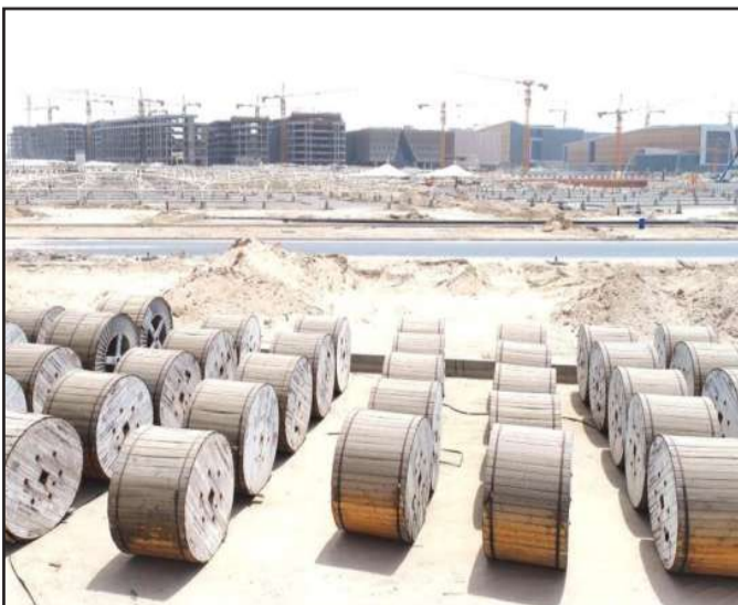
الكابلات في المدينة الجامعية

والمرافق التي وصلت لمرحلة متقدمة من التنفيذ حوالي (124) كيلو متر، وقد تبنت الجامعة أسلوباً متميزاً في تصميم مسار كابلات الضغط المنخفض من خلال استخدام حوامل الكابلات بمنطقة أنفاق الخدمات السفلية، وكذلك باستخدام أنابيب UPVC مرور كابلات الطاقة الكهربائية، وغرف أو مناهيل تفتيش كابلات الطاقة اللازمة لمرافق البنية التحتية، حيث يقدر عدد تلك الغرف أو المناهيل المستخدمة من مختلف الأحجام بـ (625) غرفة تفتيش، بينما يبلغ طول عباتر مسار هذه الكابلات حوالي (15) كيلو متر. ومن الجدير بالذكر أن هذه الخطوة تأتي كثمرة للعمل والتنسيق المشترك بين مالك المشروع وهو جامعة الكويت ممثلة في برنامجها الإنشائي من جهة ووزارة الكهرباء والماء من جهة أخرى، وهي الخطوة التي ستساهم بتسريع إنجاز الكثير من مباني ومرافق مشروع مدينة صباح السالم الجامعية والتي وصلت إلى مراحل متقدمة.