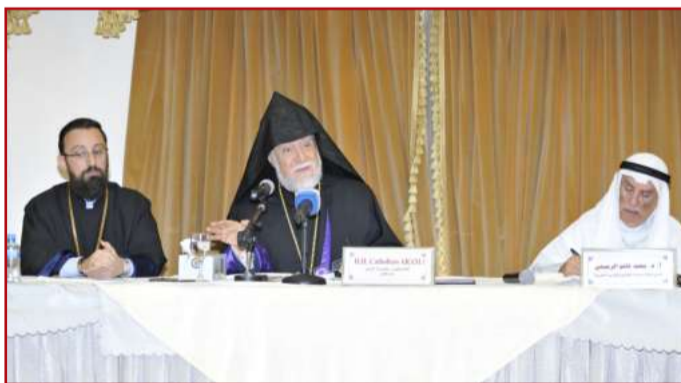
● المتحدثون في الندوة