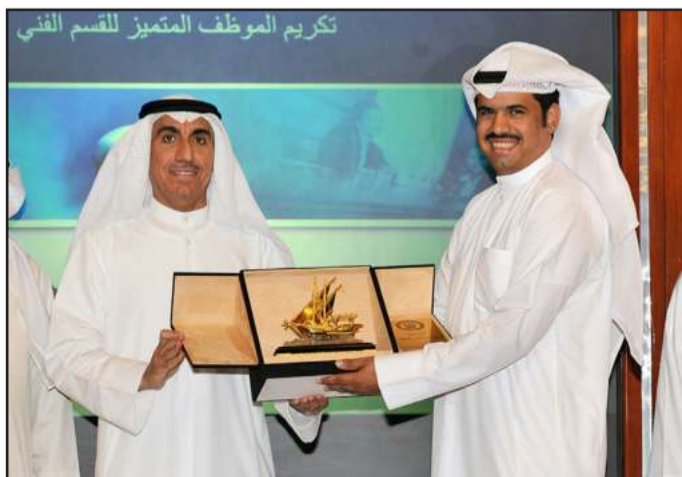
● ..وتكريم آخر