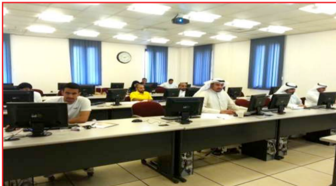
■ تدريب موظفي الإدارات في مختبرات الخوارزمي