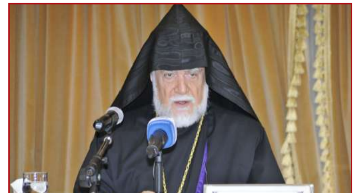
● أرام الأول متحدناً