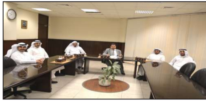
● جانب من اللقاء

ومن جانبها أشار العميدان المساعدان إلى كيفية التعامل مع الطلبة والتقدير باللوائح والقواعد، وأهمية دور هيئة التدريس لتطوير التدريب والبحث العلمي المتجدد، والحرص على الاستفادة من مخصصات البحث العلمي المتاحة لأعضاء هيئة التدريس الجدد. كما أكدوا على ضرورة مشاركة عضو هيئة التدريس في لجان القسم العلمي ولجان الكلية لما لها من أهمية في تطوير الأداء والارتقاء بمستوى الخدمات التي تقدمها الكلية لمتسببيها، وأيضا على ضرورة الالتزام بمنهاج المقررات