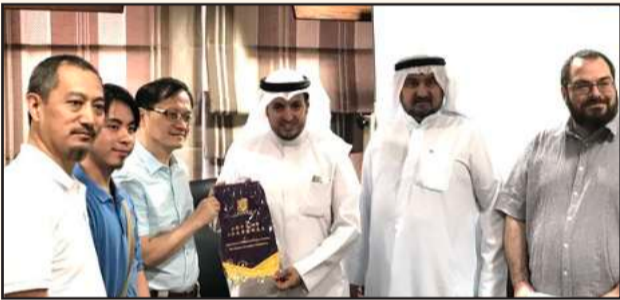
● هدية تذكارية

استقبلت كلية الشريعة والدراسات الإسلامية وفدا من الجالية الصينية، وقد كان في استقبالهم قسم العلاقات العامة بالكلية. وهدفت زيارة الوفد إلى زيارة دولة الكويت والتعرف على المجتمع المسلم وعاداته وتقاليده، والتعرف عليه عن قرب كون دينه التسامح والمحبة وعدم وجود فروقات بين الجنسيات المختلفة في الدين الإسلامي.