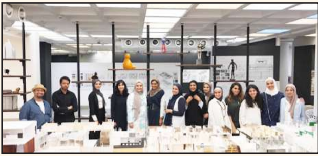
● جانب من المعرض

خلال المشروعات النهائية مع طلبة استوديو التصميم المعماري