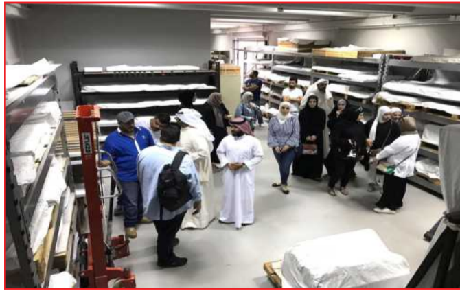
● جانب من الجولة