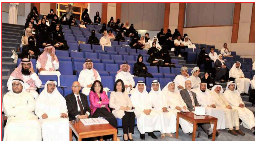
● مدير الجامعة وقياداتها يتقدمون المشاركون بالملتقى