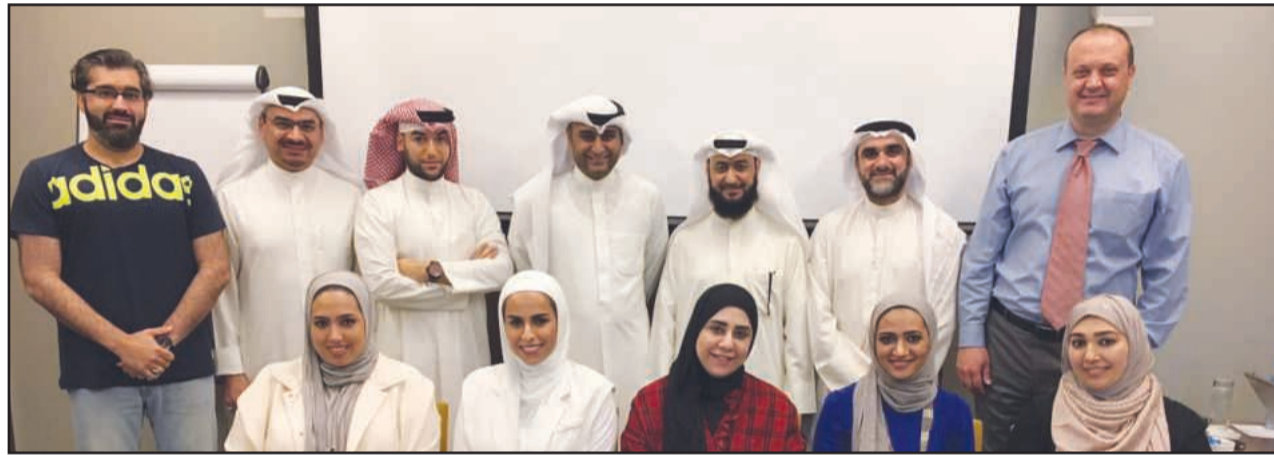
● المشاركون ببرنامج Lead Auditor

اختتمت إدارة التطوير الإداري والتدريب بالجامعة موسمها التدريبي للعام الجامعي ٢٠١٦/٢٠١٧ خلال الأسبوع الماضي، باختمام ثلاثة برامج تدريبية داخلية وبرنامجين خارجيين الأول في لندن تم تنظيمه بالتعاون مع جامعة غرب سكوتلاند، والثاني في الجامعة الكندية في دبي.