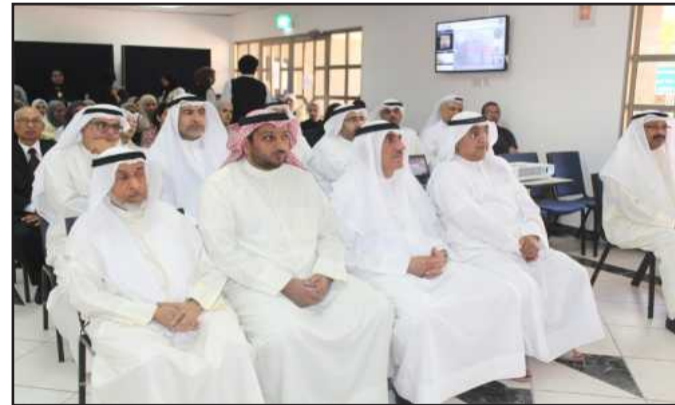
● د. الأنصاري ود. العمر في مقدمة الحضور

استخدامه بالتعاون مع مكتب العميد المساعد للأبحاث والاستشارات والتدريب من خلال الورش التدريبية التي ستقام خلال الأسابيع القادمة. وقدمت المهندسة حنان الخطيب عرضاً تقديمياً عن البوابة الإلكترونية لكلية التربية تشرح فيه البوابة وأهميتها وأهم الجهات المستفيدة من هذه البوابة. وفي ختام فعاليات اليوم قام مدير جامعة الكويت د.د.حسين الأنصاري وعميد كلية التربية د.د. بدر العمر ومراقب مركز التقنيات التربوية اعتماد الكندري بجولة سريعة في المعرض المصاحب للحفل.