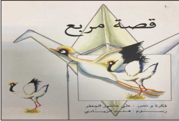
● غلاف الكتاب

كتب تطوي بين صفحاتها شيئاً من تاريخ ، او بعضاً من أدب ، او ثمة فكر ، عن سطور من بين الطيات ، تكتب صفحاتنا.