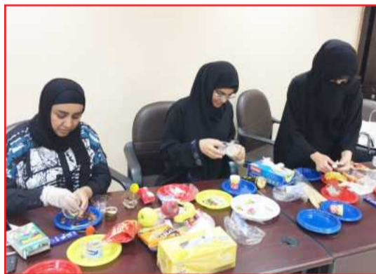
● جانب من التطبيقات في الدورة