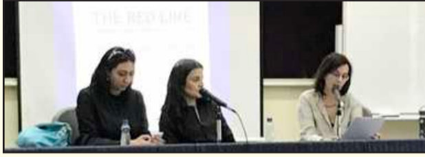
● المتحدثات في الندوة