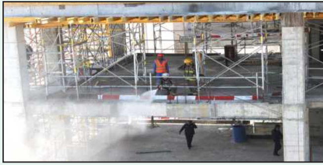
● إطفاء الحريق