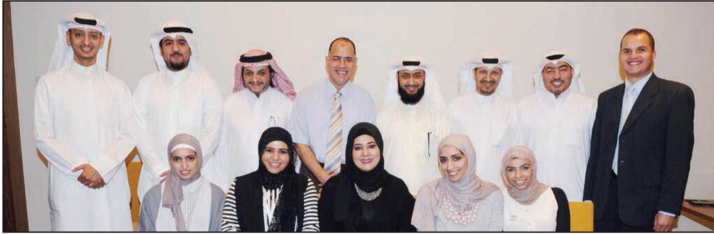
● المشاركون ببرنامج أساسيات التخزين