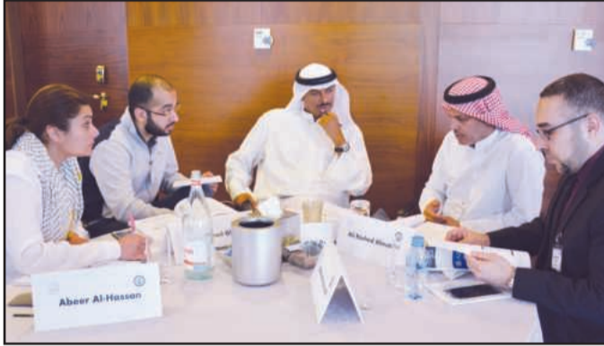
● مناقشة أفكار ومقترحات لتطوير المناهج