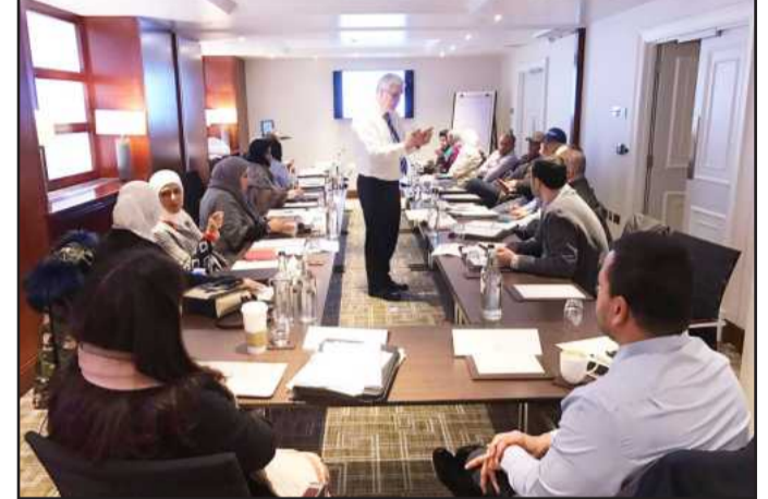
● المشاركون ببرنامج ادارة الجودة في لندن