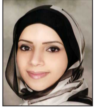
إعداد : مريم الجمعة