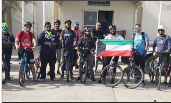
● فريق الدرجات أمام مخفر فيلكا