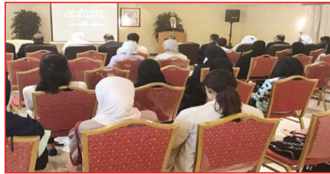
● جانب من إحدى جلسات المؤتمر

وفي الختام تقدم البلام بالشكر الجزيل لمركز الكويت للفنون الإسلامية على دعمه ورعايته للمؤتمر، وللمحاضرين على تلبية الدعوة، ولجميع الحضور.