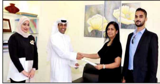
● تبادل وثائق الاتفاقية

وذكر د. الفاضل أن الاختبارات سوف تنطلق في جامعة الكويت ابتداء من شهر يوليو ٢٠١٧ موضحا أن الاختبار يتم بطريقة مختلفة عن