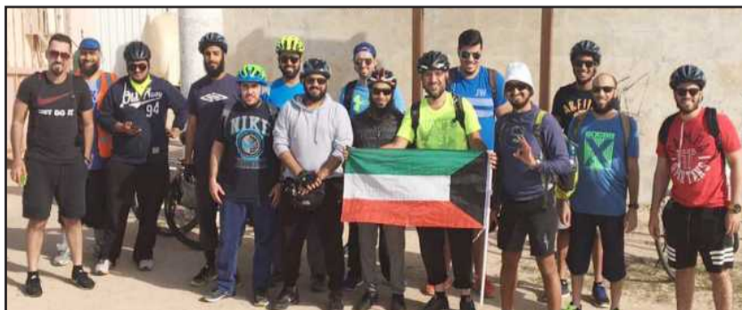
● صورة تذكارية للفريق