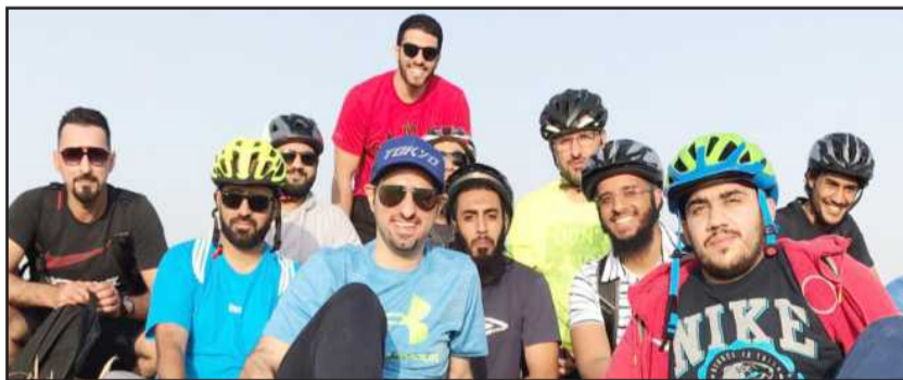
● فريق الدرجات