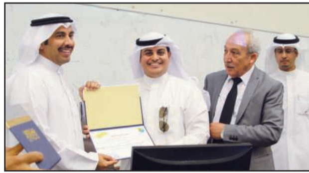
● تكريم أحد المحاضرين

الأمريكي وما ترتبه على ذلك خلال الفترات ما بعد الحرب العالمية الثانية. أما د.نجيب القناعي تحدث عن فيصل الأول وطموحاته القومية خلال فترة الاستعمار البريطاني من معاهدات وغيرها ما ترتب على تطور أوضاع المنطقة آنذاك . وفي ختام المحاضرة تم المناقشة و طرح الأسئلة بحضور عدد من أساتذة القسم وعدد كبير من الطلبة .