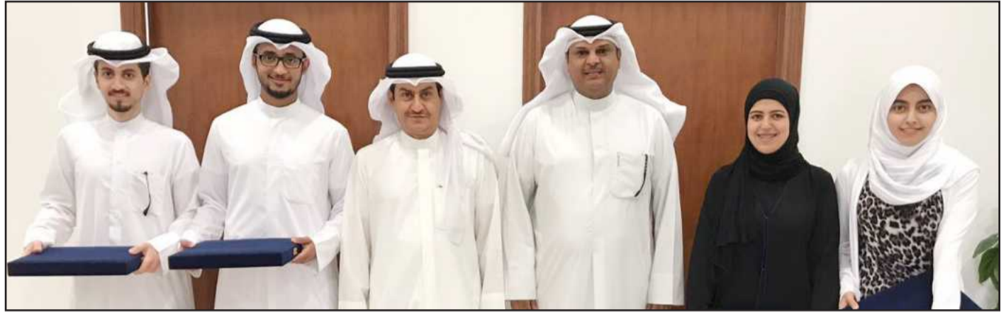
● صورة جماعية

فقط في مسابقة الروبوت، مؤكداً حرص جامعة الكويت واهتمامها بطلبتها المتميزين وتقديم الدعم وتشجيعهم على الابتكار والإبداع والتحفيز على المشاركة والتنافس في المسابقات الدولية.