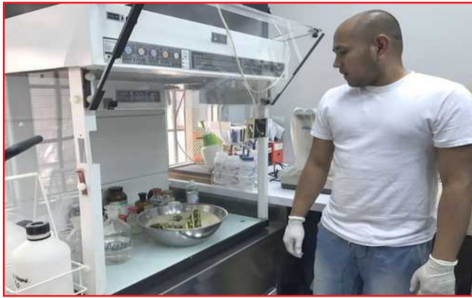
● معالجة الآثار