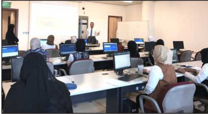
● متابعة من الحضور

وأكد مركز الخوارزمي استعدادها لتدريب جميع موظفي مراكز العمل في مختلف ادارات الجامعة بحيث يتم التدريب في مقر عملهم بشرط تجهيز وإعداد مختبرات حاسوب خاصة بهذا النظام بحيث تتوفر بها اجهزة حاسوب حديثة ومطورة وتحتوي على نظام تشغيلي اوفيس 2016 ، وإن لم يتوفر لديهم مختبرات مجهزة سيتم تدريبهم لديه بمختبراته المتخصصة والمجهزة للتدريب على هذا النظام الجديد.