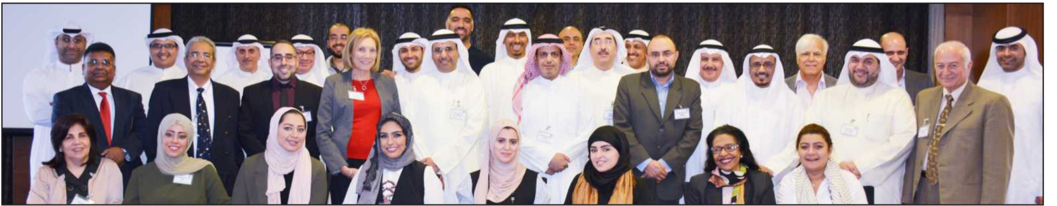
● جانب من المشاركين في الورشة