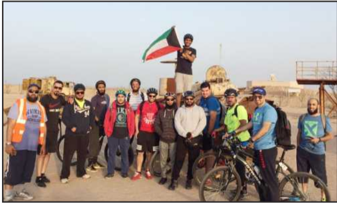
● رفع العلم