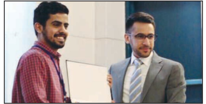
● هدية تذكارية

وغيرها، وعلى كل من جعل له خط سير حيث الاتفاق والاختلاف»، موضحا أن تأثير البعض يأتي عبر الترويج لمنتجات وأماكن معينة والبعض الآخر يؤثر بطريقة تابعة لرأي الجمهور كما يقال «الجمهور عاوز كده».