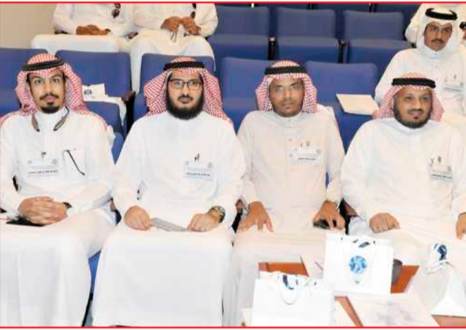
● جانب من الحضور

كيفية تقديم البحوث التي يجريها طلبة الدراسات العليا في جميع أنحاء العالم، ومهارات عرضها بشكل فعال خلال 3 دقائق بلغة مناسبة للمتلقى. بعد ذلك عقدت 11 جلسة شارك فيها نخبة من طلبة الدراسات العليا في جامعات دول مجلس التعاون الخليجي والتي قدموا من خلالها أوراق عمل.