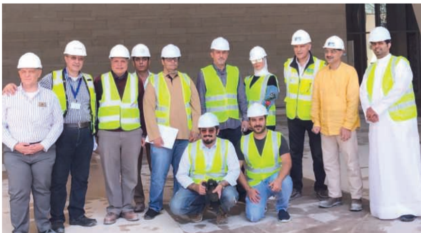
● وفد الإعلام لدى زيارته مدينة صباح السالم الجامعية

المشرفين على المشروع لمعرفة ما وصل إليه من إنجاز استوديوهات قسم الإعلام ، كونه منسق كلية الآداب منذ عام ٢٠٠٦ ، وكان من ضمن الوفد الذي سافر الى أمريكا وكندا لعمل وإيصال متطلبات الأقسام العلمية بكلية الآداب للمهندسين والاستشاريين ، مشيراً إلى أن الأشهر الست الماضية شهدت اجتماعات مشتركة مع الفرق الهندسية في حرم كلية الآداب الجديد بهدف مراجعة الخرائط الخاصة بمباني الاستوديوهات الإعلامية في الكلية وضمان تحقيق التعديلات المقترحة من قبل أعضاء هيئة التدريس بالقسم العلمي بهذا الخصوص التي أخذت بها الجامعة مشكورة .