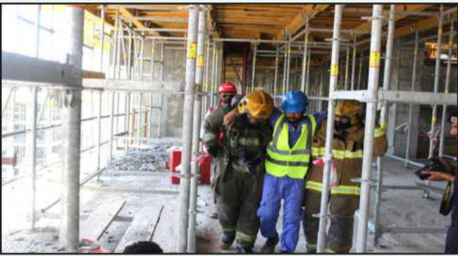
● إسعاف مصاب