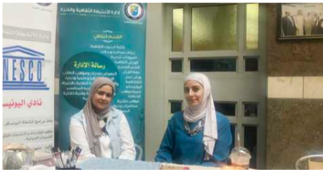
موظفنا الانشطة الثقافية خلال وجودهما في الجابرية

استفساراتهم الجامعية في مواقع مختلفة لكليات الجامعة بهدف زيادة الوعي الإرشادي لدى طلبة جامعة الكويت.