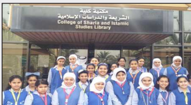
● طالبات جميلة بو حيرد أمام مكتبة الشريعة

قامت مدرسة «جميلة بو حيرد المتوسطة بنات» التابعة لمنطقة العاصمة التعليمية بزيارة لكلية الشريعة والدراسات الإسلامية. وقد رتب استقبال المدرسة وتنسيق الزيارة قسم العلاقات العامة في الكلية، وكان عددهم ٢٦ طالبة.