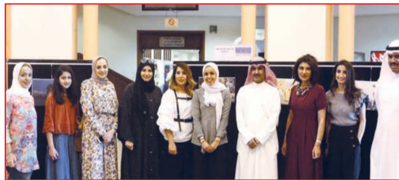
● أسرة الأنشطة الثقافية محتفية بالخطاف

والمعمارية، وتعبير عن مناطق متنوعة في الهند ما بين العاصمة الى جبال الهمالايا، معتمدة بذلك على فنون حضارات ثقافة الهند القديمة التي امتدت لأكثر من خمسة آلاف عام بأسلوب فني معاصر يربط بين تاريخ الهند والحياة اليومية والبساطة والألوان الحيوية وتعدد وجوه اللقطات، وتصوير بيئة الهند وطبيعتها وفولكلورها بأسلوب حديثي فريد يجمع بين البساطة والجماليات البصرية، التي يتواصل معها الإنسان العادي والفنان على حد سواء.