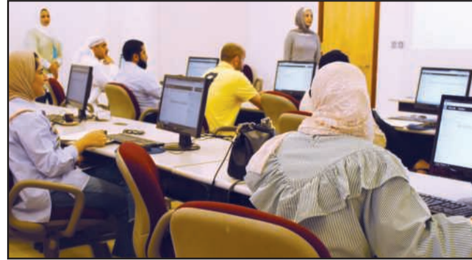
● جانب من التدريب

باستخدام باستخدام هذا النظام مع توضيح المزايا العديدة التي يطرحتها كإمكانية مشاركة المستندات مع الآخرين مع التمكن من التعديل والإضافة عليها، تكوين احداث لعمل دعوات لاجتماعات او مواعيد احتفالات بحيث يتم الرد بالموافقة والرفض من المدعوين .