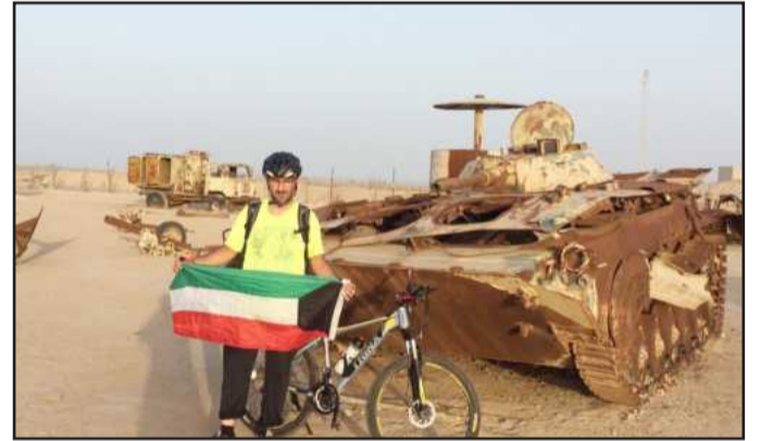
● مال الله أمام دبابة معطوبة من مخلفات الغزو