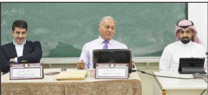
● اللجنة تتابع العروض

التدريس عن طريق اللقاءات الدورية وورش العمل. وانقسمت مراحل العرض إلى قسمين إذ يكون لكل فريق خلال المرحلة الأولى تقديم العرض المرئي للمشروع الخاص به خلال فترة لا تتعدى ١٥ دقيقة.