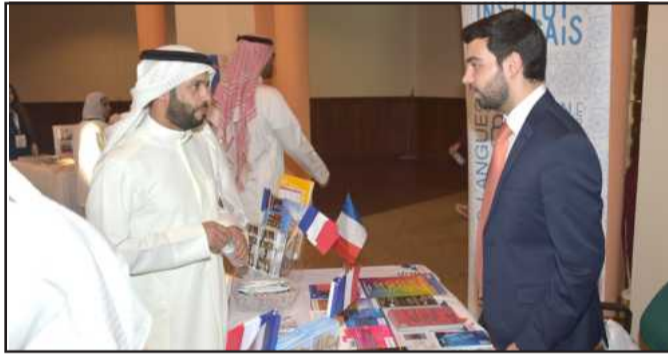
● جانب من المعرض

تندرج تحت سياسة الإدارة، حرصاً منها على تبادل الأفكار والقيم البناءة والإطلاع على النتاج الفكري والثقافي، وترحباً بجميع ثقافات العالم، وخلق حلقة وصل بين الطلبة ومحيطهم الخارجي.