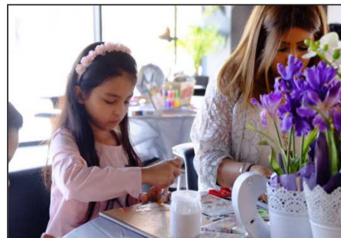
● تنفيذ إحدى اللوحات الفنية