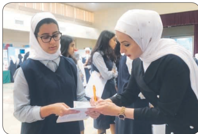
الجيعان ترد على الاسئلة والاستفسارات