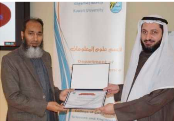
● تكريم المحاضر