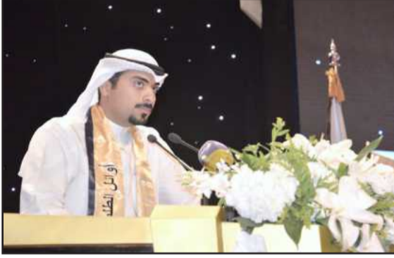
● الدخيل ملقيا كلمة المتفوقين