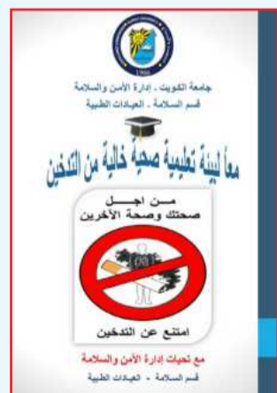
● شعار الحملة

لنشر الثقافة والتوعية الصحية والسلامة الوقائية بهدف النهوض بالجانب التوعوي والإرشادي والوقائي للأمن والسلامة. ولفت إلى أنها تأتي بالتعاون والتنسيق المسبق مع وزارة الصحة - لجنة التوعية الصحية.