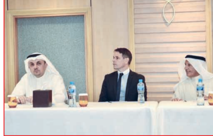
● جانب من إحدى جلسات المؤتمر