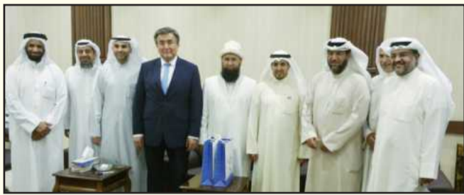
● عميد الشريعة والوفد القيرغيزي الزائر

الى تعزيز أواصر التعاون بين الجهتين العلميتين في مجالات التعليم والبحث العلمي وبرامج الخدمات، كما أنها ترسم الإطار العام لتطوير البرامج. وأيضاً المشروعات التي تعود بالنفع على الطرفين المتعاقدين والتي سيتم التفاوض بشأن شروط كل منها وبنوده على حده. وفي الختام أهدى عميد الكلية هدايا ودرعاً تذكارية للوفد الزائر.