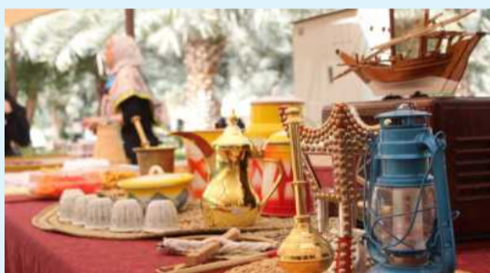
● من المعروضات التراثية

القديم هو تعريف أبنائنا الطلبة على المهن القديمة واحترامها والعمل على المحافظة عليها وتحسينها من الاندثار، مشيرة إلى حرص الجامعة على إشعار الطلبة بأهمية هذه المهن على الرغم من التطور العلمي الحاصل والرفاهية المنتشرة.