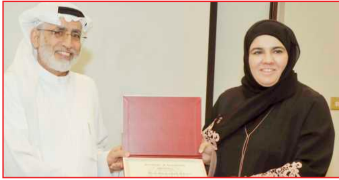
● وشهادة لضيء الفارس