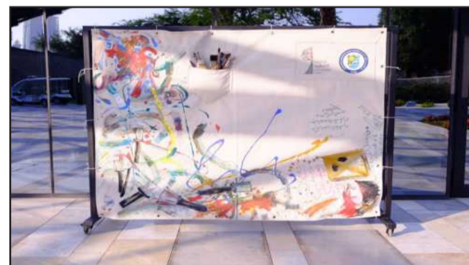
● إحدى اللوحات

انطلقت فعاليات كرنفال جامعة الكويت الفني مساء الاثنين الماضي في حديقة الشهيد واستمرت لمدة خمس ساعات بمجموعة من الأنشطة الفنية المتنوعة التي تهدف إلى تشجيع المشاركين وتحفيزهم لتطوير قدراتهم الفنية كبارا وصغارا وتأهيل الطاقات إضافة إلى ترسيخ أنشطة الفنون خارج الجامعة سعيا وراء تفريغ شحنات كبيرة لدى المشاركين