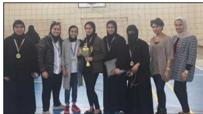
● الفريق الفائز مع الكأس

أقامت إدارة الأنشطة الرياضية الطلابية مباراة ودية لكرة الطائرة على صالة الألعاب الرياضية بكلية الآداب. وشارك في البطولة ٤ فرق من كليات الآداب والعلوم الاجتماعية والهندسة والعلوم الإدارية والعلوم، ولعبت المباراة على طريقة الدوري. وانتهت المباراة بفوز فريق كلية الهندسة بالمركز الاول و فريق كلية العلوم الحياتية بالمركز الثاني.