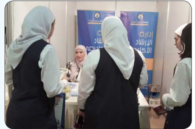
الرد على استفسارات الطالبات