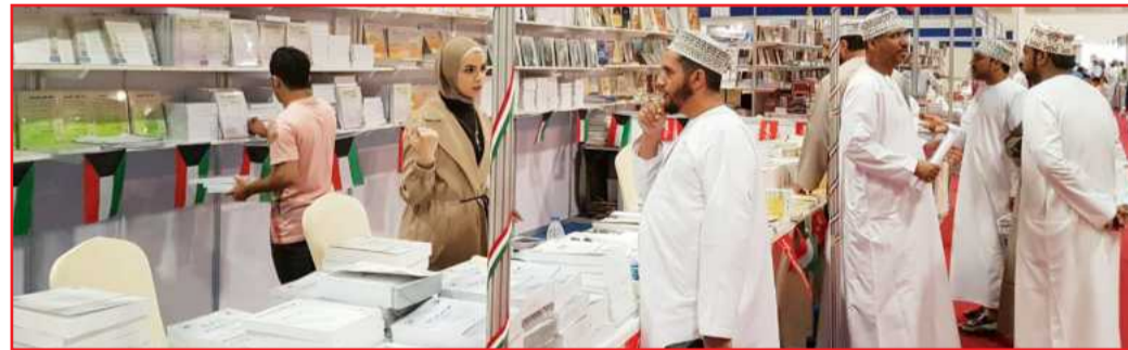
جناح مجلس النشر العلمي في معرض مسقط

العلمية ومؤلفات لجنة التأليف والتعريب والنشر، التي سارعوا إلى اقتنائها، الأمر الذي لاشك أنه يؤكد ثقة القارئ بها، ويعكس درجة الإقبال عليها. وقد حقق جناح مجلس النشر العلمي رقماً جيداً في بيع المطبوعات، حيث أوضحت الحصيلة تسويق ١١٥٧ نسخة، واستقطب ٧٨ مشتركا. ولا شك أن هذه المشاركة أثمرت عن نتائج طيبة، حيث تم التعريف بمطبوعات جامعة الكويت، والتواصل مع الزائرين من باحثين مهتمين وقراء متابعين وشخصيات أكاديمية، بما يعزز حركة النشر العلمي ويوطد الصلات العلمية مع الغير، فضلا عن إبراز دور جامعة الكويت كمؤسسة علمية ثقافية رائدة، تقوم بنشر إنتاجها العلمي خارج حدودها.