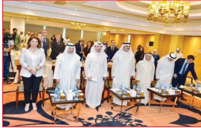
● افتتاح المؤتمر

ولفت إلى أن المشاركين في المؤتمر هم نخبة من الخبراء والمتخصصين وشركات ومؤسسات عالمية وإقليمية ومحلية، لمناقشة كل ما يتعلق بنمذجة معلومات البناء بشكل معمق وتبادل الخبرات والمعلومات والتقنيات والمتطلبات العالمية، مبيناً أهمية المؤتمر من خلال التواصل مع كبار المسؤولين والزلاء وفهم متطلبات نمذجة معلومات المباني (BIM) المتعلقة بالمشاريع الحالية والقادمة في الكويت ودول مجلس التعاون الخليجي والكشف عن فرص جديدة وكيفية استخدام وتطبيق الخدمات والحلول والمعدات الخاصة بها والإطلاع على أحدث التطورات واكتشاف التوجهات الحالية المتعلقة بمجال البناء في الكويت والخليج.