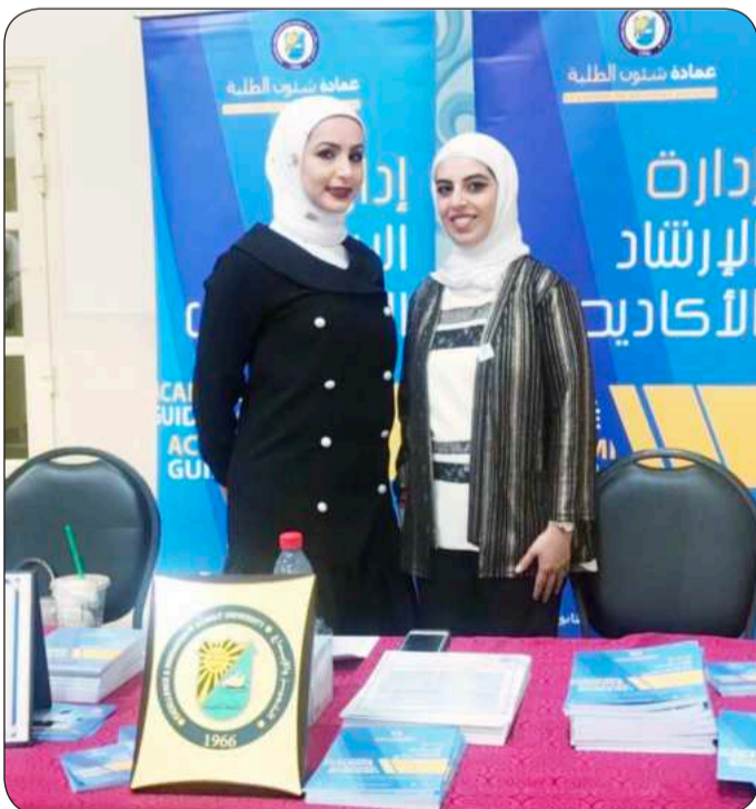
ركن الإرشاد الأكاديمي