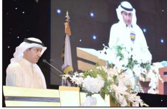
● د. النامي متحدثا