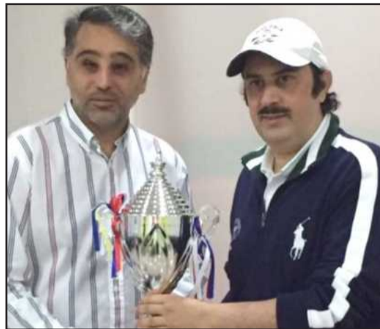
● تسليم الكأس للفائز