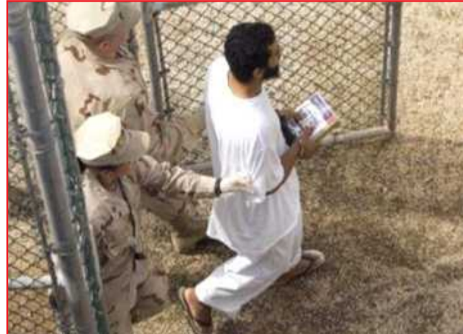
● مشاهد من المعتقل