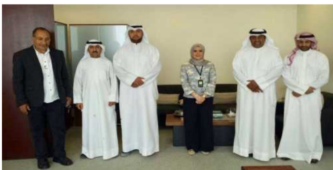
● الفريق أثناء الزيارة

للبيئة لعمل حملة توعوية لأبنائنا وبناتنا طلبة وطالبات جامعة الكويت عن أهمية الحفاظ على البيئة والتعريف بأسباب ومظاهر تلوث البيئة والأضرار الناجمة عن التلوث، موضحاً ان الإدارة تعمل على مزيد من