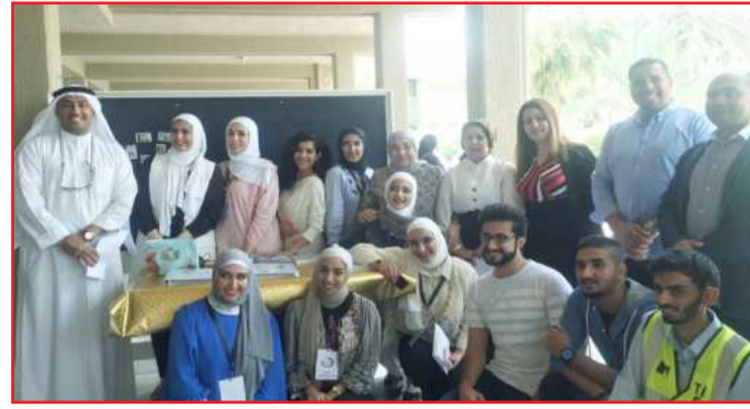
● جانب من حضور الاحتفالية