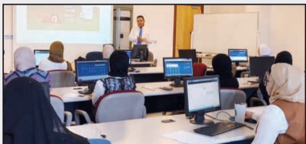
● جانب من إحدى الدورات

كتبت انتصار الفضلي : ينظم مركز الخوارزمي للتدريب وورش عمل لأعضاء هيئة التدريس بالجامعة وموظفي الإدارات المختلفة في الجامعة لتدريبهم على طريقة تفعيل والتعامل مع البريد الإلكتروني الجديد باستخدام نظام أوفيس 365 بالتعاون مع مركز نظم المعلومات في جامعة الكويت الذي وفر نخبة من المختصين في مجال الحاسب الآلي للقيام بعملية التدريب لتأهيل المشاركين وتطوير مهاراتهم التقنية مع التركيز على اتقانهم للبريد الإلكتروني باستخدام النظام الجديد أوفيس 365 بتطبيقاته المتعددة. وسيتم طرح هذه الورش لتطوير مهارات كافة العاملين في جامعة الكويت من طلبة وموظفين وأعضاء هيئة تدريس للتعريف بهذا النظام الجديد وهو خدمة الكترونية قامت شركة مايكروسوفت بتطويرها وقدمتها للمستخدمين على سحابة الانترنت وتشمل على حزمة من التطبيقات من أهمها: « البريد الإلكتروني Outlook، دليل الأشخاص People، التقويم Calender، التخزين على الانترنت OneDrive. وستركز محاور ورش العمل على التعرف بنظام الأوفيس 365، والتدريب على