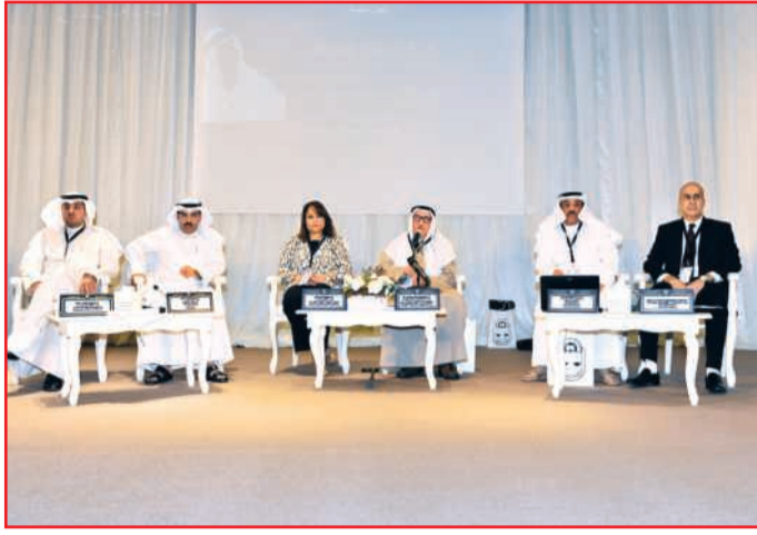
جانب من إحدى جلسات المؤتمر