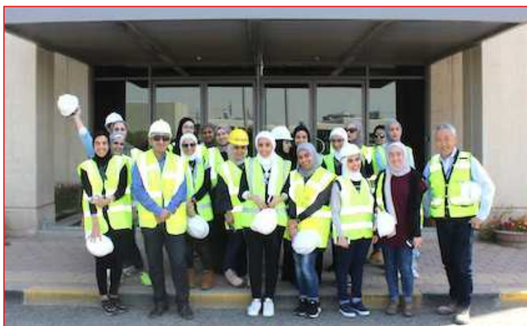
● طلبة العمارة أثناء الزيارة

الالتقاء بالمهندسين القائمين على المشروع لاطلاعهم على الأنشطة المتبعة في هذا النمط الضخم من المباني، ومعايشة كيف تتم التمديدات والتنسيق بين المهندسين والمعماريين في هذا الإطار، خاصة وأن هؤلاء الطلبة الزائرين سيصبحون إن شاء الله في المستقبل خريجين في تخصص العمارة الداخلية.