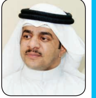
اعداد مهدي العجمي

من دار بالدنيا وطالت حياته يشوف اشياء ما تجيله على الببال يرى التغير في زمانه وذاته والوقت يكشف حال ويخفي احوال يا جاهل بالوقت هذي سواته لا تحسب انه مستقر على حال اسأل كبير السن عن ذكرياته ينيك عن ماضيه يا طيب الفال يعطيك عن جيله وعن بيناته دلایل تبقى على مر الأجيال