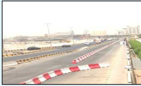
• تنظيم حارات طريق كيفان