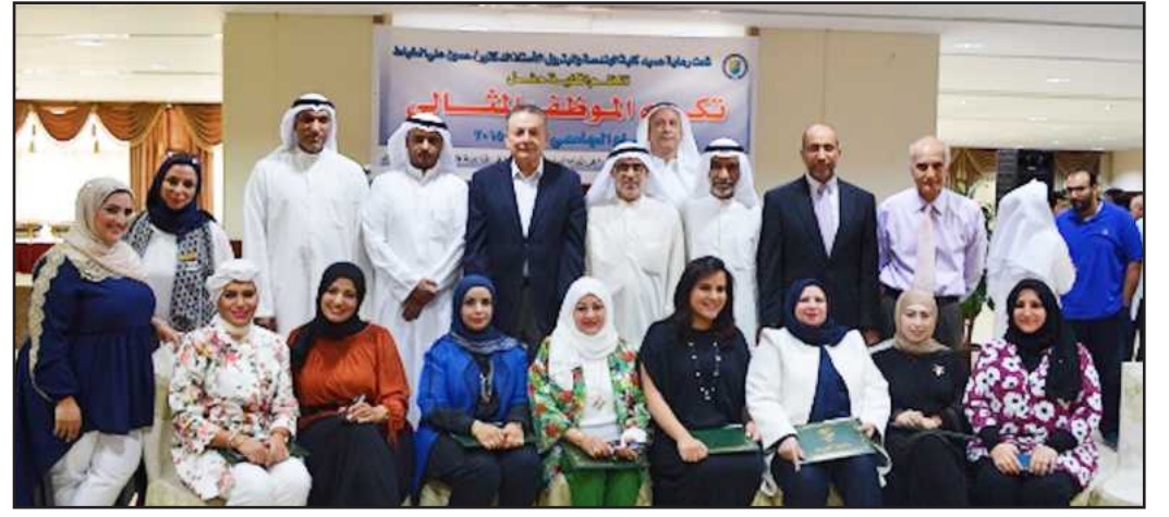
● لقطة تذكارية لأسرة كلية الهندسة والبتترول