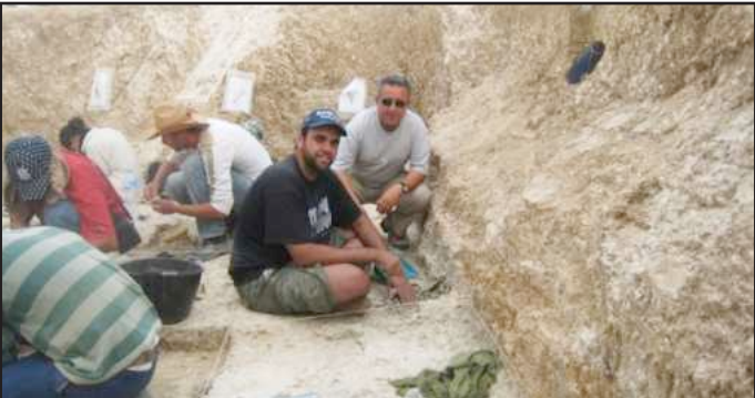
● حفريات الجزائر موقع ٢ مليون سنة