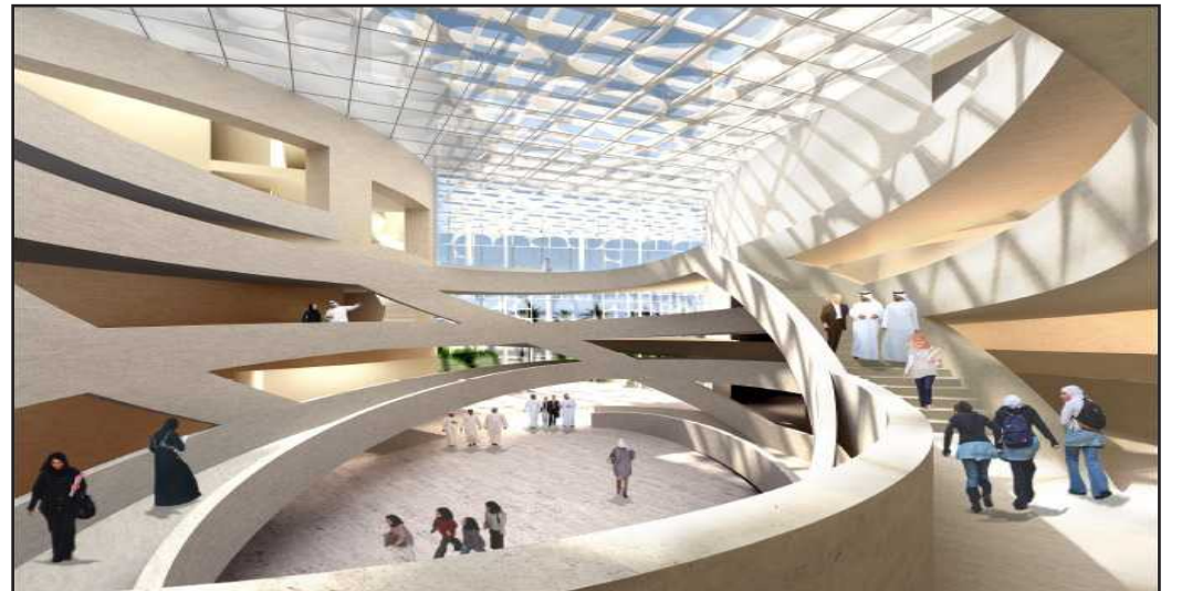
● تصميم داخلي فريد