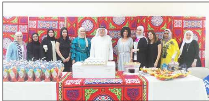
● حضور القسم الاعلامي