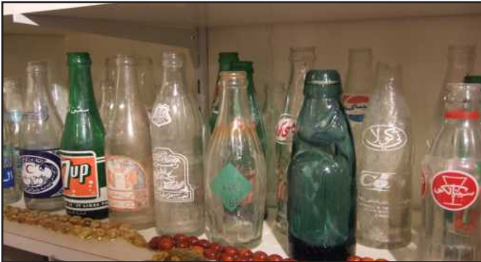
● زجاجات المياه الغازية القديمة

هذا وشارك د.أشكناني أثناء مراحل دراسته الجامعية في العديد من الأنشطة التاريخية والعلمية تمثلت في المشاركة بالمؤتمرات والمحاضرات والمعارض العلمية وكذلك أعمال التنقيب عن الآثار