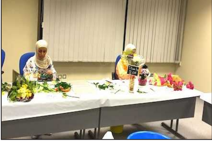
● جانب من الدورات