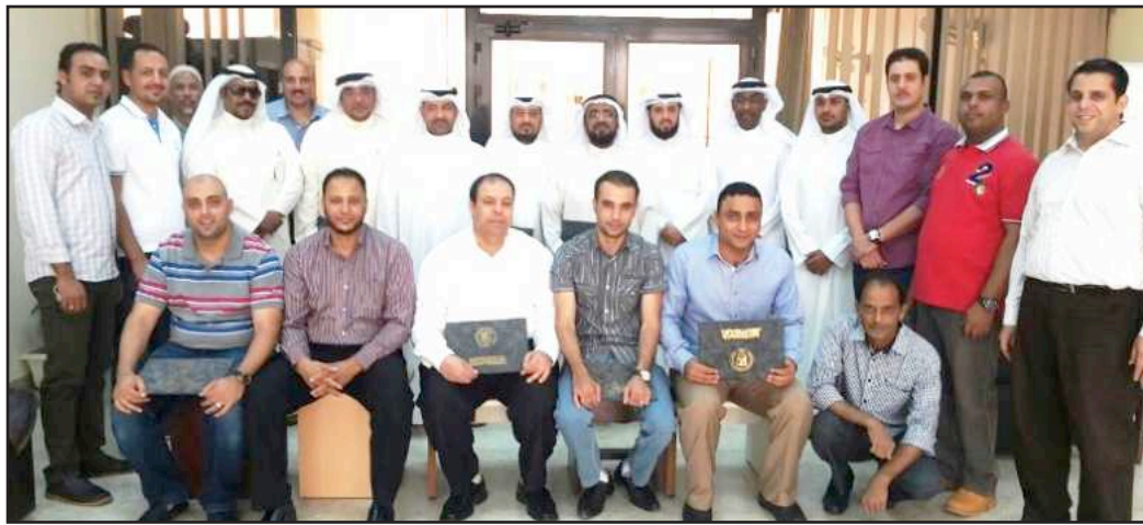
● المكرمون في لحظة تذكارية

من الإبداع والابتكار، وتوظيف قدرات موظفي مختلف إدارات العمادة عازيا هذا الأمر إلى أن المؤسسات تركز في المقام الأول على تطوير قدرات الموظفين في مختلف إدارات وأقسام المؤسسة والارتقاء بأدائهم.