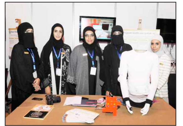
● طالبات مشروع العناية بالأم الحامل