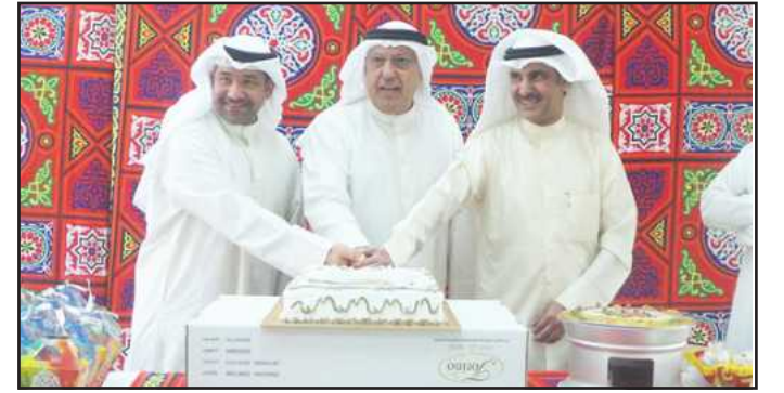
● قطع كعكة الحفل