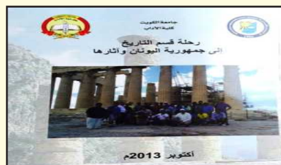
● غلاف الكتاب

بمشاركة أساتذة وطلبة القسم، حيث أصدر كتابا يحتوي على معلومات الرحلة والأماكن الأثرية والتاريخية.