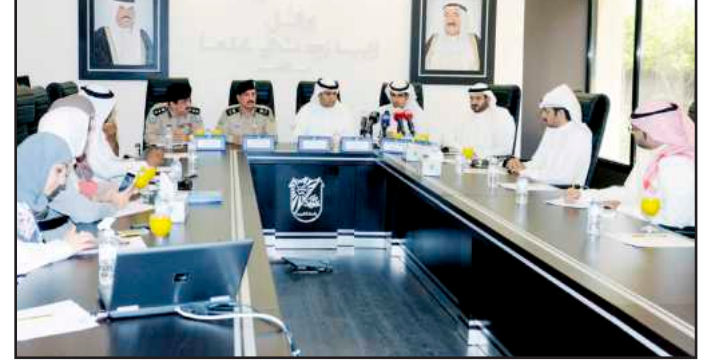
● جانب من المؤتمر