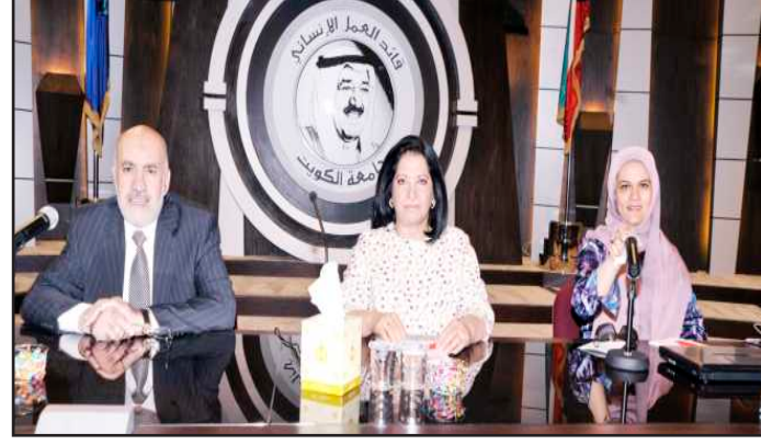
● المتحدثون باللقاء التثويري