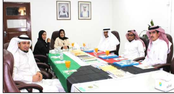
● جانب من الزيارة

والجدير بالذكر بأن الوفد اطلع على مجموعة اصدارات المركز وموجودات قسم المكتبة والأرشيف، وحصلوا على نماذج من آخر اصدارات المركز كإهداء.