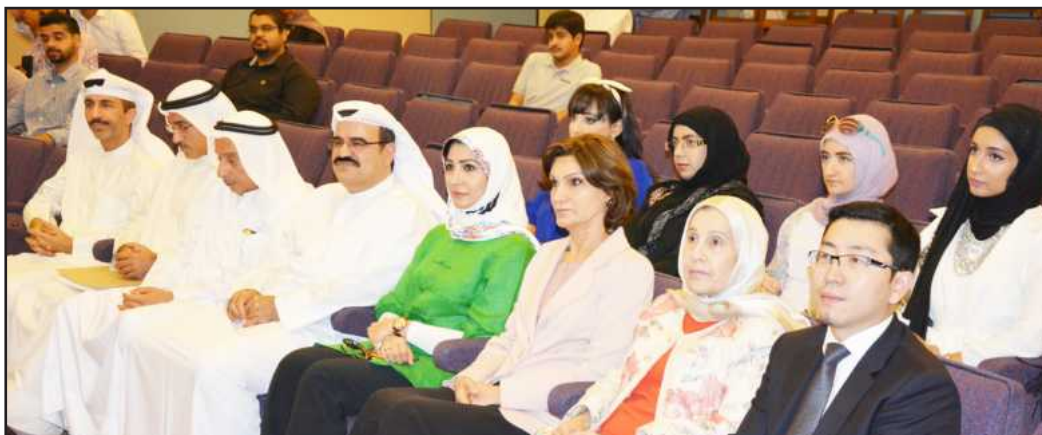
● مقدمة الحضور