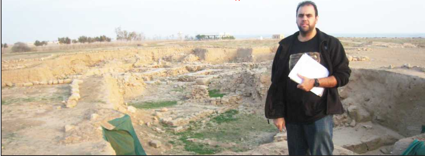
● موقع قصر الحاكم الملوني ٤٠٠٠ سنة ضمن بحث الدكتوراه