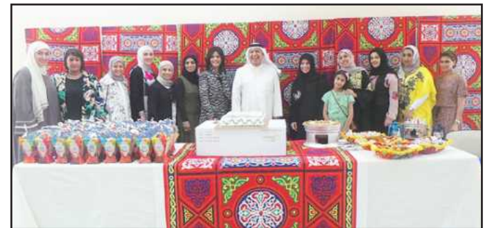
● ابتسامة لعدسة آفاق