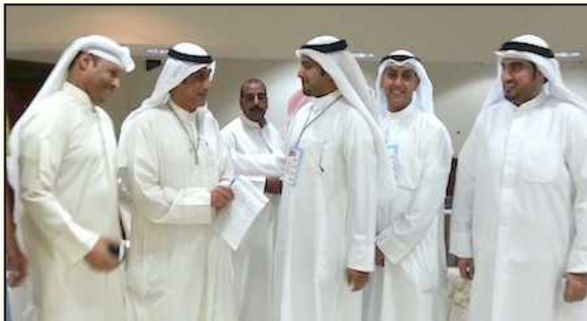
● جانب من الانتخابات