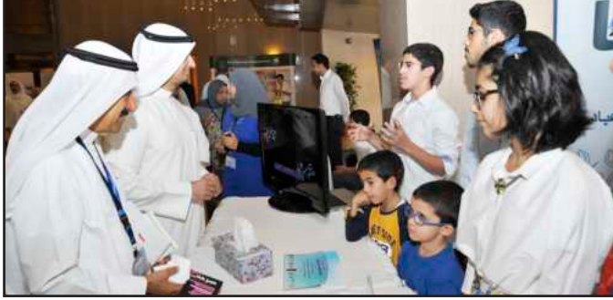
● جانب من المعرض