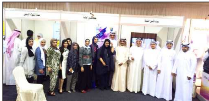
● لقطة تذكارية لموظفي شؤون الطلبة بحضور العميد