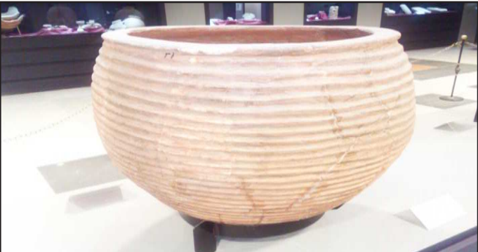
● فخاريات حضارة دلمون في فيلكا ٢٠٠٠ قبل الميلاد ضمن بحث دكتوراه