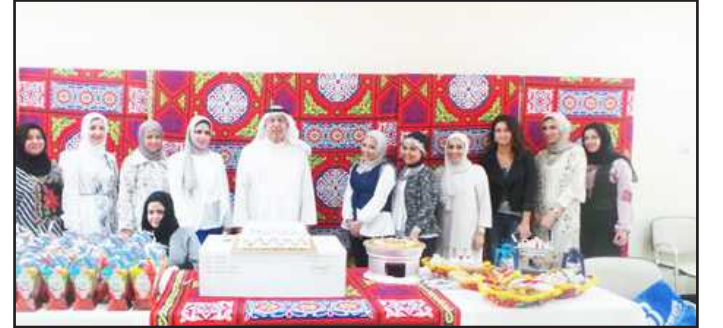
● لقطة تذكارية