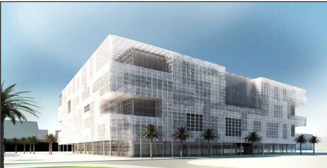
● جانب من المباني الجديدة

فكيف سعت جامعة الكويت إلى تكريس هذه الصورة الجميلة