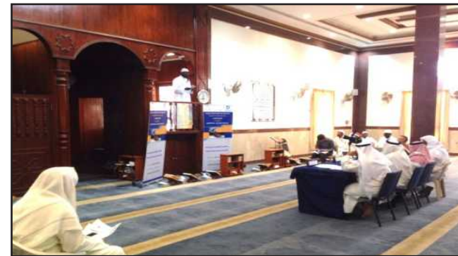
● من فعاليات المسابقة