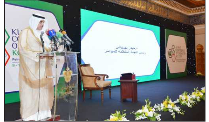
● في افتتاح مؤتمر الكيمياء

كمستشار بيئي معتمد من قبل جامعة الكويت ومرخص لإجراء الدراسات البيئية المتعلقة بالصناعة النفطية في دولة الكويت، كما عمل مستشاراً لدى مديرية الدفاع الكيماوي بوزارة الدفاع في دولة الكويت ومستشاراً لدى الهيئة العامة للتعليمات والخاصة بالعدوان العراقي وعضواً في مشاريع إعادة تأهيل البيئة الكويتية من آثار العدوان، ومحاضراً لدى كلية علي الصباح العسكرية.