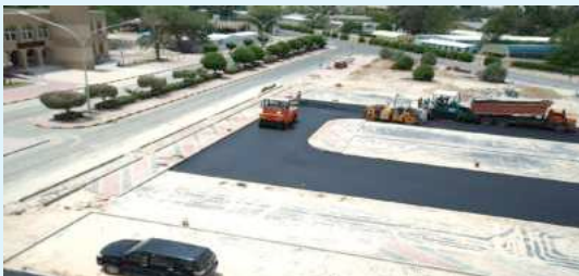
• سفلتة مواقف السيارات

من التكدس المروري بموقع الجامعة في كيفان من أجل تحقيق الانسياب والسيولة المرورية و أماكن تحميل وتنزيل الطلبة للدخول والخروج من الجامعة على طريق المطار ٥٥.