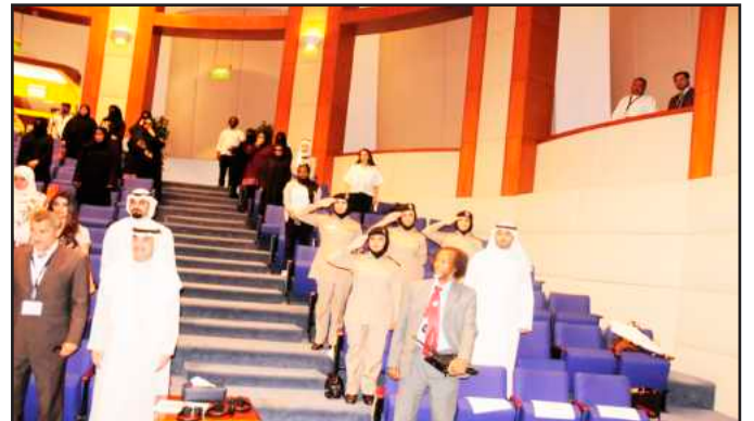
● حضور وزارة الداخلية