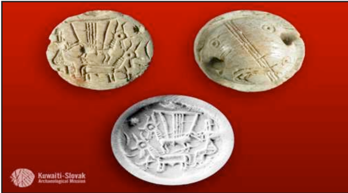
● الاختتام الدولونية قبل ٤٠٠٠ سنة ضمن بحث الماجستير

ونال جائزة أفضل مقال من المنظمة العالمية للفولكلور الشعبي – فيينا و كذلك جائزتين لباحثين علميين من مؤسسة الكويت للتقدم العلمي إضافة لعضوية الكثير من المراكز والمنظمات العربية والعالمية المهتمة والمتخصصة بالتاريخ وعلم الإنسان مثل دار الآثار الإسلامية بالكويت والمنظمة العالمية للفولكلور الشعبي التابعة للأمم المتحدة ومتحف ومعهد الدراسات الشرقية بالولايات المتحدة و مركز أمريكا للآثار ومنظمة مجتمع ناشيونال جيوغرافيك الأمريكية .