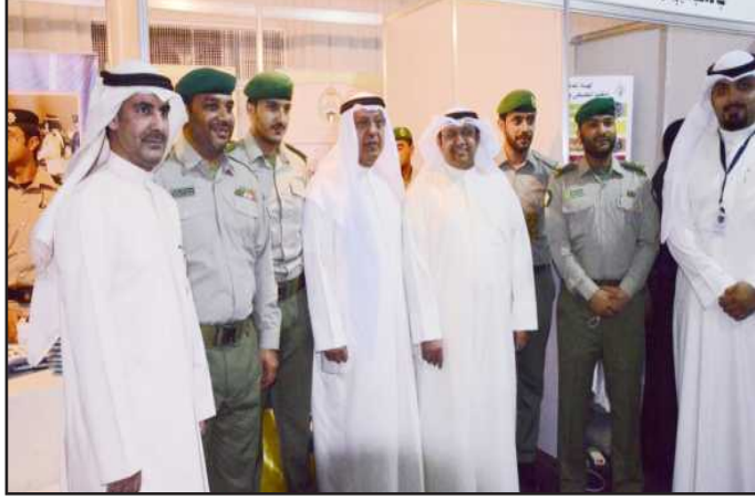
● ومشاركة للحرس الوطني