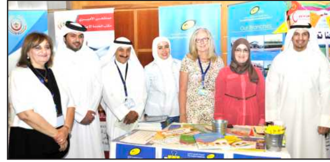
● لحظة تذكارية

دورها الحيوي الذي تقوم به في خدمة الجامعة والمجتمع، من خلال إقامة المؤتمرات والملتقيات الهادفة التي تناقش القضايا المجتمعية مساهمة منها في إيجاد الحلول العملية لتلك القضايا، بمشاركة نخبة عالمية، وإقليمية، ومحلية مميزة من المهتمين والمتخصصين في مجال تنشئة وصحة الأطفال بهدف التركيز على قضايا الألفية الثانية وهي من القضايا التي تحتاج المزيد من الاهتمام، لاسيما وأن الأطفال هم عصب بناء المستقبل وأمله. وأشار د.أسيري إلى أن الاهتمام بهذه