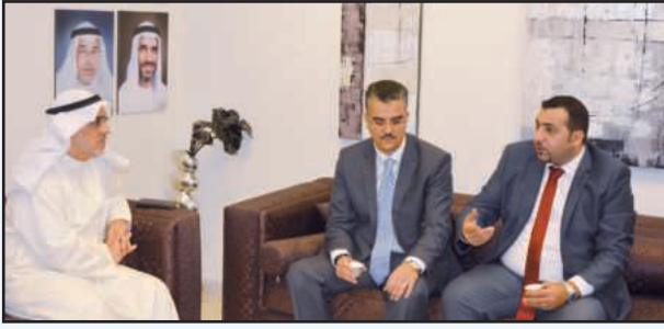
● جانب من الاجتماع مع هيئة الاعتماد

وتجدر الإشارة إلى أن الاعتماد في ١٧٠٢٥ هو أعلى مستوى من الجودة في العالم بمجال المختبرات.