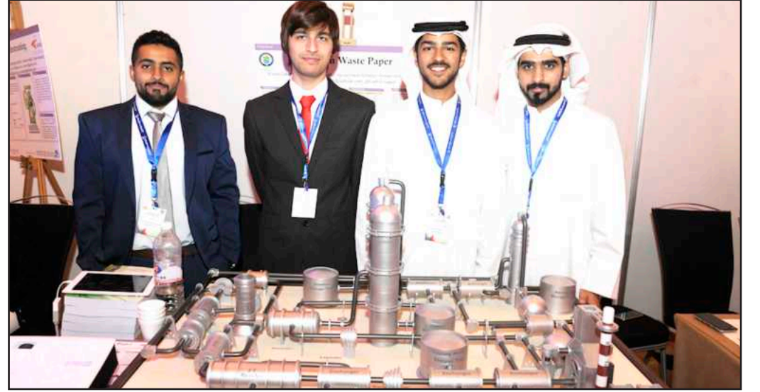
● طلاب مشروع إنتاج الطاقة من النفايات الورقية