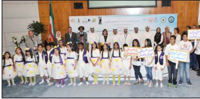
● من عرض وزارة التربية

المطيري:الأطفال أساس قيام أي مجتمع لذا يتوجب الاهتمام بهم ورعايتهم د.أسيري: الاهتمام بهذه الفئة من أهم المجالات التي تركز عليها الكلية وتهتم بها