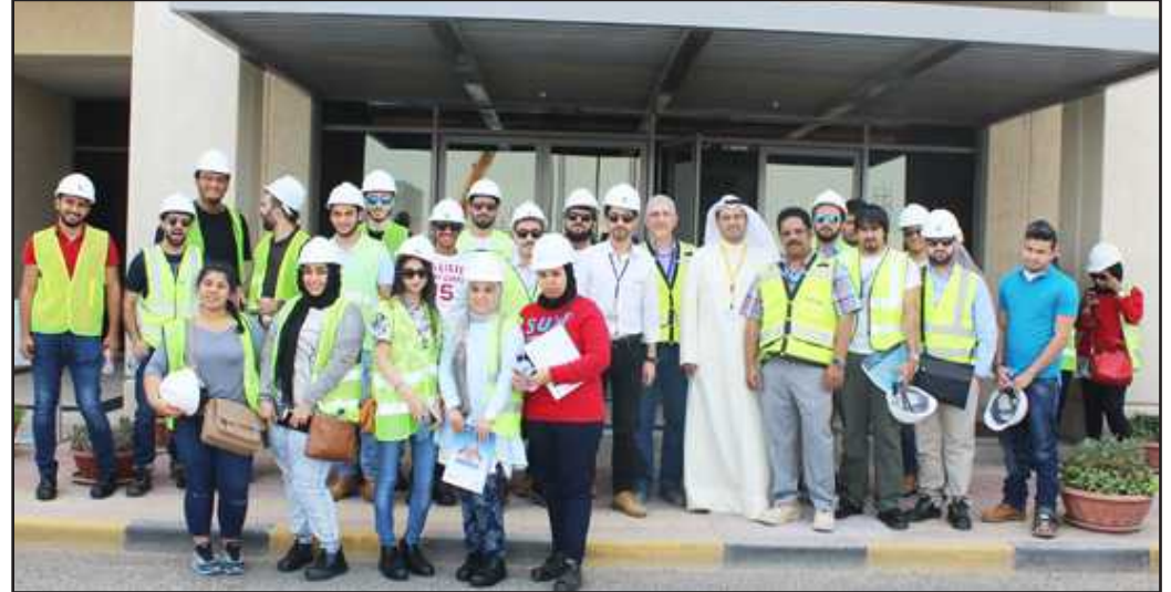
● وفد طلبة الكلية الأسترالية أمام مبنى البرنامج الإنشائي في الشداية