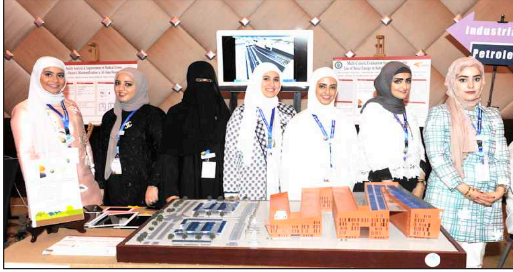
● طالبات مشروع الطاقة الشمسية في مدينة صباح السالم الجامعية