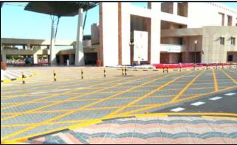
• صيانة الخطوط الأرضية