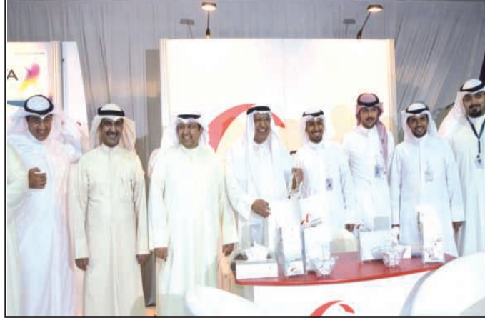
● مشاركة بنك بوبيان