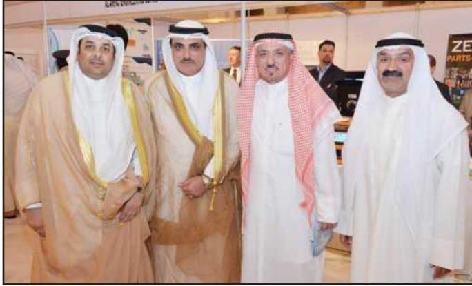
● مشاركة بأحد المعارض بحضور وزير العدل والأوقاف