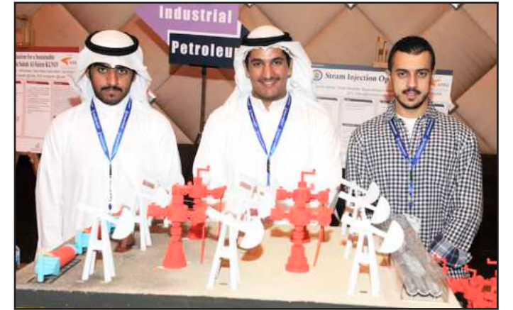
● طلاب مشروع إنتاج النفط الثقيل وتقليل الرمل المصاحب له