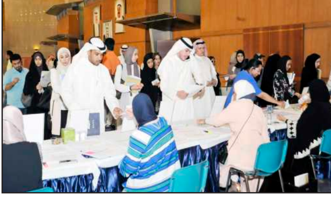
● تسجيل معلومات الطلبة

وأشارت إلى أن الكلية ساهمت مباشرة بثلاثة مقررات لدعم المستوى الأكاديمي لطلبة الدراسات العليا والمحافظة على نوعية أبحاثهم، وذلك باستحداث مقررات عامة تحت مظلة إدارة كلية الدراسات العليا مباشرة لأول مرة في تاريخ الكلية وغايتها تنمية قدرات الطالب على الكتابة العلمية وصقل مهاراته في التواصل وزيادة وعيه فيما يتعلق بالأمانة العلمية عند إجراء البحث والأخلاقيات الأخرى ذات العلاقة بالبحوث، وذلك أسوة بما هو متبع بالجامعات العالمية العريقة، والتخصيص لثلاثة مستويات لاختبار بمسمى (ITOAL) وهو اختبار لقياس مهارات اللغة العربية على غرار اختبار (TOEFEL).