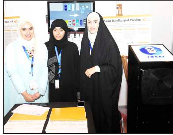
● طالبات مشروع حماية مواقف ذوي الاحتياجات الخاصة

وهذا المشروع عبارة عن استخدام الأوراق المستعملة والتي تعادل ٢,٧ طن من الأوراق المستعملة والتي تنتجها الكويت فقط ٤٧٪ يتم إعادة تدويرها والباقي يتم دفنه تحت الأرض كنفايات ورقية مما يسبب ضرراً للبيئة فنحن نستخدم هذه الأوراق لإنتاج منتجات نفطية كالديزل والكيروسين والبنزين المستخدم في محطات الوقود.