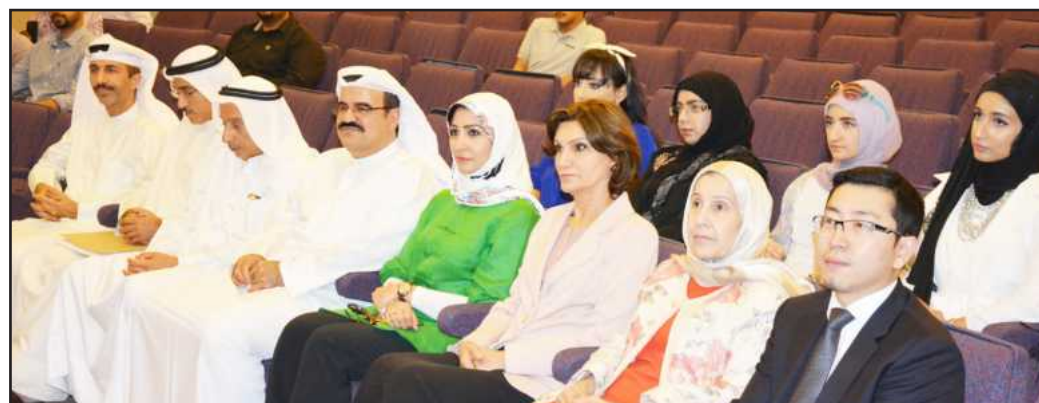
Audience members at the orientation ceremony

Besides, he explained that the company will cover all the expenses for the training