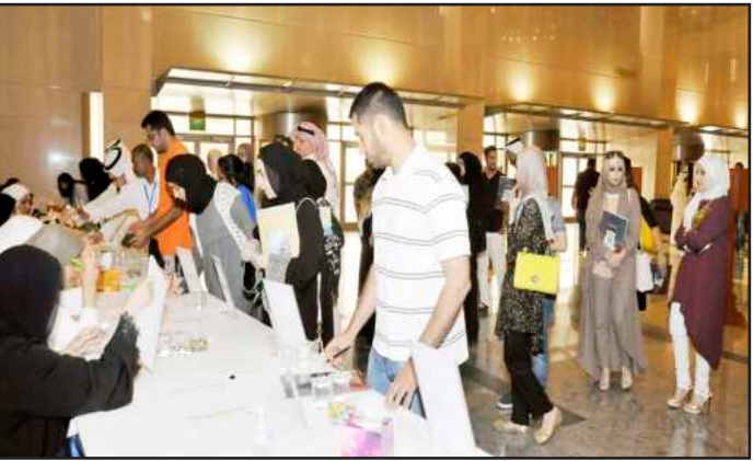
● على هامش اللقاء