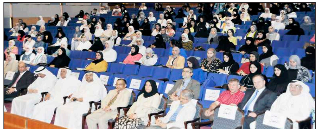
● جانب من الحضور