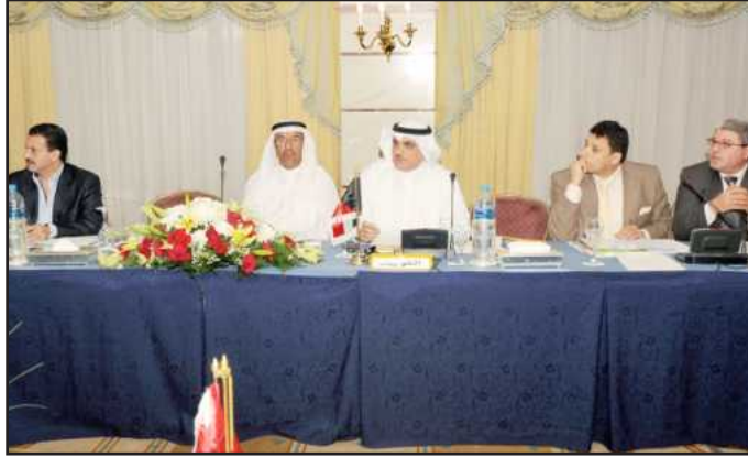
●..وفي أحد الاجتماعات