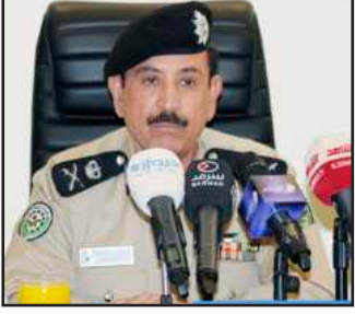
● اللواء عبدالله المهنا