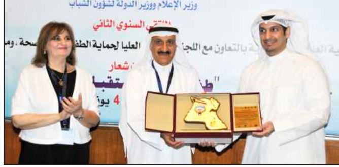
● تكريم ممثل وزير الاعلام