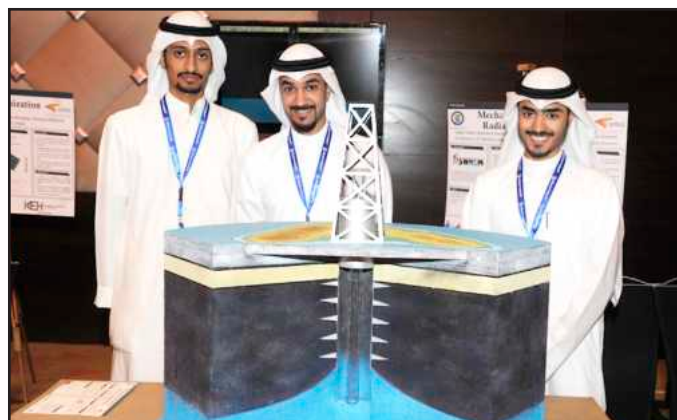
● طلاب مشروع تقليل إنتاج الماء وزيادة إنتاج النفط