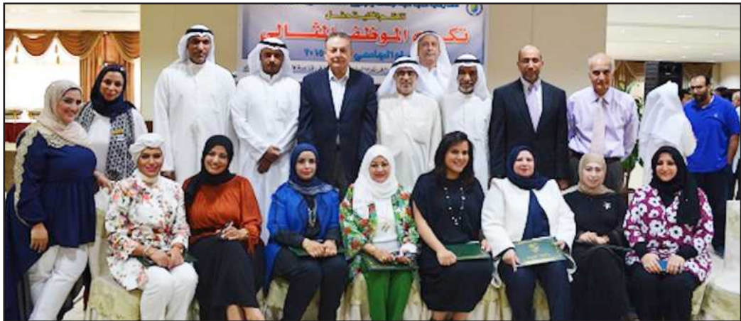
A group photo of the ideal employees at the College of Engineering and Petroleum