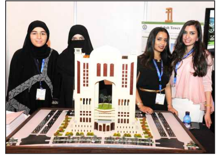
● طالبات مشروع «برج صباح»

كتبت شريفة العبد السلام: ينظم مركز التدريب الهندسي والخريجين في كلية الهندسة والبترول معرض التصميم الهندسي في نهاية كل فصل دراسي ويهدف هذا المعرض إلى قياس قدرة المهندس على العمل وقياس إمكانية تجاوبه مع سوق العمل، ومساعدة المهندس على اكتشاف جديد أو تحقيق تقدم علمي في تخصصه، ويبرز المعرض قدرات ومهارات المهندس الخريج، وأيضاً تظهر مشاريع متميزة ذات كفاءات عالية للوصول إلى براءة الاختراع. ويسلط المعرض الضوء لظهور بذرة اختراع أو اكتشاف علمي، ويوفر بيئة محفزة لثقافة الإبداع وتطبيق الحلول التكنولوجية في الحياة العملية بطريقة سهلة وممتعة، ويساهم في توظيف طاقات مهندسي المستقبل والاستفادة من أفكارهم وابتكاراتهم، وكذلك يحث الطالب على البحث عن المعلومة العلمية التي تفيد المشروع، وتنمية التعاون والمناقشة العلمية بين أعضاء الفريق الجماعي، ويشجع المعرض الطلبة على إبراز إنجازاتهم العلمية وتوثيقها تقديرًا لجهودهم ومثابرتهم في التحصيل العلمي. وفي معرض التصميم الهندسي