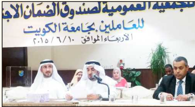
● مناقشة التقريرين الإداري والمالي في الجمعية العمومية

الصندوق أيضاً بتقديم مساعدات مالية لتغطية حاجة ملحة تقدرها إدارة الصندوق وتكون بسبب خارج عن إرادة العضو، ويقدم الصندوق قروضا حسنة بدون فوائد لتغطية ضائقة مالية للعضو بناء على طلبه وفق الشروط والضوابط المنصوص عليها، وكذلك يقدم الصندوق دعماً مالياً لبعض الخدمات المقدمة للموظفين مثل الدعم المقدم لرحلات العمرة وحجز تذاكر السفر والشاليهات والرحلات السياحية الخارجية والداخلية إضافة إلى تذاكر المراكز الترفيهية المحلية. كما يقدم الصندوق العديد من الخدمات الاجتماعية والترفيهية والدينية: حيث تقدم إدارة الصندوق مجموعة متكاملة من الخدمات الاجتماعية والترفيهية والدينية تشمل الرحلات السياحية الخارجية والداخلية كالشاليهات والمراكز الترفيهية الأخرى والمخيمات الربيعية إضافة إلى رحلات العمرة سواء عن طريق الطيران أو عن طريق البر، علماً بأن جميع هذه الخدمات تقدم للأعضاء وأسرةهم بدعم مالي يصل إلى ٥٠٪ من التكلفة ويقدم بعضها مجاناً مع تحمل إدارة الصندوق كامل التكلفة وفق الشروط والضوابط، وترتبط إدارة الصندوق باتفاقيات تفاهم مع مجموعة من الشركات والمؤسسات التجارية والثقافية يحصل بموجبها العضو على نسبة خصم مقرر نظير الحصول على هذه الخدمة، ومنها شركة الاتصالات المتنقلة زين - سفريات الغانم - الخطوط الجوية البريطانية - عناية للتأمين - المركز العلمي.