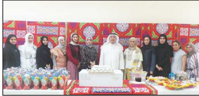
● عميد شؤون الطلبة يتوسط موظفات العمادة