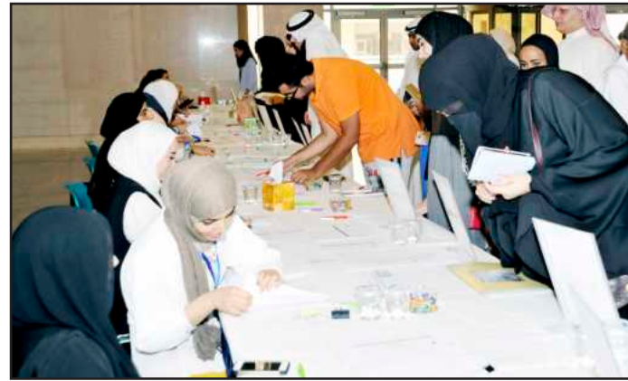
● مراجعة للبيانات

والمهني المبني على الحجة والبرهان، والحكمة ومعرفة سبل وطرق المعرفة للرقى العلمي والتصدي للمشاكل والبحث عن حقيقة الأمور، والتي هي أساس البحث العلمي بالأسس والوسائل العلمية والقدرة على التحليل والاستنتاج بالابتعاد عن السلبيات والمخاطر، وإيجاد الحلول لتلك القضايا واستثمارها في عالم المعرفة على المستوى المحلي والعالمي. وذكرت أ.د. العوضي أن التحدي لا يقتصر على إنجاز البحث ونشر الأطروحة لنيل الدرجة العلمية العليا، وإنما يمتد الطموح لنشر نتائج الأبحاث في أرقى المجالات العلمية العالمية المحكمة، متمنية أن تتميز البحوث بالإبداع الذي يؤدي إلى تسجيلها كبراءة اختراع لتحظى الجامعة بمكانة وتميز إقليمي وعالمي بجهود طلبتها الحثيثة.