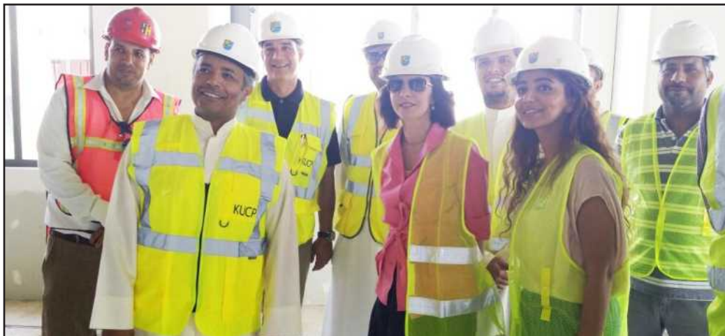
● وفد وزارة الشباب مع د.قتيبة رزوقي