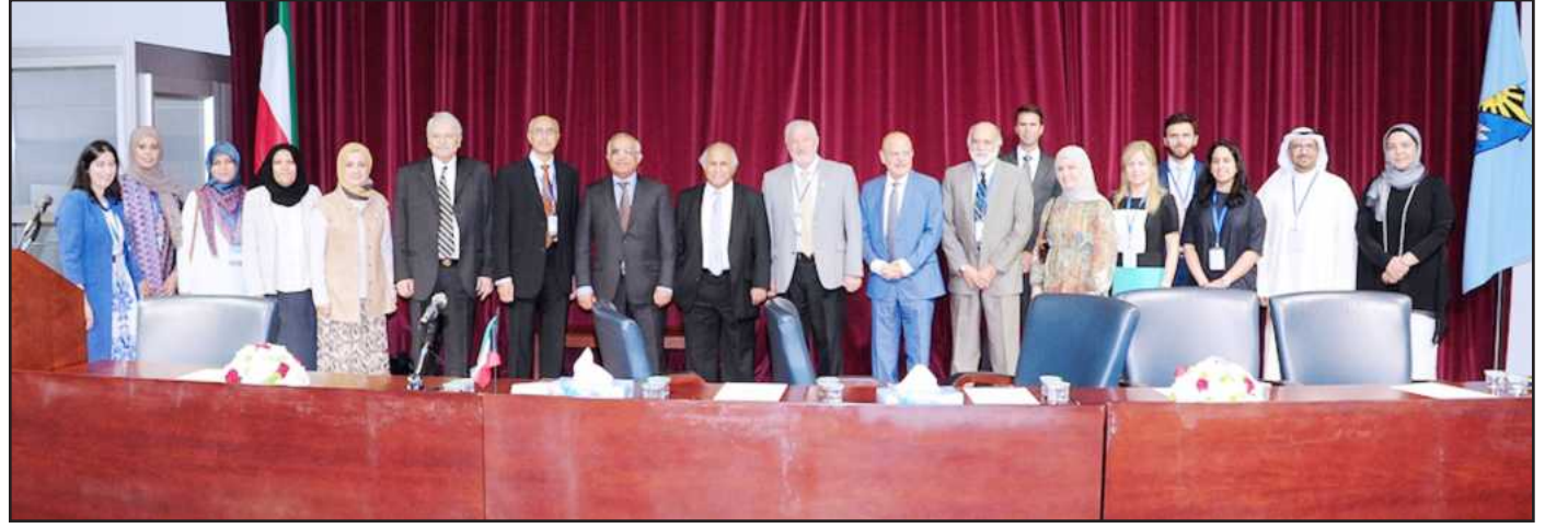
● لقطة تذكارية للضيوف والمحاضرين واللجنة المنظمة