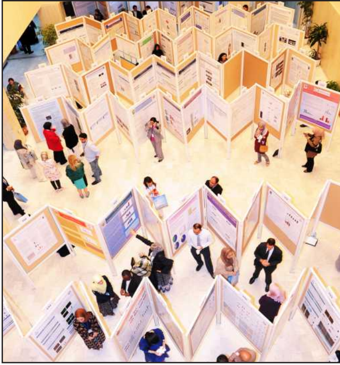
● منظر علوي للملصقات العلمية