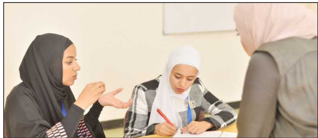
Students preparing their argument strategy

teams, taking part in the championship, at the Qatar National Convention Center. Furthermore, the Minister of Education and Higher Education, Dr. Bader Al-Essa, congratulated the academic community especially the participating students, as it is the first prize of such sort, offered by the IUADC and the Qatar Debate Center. Moreover, the Acting-President of KU, Prof.