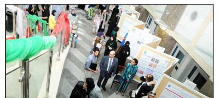
A view from the top

by different departments at the college in the form of posters: 56 from the Department of Medical Laboratory Sciences, seven from the Department of Physical Therapy, 12 from the Department of Occupational Therapy, 16 from the Department of Radiology Science, 15 from the Department of Health Information Management, including the participation of former graduates and graduate students.