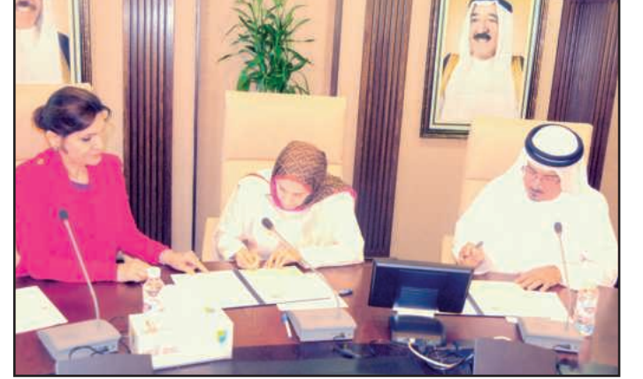
● أثناء توقيع الاتفاقية

مجلس التعاون، وشكر هذه المبادرة متمنيا أن تكون هذه الاتفاقية بداية لتعاون أكبر في كافة المجالات العلمية والأكاديمية وكافة الأنشطة حتى تحقق الهدف من تلك البروتوكولات وتفعيلها . وجدير بالذكر أن مركز جمعة الماجد هو هيئة خيرية علمية ذات نفع عام تعنى بالثقافة والتراث في دبي والعالم العربي والإسلامي، ويضم هذا المركز بين أنشطته المتعددة كلية للدراسات الإسلامية والعربية يدرس بها نحو ٣٧٠٠ طالب وطالبة. ويسعى المركز إلى جمع التراث الإنساني وحفظه والتعاون الثقافي وتبادل الخبرات مع الهيئات الثقافية ومراكز البحث العلمي. ويذكر أن الشيخ جمعة الماجد مؤسس ورئيس مركز جمعة الماجد للثقافة والتراث إلى جانب كونه من أنجح رجال الأعمال في دبي، كما يعد أحد رجال الثقافة والفكر والعمل الخيري في دولة الإمارات العربية المتحدة والخليج العربي فقد أسس المدارس الأهلية الخيرية، وكلية الدراسات العربية والإسلامية، التي تمنح شهادة البكالوريوس في علوم اللغة العربية وفي الدراسات الإسلامية لأبناء المعوزين من دول الخليج والدول الفقيرة الأخرى مجاناً، بل ويمنح طالب الكلية مخصصاً شهرياً، وهو أحد مؤسسي جمعية بيت الخير لرعاية العائلات الفقيرة. وقد نال على جهوده في خدمة الإسلام والثقافة العديد من الجوائز من بينها جائزة الملك فيصل العالمية لخدمة الإسلام عام ١٩٩٨م، وجائزة شخصية العام الثقافية لدولة الإمارات العربية المتحدة عام ١٩٩٢م، وجائزة المساهمين في محو الأمية وتعليم الكبار من وزارة التربية والتعليم الإماراتية عام ١٩٩٥م، وجائزة القرنين للشخصيات الثقافية عام ٢٠٠٤ في الكويت، و نوط القدس من الرئيس الفلسطيني محمود عباس سنة ٢٠٠٥، وجائزة تريم عمران للمؤسسات الثقافية الرائدة عام ٢٠٠٧ في الشارقة .