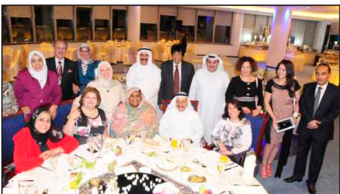
● صورة جماعية

وأضافت د. القاضي أن دور منظمات المجتمع المدني ليس جديداً في الوطن العربي بل يمتد لأكثر من خمسة عقود وعملت هذه المنظمات في مجالات مختلفة سواء للدفاع عن المرأة ضد التمييز بالقانون أو تشريعات الدولة أو لمساعدة المرأة أن تكون مستقلة مادياً عن طريق التمكين الاقتصادي سواء عن طريق التدريب أو القروض وأيضاً في المجال السياسي المتمثل في المطالبة بحق المرأة في المجال السياسي، لتمثيلها في البرلمان أو مساعدة النساء في التدريب لشغل مراكز سياسية، وليس فقط المنظمات في المجتمع المدني على المستوى المحلي لكن هناك منظمات دولية لهم دور بارز في تمكين المرأة في جميع أنحاء العالم.