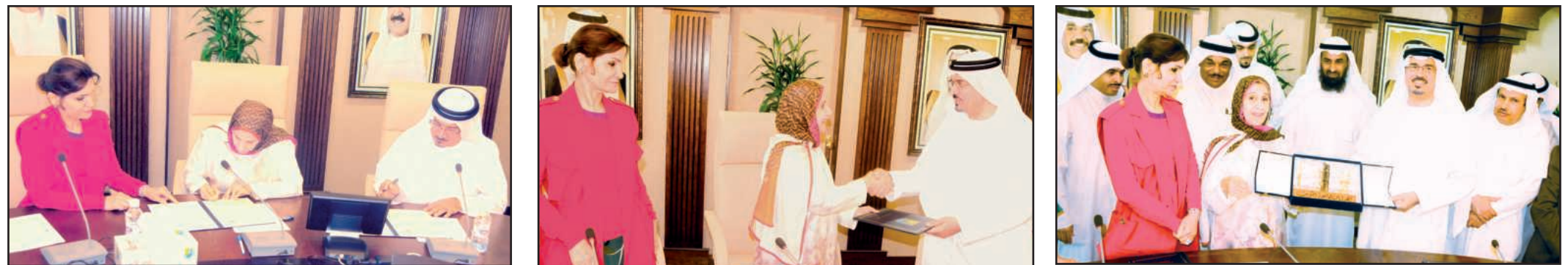
Prof. Al-Hajji signing the academic agreement