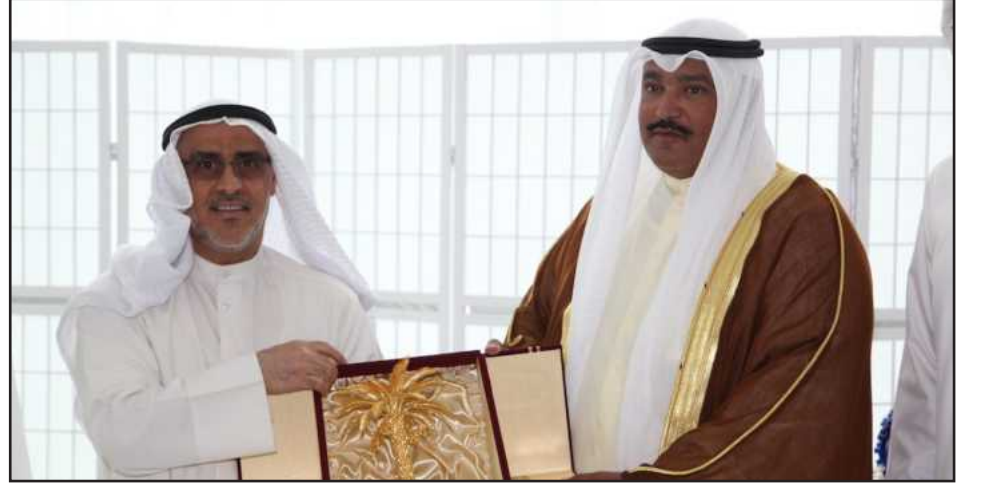
● درع تذكاري

كتب حمد العبدلي: تحت رعاية وحضور الشيخ فهد السعد وبدعم من مؤسسة البترول الكويتية، اختتمت كلية الهندسة والبتترول مسابقة الإبداع الهندسي الثانية لخدمة ذوي الاحتياجات الخاصة لطلبة الثانوية العامة، برعاية بنك بوبيان وشركة عيسى اليوسفي، وبحضور عميد الكلية أ.د. حسين الخياط والمدارس المشاركة. وأشاد الشيخ فهد السعد بالمسابقة مبيناً أن من شأنها كشف مواهب الشباب، وتنمية قدراتهم وصقل مهاراتهم، وتطوير إبداعاتهم، وإذكاء روح المنافسة بينهم، مضيفاً أن ذلك تجسيد للاهتمام الدائم، والرعاية الشاملة التي يوليها لأبنائه الشباب قائد المسيرة أمير البلاد وولي عهده الأمين. وأشاد بموضوع المسابقة الذي يهدف إلى خدمة ذوي الاحتياجات الخاصة، ومساعدتهم للقيام بدور فعال في خدمة مجتمعهم ووطنهم فكل الشكر، للقائمين