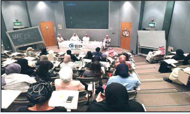
● جانب من المحاضرة