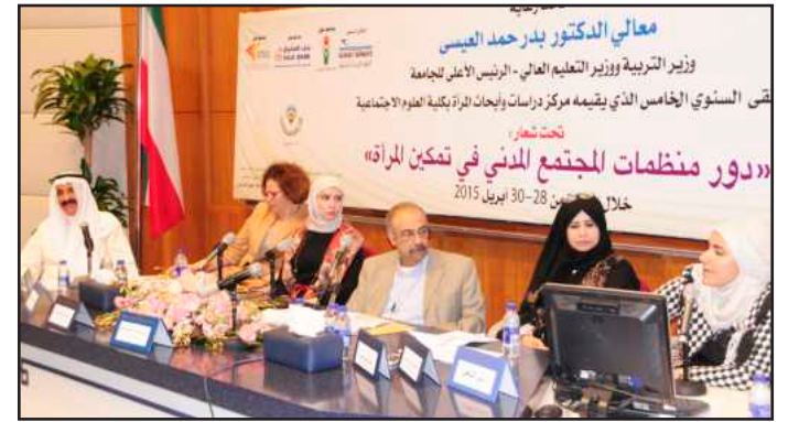
جانب من الجلسات