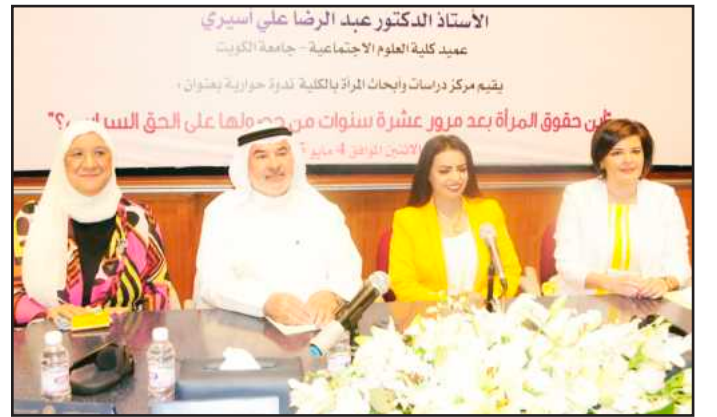
● المتحدثون في الندوة