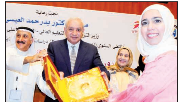
دفع تذكاري من الوزير