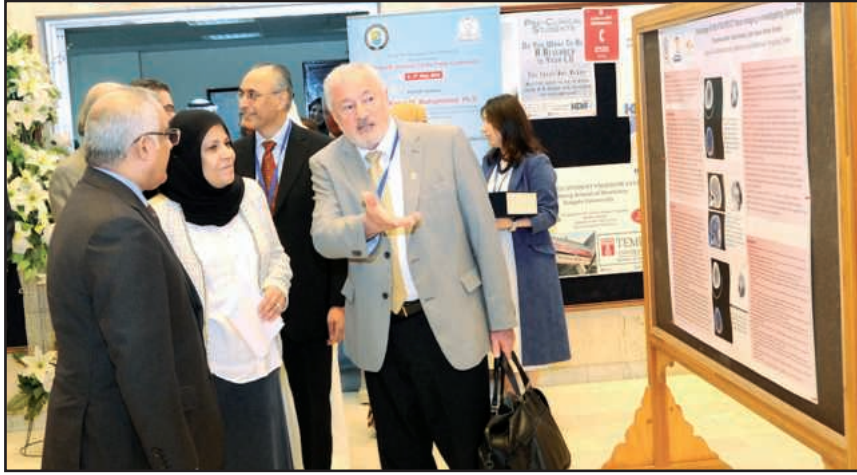
● نقاش علمي