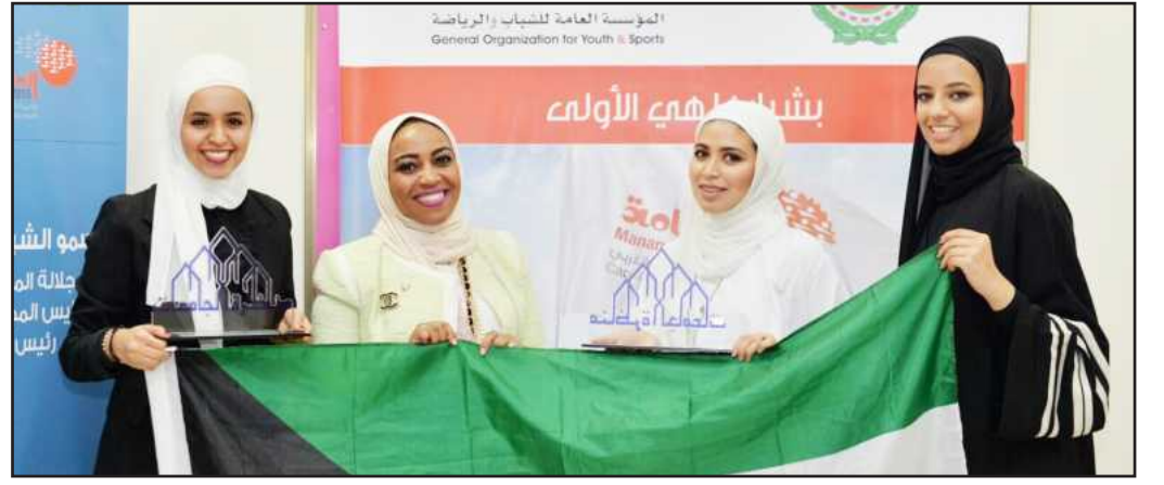
● طالبات الجامعة يحملن علم الكويت في البطولة