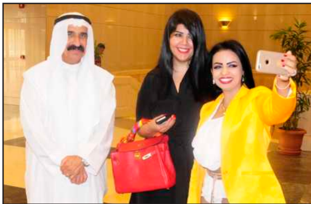
● سيلفي أثناء الفعالية