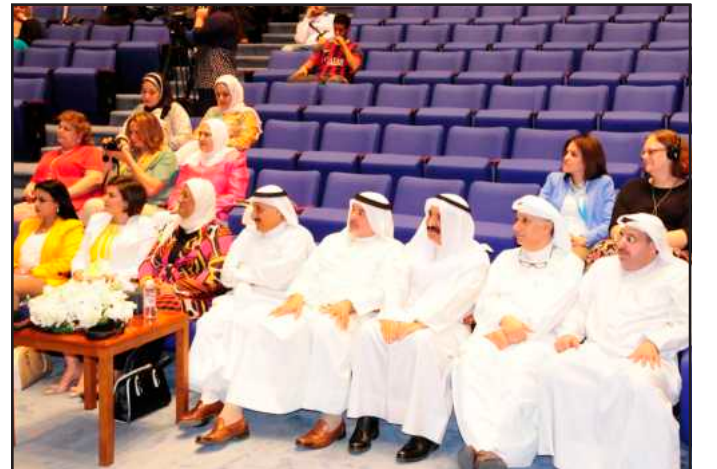
● مقدمة الحضور