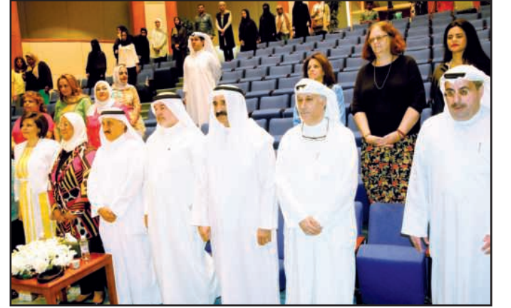
● أثناء عزف السلام الوطني

وأكد أسيري ان مركز دراسات وأبحاث المرأة بالكلية يعتبر المركز