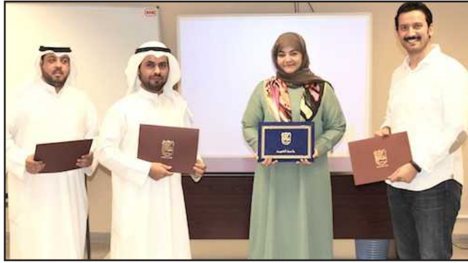
● حليلة غريب مع المشاركين في برنامج لغة الإشارة