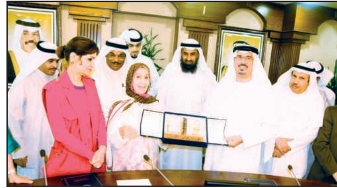
● هدية تذكارية مقدمة من جامعة الكويت

مجلس التعاون، وشكر هذه المبادرة متمنيا أن تكون هذه الاتفاقية بداية لتعاون أكبر في كافة المجالات العلمية والأكاديمية وكافة الأنشطة حتى تحقق الهدف من تلك البروتوكولات وتفعيلها . وجدير بالذكر أن مركز جمعة الماجد هو هيئة خيرية علمية ذات نفع عام تعنى بالثقافة والتراث في دبي والعالم العربي والإسلامي، ويضم هذا المركز بين أنشطته المتعددة كلية للدراسات الإسلامية والعربية يدرس بها نحو ٣٧٠٠ طالب وطالبة. ويسعى المركز إلى جمع التراث الإنساني وحفظه والتعاون الثقافي وتبادل الخبرات مع الهيئات الثقافية ومراكز البحث العلمي. ويذكر أن الشيخ جمعة الماجد مؤسس ورئيس مركز جمعة الماجد للثقافة والتراث إلى جانب كونه من أنجح رجال الأعمال في دبي، كما يعد أحد رجال الثقافة والفكر والعمل الخيري في دولة الإمارات العربية المتحدة والخليج العربي فقد أسس المدارس الأهلية الخيرية، وكلية الدراسات العربية والإسلامية، التي تمنح شهادة البكالوريوس في علوم اللغة العربية وفي الدراسات الإسلامية لأبناء المعوزين من دول الخليج والدول الفقيرة الأخرى مجاناً، بل ويمنح طالب الكلية مخصصاً شهرياً، وهو أحد مؤسسي جمعية بيت الخير لرعاية العائلات الفقيرة. وقد نال على جهوده في خدمة الإسلام والثقافة العديد من الجوائز من بينها جائزة الملك فيصل العالمية لخدمة الإسلام عام ١٩٩٨م، وجائزة شخصية العام الثقافية لدولة الإمارات العربية المتحدة عام ١٩٩٢م، وجائزة المساهمين في محو الأمية وتعليم الكبار من وزارة التربية والتعليم الإماراتية عام ١٩٩٥م، وجائزة القرنين للشخصيات الثقافية عام ٢٠٠٤ في الكويت، و نوط القدس من الرئيس الفلسطيني محمود عباس سنة ٢٠٠٥، وجائزة تريم عمران للمؤسسات الثقافية الرائدة عام ٢٠٠٧ في الشارقة .