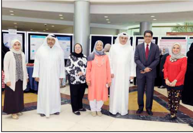
لقطة تذكارية تصوير حسام محمدي :