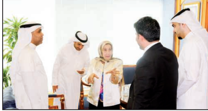
● أثناء الحوار