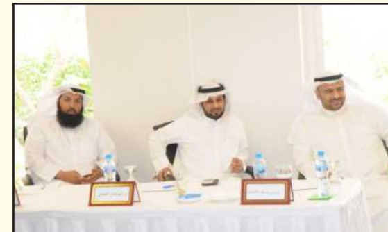
● موظفو بلدية الكويت