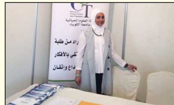
● مشاركة المكتب في يوم التدريب