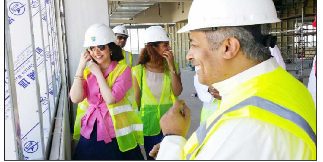
● ابتسامة مشتركة