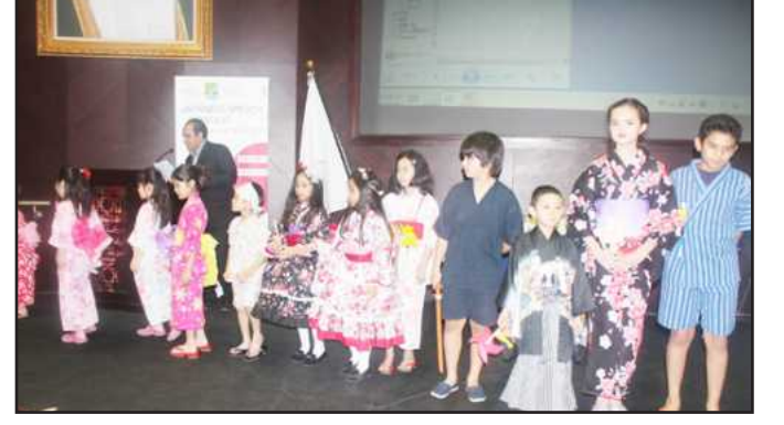
● عرض للأطفال