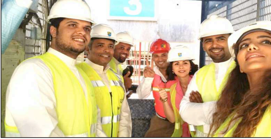
● سيلفي أثناء الزيارة