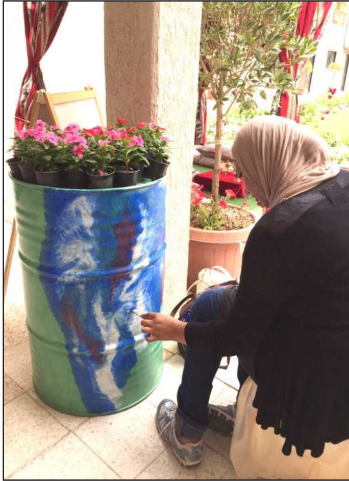
● الرسم على البراميل