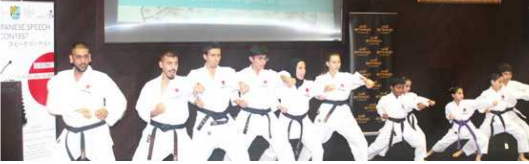
● عرض للكراتيه