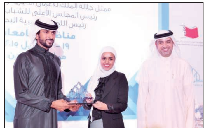
● الشيخ ناصر آل خليفة يكرم لولوة الخطاف

الحجي استقبلت فريق المناظرات من جانبها استقبلت مدير جامعة الكويت بالإنيابة أ. د. حياة الحجي فريق طلبة الجامعة الفائز بجائزة رواد المناظرات في قطر. وأعربت الحجي عن سعادتها البالغة وفخرها بتحقيق فريق الجامعة لهذا الفوز الذي يتجلى الصدر، مباركة لجامعة الكويت حصولها على جائزة رواد المناظرات، والتي تعتبر الجائزة الأولى التي يقدمها المركز وقد حظيت بها الجامعة، مؤكدة على أن هذا الفوز دليل على أن الجامعة تسعى بخطى حثيثة إلى الأمام. وتطلعت إلى ضرورة مشاركة طلبة المنح الدراسية والبعثات في دوري مناظرات فيما بينهم خاصة وأن معظمهم يجيدون اللغة العربية، مشيرة إلى وجود طلبة من أكثر من عدة دول يدرسون في الجامعة ويدرسون اللغة العربية في مركز اللغات، مؤكدة أن تلك المشاركة ستخلق انطباعاتاً جيداً ومشجعاً لديهم وسينقلون من خلالها