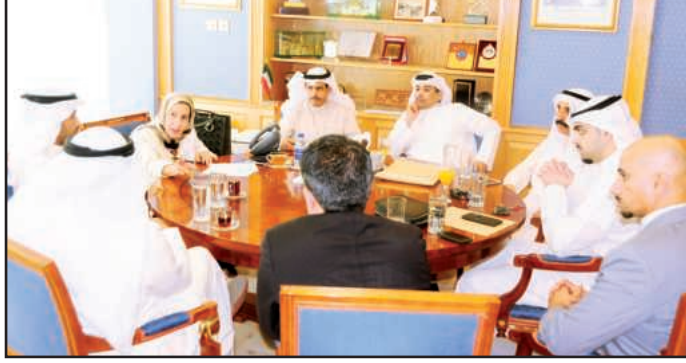
● جانب من اللقاء