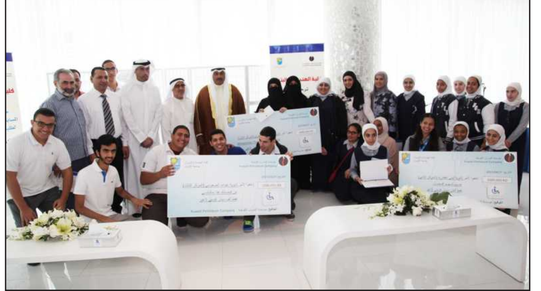
● الشيخ فهد السعد يتوسط الفرق الفائزة