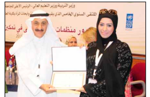
● تكريم إحدى الطالبات