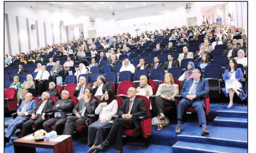
● جانب من الحضور