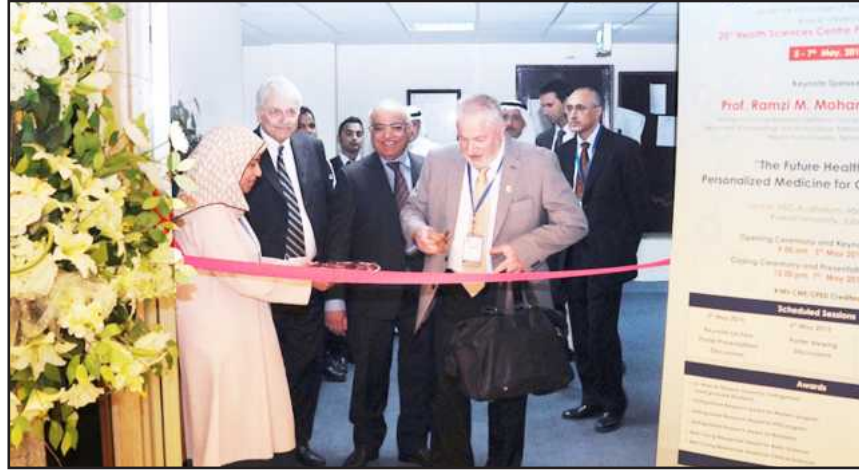
● افتتاح معرض الملصق

واعطائهم الجوائز في اليوم الأخير من المؤتمر. وفي كلمة للاستاذ الزائر د. رمزي محمد أكد فيها جودة الملصقات المقدمة من الناحية العلمية والتقنية ومن ناحية التقيد بالتعليمات ويأتي ذلك من خبرة العشرين سنة في هذا المجال ومن مجهود تراكمي أتت نتائجه على هذا النحو، مؤكداً على جودة البحوث العلمية المشاركة واصفاً إيها بأنها أكثر من جيدة وأفضل من البحوث والملصقات التي تقدم حتى في الولايات المتحدة الأمريكية.