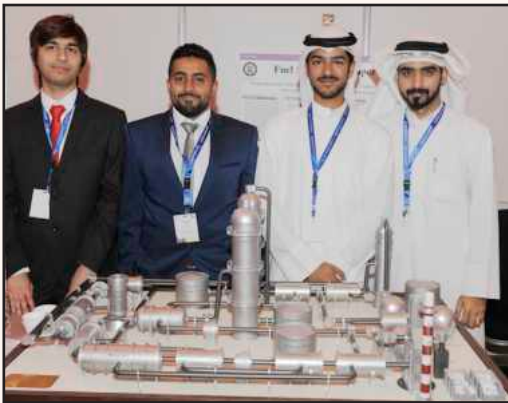
One of the participating teams at the exhibition