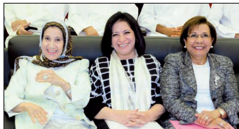
A photo of the attendees during one of the conference afternoon sessions