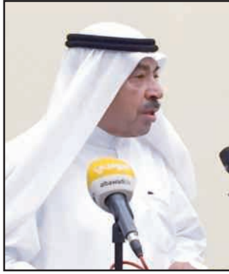
● الأديب عبدالعزيز البابطين