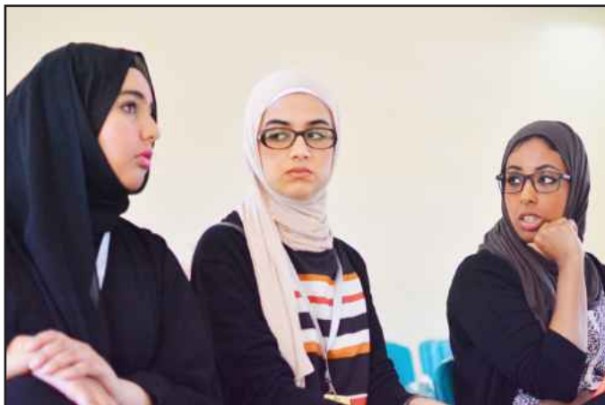
● مار عليج هالسؤال ؟