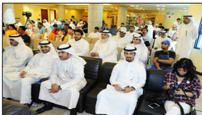
● جانب من الحضور