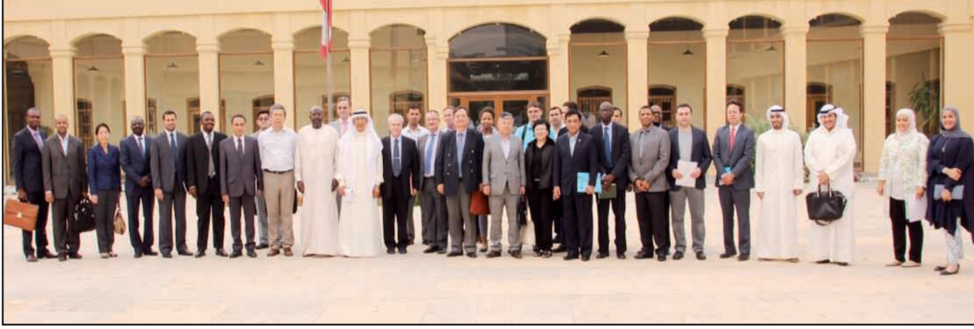
● لقطة تذكارية

الزبيدي . يذكر أن هذه الدورة قد تم طرحها للمرة الثانية على التوالي للمستويين الأول والثاني وذلك تبعاً للتعاون المستمر بين عمادة خدمة المجتمع والمعهد الدبلوماسي في وزارة الخارجية .