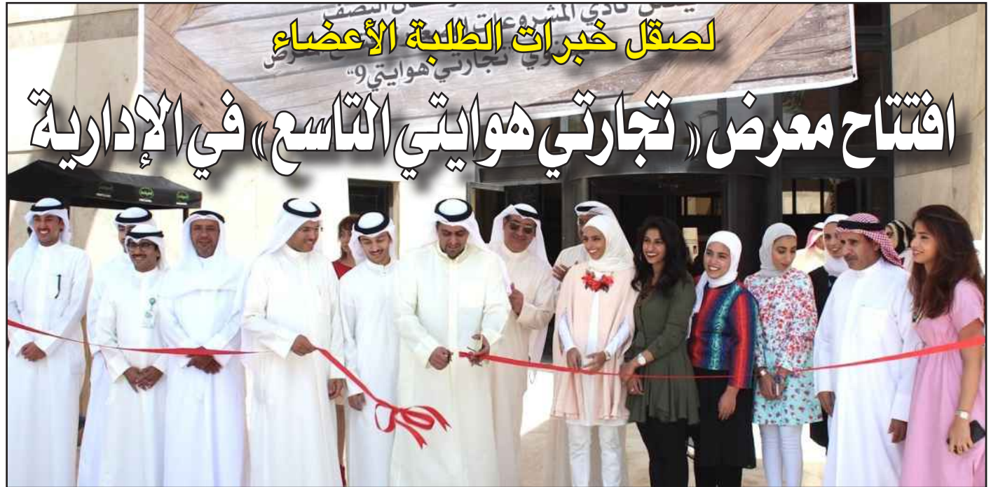
● راكان النصف مفتتحا المعرض

● لقطة تذكارية للمشرفين والطلبة بحضور عميد الكلية تحت رعاية عميد كلية الحقوق أ.د. جمال النكاس أقيم مكتب التدريب العملي بالكلية حفل تكريم مشرفي وطلبة التدريب العملي على مسرح أ.د. عثمان عبد الملك ، بحضور عدد من العمداء المساعدين وأعضاء هيئة التدريس ، إضافة إلى ممثلين عن جهات حكومية وخاصة ومؤسسات حقوقية . هذا وقد أثبتت السنوات الماضية أن التدريب العملي له فائدة كبيرة في تدريب الطلبة وإعطائهم الملكات القانونية التي تدفعهم إلى الحياة العملية بصورة قوية ومهنية أكثر، وتمكينهم من التطبيق الفعلي لممارسة مهنة المحاماة ، وتعريفهم بالإجراءات القانونية. وأكد عميد كلية الحقوق أ.د. جمال النكاس اهتمام الكلية في تنظيم نشاط التدريب العملي ، للطلاب والطالبات في كلية الحقوق على مدار السنوات الماضية لما يساهم به من صقل لمواهب الطلبة وتنمية قدراتهم ، كما يخرج كوادر طلابية مؤهلة ، تمتلك الخبرة والمهارة للعمل وخدمة الكويت في أي مجال. وقال في كلمته خلال الحفل ، بمناسبة اجتياز طلبة الفرقة الرابعة الفترة التدريبية المقررة بنجاح لعام ٢٠١٥ / ٢٠١٤ : هناك جهات ساهمت معنا في نشاط التدريب العملي هذا العام ، ونحن ممتنون لها كثيراً ، خصوصاً بعد النجاح الذي حققه النشاط التدريبي ، من تنوع لأنشطته وتميز لفعالياته ، وقد كانت مشاركة تلك الجهات عاملاً مشجعاً ومحفزاً للطلبة على الإبداع وتقديم أفضل ما لديهم في التدريب العملي.