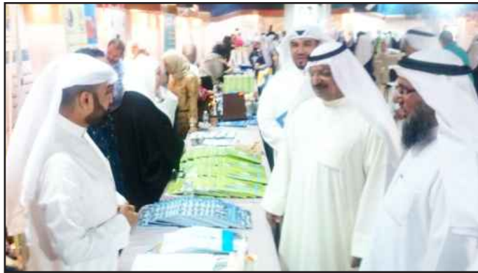
● شرح لمحتوى جناح الجامعة