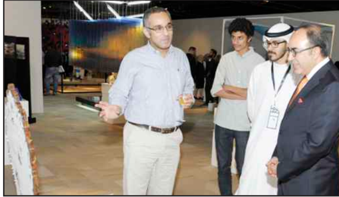
● شرح لمشروع