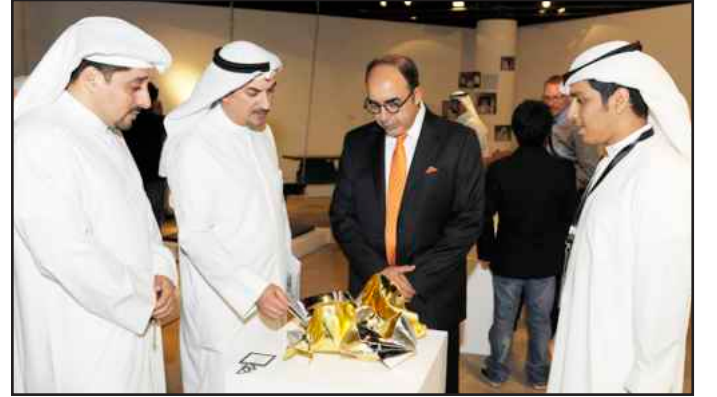
● عرض لأحد التصميمات