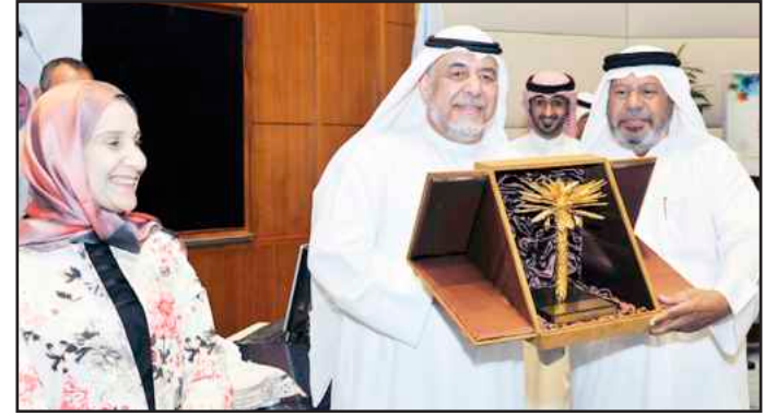
Al-Masaad being presented an award on behalf of the GSA