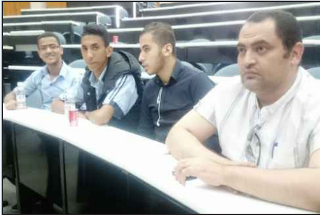
● المشاركون في الورشة