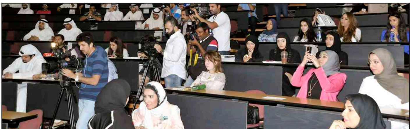
● جانب من الحضور

و مضى أبل قائلا اليوم أصبح من الضروري تبني مشاريع بناء المدن وليس توفير سكن فقط، ودراسة أسباب الخلل في السوق العقاري لإيجاد الحلول المناسبة، وتصحيح الخلل في نظام توفير السكن، وأسباب ارتفاع أسعار الأراضي بشكل ملحوظ في السنوات الأخيرة بهدف تطبيق