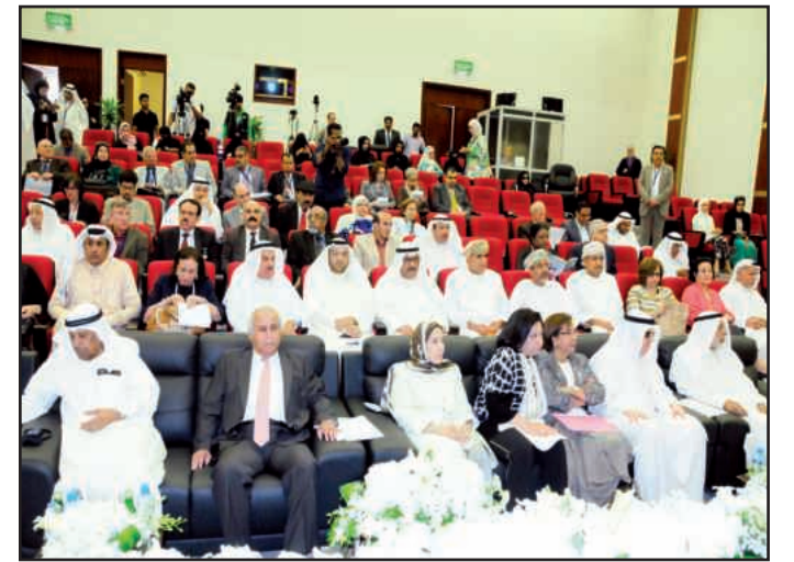
● جانب من الحضور