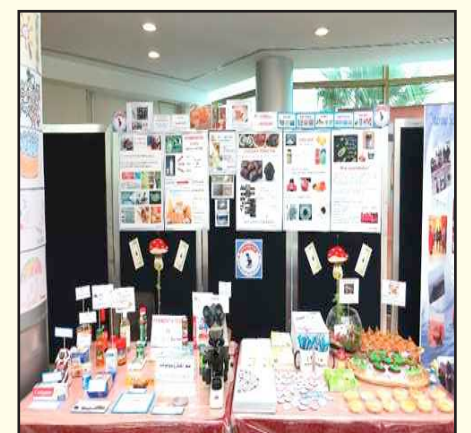
A photo of one of the booths at the exhibition