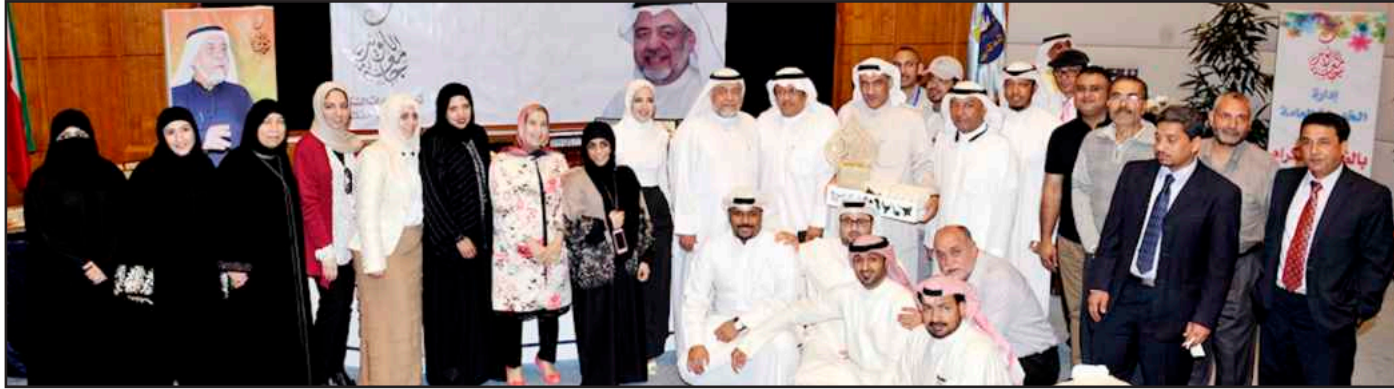
A group photo of the attendees at the ceremony