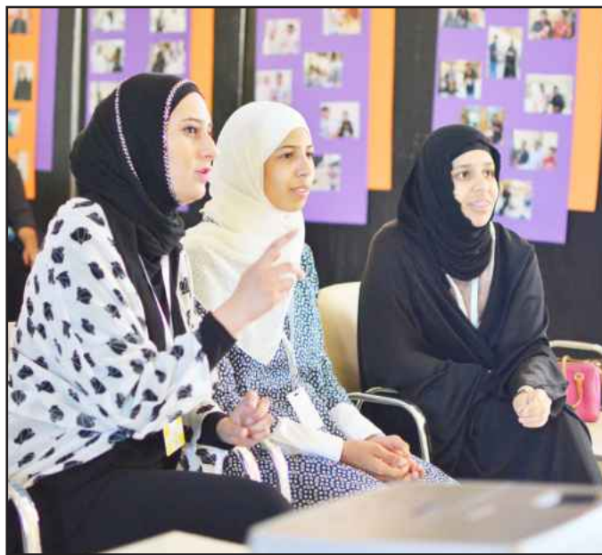
● توقعین ای اجابہ فہم؟