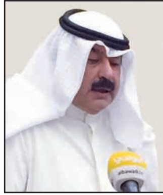
● السفير خالد الجارالله