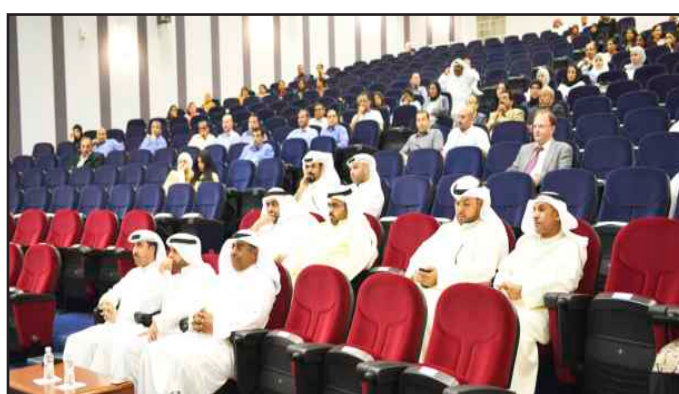
● جانب من الحضور