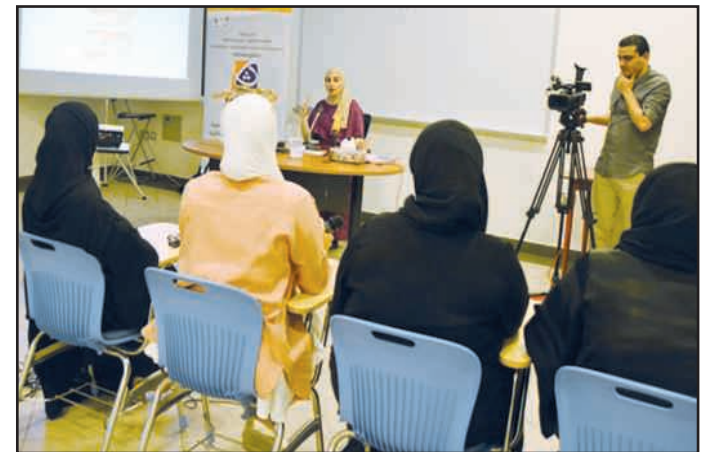
● من الدورى الثقافى