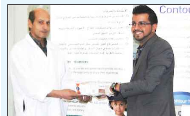
● شكر وتقدير

وقال النصف إن :«الدعم بالأراضي الاستثمارية والصناعية والورش هي الداعم الحقيقي للمشاريع الصغيرة ، فلا يمكن لأي اقتصاد في أي بلد أن ينهض من دون هذه المشاريع بالإضافة إلى أن القوانين