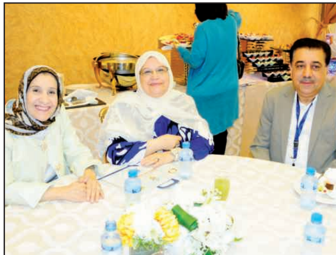
● ابتسامة لعدة آفاق