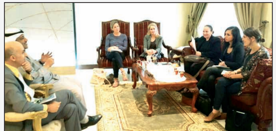
The French delegation discussing the positive aspects of the student exchange program