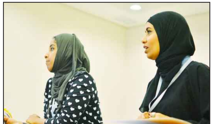
● ترقب واهتمام