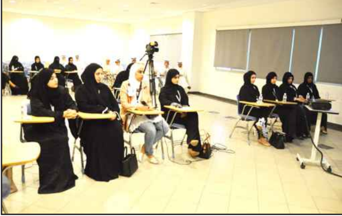
● من المناقشات