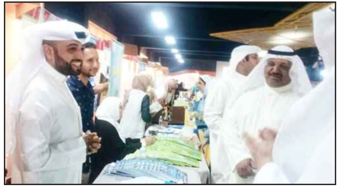
● جانب من المعرض

والطلاب في اليوم الثاني. وتحرس جامعة الكويت في المشاركة بالمعارض الطلابية والثقافية والتعليمية، وذلك انطلاقاً من دورها البارز في تعزيز العلاقات مع الجماهير الداخلية والخارجية،