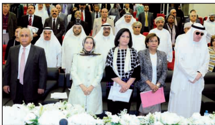
A group photo of the attendees during the playing of the national anthem of Kuwait