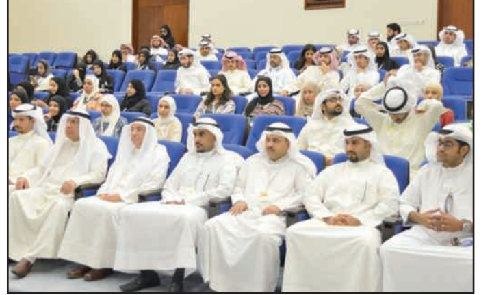
● من الحضور

تعتبر مكملة للمنهج الدراسي، وتشكل متنفساً للطلبة يعبرون من خلالها عن مشاعرهم وأفكارهم، إضافة إلى أنها تساعدهم على التفوق الدراسي والمهني وعلى الاستقرار النفسي، بالابتعاد عن ضغط التدريس، ولذلك فالأنشطة الثقافية تساهم في تكوين طالب مثقف واكتشاف المواهب الطلابية.