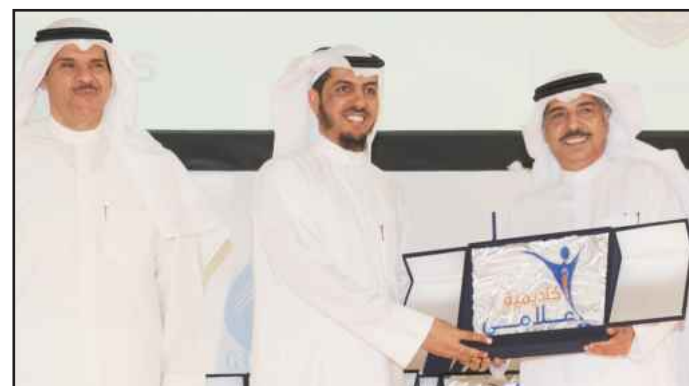
● تكريم الوكيل المساعد بوزارة الشباب يوسف اليتامي