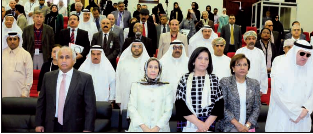
● أثناء عزف السلام الوطني