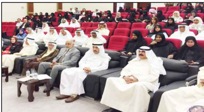
● حضور الاحتفالية

وأضاف: كان والدي عندما يكون على أبواب ميلاد قصيدة فانه يحاول أن يكون معنا ولكننا نستشعر أن هناك شيئا ما وأنه معنا جسداً لكن فكره وخواطره مع تلك القوافي العائمت يحاول أن يجمعهم ويسوق أبيات شعر متناغمة فينتهي المخاض وتولد قصيدة من قصائده الجميلة،