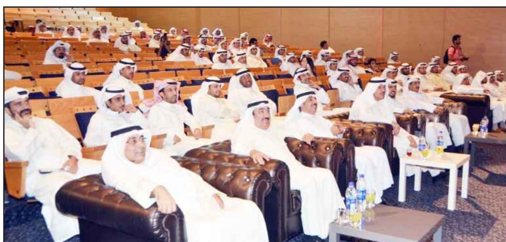
● جانب من الحضور