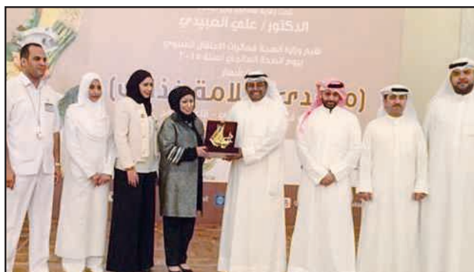
● من معرض يوم الصحة العالمي