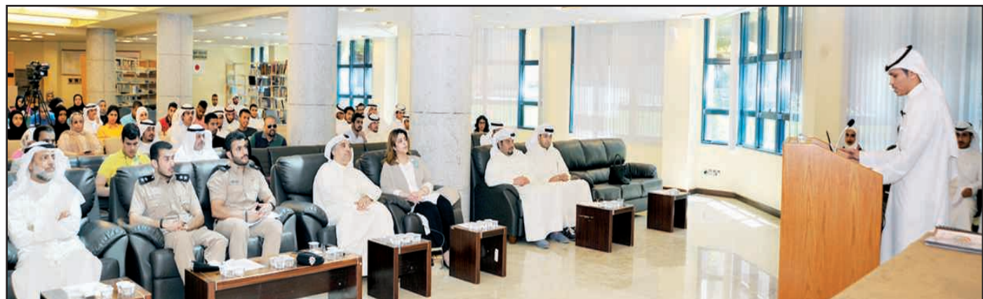
● من الفعالية