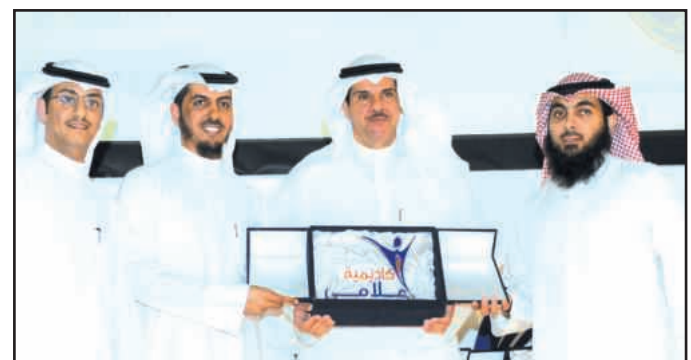
● تكريم راعي الحفل

قال وزير الاعلام ووزير الدولة لشؤون الشباب الشيخ سلمان الحمود أن (أكاديمية اعلامي) تأتي كمبادرة تساهم في مواكبة التطور الاعلامي الكبير لا سيما في مجال الاعلام الجديد. وأكد الشيخ سلمان الحمود في تصريح للصحافيين عقب حفل تكريم المشاركين في دورات (أكاديمية اعلامي) حرص وزارة الدولة لشؤون الشباب على دعم مثل هذه المبادرات المهمة والرائدة التي