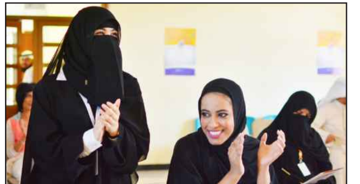
● صبح صبح