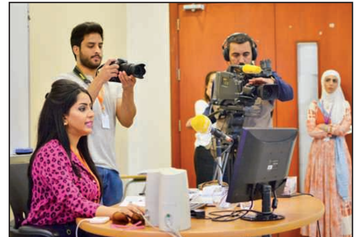
● اللجنة الإعلامية