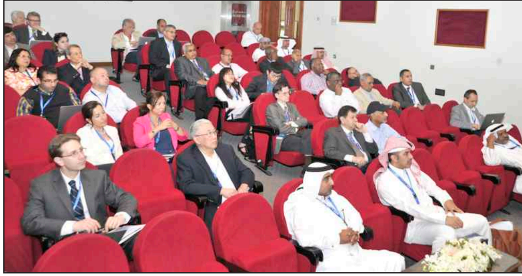
● حضور الملتقى