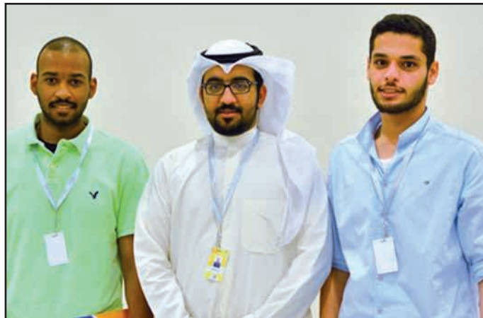
● لقطة تذكارية