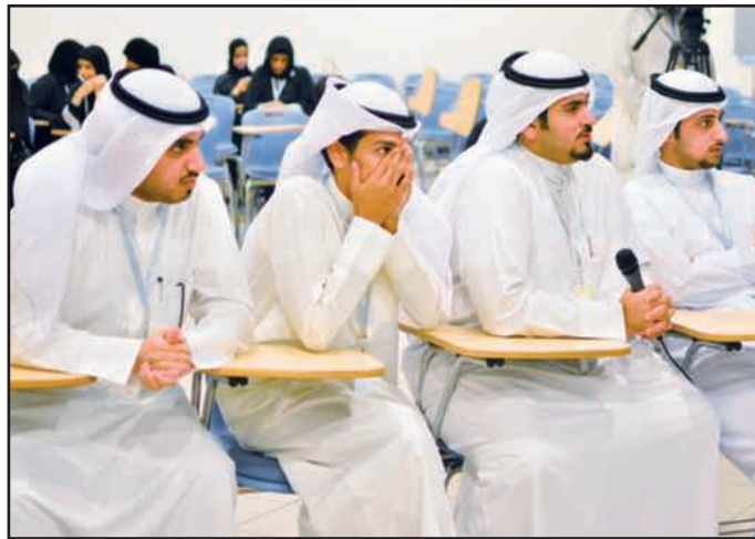
● الله يستر