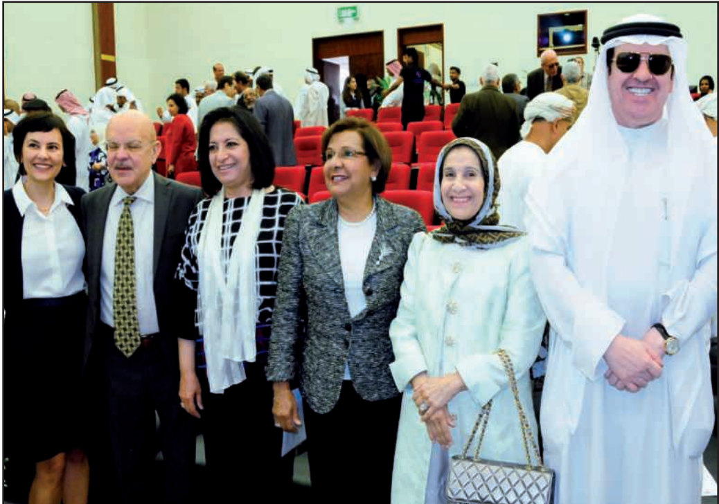
● لقطة تذكارية