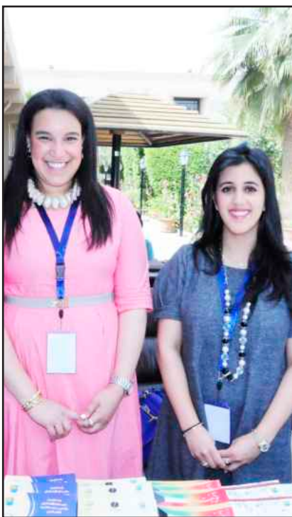
● طالبتان مشاركتان بالمؤتمر