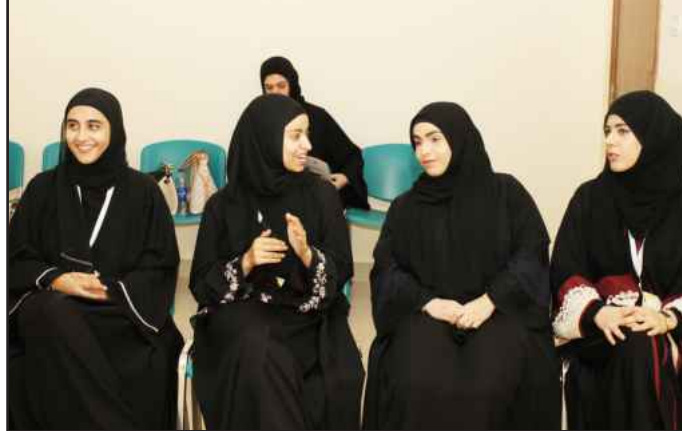
● اشرائكم ؟