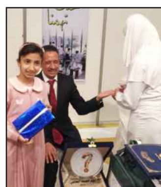
● من فعاليات يوم الصحة العالمي

مدي سلامة غذائك ( ضمن فعاليات يوم الصحة العالمي المقام في فندق ريجنسي يوم الثلاثاء الماضي برعاية وزير الصحة د.علي العبيدي . وعرض القسم ما يتم تقديمه من الخدمات الطبية الطارئة بالعيادات الجامعية التابعة لإدارة الأمن والسلامة، بالإضافة لعرض وتوزيع العديد من البوسترات والكتيبات الإرشادية التي تحتوي على العديد من المعلومات والإرشادات عن السلامة والوقاية والصحة ، وذلك بهدف نشر وتعميم الثقافة الأمنية والسلامة العامة بالجامعة .