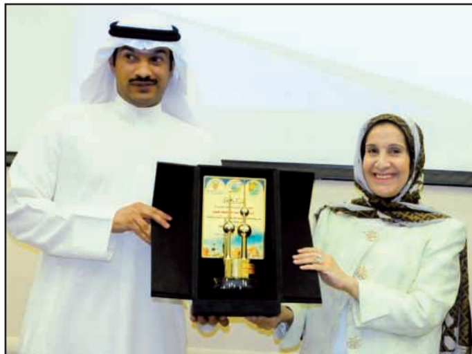
● درع تذكاري يتسلمه ممثل الشيخة شيخة الخليفة

وجودها نقلة نوعية في تجليات الفكر الثقافي ومعطياته تتفاوت نسبة سبر أغوارها بين عقلية المفكر والطفل تفاوتا كبيرا. وذكرت أن كل هذا يطرح تساؤلات ... أين؟ ومتى؟ وكيف؟ وما هي التأثيرات الظاهرة والباطنة في المجالات الفكرية والعلمية والاجتماعية؟ كل هذه الاستفسارات جعلت طرح هذا الموضوع للدراسة والمناقشة فجاء المؤتمر هذا بجهود اللجان