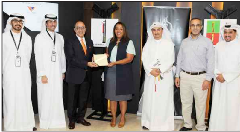
● تكريم مشاركة

فرع الكويت هي جمعية مستقلة غير ربحية بإدارة طلابية وهي أكثر من مجرد نادي، وتهدف الجمعية إلى التعاون بين الطلبة من جميع أنحاء العالم وتبادل المساعدات بين بعضهم البعض، الجمعية الأمريكية لطلبة العمارة - فرع جامعة الكويت - هي أول فرع عالمي لها وأصبحت جمعية مستقلة في يونيو ٢٠١١ وتشجع الطلاب على المشاركة في أنشطتها باستخدام التعليم باعتباره المفتاح لمستقبل المعماري وتشمل أنشطة الجمعية ورش العمل والمحاضرات والفعاليات والدروس.