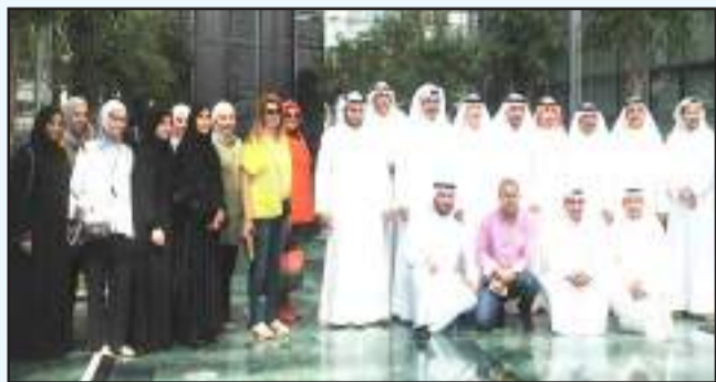
● لحظة تذكارية في ديوان المحاسبة