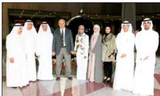
● لقطة تذكارية بحضور د. بدر العيسى

المتفوقين والمتفوقات من كافة التخصصات العلمية والادبية بكليات الجامعة المختلفة للعام الجامعي ٢٠١٣-٢٠١٤ ، لافتا إلى ان جامعة الكويت تحرص على