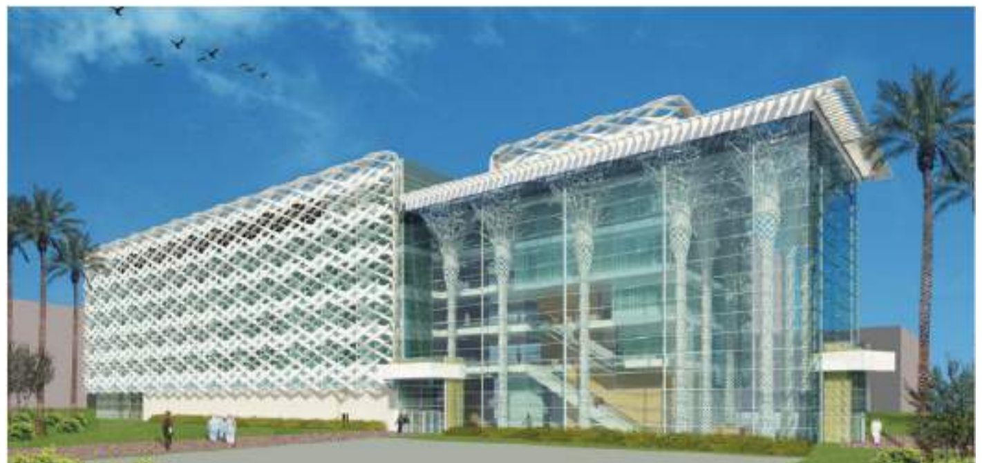
● الحرم الجديد لكلية الشريعة