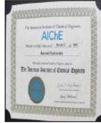
● شهادة اعتماد الفرع من الجمعية الام