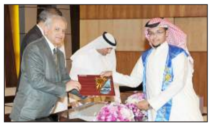
● متفوق من كلية الحقوق