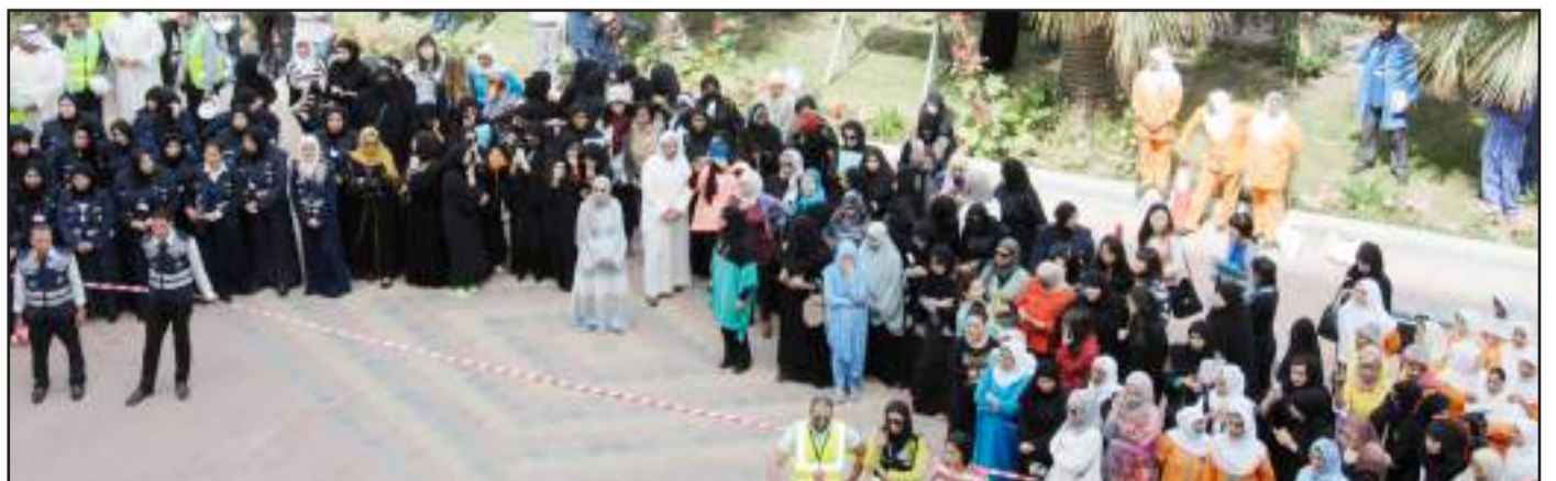
● الطالبات عند نقطة التجمع