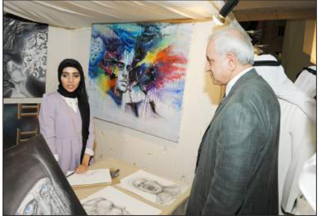
● معروضات فنية على هامش الحفل