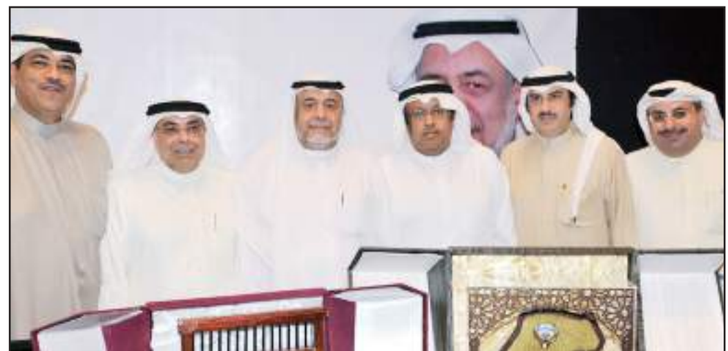
● لقطة تذكارية بحضور المحتفى به