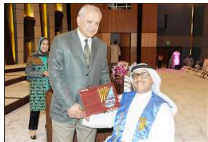
● وزير التربية يكرم متفوقا من ذوي الاحتياجات الخاصة