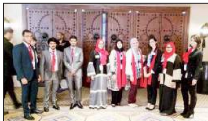
● طلبة رحلة الداو

كتبت زينب باقر : الجمعية الأمريكية للمهندسين الكيميائيين AICHE هي أكبر وأقدم جمعية للمهندسين الكيميائيين في العالم ، تأسست في عام ١٩٠٨ وتم إنشاء أول فرع طلابي في جامعة الكويت في مارس ٢٠١٠ ويعد أول فرع طلابي في الشرق الأوسط حيث تضم الجمعية الأم أكثر من ٥٠ ألف مهندس كيميائي من ٩٣ بلداً تجمع فروعاً طلابية وتجمعات مهنية .