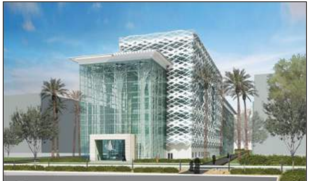
● مبنى الشريعة الجديد مساحته ١٤٦٣٨ متراً مربعاً

للكلية. أما المحافظة على البيئة فهي مسئولية وليست خياراً، حيث يمكن ملاحظة ذلك من خلال تزويد هذا الصرح بجدران الوقاية من أشعة الشمس للحماية من العوامل الجوية القاسية بدولة الكويت، إلى جانب استخدام الخلايا الشمسية، وسخانات المياه العاملة بالطاقة الشمسية، والنظم الميكانيكية التي تتميز بالكفاءة، واستخدام المواد غير الضارة بالبيئة، وغيرها من الأمور الأخرى.