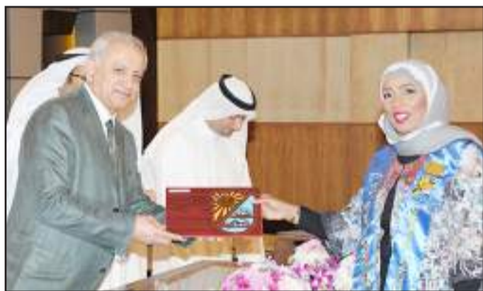
● ابتسامة لعدسة «آفاق»