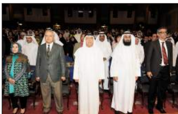
● أثناء عزف السلام الوطني