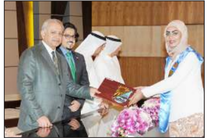
● متفوقة من الطب المساعد

الحبيب فانتم الدرع الواقى لوطننا الحبيب ومنكم قادة المستقبل وعليكم خدمة المجتمع وتنميته اجتماعيا وثقافيا واقتصاديا وتوجهت إلى الطلبة: ولتعلموا ابناي الطلبة ان الواقع العلمي لا يعترف الا بنوايح المجتمع لذلك كان التفوق مطلب اصحاب الهمم العالية الذين يبحثون عن مستقبل افضل، فعليكم الاستمرار في تفوقكم واستغلال قدراتكم الذاتية من اجل الوصول الى القمة.