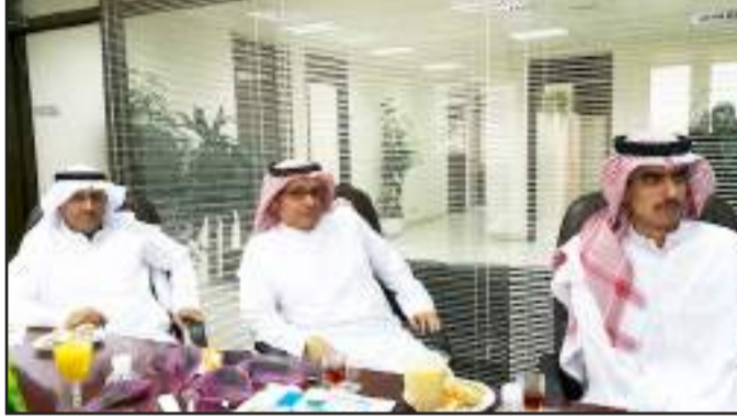
● الوفد السعودي