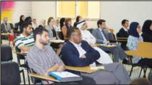
● جانب من الحضور

كتب محمد اكروف: من جانب آخر نظمت الجمعية الامريكية للمهندسين الميكانيكيين ASME بالتعاون مع السفارة السويسرية وكلية الهندسة والبتترول ندوة تحت عنوان «رؤية تحول الطاقة من المنظور السويسري» التي ألقاها رئيس قسم الطاقة في جامعة جنيف السويسرية أ.د.مارتن باتل بحضور السفير السويسري لدى دولة الكويت أيتيني ثيفوس وكوكبة من أعضاء هيئة التدريس وطلبة الكلية. كتب محمد اكروف: التقى عميد كلية الهندسة والبتترول أ.د. الدكتور حسين الخياط السفير السويسري لدى دولة الكويت أيتيني ثيفوس ورئيس قسم الطاقة بجامعة جنيف السويسرية أ.د.مارتن باتل. وتهدف هذه الزيارة إلى بحث سبل التعاون والعمل المشترك بين الجانبين وذلك لكي يستفيد الطرفان من خبرات بعضهما في المجالات العلمية والبحثية المختلفة.