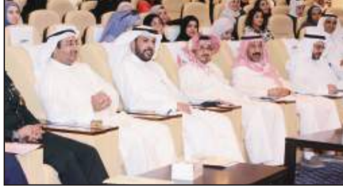
● جانب من الحضور