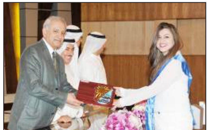
● شهادة تقدير