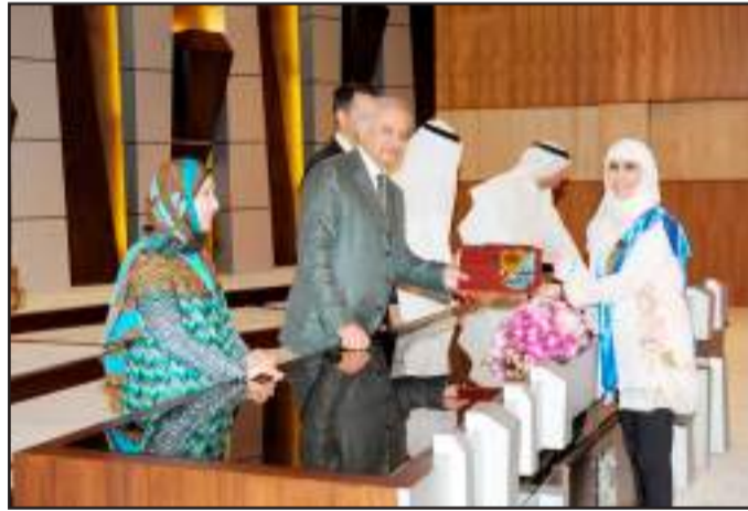
● شهادة تقدير