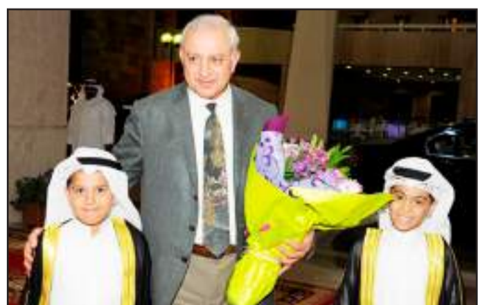
● ترحيب بوزير التربية