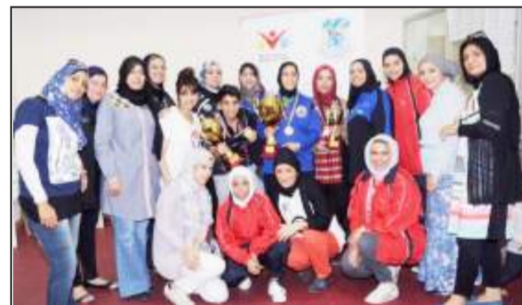
● لحظة تذكارية