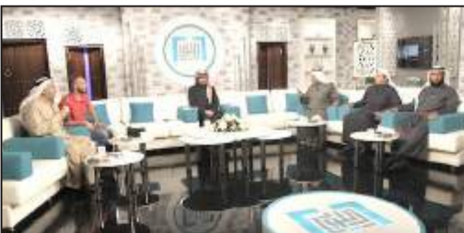
● ..وبرنامج اللوبي