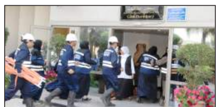
● دخول أفراد الأمن والسلامة