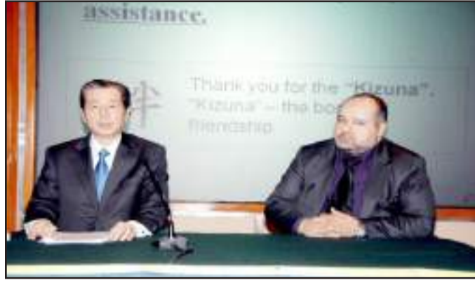
● سفير دولة اليابان في الكويت في محاضرة فوكوشيما