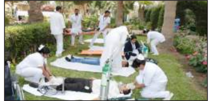
● إسعافات أولية