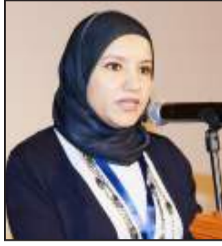
● متحدثة في المؤتمر

اختتم أعماله و أكد ضرورة التواصل مع الوزارات للمشاركة في الابحاث