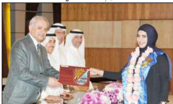
● متفوقة من العلوم الادارية

على الاهتمام بالطلبة ورعايتهم وتشجيع تفوقهم الدراسي وذلك بتنظيم حفلها السنوي لتكريم الطلبة المتفوقين بكافة كليات جامعة الكويت، وما نحن اليوم نحتفل معا بتكريم كوكبة جديدة من متفوقي العام الجامعي ٢٠١٣-٢٠١٤ تشجيعا لهم على التفوق العلمي والاستمرار فيه حتى يكونوا شموعا مضيئا لأقرانهم في الاعوام