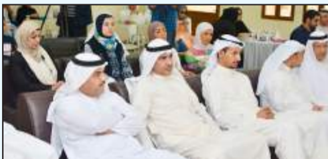
● جانب من الحضور

والتي لن تنتهي إلا مع الحفل الختامي للدوري الثقافي والذي سيحدد لاحقاً حيث ستكون هناك مفاجآت عديدة للجمهور وللحضور الكريم.