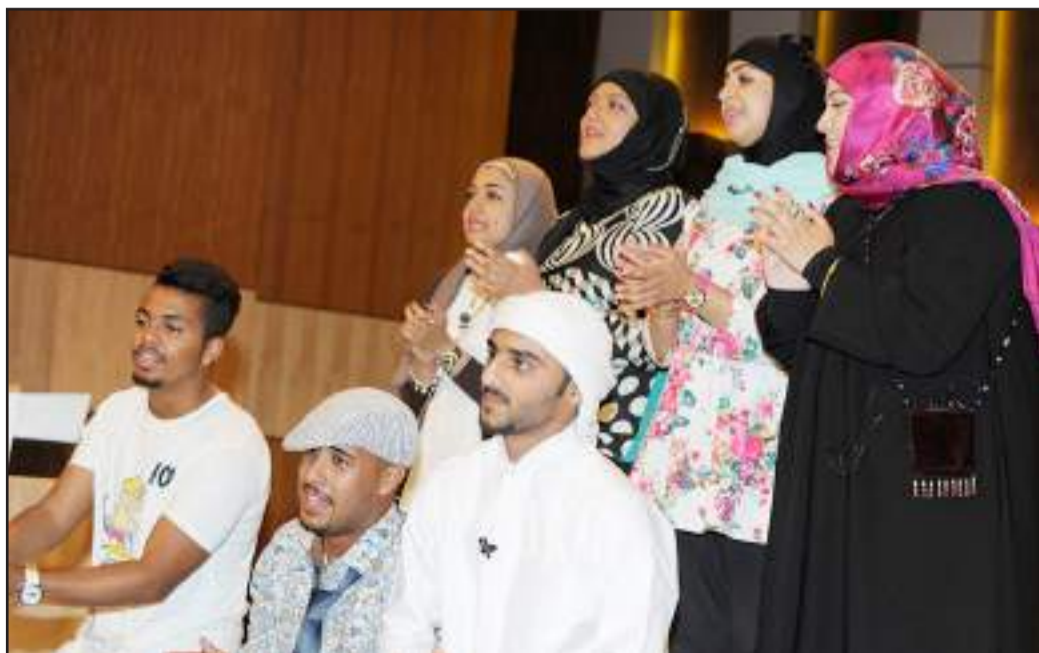
● تشجيع وحماس للعرض المسرحي