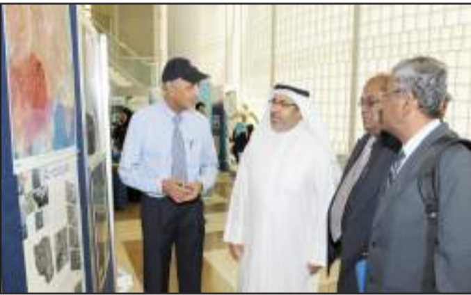
● جانب من المعرض المقام على هامش الورشة

و أشار إلى أن الكويت تهتم كثيراً في الحفاظ على البيئة ومواردها من قبيل سلامة المياه الجوفية والبيئة الصحراوية والشواطئ ، مبيناً أن الكويت تحاول معالجة بعض المشاكل البيئية التي نشأت إبان إحتلال دولة الكويت في مطلع التسعينات وما نشأ أثناء حرب التحرير من تلوث بيئي وتسرب نفطي ، مؤكداً أن موقع الكويت الجغرافي بالقرب