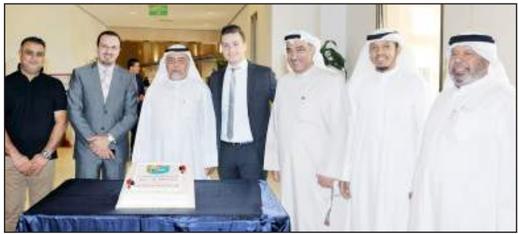
● ..ومع أسرة الخدمات