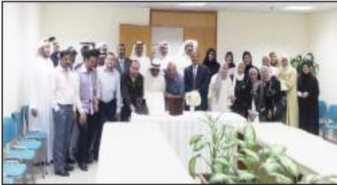
● لقطة تذكارية لأسرة إدارة شؤون التخزين