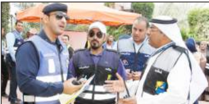
● مراجعة لآلية الإخلاء