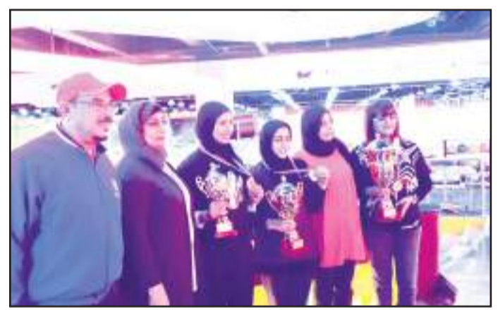
● تكريم الفائزات بلعبة البولينغ

شاركت ادارة المنشآت الرياضية بالجامعة في دوري الوزارات للعبة البولينغ سيدات بثلاث مشاركات خضن المنافسات ضمن 29 منافسة من جهات مختلفة.