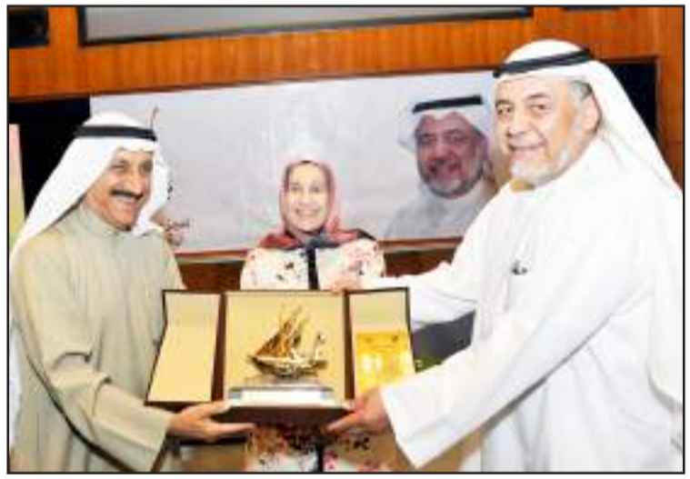
● ..وهدية من كلية العلوم الاجتماعية