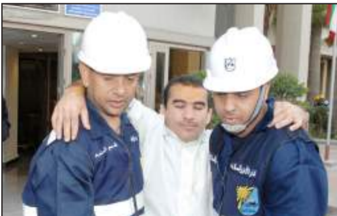
● تطبيقي عملي للإخلاء

و أوضح الياقوت أن سيناريو الإخلاء الوهمي بدأ باندلاع حريق في المبنى وانطلاق صافرة الإنذار وانتشار الأدخنة في المبنى مما تسبب بحدوث إصابات لبعض الطالبات ، حيث تم مساعدة الطالبات على التجمع عند نقاط التجمع المحددة عبر مخارج الطوارئ وإخلاء المبنى في زمن قياسي علماً بأن سكن الطالبات يضم ١٢ جناح و عدد ٢٧٤ غرفة و ٣ سالام طوارئ، وهو ما يعتبر ذو أهمية خاصة بخلاف المباني الأكاديمية كالكليات والمباني الإدارية حيث أن السكن مخصص للإقامة الكاملة إضافة إلى تقديم الإسعافات الأولية اللازمة للمصابات عن طريق إدارة الطوارئ الطبية بوزارة الصحة ، ومشاركة الإدارة العامة للإطفاء في إطفاء الحريق والتأكد من سلامة المبنى.