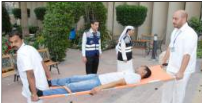
● نقل المصابين