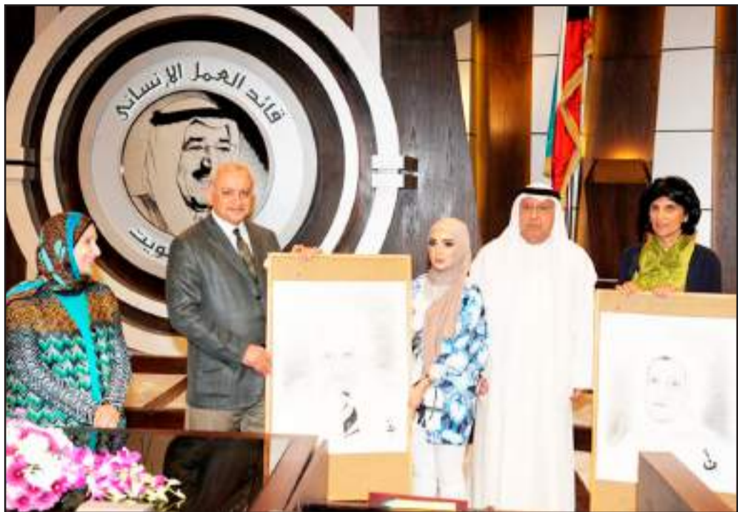
● هدية عمادة شؤون الطلبة لوزير التربية ومديرة الجامعة بالإنابة