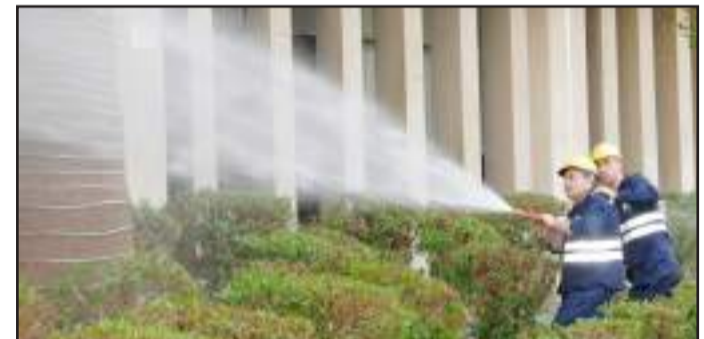
● أثناء إخماد الحريق