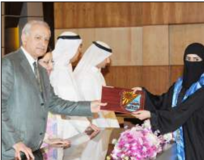
● متفوقة تستلم شهادتها