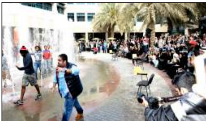
● الدوري الثقافي قدم أول فلاش موب في الجامعة

وبين ان الثقافة لها دور كبير في تطور الامم والحضارات في جميع بلاد العالم، مضيفاً إلى أن الكويت كانت من أوائل دول المنطقة التي اهتمت في تطوير العلم والتعليم