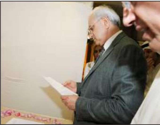
● جولة في المعرض