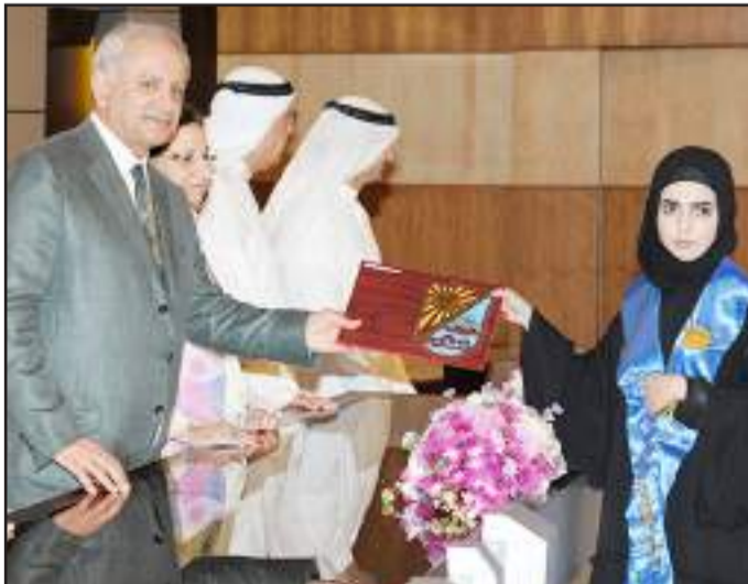
● شهادة تقدير