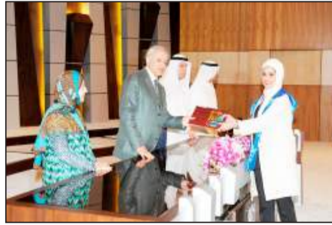
● ابتسامة لعدسة آفاق