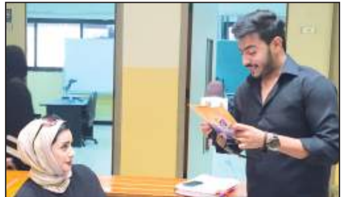
● اسئلة متنوعة