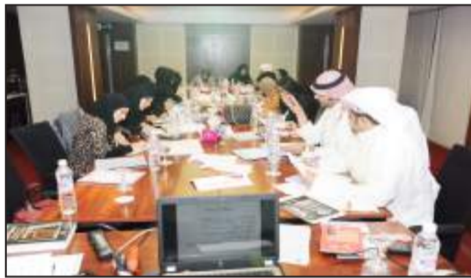
● اجتماع لدعم واستثمار طاقات الشباب

د. النويجم: دورات المشروع تدعم دور الشباب الكويتي في المجتمع