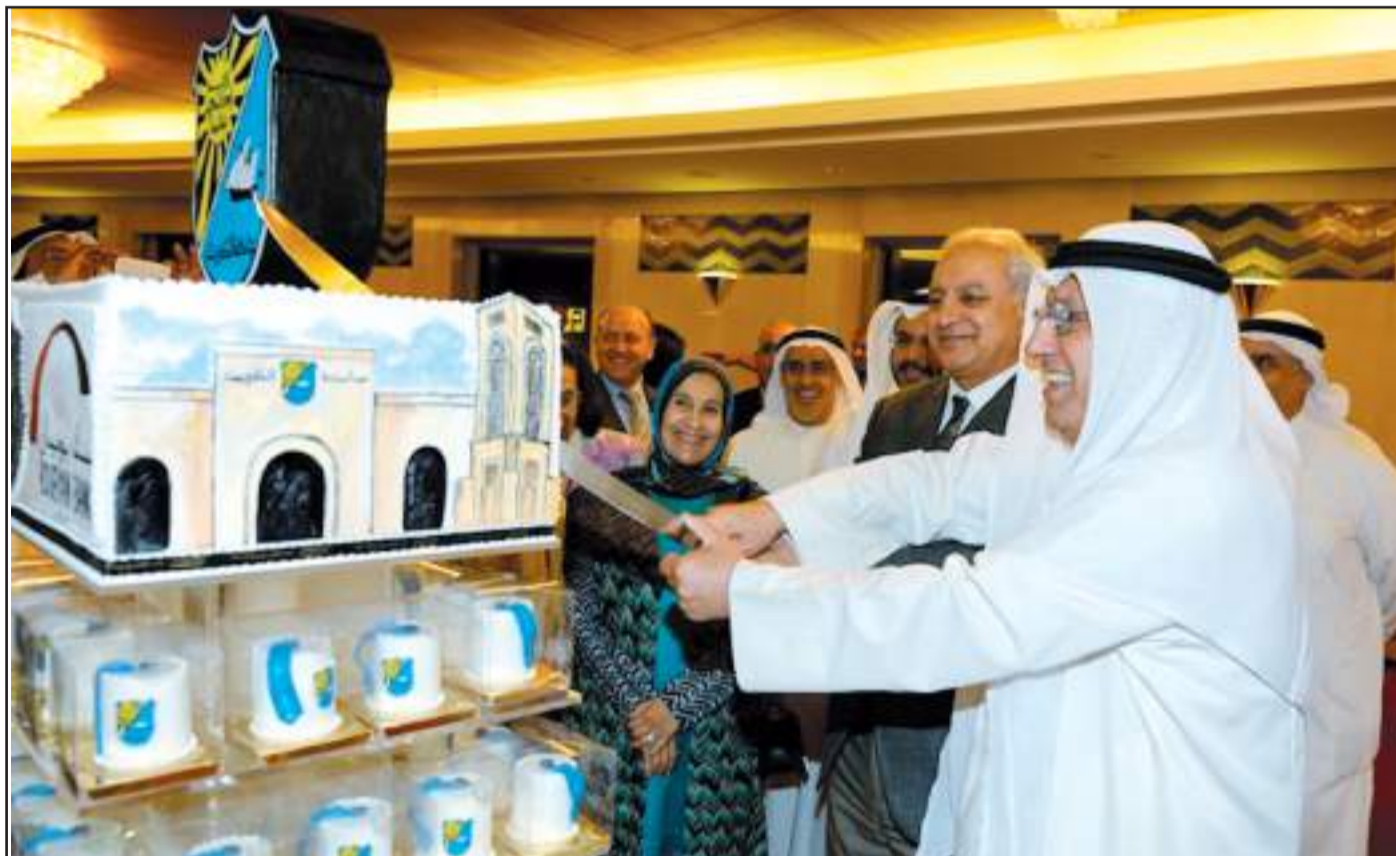
● قطع كعكة الحفل

الجامعة تشجع على التفوق والاجتهاد والكويت تنتظر منكم الكثير