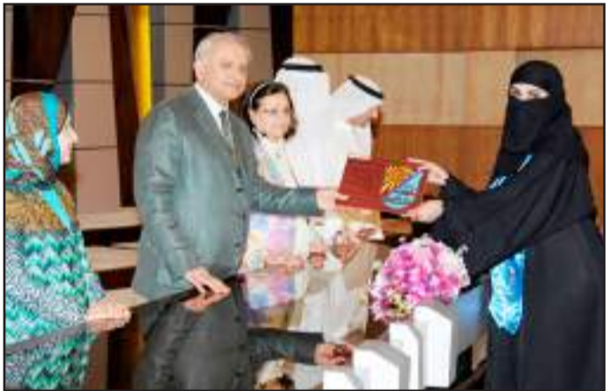
● من المكرمات في الحفل