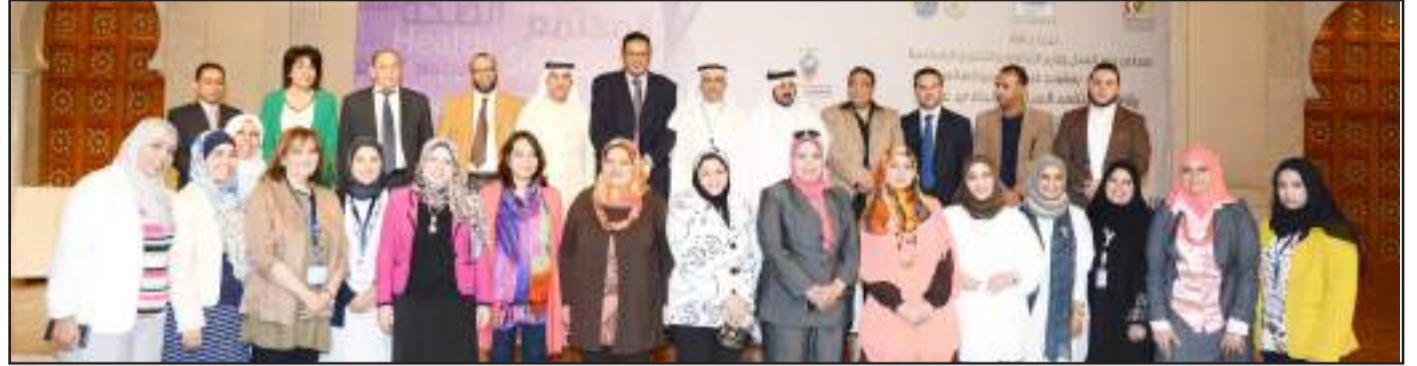
● لقطة تذكارية للمحاضرين والمنظمين

هيئة تدريسية و معاونيهم و ذلك مع مؤسسات التنشئة الاجتماعية و مؤسسات المجتمع المدني لتفعيل قوانين و توصيات الأبحاث الخاصة بمنع العنف ضد الأطفال في المؤسسات المختلفة و متابعة ذلك بالتوعية المستمرة و الذوات للأسرة و المدرسات و الاخصائيين الاجتماعيين و غيرهم من من يتواصلون مع الأطفال بشكل مباشر .