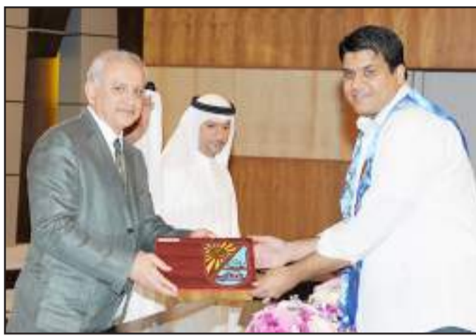
● شهادة تقدير