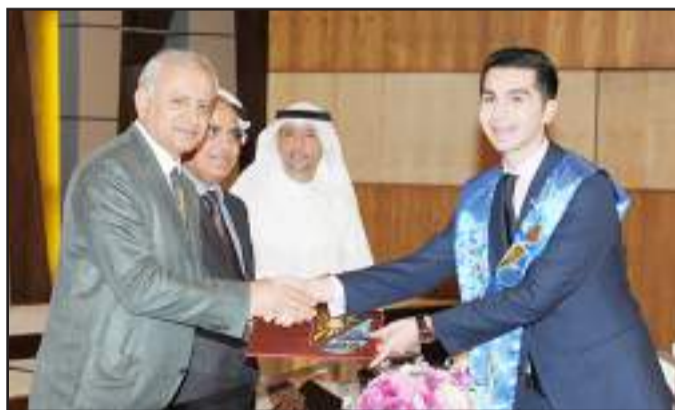
● .. وكلية الطب