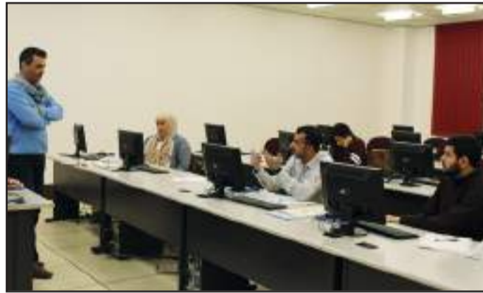
● جانب من البرنامج التدريبي

المترك: البرنامج احتوى دورات « الفوتوشوب » و « الايلستريتار » و « انديزاين »