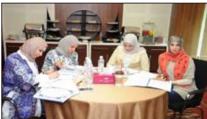
● من دورات المشروع