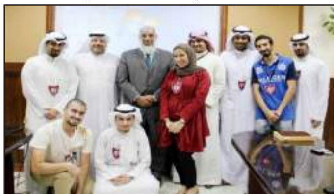
● محاضرة شركة ايكويت

وأوضح أن الجمعية في إطار عملها وأنشطتها المهنية ، هناك مجموعة من الأنشطة الثابتة تتكرر كل سنة وهناك أنشطة متغيرة ، مبيناً أن الجمعية تأسست قانونياً ورسمياً في عام ٢٠١٠ وهو أول فرع طلابي في الشرق الأوسط للجمعية الأمريكية للمهندسين الكيميائيين وتم منحنا شهادة تأسيس الفرع وعند افتتاح الفرع تم تعيين فريق من الطلبة .