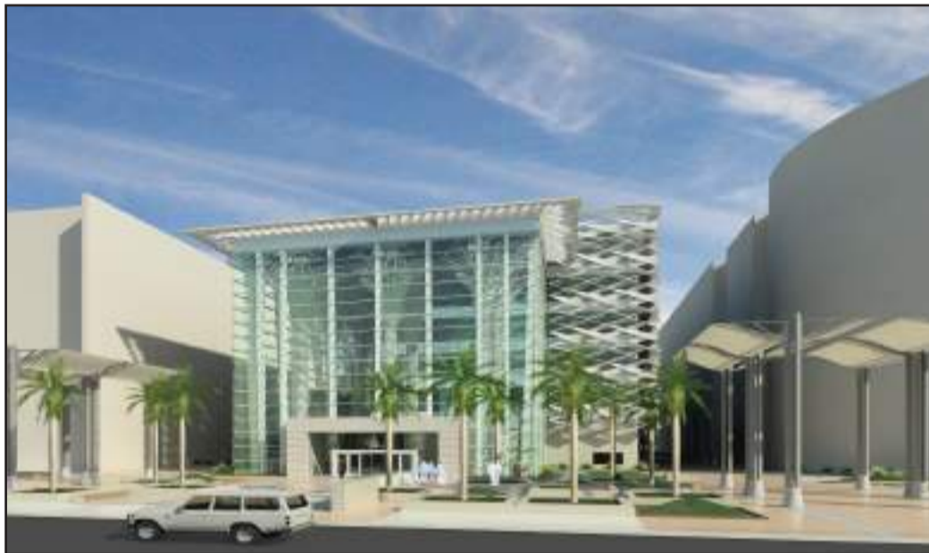
● مخطط لمباني كلية الشريعة