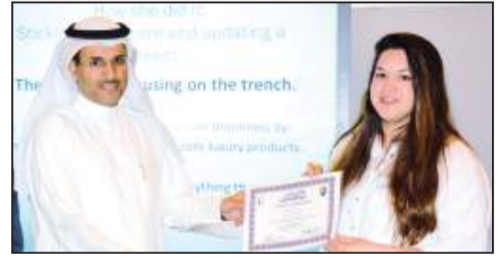
● شهادة تقدير