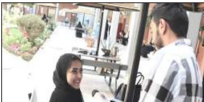
● من فعاليات «شغل عقلك»