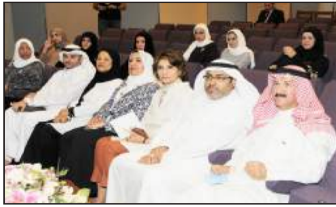
● مقدمة الحضور