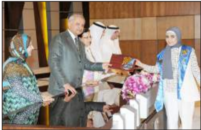
● متفوقة من كلية التربية