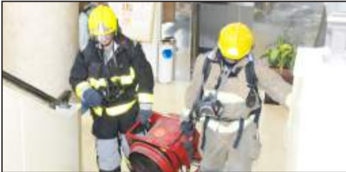
● أثناء إطفاء النار

● أفراد الأمن والسلامة بعد انتهاء الإخلاء الوهمي