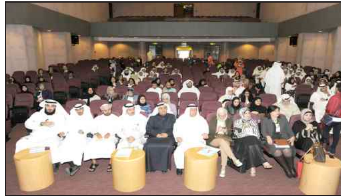
● من انطلاق الدوري