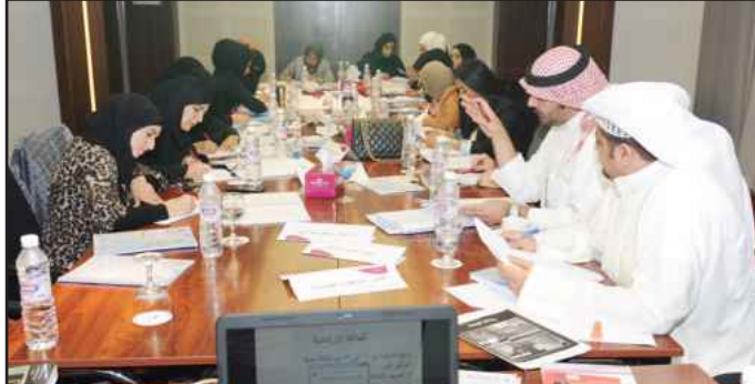
● جانب من دورات المشروع

طاقات الشباب بأن هذه الدورة مفيدة وهادفة جداً وفيها تنوع وتبادل خبرات واكتساب معلومات جديدة، بالإضافة إلى أنها تخدم طبيعة عملها كباحثة نفسية في معالجة الظواهر التي أصبحت تنعكس سلباً على المجتمع والتي باتت منتشرة بشكل كبير في الأماكن والمرافق العامة التي يرتادها المواطنون.