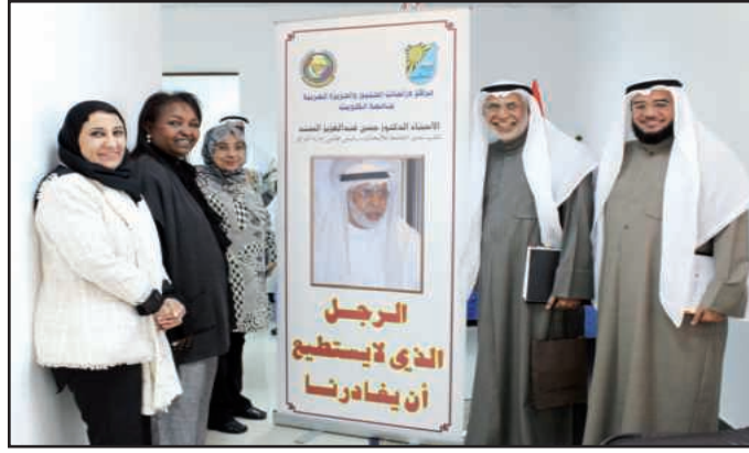
● لافتة ترحيبية