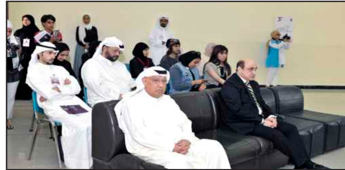
● جولة قبل النهائي