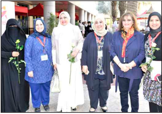
● لقطة تذكارية