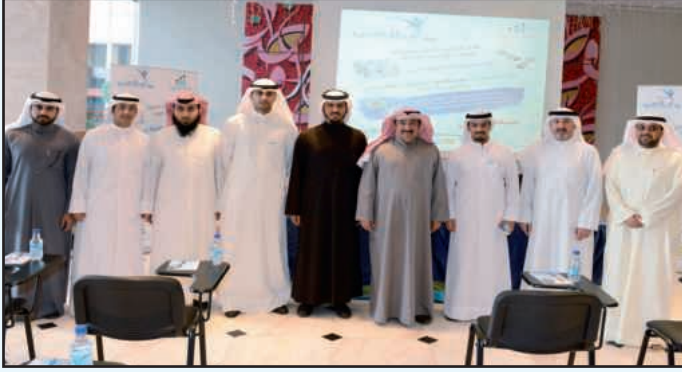
● لقطة تذكارية

واشار ابا الخيل الي اننا نفخر بمثل هؤلاء الشباب القائمين على اكااديمية اعلامي و يجب علينا تقديم الدعم لهم و الاخذ بأيديهم فلهم كل الشكر والتقدير.