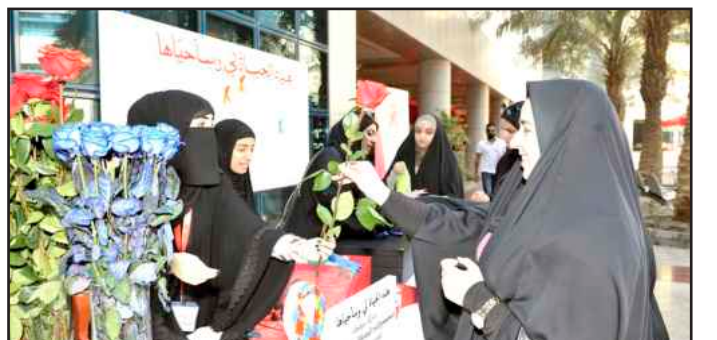
● مشاركة الحضور في حملة دعم الأمراض