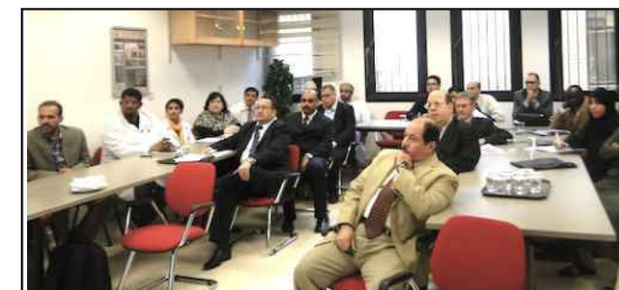
● حضور ورشة العمل

هذه الورشة الفريدة من نوعها والتي تعتبر الأولى في جامعة الكويت.