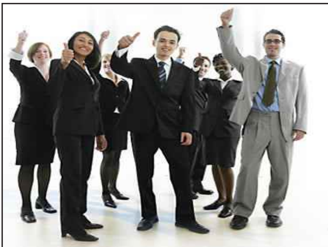
● الأفراد أصبحوا أكثر وعيا بفضل التعليم

وتابع استاذ كلية العلوم الادارية « لكن مما تختص به الدول النامية