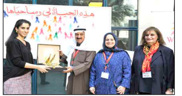
● هدية تذكارية