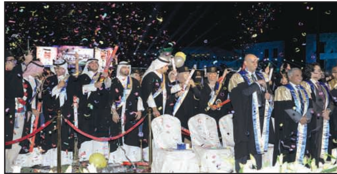
جانب من احتفال السنة الماضية