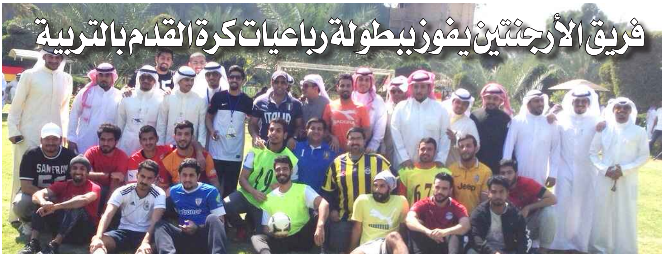
● المشاركون في بطولة رباعية كرة القدم