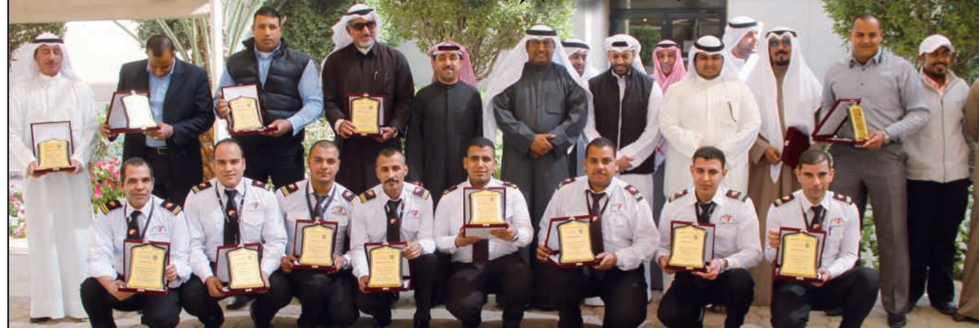
● لقطة تذكارية لأسرة الأمن والسلامة

التي يبذلونها في العملية التنظيمية للفعاليات والأنشطة الطلابية علي مدار العام الدراسي (جميع الأنشطة) هذا بالإضافة للأعمال الأمنية والتنظيمية الأخرى التي تقوم بها الإدارة لخدمة الطلاب والطالبات بالجامعة.