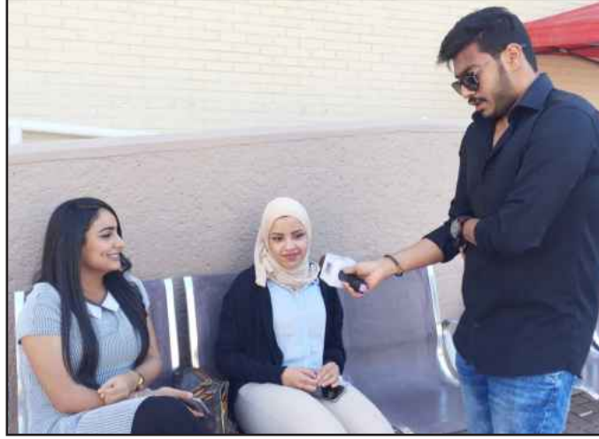
● ناظر الإجابة

وتفاعلهم عبر مواقع التواصل الاجتماعي للبرنامج من خلال هاشتاق #شغل عقلك واربح. كما أن القبول الطلابي لهذه المسابقة والتفاعل مع عدسة البرنامج قد أعطت للمسابقة أجواء رائعة، خرج الطلبة فيها من روتين اليوم الدراسي وأملت وقت فراغهم خلال فترة البريك الجامعي بكل ما هو مفيد وممتع. و وعدت اللجنة الإعلامية بمزيد من المفاجآت في انتظار طلبة الجامعة، لاسيما وان اللجنة وضعت ضمن خطتها الإعلامية التجول عبر عدسة البرنامج بين جميع الكليات بلا استثناء بهدف الوصول الى أكبر عدد من المشاركين وتوزيع الجوائز عليهم، بالإضافة إلى الترويج لمسابقة الدوري الثقافي الثاني لكليات جامعة الكويت في نسختها الثانية التي ستجري انطلاقتها في ٢٨ مارس المقبل.