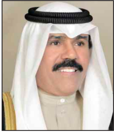
● سمو ولي العهد الشيخ نواف الأحمد