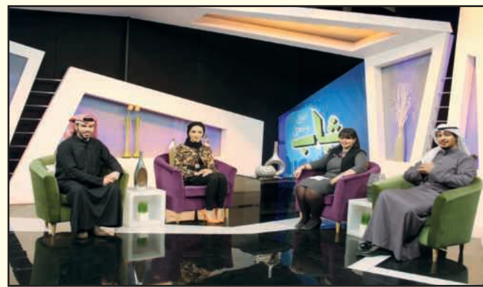
● أثناء اللقاء

مبينة ان الهدف من هذه المسابقة تنمية شخصية الطالب الجامعي واعطائه مساحة اكبر في عملية التفكير واتخاذ القرار، بالإضافة الى صقل مواهبه،