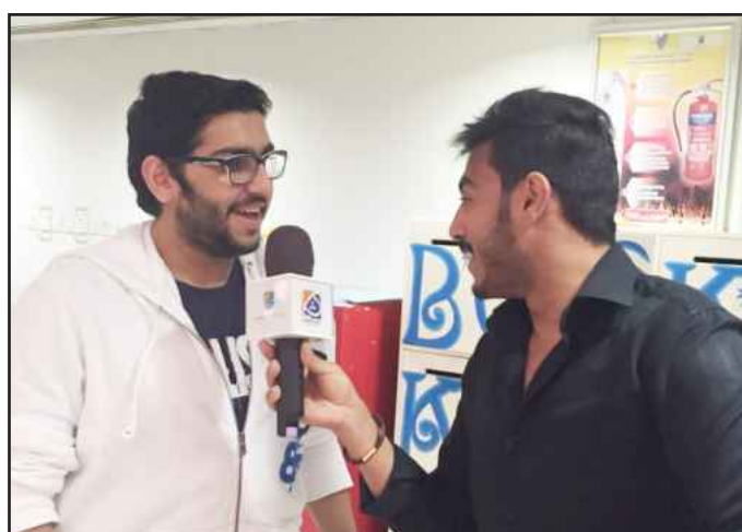
• ابتسامة متبادلة

العلي: المسابقة تنمي ملكة القراءة والمطالعة في عصر العولمة