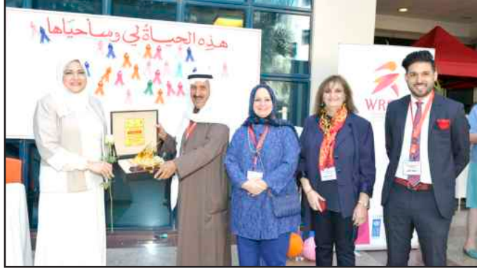
● تكريم البرنامج الإنمائي للأمم المتحدة