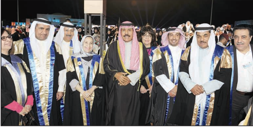
.. و الشيخ نواف الأحمد يتوسط عمادة كلية الآداب