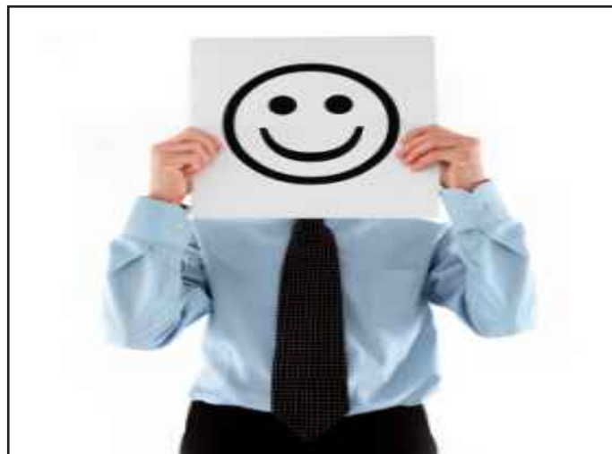
● توفير الراحة للموظف ضروري لتحفيزه على الانتاج