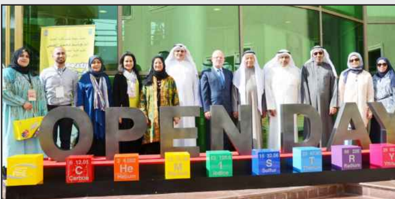
● لقطة تذكارية بحضور عميد الكلية

اليوم المفتوح بشكل سنوي ويقوم بزيارته طلبة وطالبات الثانوية من مختلف المدارس ، وقد تم تخصيص اليوم الأول للطالبات واليوم الثاني للطلبة، وأشار العسوسى إلى أن هذه الفعالية تهدف إلى التعريف بالمجالات المتاحة والفرص الوظيفية المستقبلية للخريجين حتى يكون الطالب ملماً بالمعلومات حول التخصص الذي اختاره، و قدم العسوسى شكره لكل القائمين على هذه الفعالية وخص بشكره عميد الكلية أ.د.جاسم الحسن.