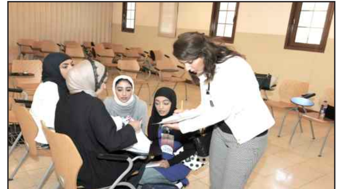
● تحضيرات قبل الجولة

التدريب، جامعة الخليج للعلوم والتكنولوجيا، كلية بوكسهل للبنات، كلية القانون الكويتية العالمية، الجامعة الأمريكية، الكلية الأسترالية والجامعة العربية المفتوحة. وبينت الصايغ أن نهائي بطولة دوري المناظرات سيقام يوم الاثنين المقبل تحت رعاية مدير جامعة الكويت، مشيرة إلى أن الطلاب والطالبات تميزوا وأبدعوا ببطولة دوري المناظرات حيث أثبت كل فريق مهاراته وقدراته في فن الخطابة والكلام واحترام