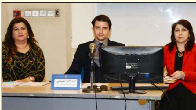
● المتحدثون بالندوة

أقامت وحدة الدراسات الأمريكية بكلية العلوم الاجتماعية محاضرة بعنوان « فنزويلا السياسة والمجتمع » حاضر فيها نائب رئيس البعثة الدبلوماسية الفنزويلية بالكويت أالين تشوتيجي . و بهذه المناسبة قالت رئيسة وحدة الدراسات الأمريكية د. حنان الهاجري ان المحاضرة تناولت تاريخ فنزويلا ما قبل الاستعمار و اثناءه و بعده الى جانب العهد الجديد لفنزويلا متضمنة العديد من المعلومات الجغرافية والسياسية والاجتماعية والسياحية. و حول اختيار موضوع فنزويلا عنوانا للمحاضرة ذكرت الهاجري أن الوحدة الأمريكية تتركز معظم نشاطاتها حول الولايات المتحدة الأمريكية و ان اختيار موضوع يخص دول أمريكا اللاتينية حاليا يرجع إلى ان أمريكا اللاتينية تجذب الكثير من الباحثين من مختلف التخصصات في اهتمامات تتعلق بالسياسة والتاريخ والانثروبولوجيا والاقتصاد والاعلام والفن والرياضة وغيرها ، إلى جانب انها منطقة حية بالكثير من الاحداث مضيئة أن دول أمريكا اللاتينية تعاني من عدة عوائق تقف في وجه التنمية والاستقرار فيها مما يجعلها منطقة خصبة بالمواضيع التي تستحق الاهتمام بها أكاديميا إلى جانب رغبتنا بالوحدة الأمريكية لفتح باب لفهم المجتمعات الاخرى و موازين القوة و أنماط حياة جديدة لا يعرف عنها الكثيرين في منطقتنا .