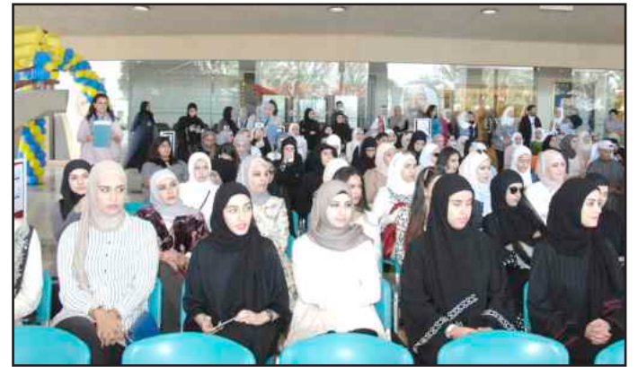
A photo of the attendees at the open day