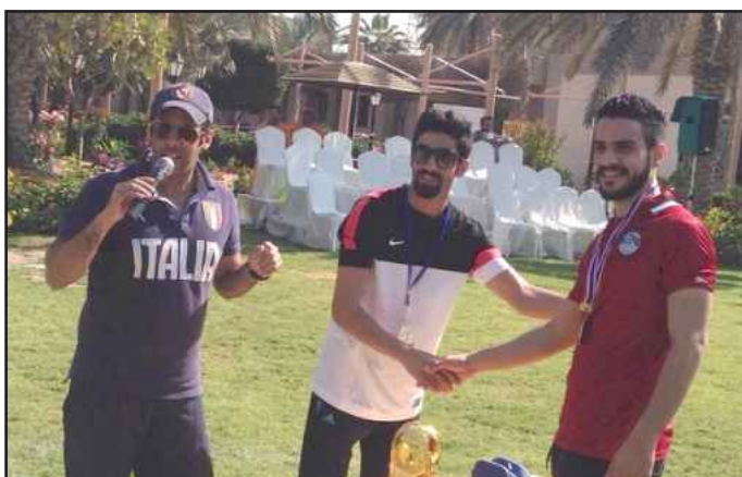
● اثناء توزيع الكؤوس

ودعا النزال الطلاب الراغبين في المشاركة في البطولة مراجعة مكتب الاشراف