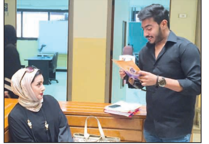
● سؤالنا يقول

وتفاعلهم عبر مواقع التواصل الاجتماعي للبرنامج من خلال هاشتاق #شغل عقلك واربح. كما أن القبول الطلابي لهذه المسابقة والتفاعل مع عدسة البرنامج قد أعطت للمسابقة أجواء رائعة، خرج الطلبة فيها من روتين اليوم الدراسي وأملت وقت فراغهم خلال فترة البريك الجامعي بكل ما هو مفيد وممتع. و وعدت اللجنة الإعلامية بمزيد من المفاجآت في انتظار طلبة الجامعة، لاسيما وان اللجنة وضعت ضمن خطتها الإعلامية التجول عبر عدسة البرنامج بين جميع الكليات بلا استثناء بهدف الوصول الى أكبر عدد من المشاركين وتوزيع الجوائز عليهم، بالإضافة إلى الترويج لمسابقة الدوري الثقافي الثاني لكليات جامعة الكويت في نسختها الثانية التي ستجري انطلاقتها في ٢٨ مارس المقبل.