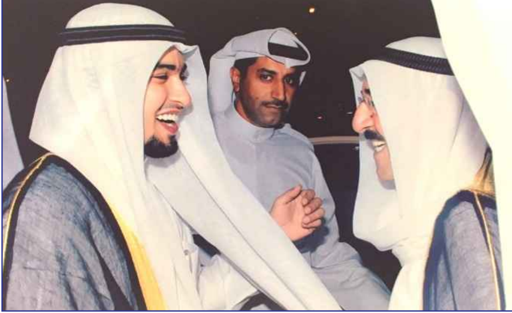
● سلمان الهبيدة مع سمو امير البلاد الشيخ صباح الاحمد الصباح