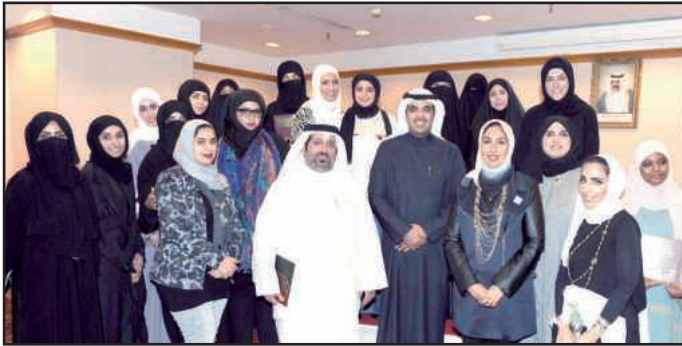
● لقطة تذكارية