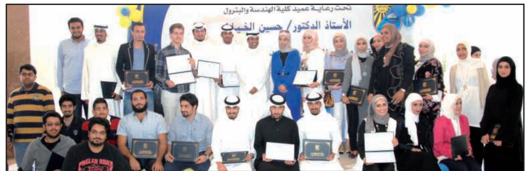
A group photo of the honored students