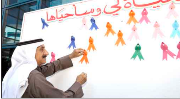
● د. أسيري مشاركا في حملة دعم الأمراض