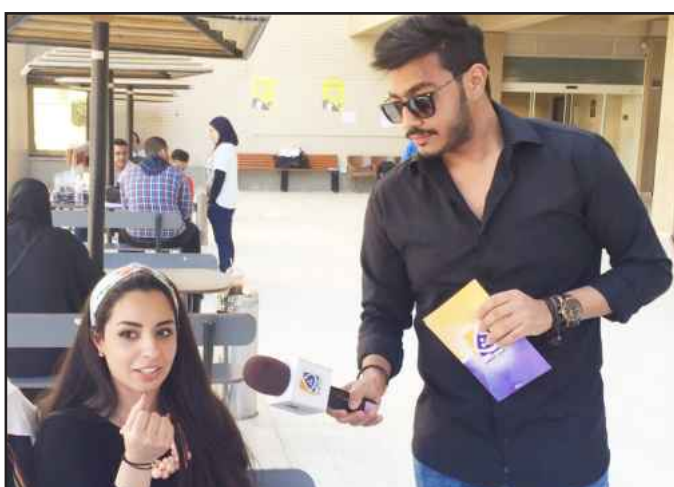
• من جولة البرنامج

اتفق قياديو الجامعة على أهمية الثقافة لدى الطلبة واكتسابها من خلال الأنشطة والفعاليات التي تقيمها عمادة شؤون الطلبة، والذي يعتبر الدوري الثقافي ٢ جزءاً من هذه الأنشطة التي تقام داخل الجامعة.