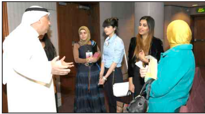
● تشاور مع عميد شؤون الطلبة