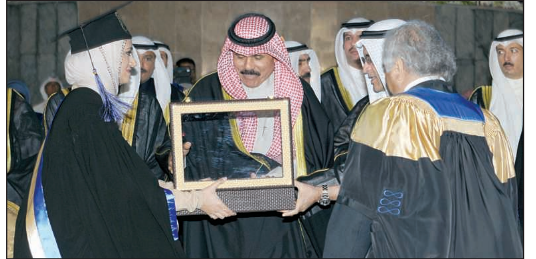
خريجو الجامعة يهدون سمو ولي العهد هدية تذكارية في الحفل الماضي

الخدمات التي نقدمها أفضل ، ازداد الاعتماد علينا في تقديم تلك الخدمات. وأكد على أن أفق ممارسة مهنة الصيدلة في توسع كبير في جميع أنحاء العالم، وذلك يرجع للثقة التي استطاع الصيادلة اكتسابها من مجتمعهم، وهذا ما يجب أن تحتذوا به في مسيرتكم القادمة وهذا هو الباب التالي الذي ينبغي عليكم فتحه.