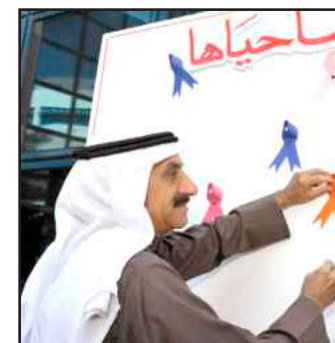
Prof. Assiri viewing the presented health ribbons

Nevertheless, the college’s celebration included an organized signature campaign to raise awareness of the various diseases that affect women. With each signature the campaign received from participants, members presented them with women’s health ribbons. Signatures were collected to raise awareness and strengthen efforts to promote women’s health with a primary health care approach.