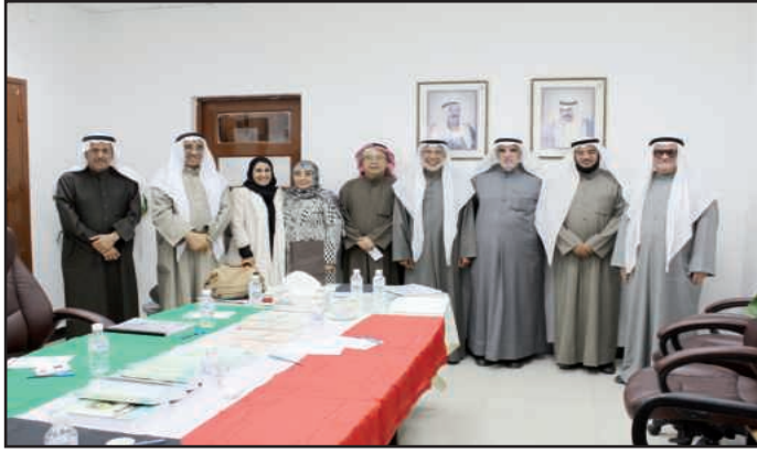
● لقطة تذكارية