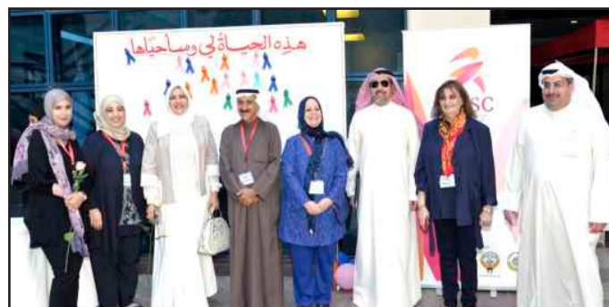
A group photo with some of the participants at the Women’s Health day