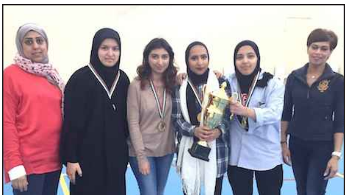
● فريق الآداب يحمل كأس البطولة

نظمت إدارة الأنشطة الرياضية بعمادة شؤون الطلبة بطولة الكليات لكرة السلة بمشاركة 3 فرق هي: كلية الآداب، وكلية العلوم الحياتية، وكلية العلوم، بصالة الألعاب الرياضية بكيفان.