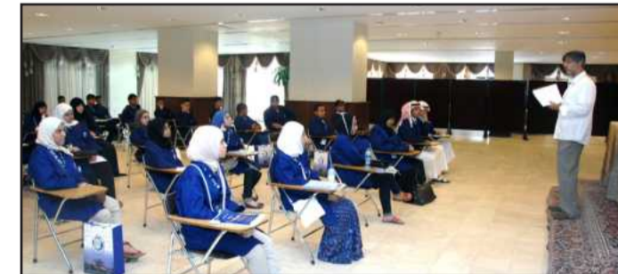
● جانب من إحدى الورش

سياسية في البلاد. وكشف الملا أنه ولأول مرة سيشترك جميع الطلبة المتدربين بورش عمل النانو تكنولوجي التي سوف تقسم إلى 3 مشاريع، موضحاً أنه سيتم توزيع الطلبة في ورش عمل مختلفة في أقسام كلية الهندسة والبتترول، كقسم الهندسة الميكانيكية والهندسة الكهربائية وهندسة الكمبيوتر والبرمجة، مشيراً في الوقت ذاته إلى أنه سيقام حفل اختتام للدورة، يتم من خلاله عرض مجموعة متميزة من مشاريع الطلبة المشاركين بالدورة، متمنياً أن تساهم هذه الدورة في تحقيق أهدافها المنشودة، وتساعد الطلبة في اختيار تخصصاتهم المناسبة في المستقبل.