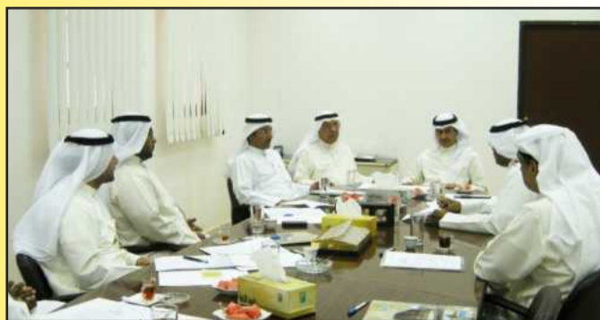
● جانب من الاجتماع

وجاء الاجتماع الأول لتحديد اختصاصات اللجان العاملة في الانتخابات ، من أجل النهوض بالعملية الانتخابية، وحسن سير العمل واتخاذ القرارات والإجراءات اللازمة ذات الصلة وفق اللوائح الجامعية والقواعد المقررة بهذا الشأن، وتم تكليف رؤساء اللجان باختيار الاعضاء المشاركين في كل لجنة . طالع ص ٣