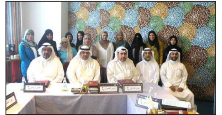
● ختام دورة «برمج عقلك»