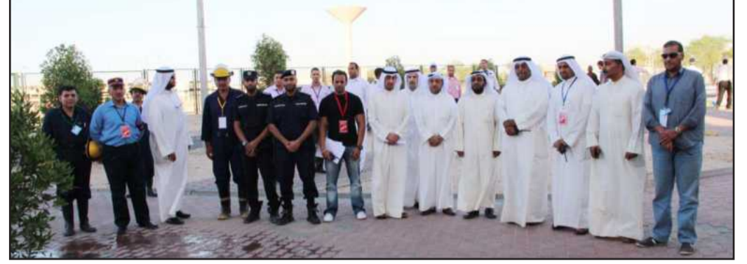
● لجنة الطوارئ مع أفراد الداخلية