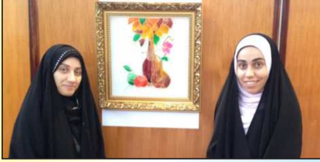
● طالبتان مع إحدى اللوحات