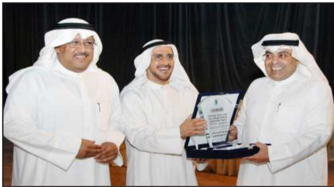
● .. ودرع ليفصل مقصيد