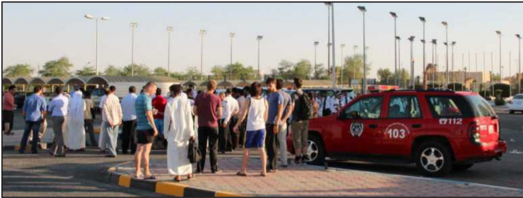
● التجمع خارج السكن بعد الإخلاء