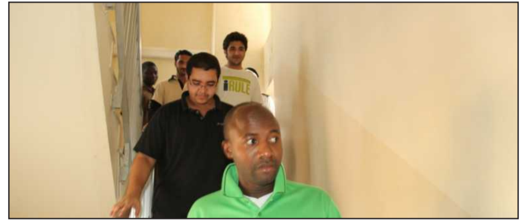
● جانب من عملية الإخلاء