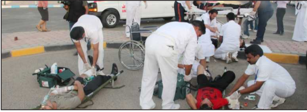
● اسعاف و عناية طبية