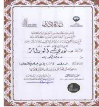
● شهادة تقدير من جائزة القرآن الكريم ومسموعة ومقروءة، ويقدم شرحاً مفصلاً للقاعدة اللغوية بالصوت،

ويخدم هذا البرنامج المتعلمين في جميع أنحاء العالم ليشمل طلبة المرحلة الابتدائية والمتوسطة والثانوية، وكذلك فئة المعلمين والمعلمات لقسمي اللغة العربية والتربية الإسلامية، بالإضافة إلى المكتبة المدرسية والمراكز الإسلامية التعليمية، وقد تم إعراب «جزء عم» كخطوة أولى تتبعها خطوات لإعراب القرآن الكريم كاملاً، كما قامت وزارة الأوقاف والشؤون الإسلامية بمراجعة البرنامج وتدقيقه وإجازته.