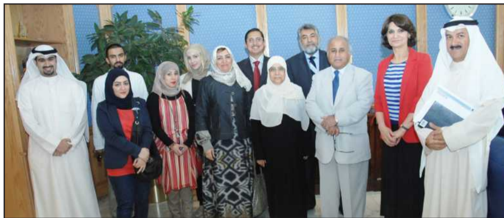
● لقطة تذكارية مع مدير الجامعة