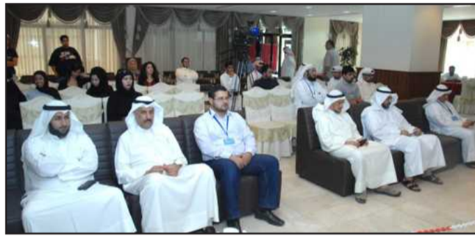
• لجنة التحكيم

وفيما يتعلق باللجنة المنظمة قال الملا: تضم ست اساتذة مختصين في مجالات الهندسة والميكانيك وبرمجة الحاسوب والرياضيات ويتم التحكيم في المسابقة على أسس ومعايير تحكيم علمية، وقد تم تخصيص مبلغ وقدره ١٥٠٠ دينار كويتي لتوزيعها على الفائزين.