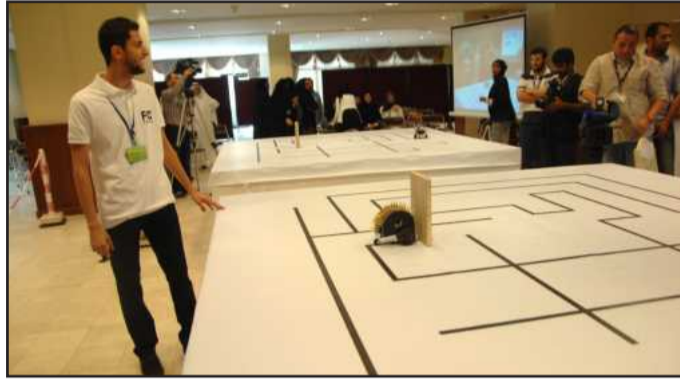
• جانب من المسابقة