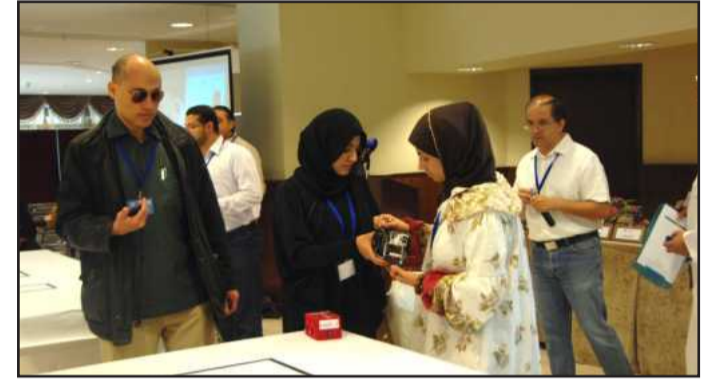
• مشاركتان من التعليم التطبيقي

إلى قسمين، ففي المرحلة الاولى لكل فريق محاولتين للوصول إلى نقطة النهاية بمدة لا تزيد عن خمس دقائق لكل محاولة وستعتمد لجنة التحكيم افضل وقت بين المحاولتين وسيكون مسار الروبوت في هذه المرحلة متوسط الصعوبة وسيتم اختيار افضل عشر مشاركات للمنافسة للمرحلة الثانية.