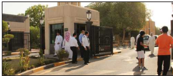
● تنظيم دخول السيارات

ساهمت إجراءات إدارة الأمن والسلامة والتنسيق مع مركز التقييم والقياس من خلال التنظيم والتأمين بتسهيل إنجاز اختبارات القدرات الأكاديمية لطلاب وطالبات المرحلة الثانوية من خلال تنظيم حركة السير في الشوارع المحيطة والمؤدية لمواقع الجامعة في الخالدية و كيفان بالتعاون مع وزارة الداخلية بالإضافة إلى نقل وتأمين حقائب الأسئلة والأجوبة . هذا وقامت الإدارة بالتنسيق مع وزارة الصحة لتوفير سيارات الإسعاف تحسبا لأي طارئ ، وزيادة أعداد أفراد الأمن والمشرفين لتنظيم وإرشاد الطلاب والطالبات للوصول إلى أماكن قاعات الاختبارات .