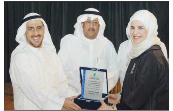
● درع تذكارية لاحدى المشاركات