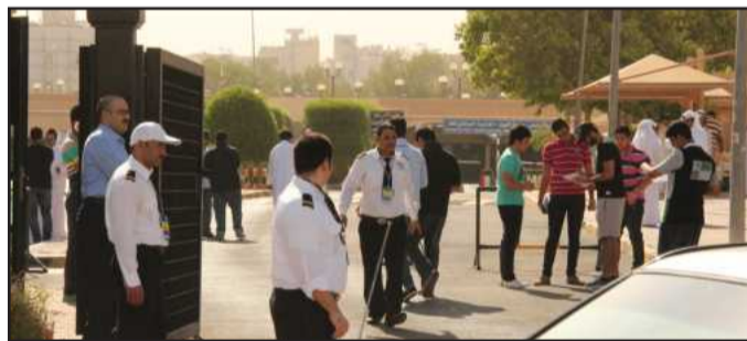
● أفراد الأمن يرشدون الطلبة إلى إحدى القاعات