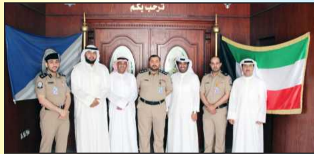
● لقطة تذكارية في إدارة العمليات