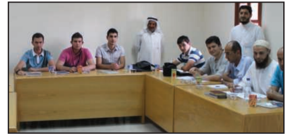
● المشاركون في الدورة

كتبت فجر بوردن: نظمت عمادة خدمة المجتمع والتعليم المستمر ممثلة بقسم التعليم المستمر «دورة اللغة العربية لغير الناطقين بها» ، والموجهة لمجموعة من الدارسين الأترارك في جامعة السلطان محمد الفاتح الوقفية باسطنبول والتي تأتي ضمن زيارتهم لجامعة الكويت بناءً على دعوة مدير الجامعة