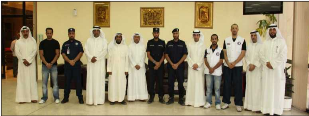
● لقطة تذكارية