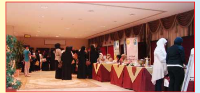
● جانب من المعرض