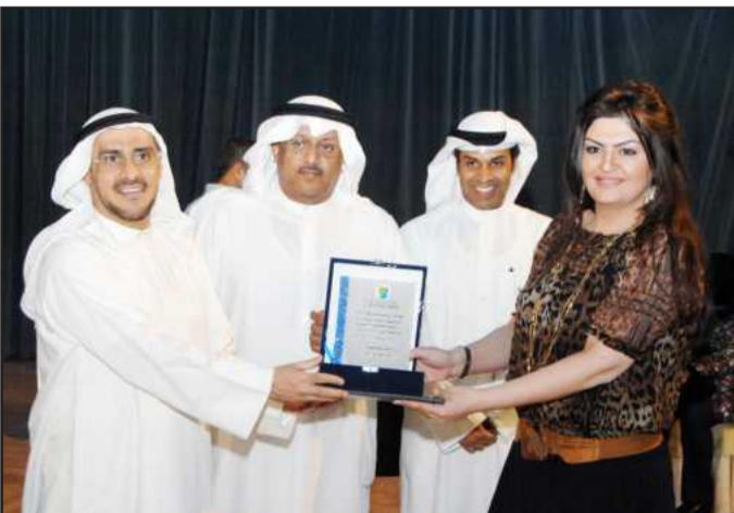
● مشاركة تتسلم درعها