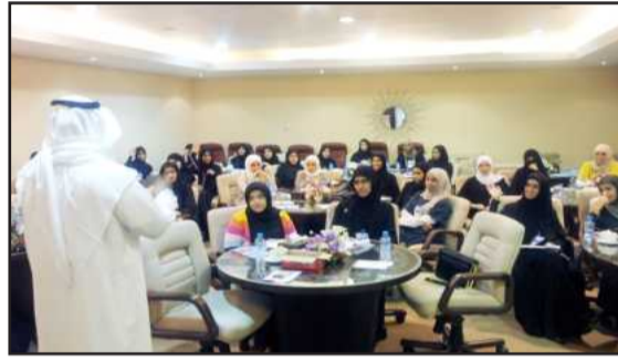
● اهتمام و متابعة