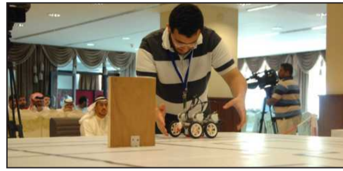
• استعداد قبل البدء

د. الخياط: نتمنى توسع المسابقة خلال السنوات المقبلة لتشمل جميع شرائح المجتمع