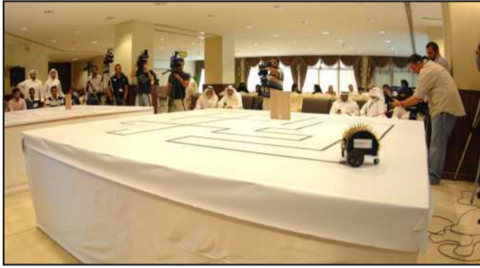
تصوير: بنز جوزيف • توثيق اعلامي للمسابقة

د. الملا: آلية التحكم تنقسم إلى مرحلتين الأولى تؤهل ١٠ مشاركات للثانية