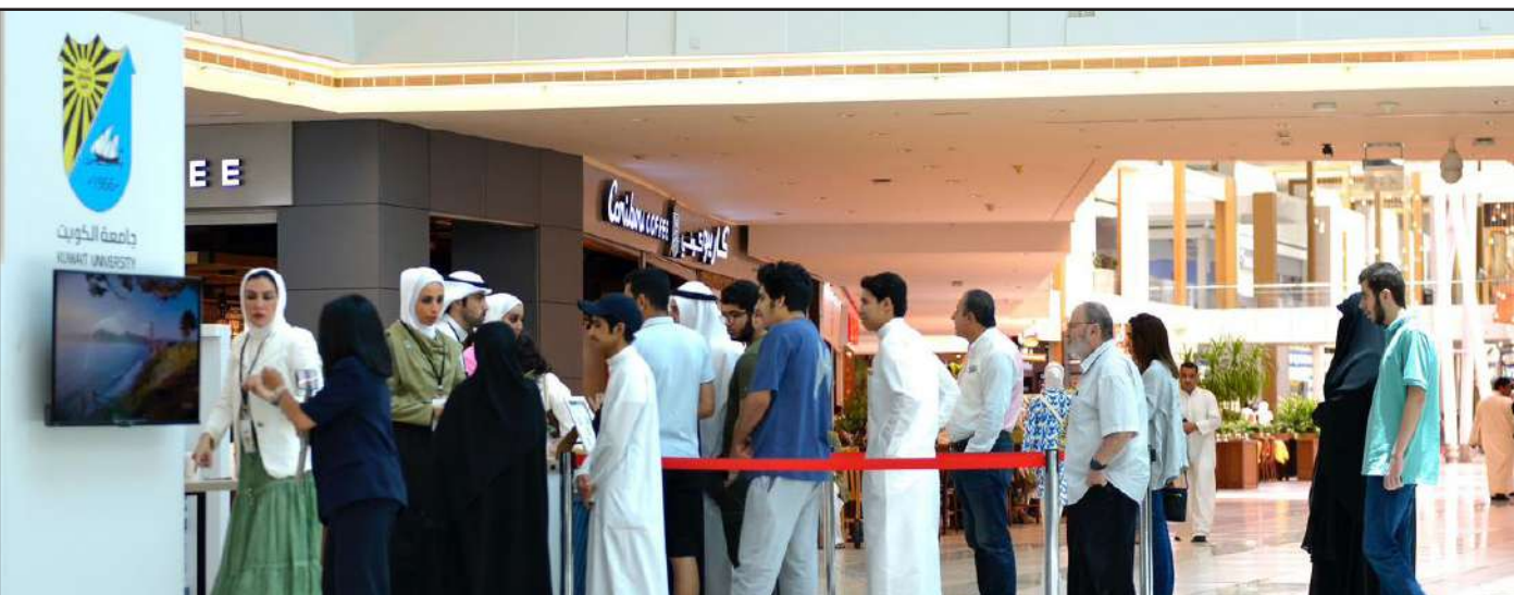
إقبال طلابي على جناح الجامعة

وأشارت إلى تفاوت الرغبات واختلافها، لافتة أن هناك رغبة شديدة في التخصصات الطبية