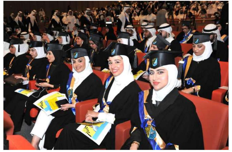
جانب من الحفل