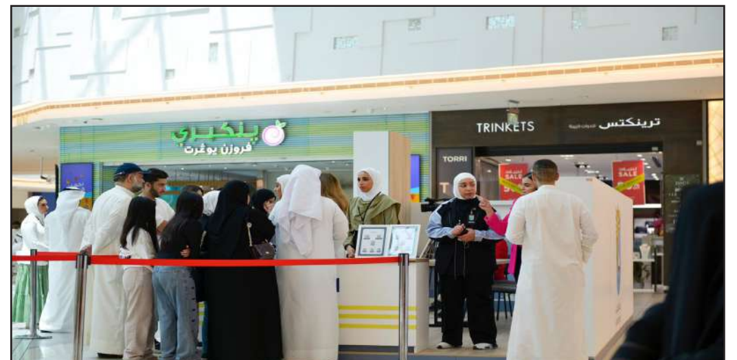
إجابة على كل الأسئلة