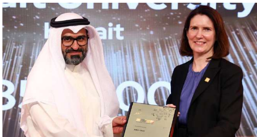
تسليم الشهادة لممثل الجامعة

أحرزت جامعة الكويت تقدماً في تصنيف QS العالمي للجامعات (2024) وحلت في المرتبة 851 – 900 من إجمالي مشاركات 2963 جامعة عالمية.