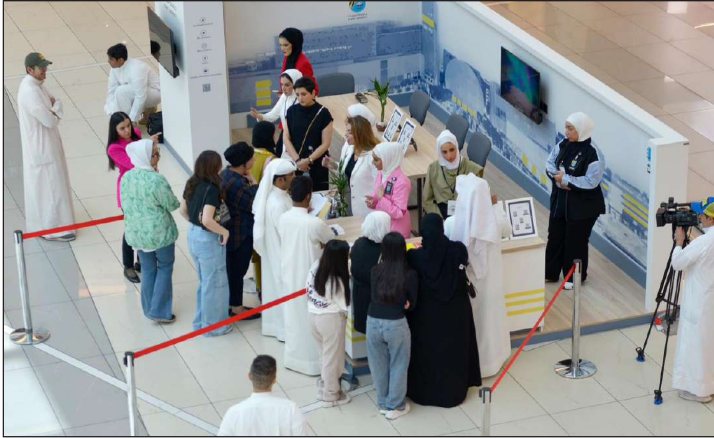
الطلبة في جناح الجامعة