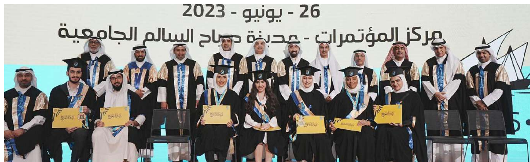
أساتذة الهندسة والخريجون