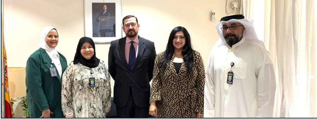
السفير الأسباني مع مدير مركز خدمة المجتمع