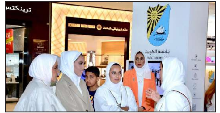
إجابة على الأسئلة