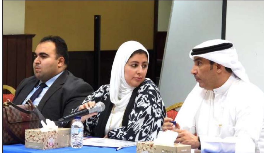
جانب من الجمعية العمومية لصندوق الضمان الاجتماعي