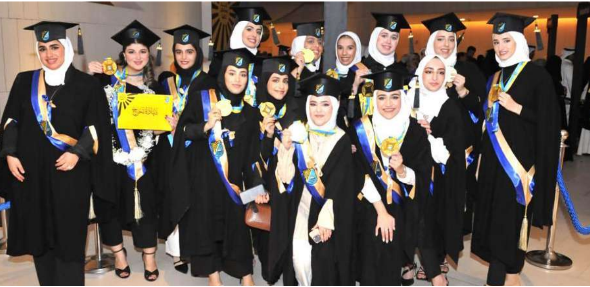
جانب من الخريجات