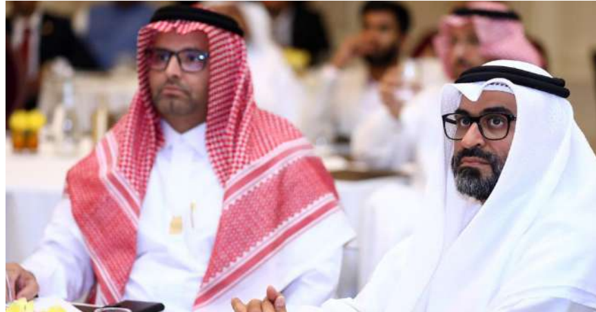
متابعة اعلان النتائج