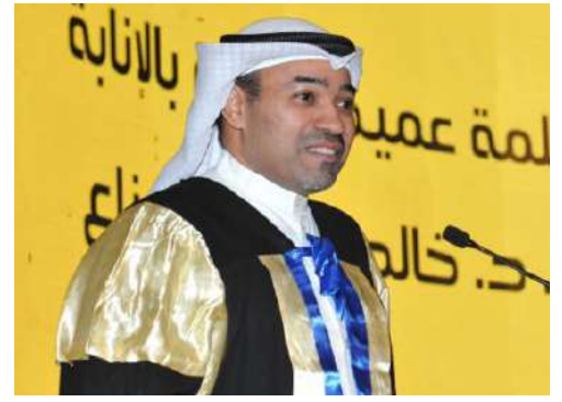
أ.د. خالد الهزاع