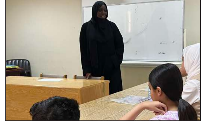
شيري بازار خلال الدورة