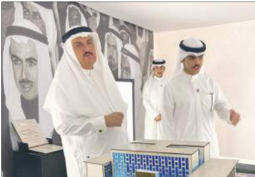
عميد الكلية أثناء الاحتفالية