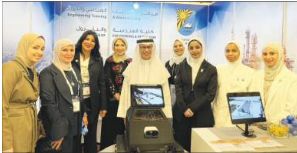
لقطات متفرقة لطلبة كلية الهندسة والبتترول المشاركين في المؤتمر

المؤتمر من أبرز الفعاليات الخليجية المتخصصة في قطاع الكهرباء والطاقة الجديدة والمتجددة