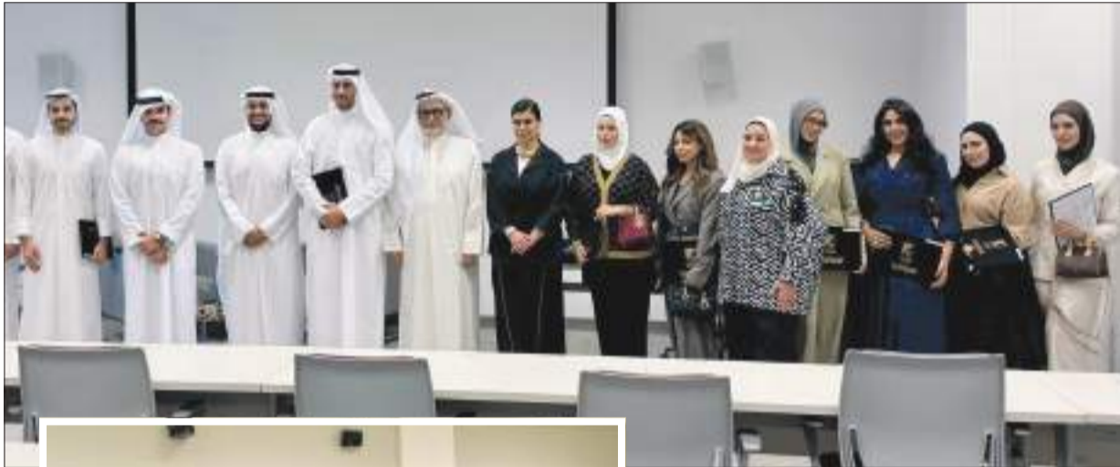
لقطة جماعية للمشاركين والمشرفين على البرنامج