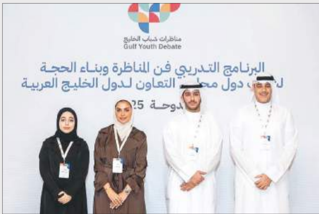
الوفد المشارك في البرنامج الخليجي

البرنامج استمر على مدى أسبوع كامل تخللته ورش تدريبية مكثفة