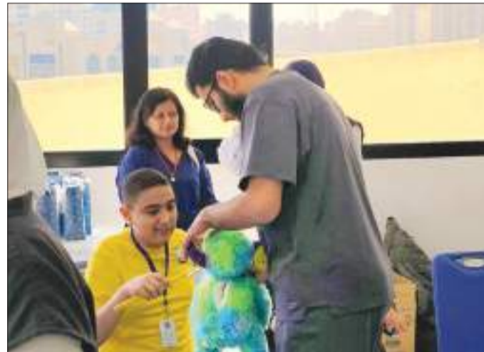
لقطات مختلفة لطلبة كلية طب الأسنان لذوي الاحتياجات الخاصة