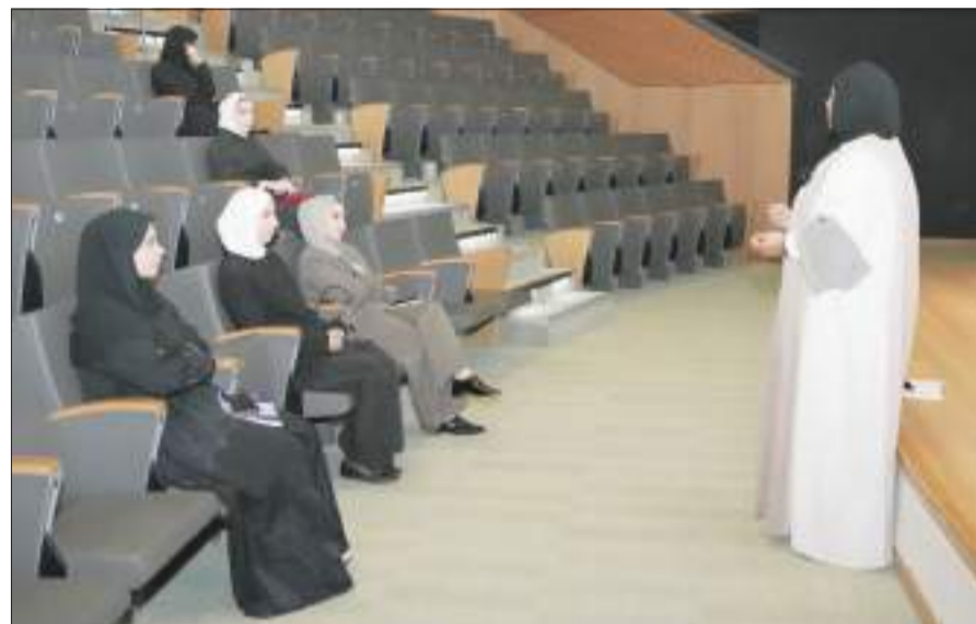
جانب من المحاضرة

بعض الممارسات الخاطئة المنتشرة في بعض الأسر، مثل الاعتماد المفرط على العمالة المنزلية أو تخصيص خادمة لكل طفل، مما يؤدي إلى إضعاف روح المسؤولية والاستقلالية لدى الأبناء، داعية إلى ضرورة توزيع المهام بين جميع أفراد الأسرة بما يمنع تراكم الأعباء على طرف واحد. واختتمت المحاضرة بالتأكيد على أن النجاح الحقيقي للأم الطالبة يكمن في قدرتها على الموازنة بين أدوارها المختلفة دون إغفال جانبها الإنساني والنفسي والديني، لتكون نموذجاً يُحتذى في العطاء والتميز.