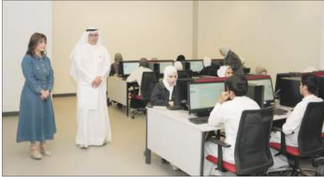
جانب من متابعة مديرة الجامعة لسير عملية الاختبارات

د. الميلم: جامعة الكويت مستمرة في تطوير آليات التقييم والقياس بما يتوافق مع أحدث المعايير الأكاديمية