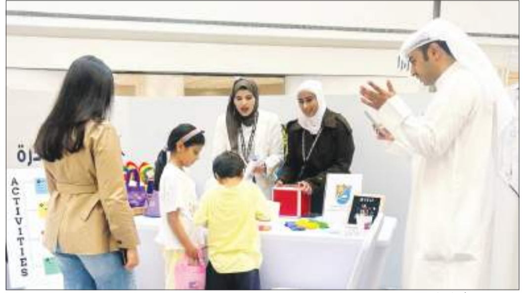
جانب من مشاركة كلية الصحة العامة بالمبادرة

ونشر ثقافة الحياة الصحية عبر الأنشطة التفاعلية والاستشارات التغذوية الرياضية، نحو مجتمع أكثر صحة وجودة حياة أعلى.