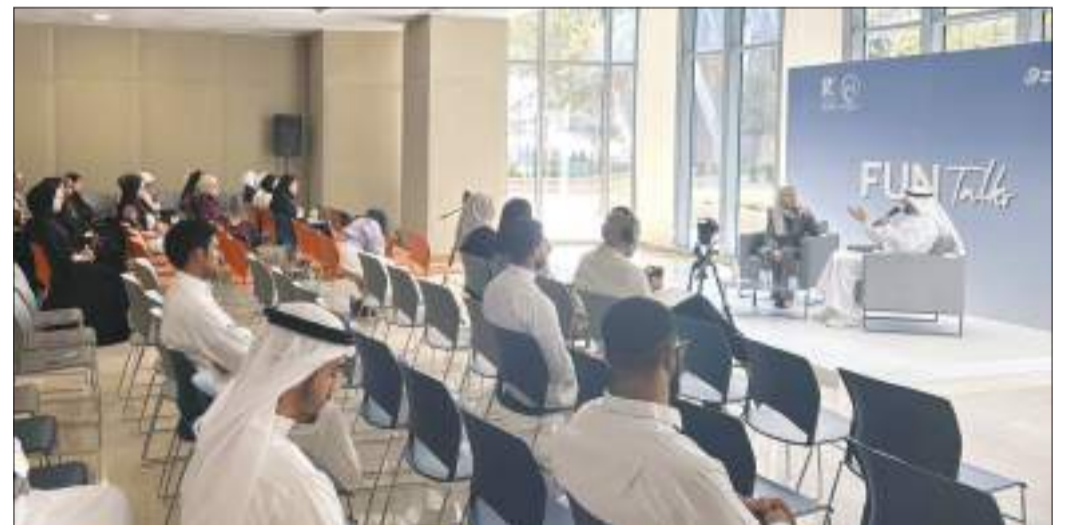
جانب من اللقاء الحواري