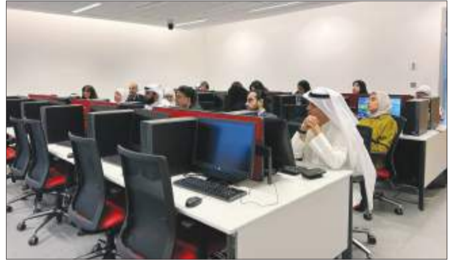
المشاركون في الورشة