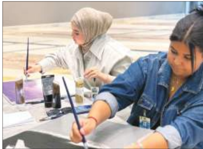
لقطات من الورشة