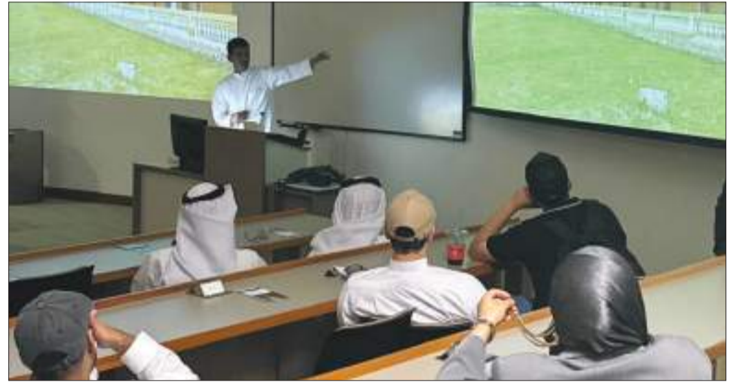
جانب من ورشة التصوير الفوتوغرافي

الأنشطة الثقافية والفنية التي تنظمها عمادة شؤون الطلبة بهدف صقل مهارات الطلبة وتنمية شغفهم بعالم التصوير الفني.