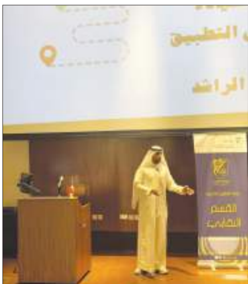
جانب آخر من المحاضرة