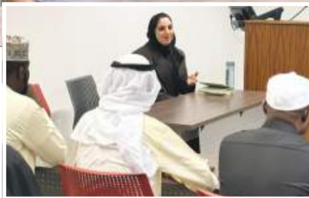
جانب آخر من الورشة

التي يمرّ بها طلبة الدراسات العليا في إعداد الرسائل العلمية، ابتداءً من اختيار الموضوع، مروراً ببناء الفصول وتنظيم الوقت، وتجاوز ما يُعرف بقفلة الكاتب، وصولاً