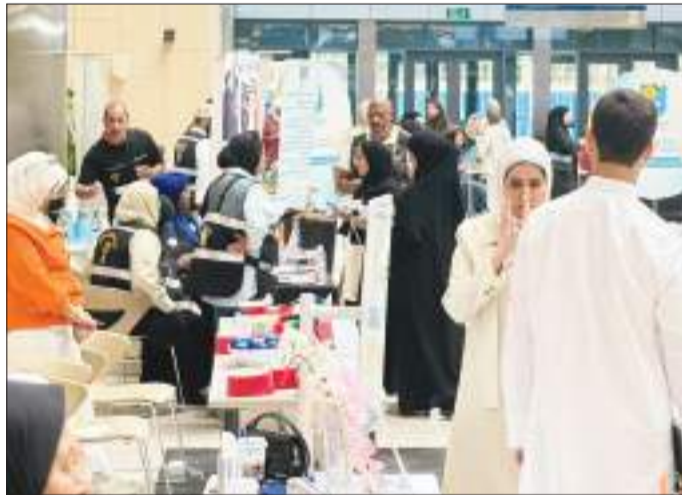
لقطات متفرقة من المعرض