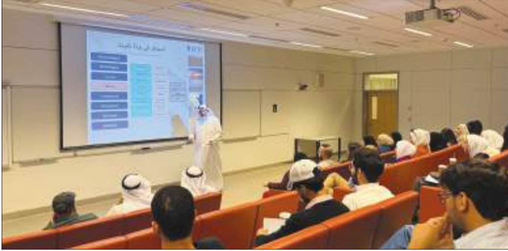
جانب من المحاضرة