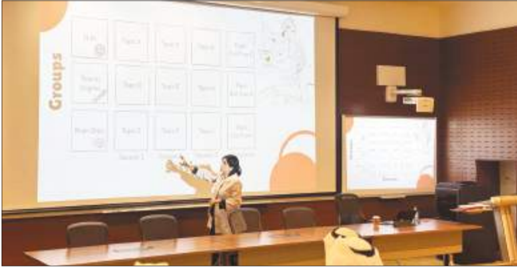
جانب آخر من الورشة