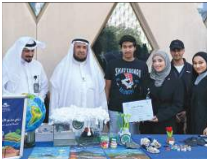
عميد شؤون الطلبة وعميد كلية التربية مع عدد من الطلبة المشاركين

جسدت تطبيقات علمية مبتكرة يمكن تنفيذها داخل الصفوف الدراسية. وتهدف هذه المبادرة إلى إثراء المعرفة العلمية لدى طلبة كلية التربية، وتزويدهم بأفكار وأساليب عملية قابلة للتطبيق داخل الفصول الدراسية، مما أتاح للحضور فرصة مميزة للتعرف على طرق جديدة لتوظيف الوسائل التعليمية الحديثة في المدارس وشهدت الفعالية حضوراً لافتاً من أعضاء هيئة التدريس والطلبة.