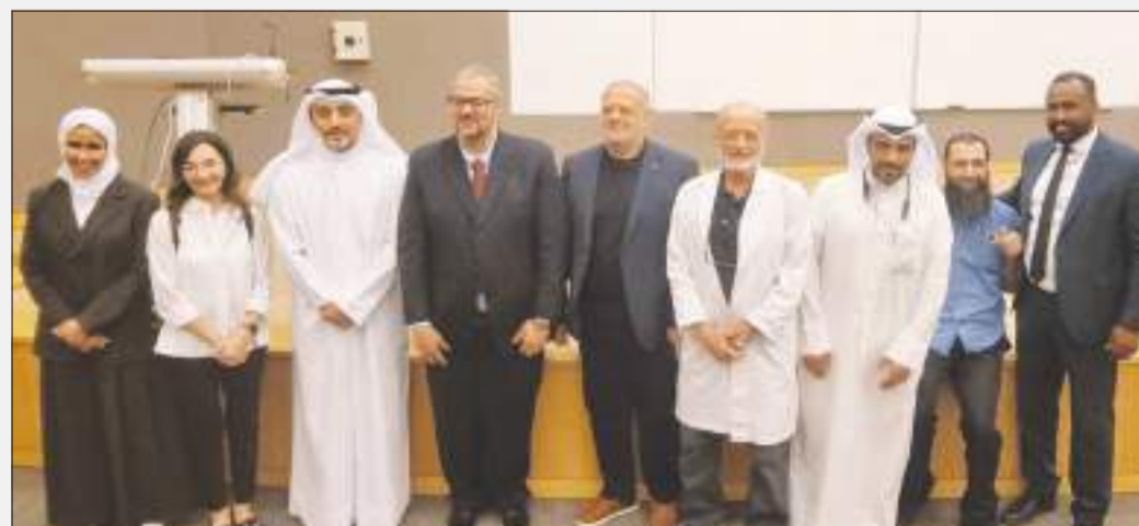
الضيف الزائر بتوسط أسرة كلية العلوم في لقطة جماعية