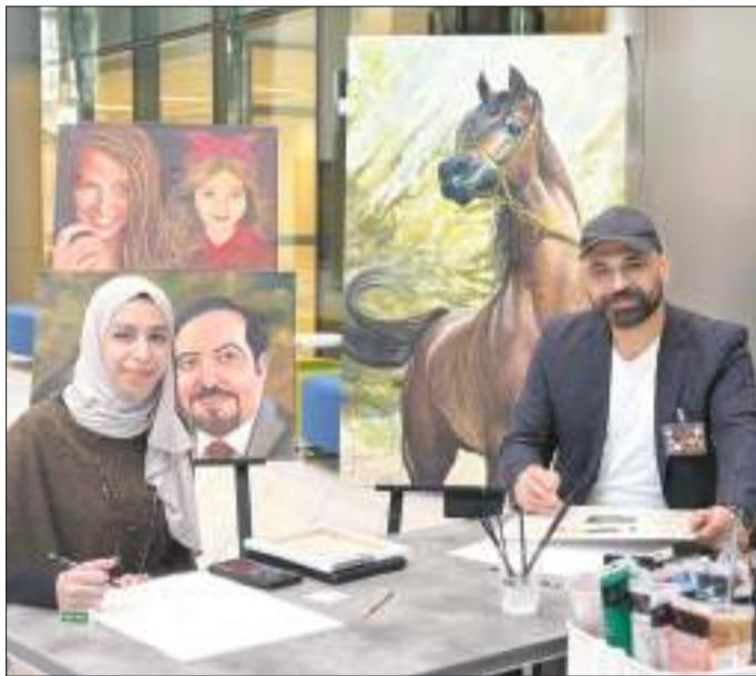
جانب من ورشة الرسم