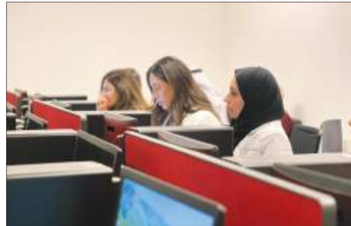
جانب من الورشة

قدم محاضرة عن أحدث التوجهات والتحديات في مجال الذكاء الاصطناعي