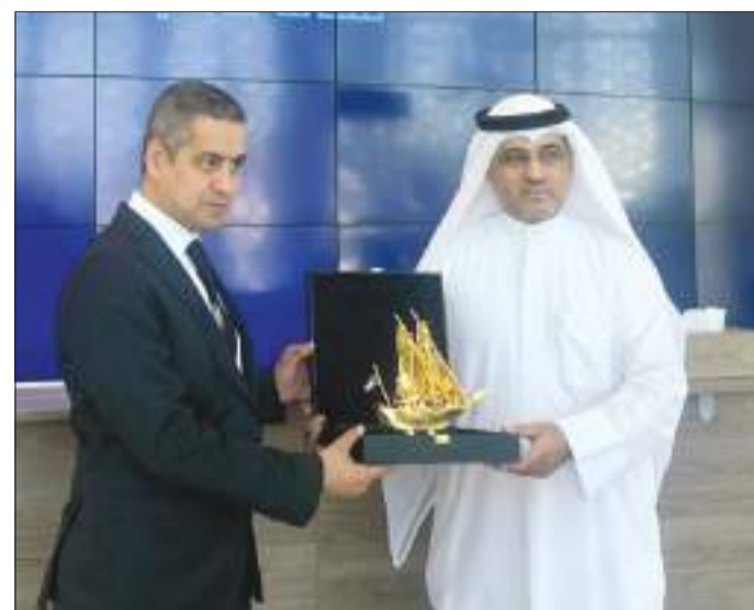
أ.د.أسامة العمير يكرم رئيس الوفد الزائر