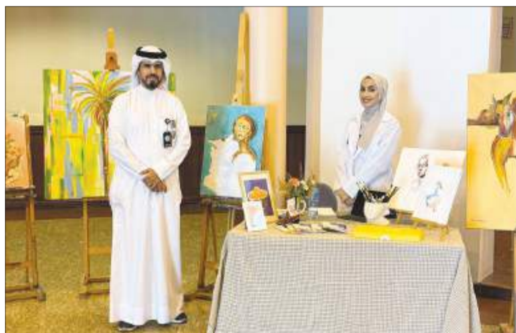
أعضاء القسم الفني بإدارة الأنشطة الثقافية

المعرض هدف إلى تعريف طلبة الجامعة بفعاليات المرسم وأنشطته الفنية المتنوعة وإبراز الإبداعات في مجالات الرسم والتصوير الفني