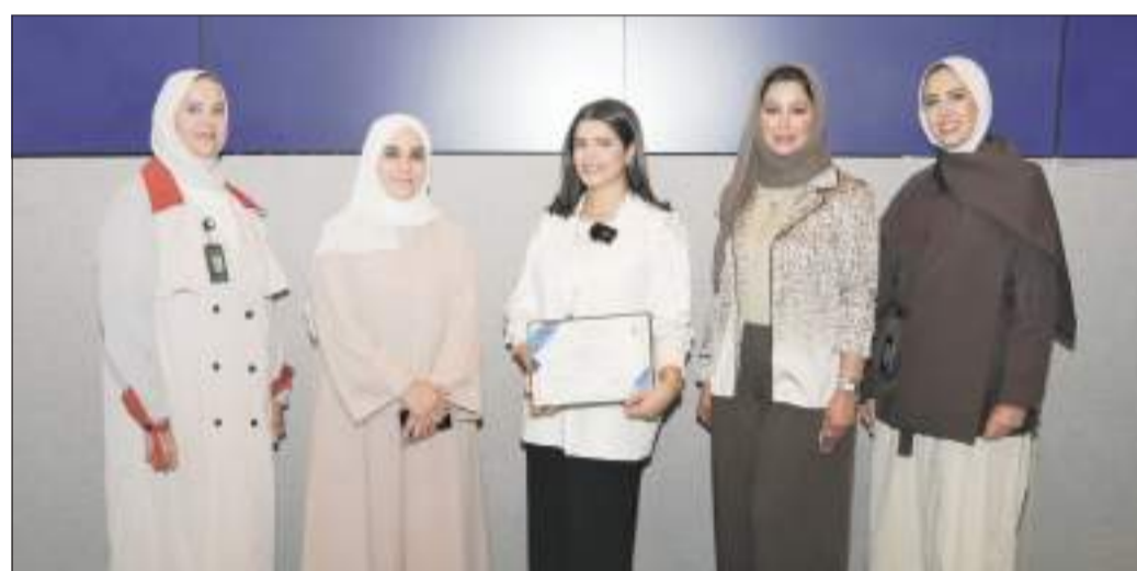
لقطة جماعية أثناء التكرم

المركز، بالإضافة إلى موظفي الإدارات الجامعية. في هذا السياق، ناقشت المحاضرة مفهوم القلق ومصادره