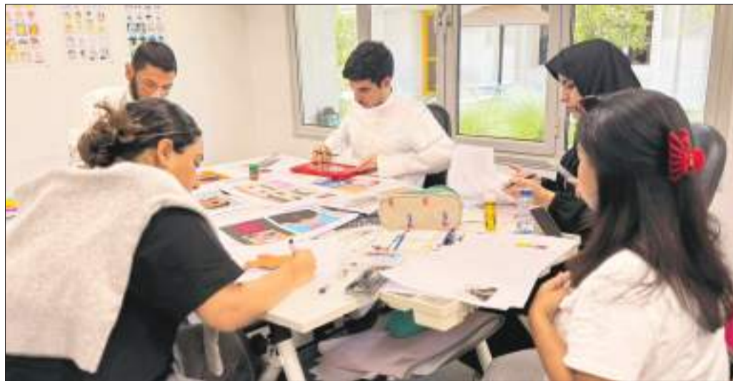
طلبة قسم التصميم أثناء عملهم للمشروع

قدّم طلبة مقرر (التصوير الضوئي 1) في قسم التصميم المرئي والداخلي، تحت إشراف د.مي الخرافي، في كلية العمارة مشروعاً بعنوان «البورتريه الذاتي - Self-Portrait Project»، الذي يهدف إلى تنمية مهارات الطلبة في التعبير البصري والتصميم الإبداعي.