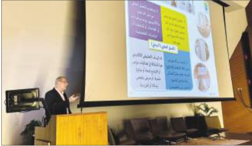
جانب من الورشة