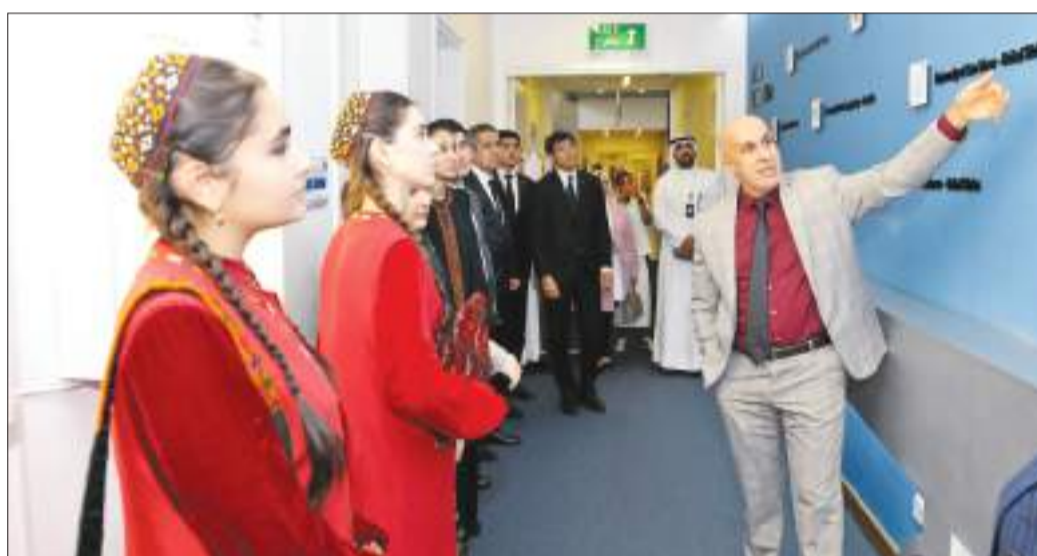
جانب من الجولة

الجولة شملت زيارة للمرافق الأكاديمية والبحثية في الكلية وشرح عنها