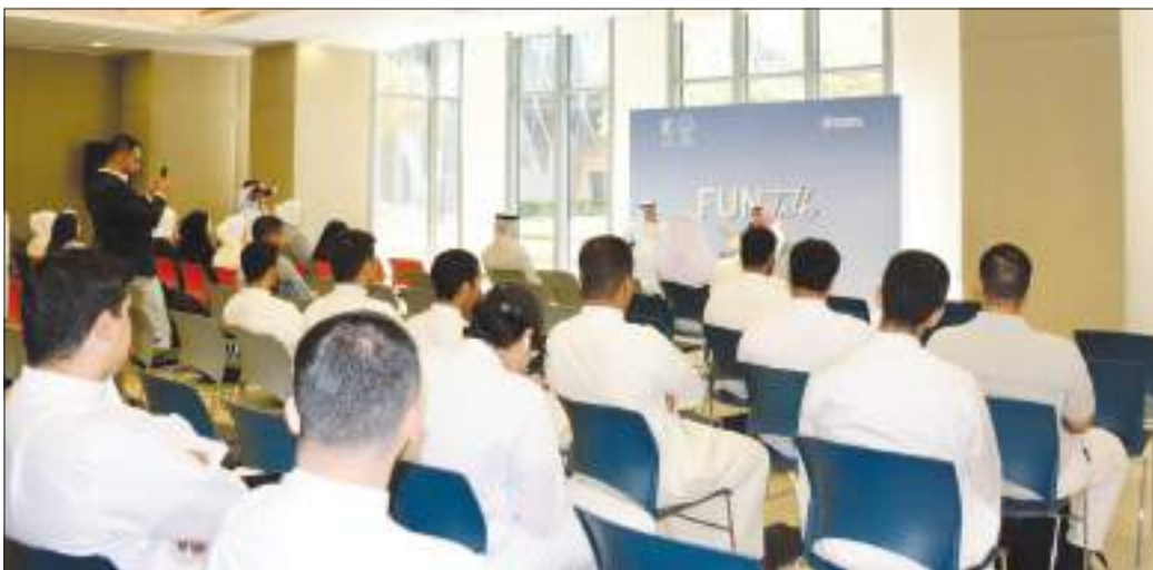
جانب آخر من الحضور