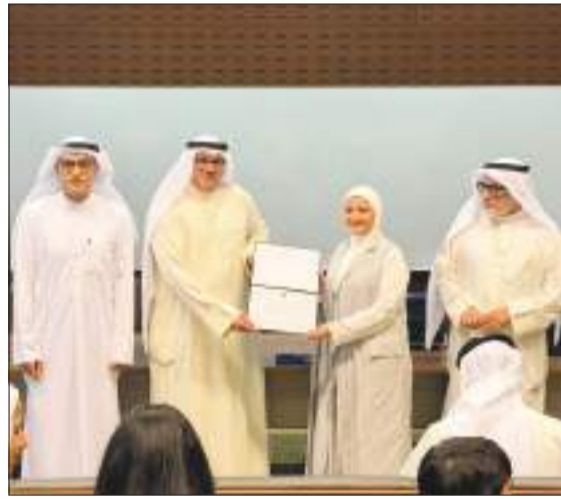
لقطات من التكريم