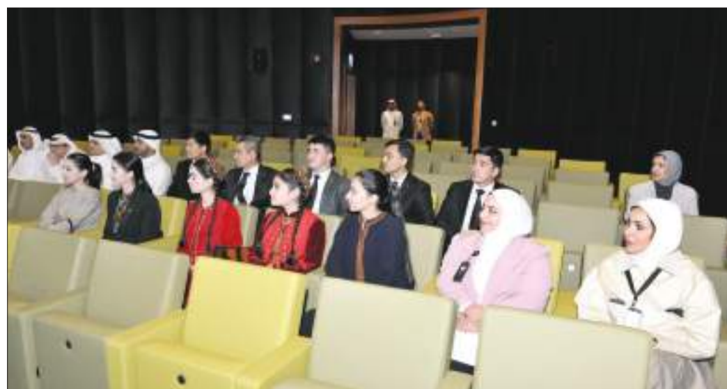
جانب من الحضور