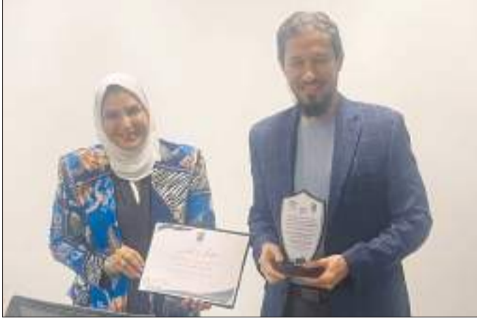
أ.د. شفيقة العوضي تكريم أ.د. بدر شفاقة العنزي