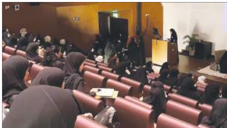
جانب من الندوة

والحياتية. تأتي هذه الندوة ضمن الأنشطة التي تنظمها عمادة شؤون الطلبة بهدف تعزيز الوعي الفكري والقيمي لدى الطالبات، وتشجيعهن على الجمع بين العلم والثقافة الدينية في حياتهن الجامعية.