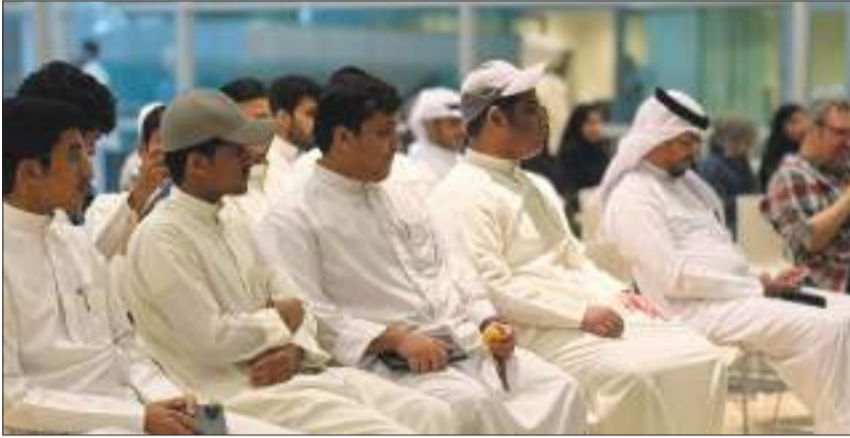
جانب آخر من الحضور

التركماني أكد أهمية الالتزام في بناء مسيرة فنية ناجحة