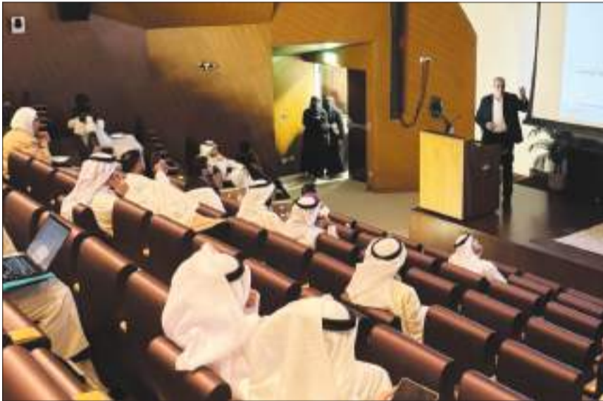
جانب آخر من الحضور