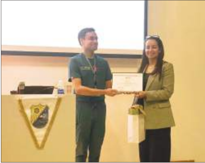
جانب من التكريم