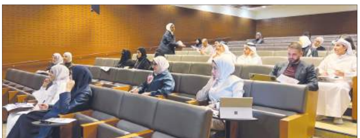
جانب من حضور الورشة