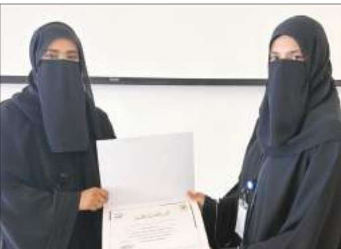
...و جانب آخر من التكريم