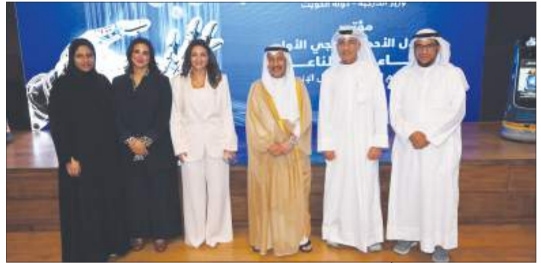
مشاركة المركز بمؤتمر الهلال الأحمر الكويتي

يؤكد التزامه بدعم الابتكار التقني في المجالات الإنسانية، وسعيه إلى بناء جسور التعاون بين المؤسسات الخليجية في سبيل تحقيق أهداف التنمية المستدامة من خلال أدوات الذكاء الاصطناعي.