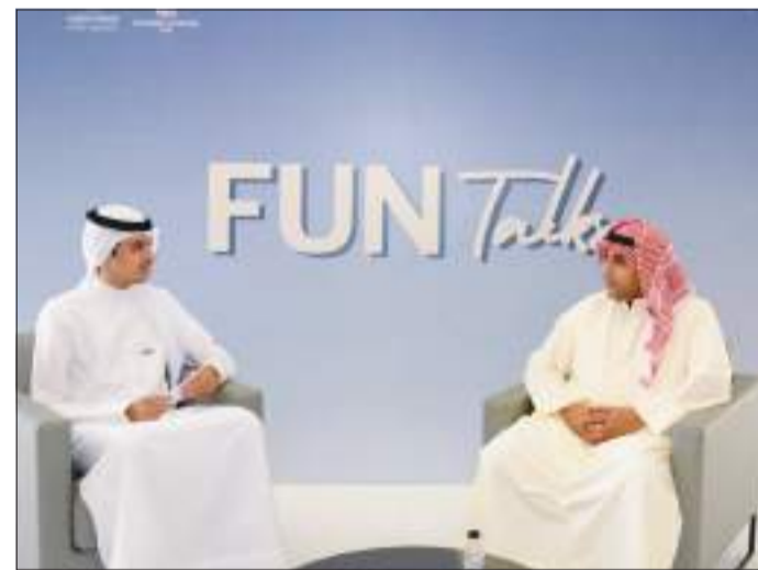
جانب من اللقاء الحواري