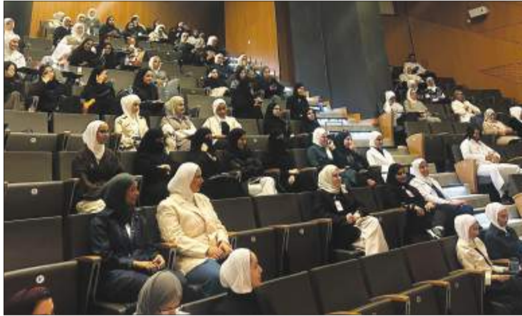
جانب من الحضور

المحاضرة شهدت تفاعلاً كبيراً من الطلبة المشاركين في التجارب العملية