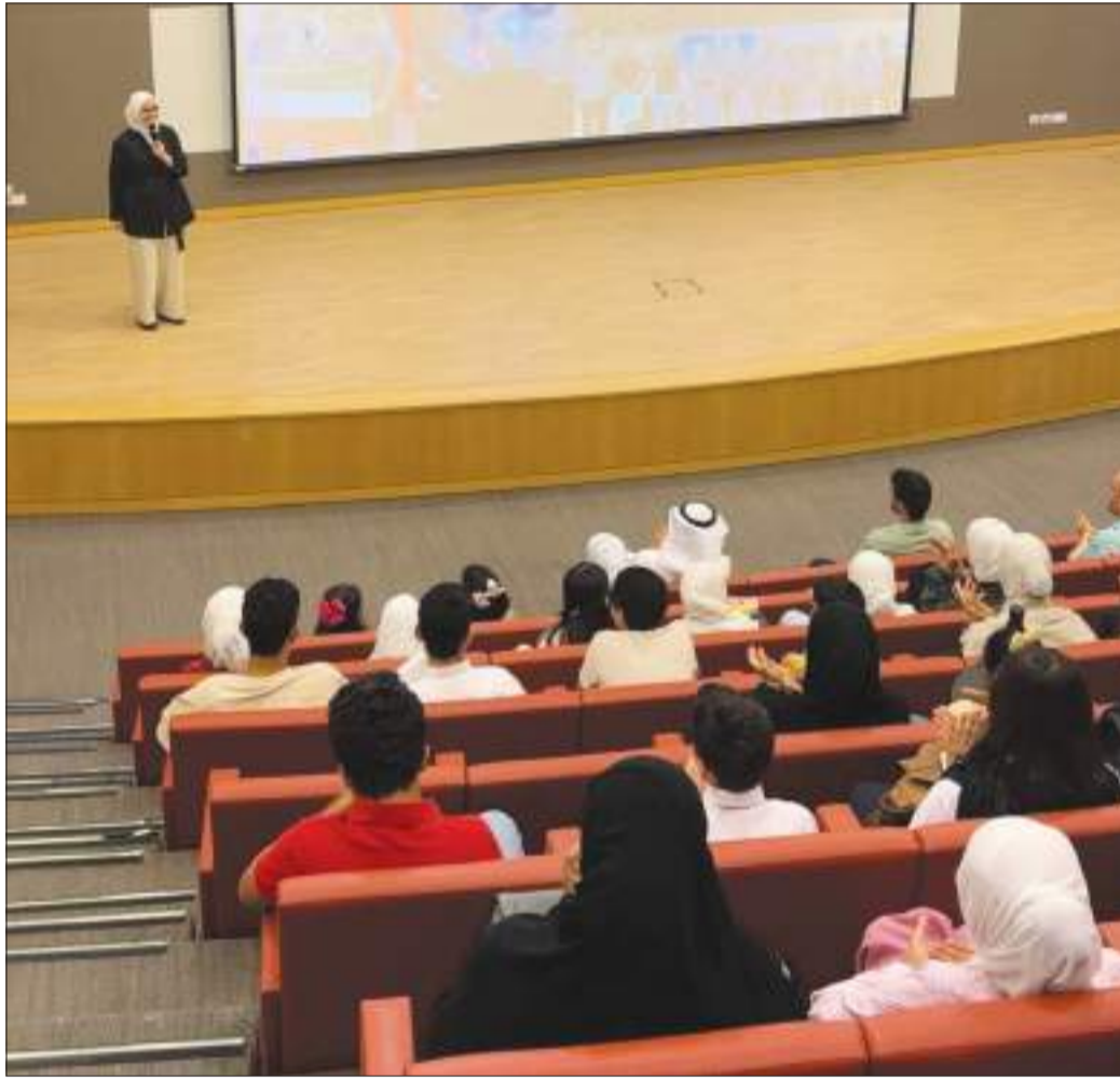
جانب من اللقاء التنويري

د.العبد الجليل: التدريبات الفعالية للمشاركين يومين أسبوعياً في كلية العلوم بمدينة صباح السالم الجامعية