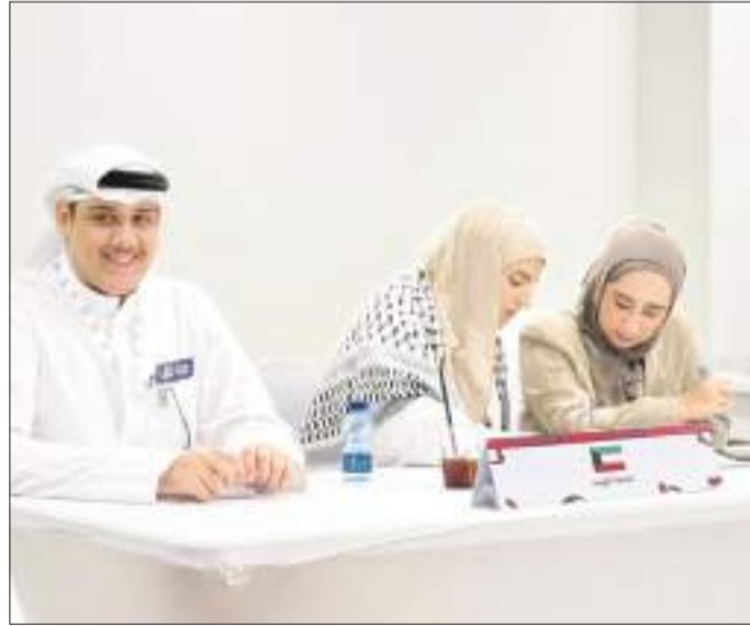
طلبة جامعة الكويت