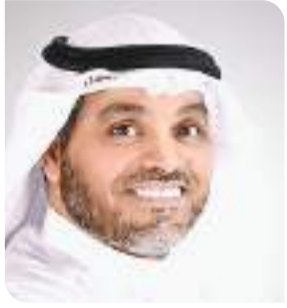
د. خالد القحس @drkhaledalqahs

يُرجى من الأساتذة الأفاضل، كتاب هذه الصفحات، الالتزام بعدد كلمات المقال بحيث لا تتجاوز 350 كلمة