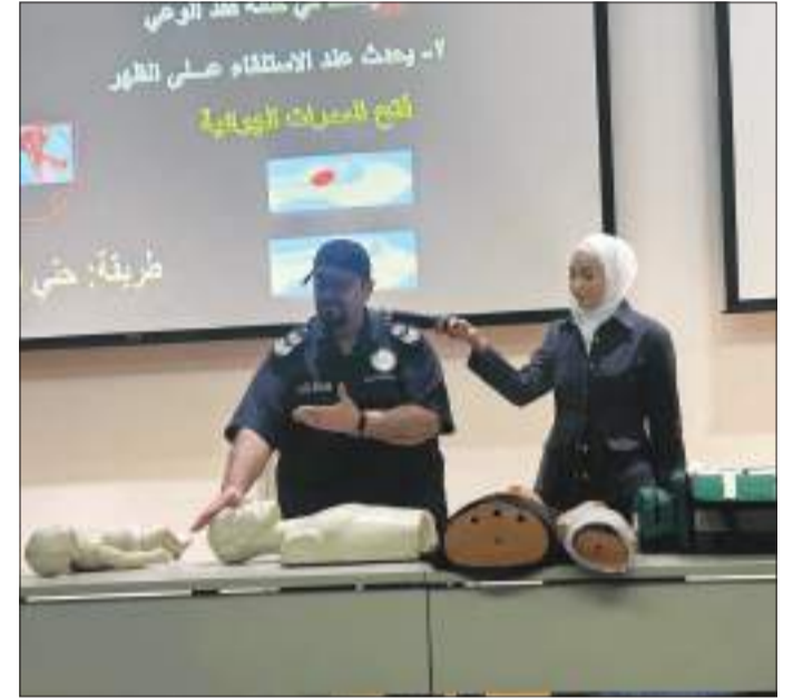
جانب من المحاضرة

وتأتي هذه المحاضرة ضمن برامج إدارة الشؤون الطلابية الهادفة إلى نشر الوعي الصحي بين طلبة جامعة الكويت وتعزيز مهاراتهم الحياتية بالتعاون مع الهيئة العامة للشباب ومختلف الأندية الطلابية.