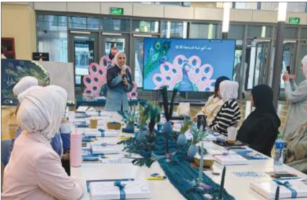
...وجانب آخر من الورشة