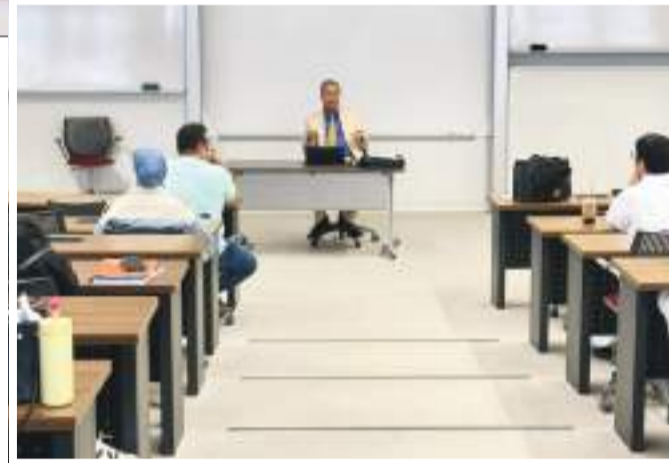
جانب من الندوة