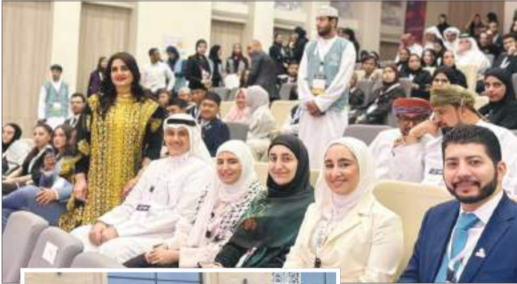
الوفد الكويتي في مقدمة الحضور