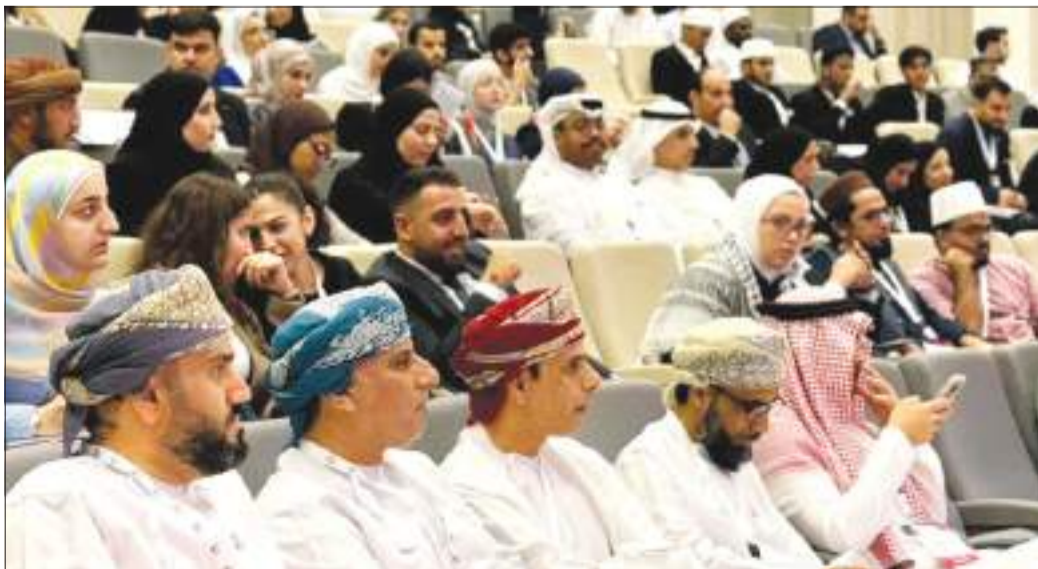
جانب من الحضور

تعزيزاً للهوية الأكاديمية العريقة والمكانة المحلية والعالمية للجامعة، شاركت الجامعة الثلاثاء الماضي، في منافسات النسخة الثالثة من بطولة مناظرات آسيا باللغة العربية، التي نظمتها مركز مناظرات قطر، بالتعاون مع مركز مناظرات سلطنة عُمان، بمشاركة 40 دولة من قارة آسيا.