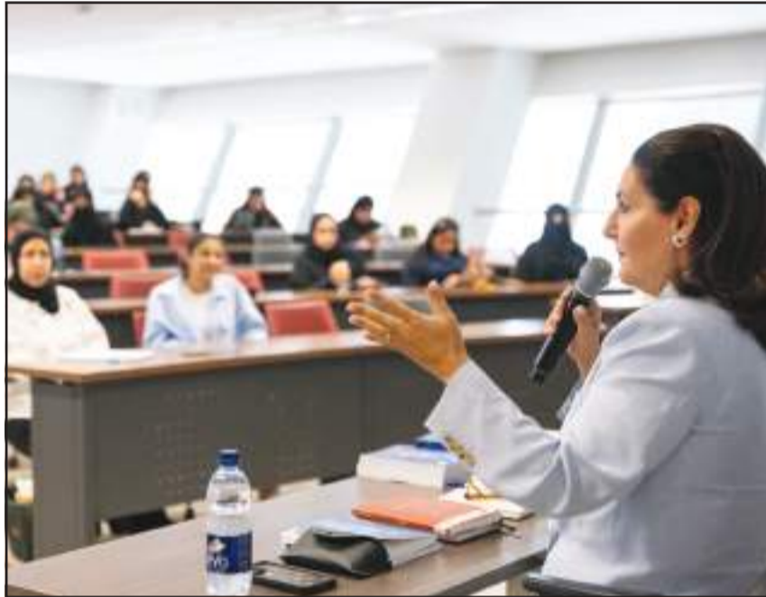
جلسة حوارية وأسئلة متبادلة بين الشاعرة الشبيخة أفراح مبارك الصباح والحضور

د. هيفاء السنغوسي: الشاعرة أفراح الصباح تعزج في شعرها بين صفاء اللغة وعمق الرؤية