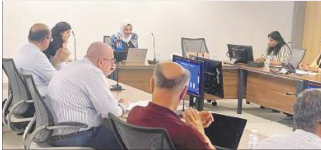
جانب من الاجتماع

المجلة هو ثمرة تعاون وجهود جماعية أسهمت في تطوير المحتوى العلمي. تعد مجلة الكويت للعلوم من المجلات الأكاديمية المرموقة، تصدر تحت مظلة الناشر (Elsevier) والمدرجة ضمن قاعدة بيانات المجلات ذات الوصول المفتوح (DOAJ – Directory of Open Access Journals) إذ تمتلك مؤشرات علمية متميزة مثل مؤشر 22 (H-index) وعامل الاستشهاد 3.3 (CiteScore) وعامل التأثير 1.1 (Impact Factor)، والتي تعكس جودة الأبحاث المنشورة فيها وتأثيرها العلمي. كما تصنف المجلة رتبة