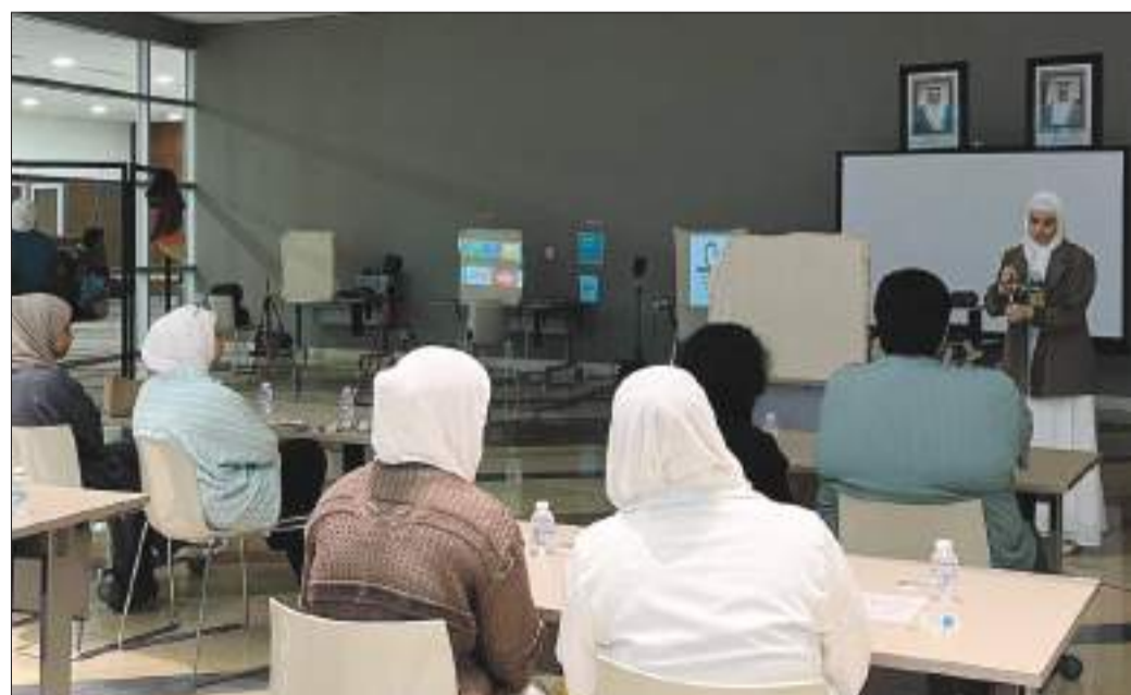
جانب من الورشة