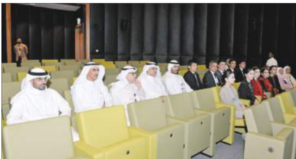
جانب آخر من الحضور

منها الجولة الميدانية، ثم إلى كلية العلوم الإدارية، بحضور عميد كلية العلوم