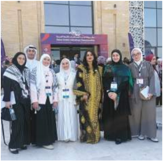
لقطة جماعية للوفد الكويتي