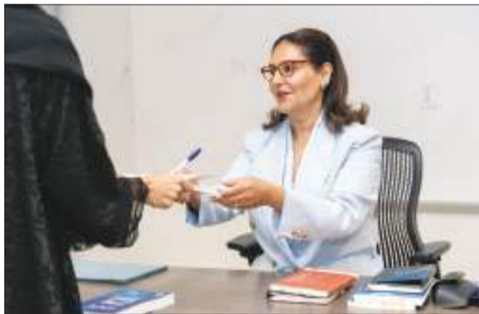
الشاعرة الشبيخة أفراح مبارك الصباح تتفاعل مع الطلبة

وقد تفاعل الحضور مع قصائدها بحفاوة واضحة، وامتألت القاعة بتصفيق