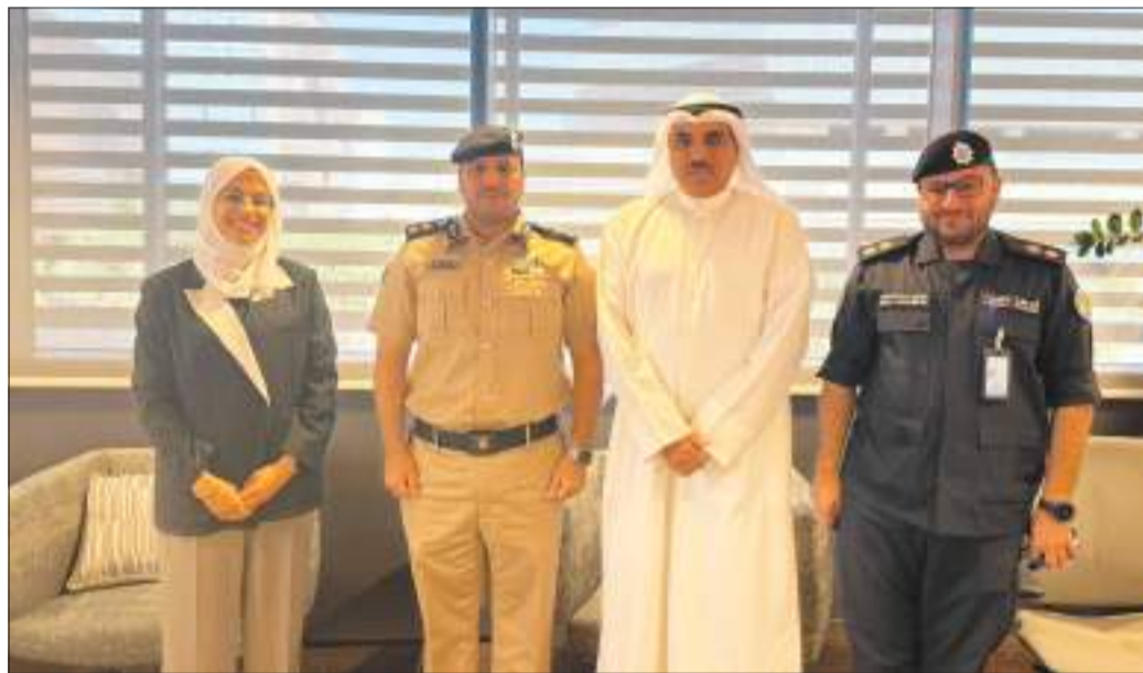
أ.د. حيدر بهبهاني أثناء استقباله أسرة البحوث والدراسات بوزارة الداخلية

الارتقاء بالعمل الأمني من خلال أبحاث العلمي وترسيخ مفهوم التعاون بين المؤسسات الأمنية والأكاديمية