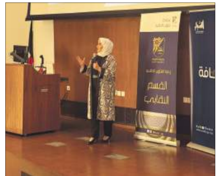
جانب من الدورة