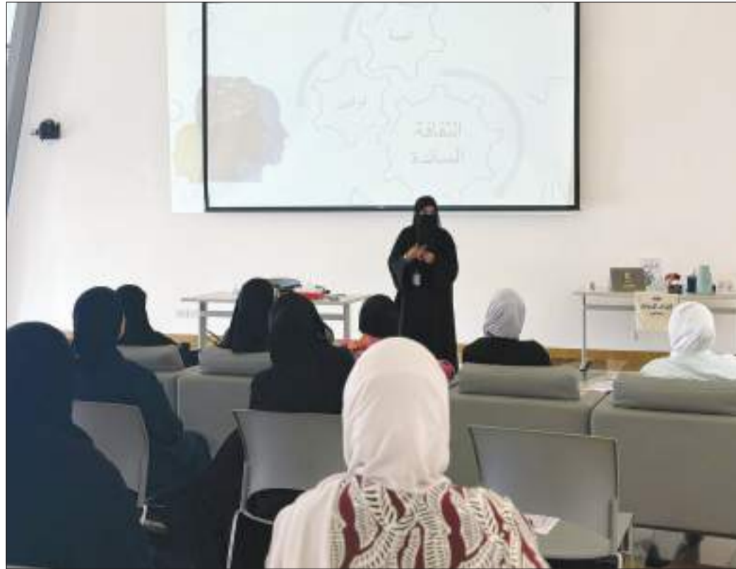
جانب من المحاضرة

وضبط الوقت في الحياة الدراسية والشخصية، مما أضفى على اللقاء طابعاً توعوياً وتحفيزياً. وتأتي هذه المحاضرة ضمن الجهود الهادفة إلى نشر الوعي بأهمية الوقت وتشجيع الطلبة على تطوير مهاراتهم الحياتية لتحقيق التوازن بين العمل والدراسة والحياة الشخصية.