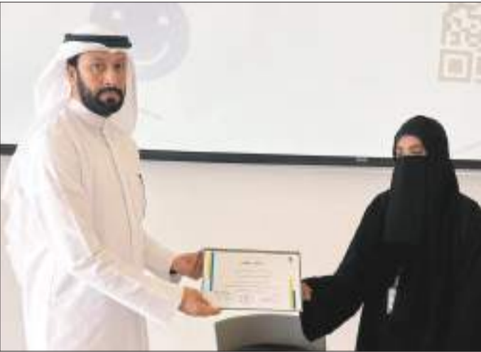
جانب من التكريم