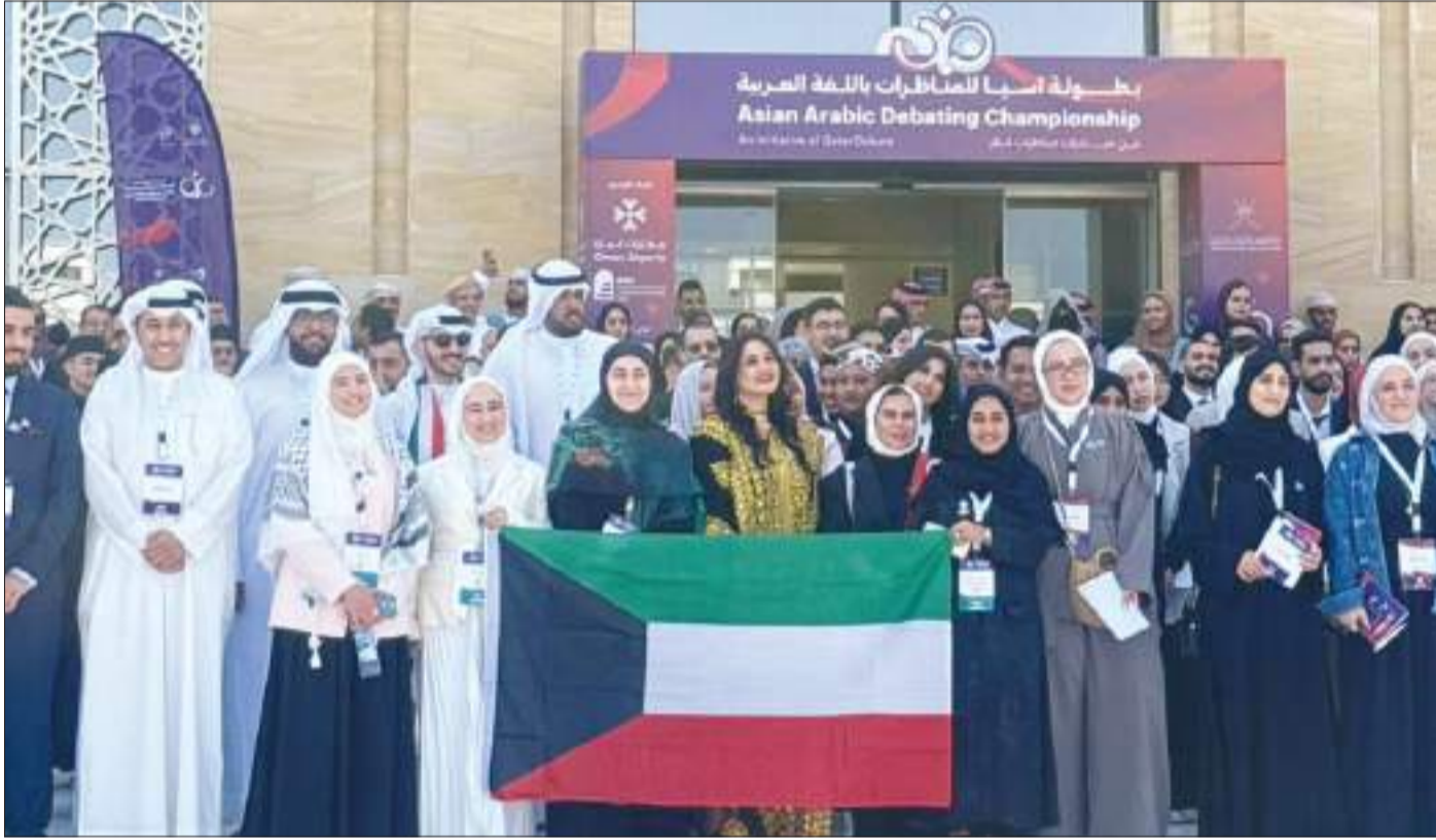
لقطة جماعية للمشاركين

البطولة منصة لإبراز القدرات اللغوية للطلبة وتنمية ثقافة النقاش وتبادل الخبرات بين الشباب من مختلف الدول