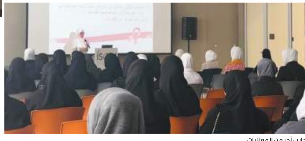
جانب آخر من الفعاليات