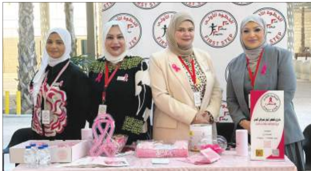
أسرة إدارة الإسكان الطلابي أثناء الفعاليات