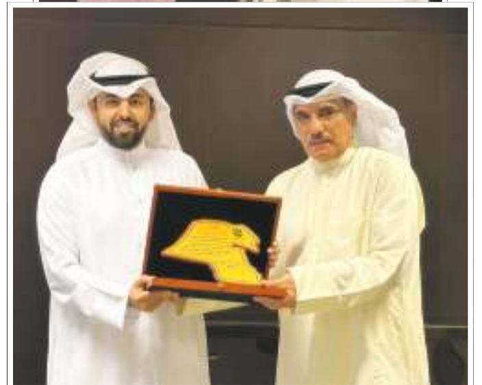
لقطات من التكريم