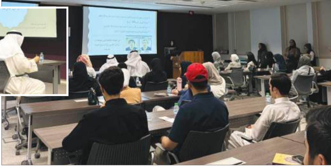
جانب من المحاضرة

والثقافية لديهم. وفي ختام الفعالية، توجّهت إدارة الشؤون الطلابية بالشكر للهيئة العامة للشباب على تعاونهم المثمر، وللمحاضرة على ما قدمته من معلومات قيمة أثّرت النقاش وأسهمت في إيضاح أبعاد الهوية الوطنية في ظل المتغيرات العالمية الحديثة.