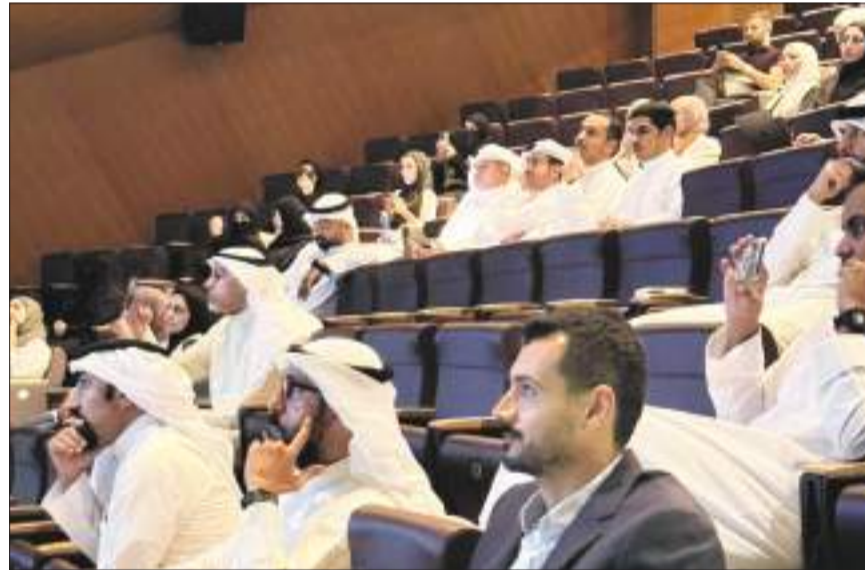
جانب من الحضور

لتعزيز الوعي الفكري والقيمي والجمع بين العلم والثقافة الدينية