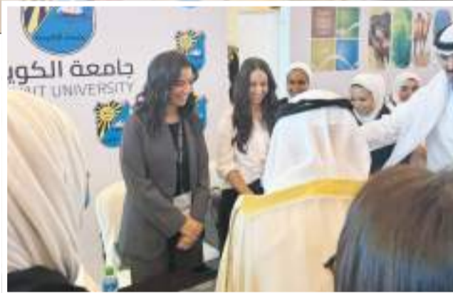
جانبا آخر من الدورة