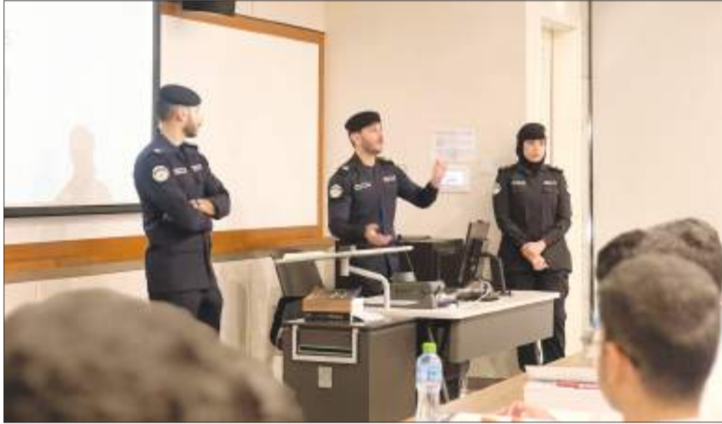
جانب من شرح الحملة التوعوية

يوسف الخميس: تدشين خدمة «مسار» قريباً وتوعية الطلبة ومنتسبي الجامعة بالمخالفات المرورية