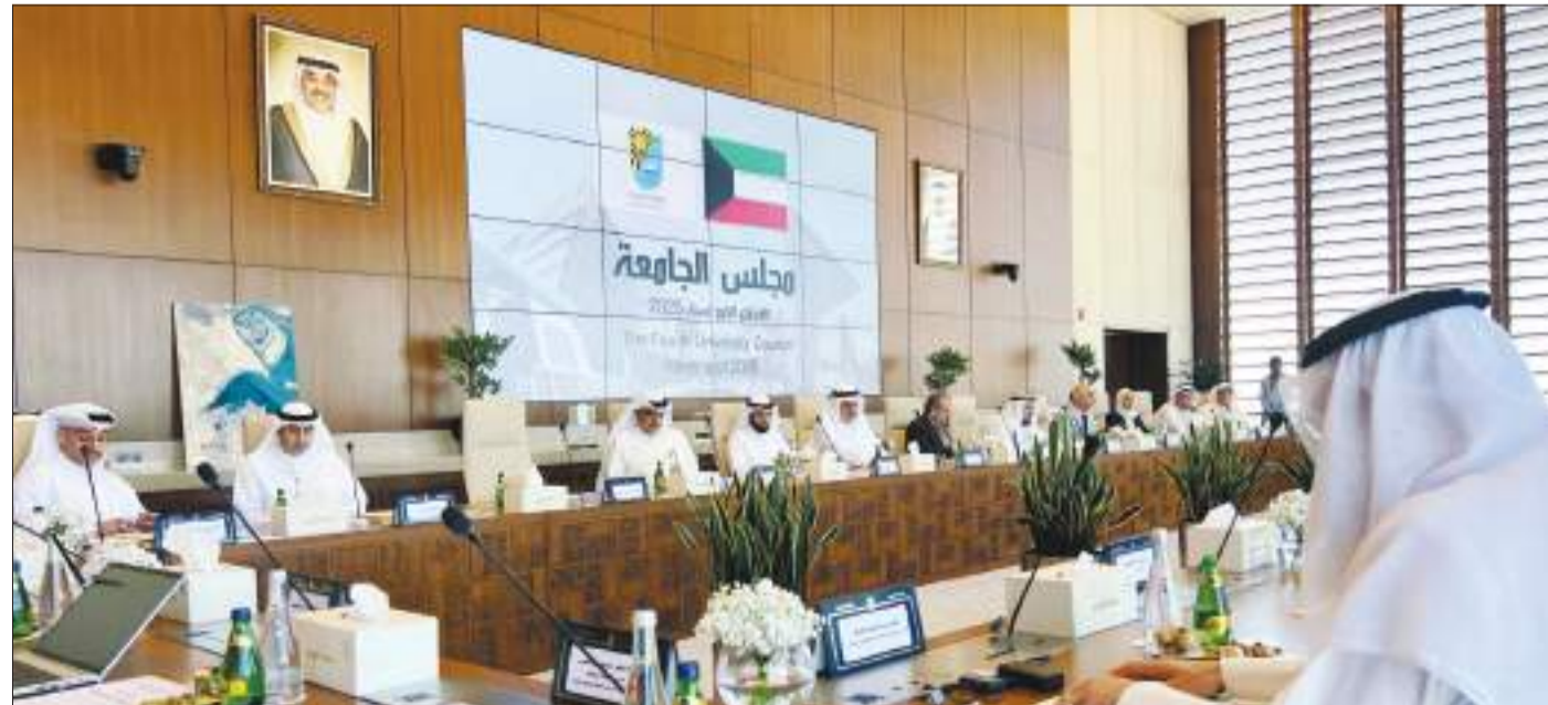
جانب آخر من الاجتماع