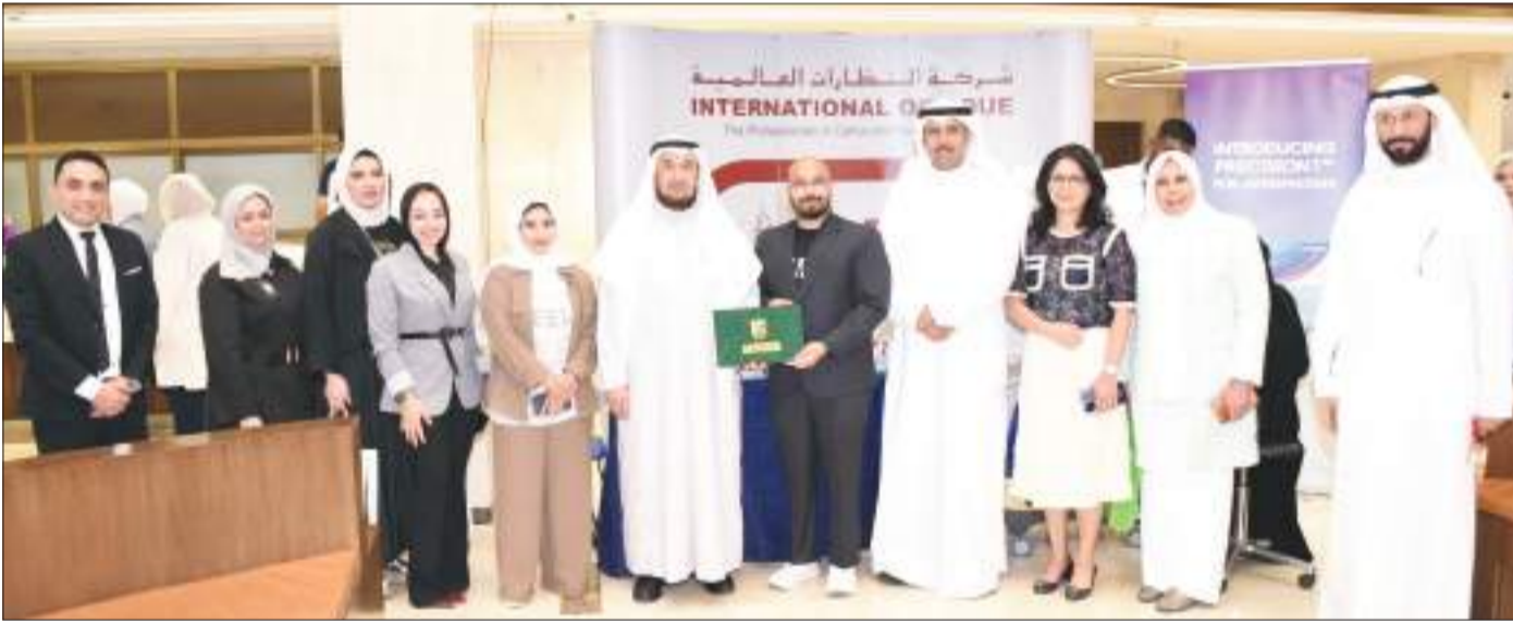
...وجانب آخر من التكريم