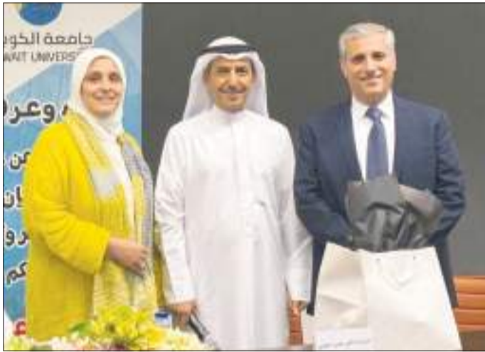
جانب آخر من الاحتفال