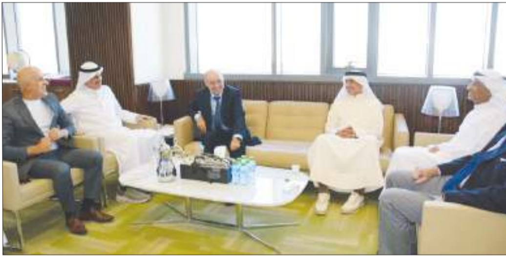
أسرة كلية العلوم الإدارية أثناء استقبالها المستشار الأكاديمي د. كبراش

للتنظيم المتميز، مشيداً بمستوى الكلية الأكاديمي وحرصها على تطبيق معايير الجودة والتحسين المستمر، ومؤكداً أن مثل هذه الزيارات تمثل خطوة مهمة نحو تطوير البرامج العليا في جامعة الكويت. وفي ختام الزيارة، عبّر أ.د. المطيري عن شكره وتقديره للمستشار أ.د. كبراش على زيارته القيمة وملاحظاته البناءة، التي تسهم في دعم جودة البرنامج وتطويره وفق أفضل الممارسات الأكاديمية الدولية.