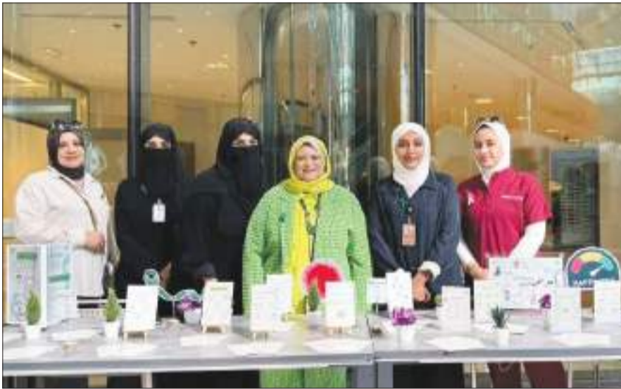
جانب من الفعاليات