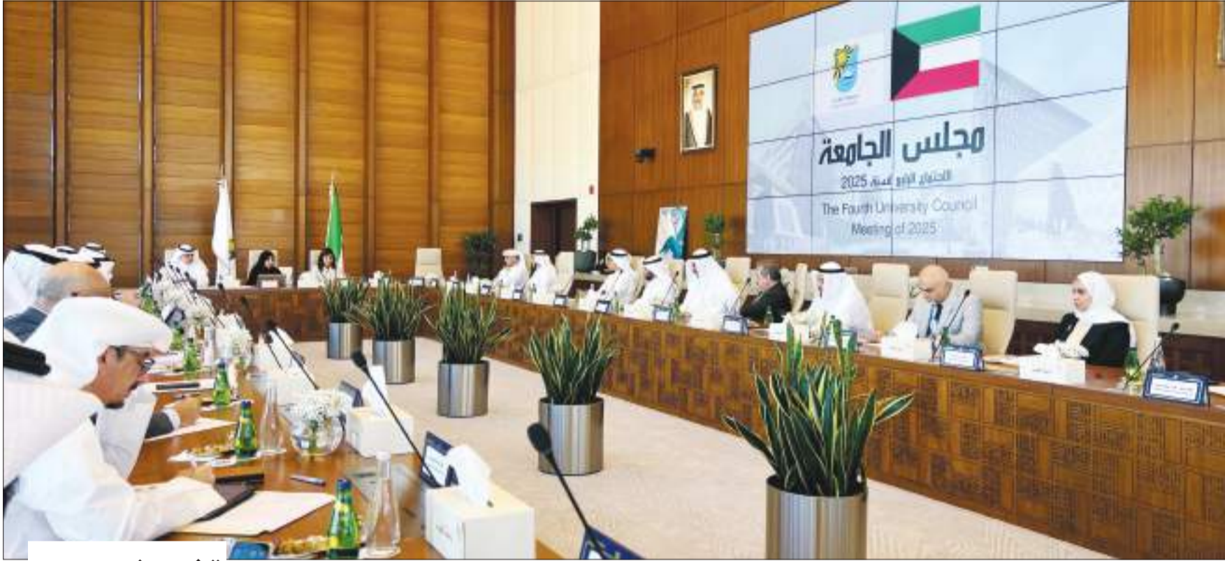
اجتماع مجلس الجامعة