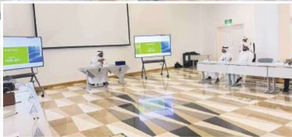
...و جانب آخر من الدورة