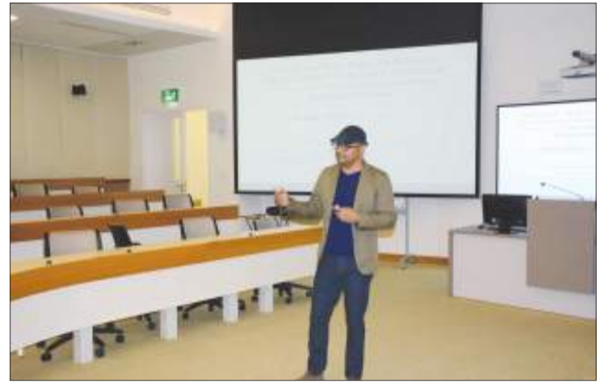
جانب من إحدى الجلسات