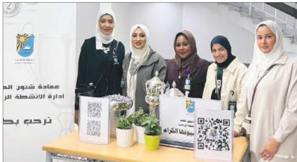
أسرة إدارة الأنشطة الرياضية

الفعالية شهدت مشاركة واسعة من طلاب وطالبات الكلية التي أسهمت في خلق أجواء من التفاعل والحماس بينهم