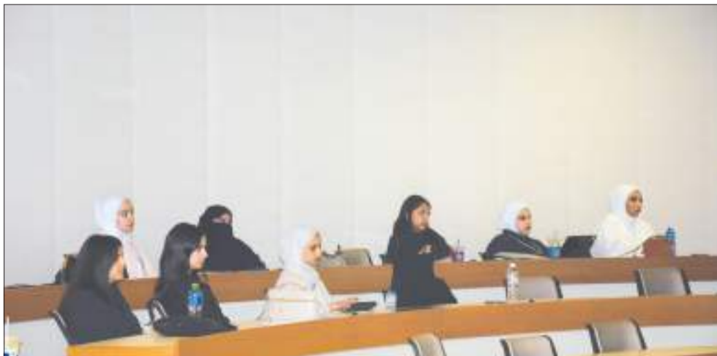
...جانب آخر من الحضور