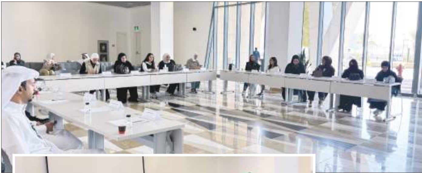
جانب من الدورة