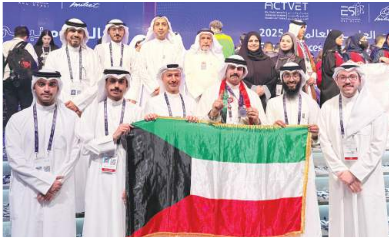
الوفد الكويتي المشارك