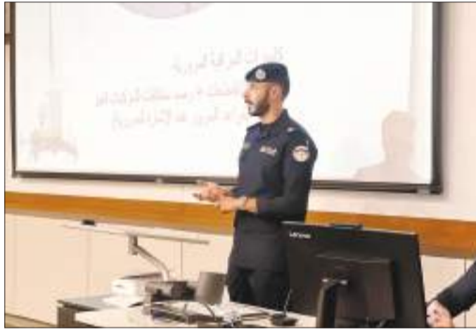
جانب آخر من شرح الحملة

توعية حول قانون المرور الجديد وتعديلاته وتعريف بالبوابات الجديدة