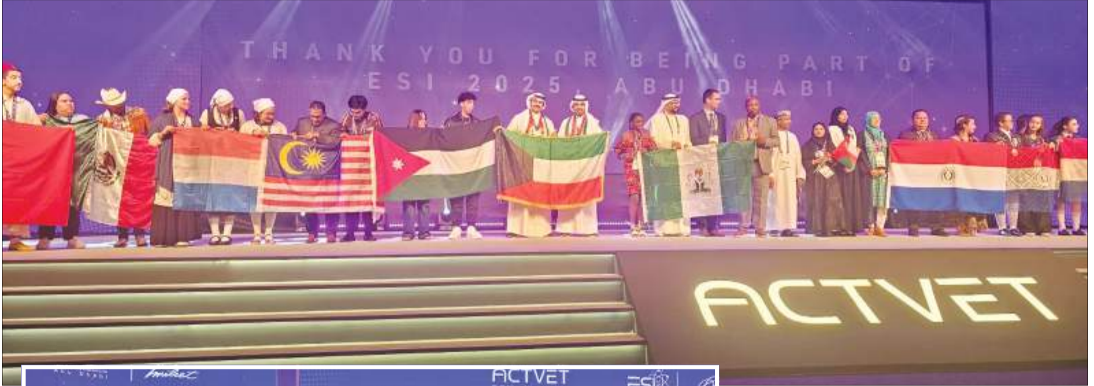
طلبة جامعة الكويت أثناء الاحتفال مع وفود الجامعات الأخرى