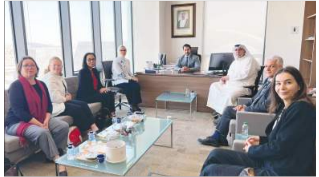
أسرة كلية الحقوق أثناء استقبالها الوفد الفرنسي

اللقاء لتعزيز دور الجامعة في توطيد العلاقات الأكاديمية والعلمية محلياً ودولياً