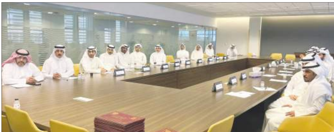
جانب من الدورة