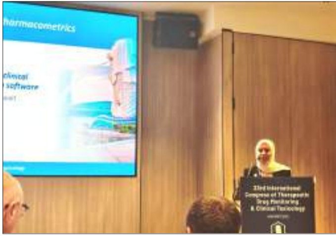
جانب من مشاركة عميدة الصيدلة في المؤتمر

الجمعية تعتبر جهة رائدة عالمياً إذ تضم نخبة من العلماء والأطباء والصيادلة المتخصصين