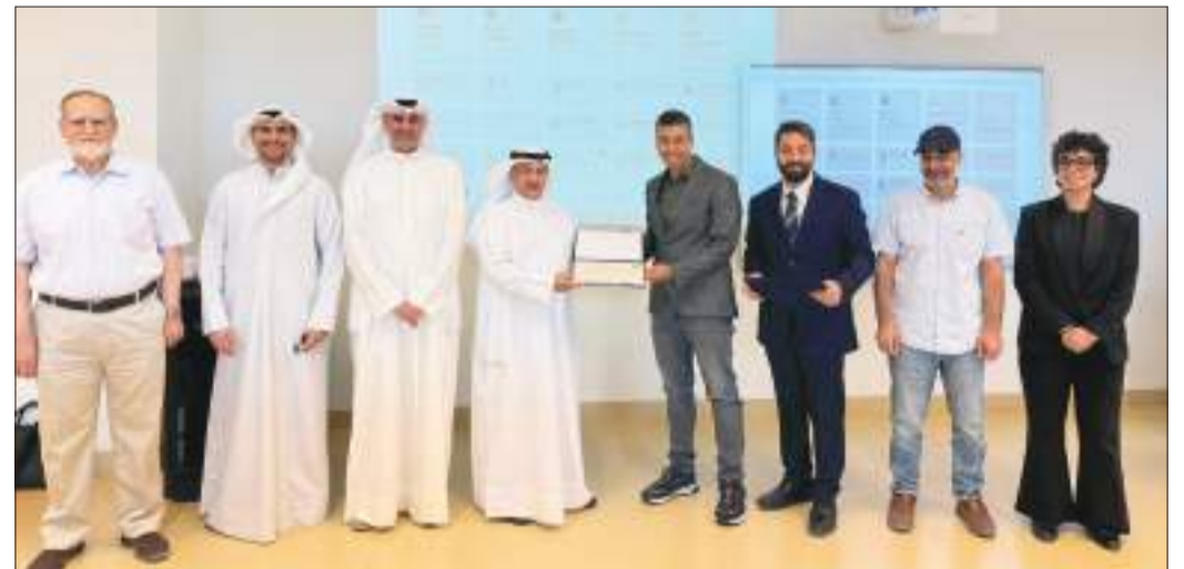
جانب من التكرم

التقنيات في مشاريعهم البحثية والتخرج. هذا التعاون يعكس التكامل بين الجامعة والصناعة لتأهيل الكفاءات الوطنية لمستقبل الطاقة.