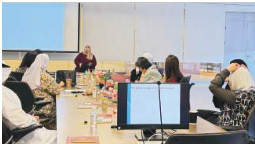
جانب من الورشة