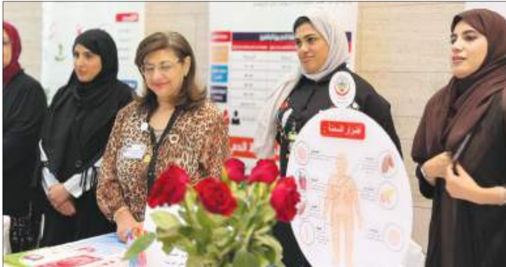
جانب آخر من فعاليات الندوة

د.البحوه: تشرفت اليوم وسعدت بإقامة هذه الندوة التفاعلية لتوعية الطلبة والطالبات