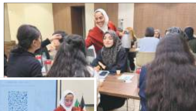
جانب من جلسة التعارف

تجربهن في جو من الألفة والمرح. يذكر أن هذه المبادرة تأتي ضمن سلسلة من الأنشطة التي يسعى من خلالها القسم إلى كسر الحواجز الاجتماعية وتوفير مساحات آمنة تعزز روح الانتماء بين الطالبات.