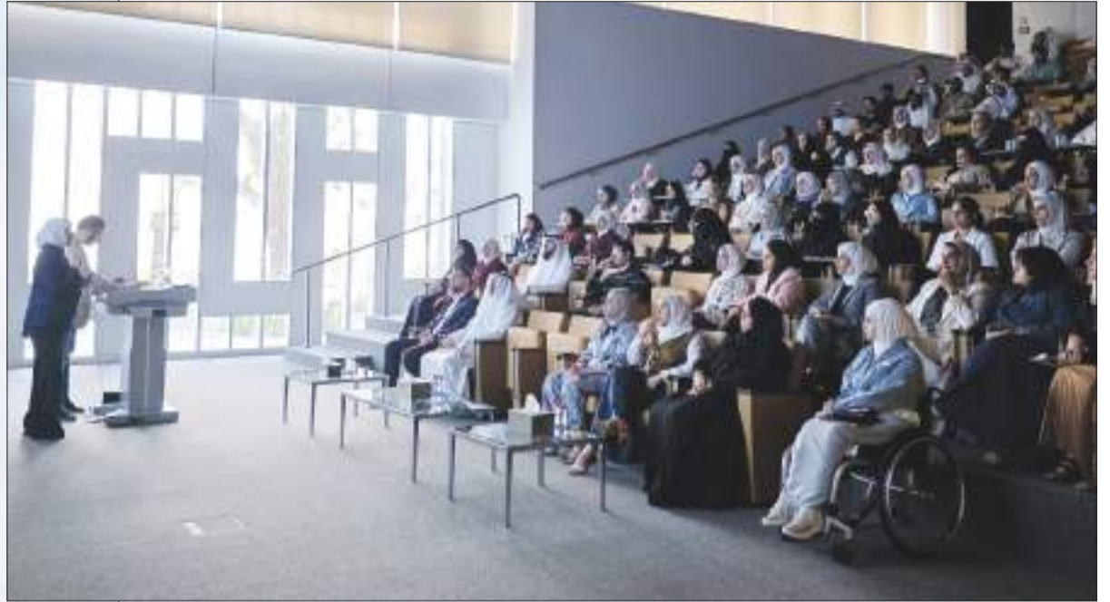
جانب من اللقاء التنويري

كتبت - أفراح الخشتي: