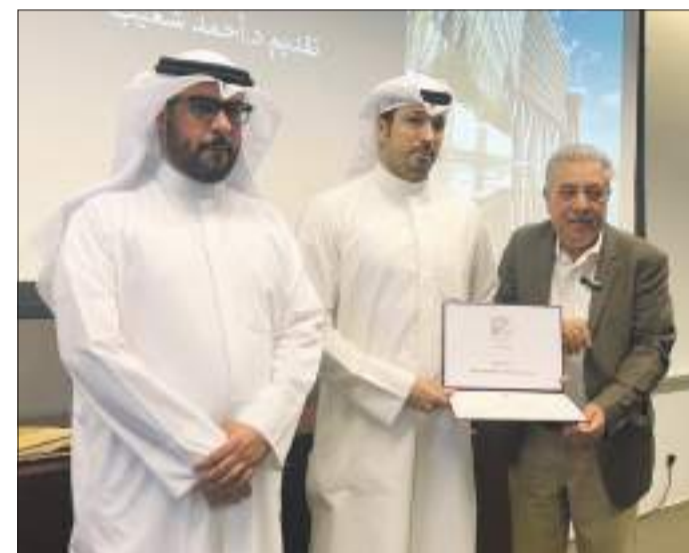
أ.د. عبدالله الجسمي يكرم أحد المشاركين