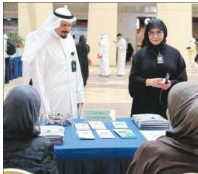
جانب من جولة العميد

يهدف المعرض إلى تعريف المستجدين باللوائح الجامعية والخدمات المقدمة لهم