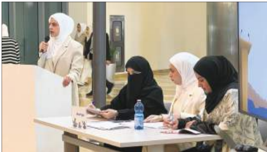
جانب من المناظرات