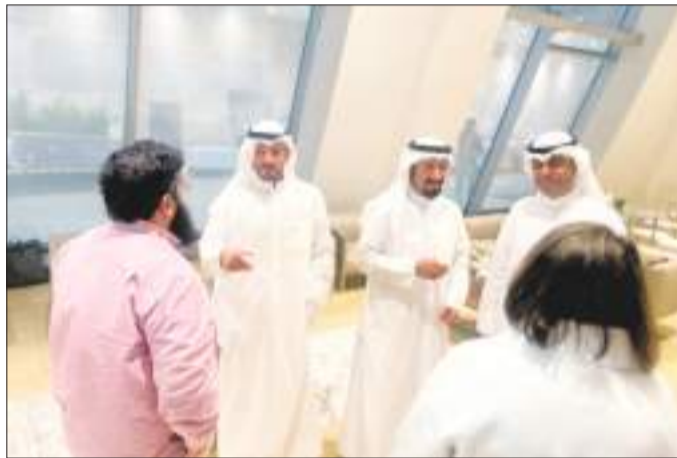
لقطات من اللقاء