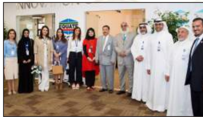
• افتتاح مركز الابتكار لشركة ايكويت للبتروكيماويات في منطقة الشعبية الصناعية