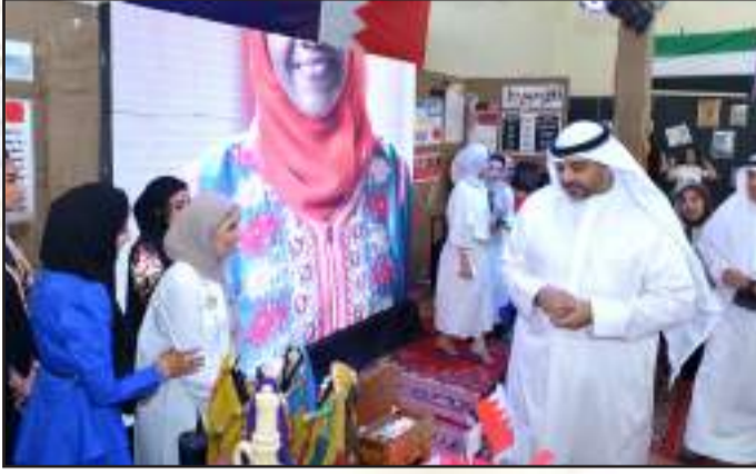
• معرض الإعلام الخليجي

• توقيع جامعة الكويت ممثلة بمركز التقييم والقياس اتفاقية لتنظيم اختبارات (الايلز) في الجامعة بالتعاون مع المركز الرئيسي لشركة (اي دي بي) في استراليا، ووفقاً للاتفاقية ستكون