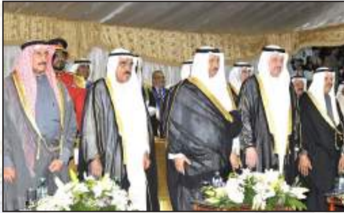
• حفل تكريم خريجي جامعة الكويت تحت رعاية سمو ولي العهد

• شاركت إدارة العلاقات العامة والإعلام في جامعة الكويت في معرض الكويت الثاني للمسؤولية الاجتماعية بهدف نشر الوعي التعليمي والتنموي والبحثي الملقى على عاتق الجامعة كونها من الجهات الحكومية الفعالة