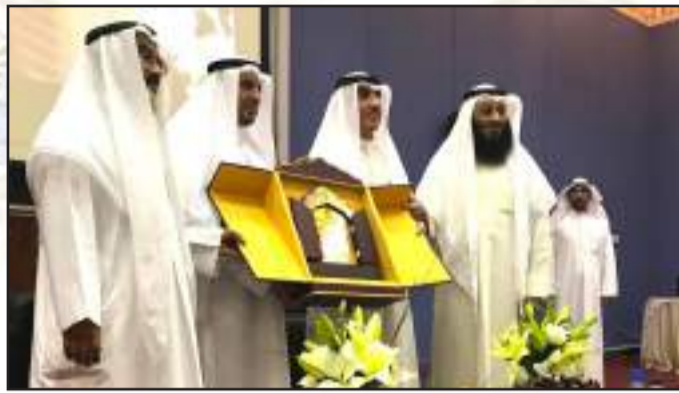
• مؤتمر العلم الشرعي في دولة الكويت اعلام واقلام

• استقبال عميدة كلية الآداب أ.د. سعد عبد الوهاب وزير الآثار الأسبق وسفير الأمم المتحدة للتراث العالمي عالم الآثار أ.د. زاهي حواس بحضور العميد المساعد للشؤون الأكاديمية أ.د. عبد الهادي العجمي ورئيس قسم التاريخ أ.د. عبدالله الهاجري ومجموعة