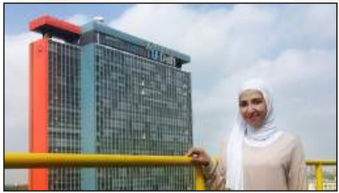
• بديرة المرشد رشحت لبرنامج الشراكات من أجل البحث والتعليم الدولي في الولايات المتحدة