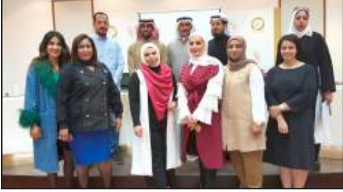
• بوزير متوسطا الحضور