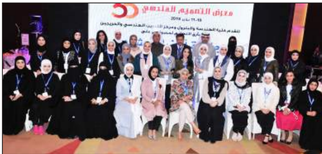
•... والطلبات الفائزات