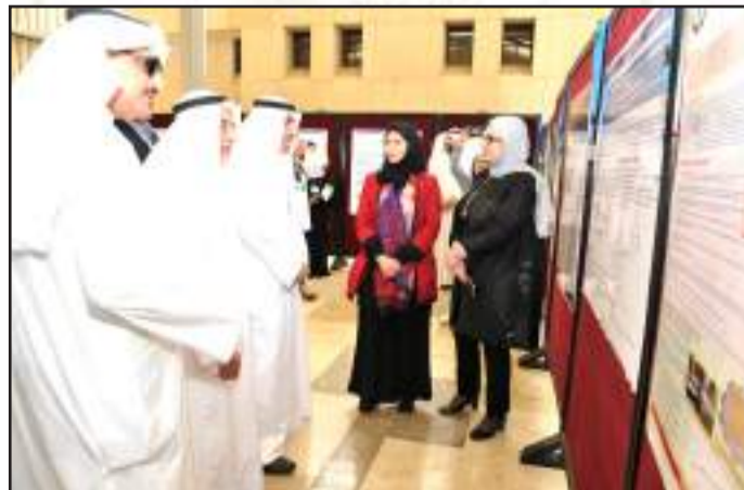
• فعالية المصق العلمي الثامنة لقطاع الأبحاث