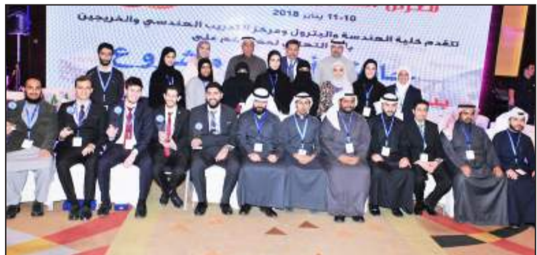
• عميد الهندسة متوسلاً الطلبة الفائزين