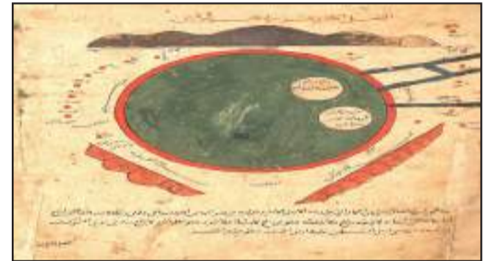
• بحر قزوين

سيخون يتم تمييز بعض المناطق. وهذه هي «هوارا» (جانند)، والقرية الحديثة (يانغيكنت - عاصمة الشعب التركي)، والشاش، ومراعي الشاش، وبلاد الغراب الأتراك. القيمة العلمية لهذه الخريطة المكتوبة بخط اليد لا حدود لها، لأنه لم يتم العثور على خريطة خاصة من نهر جيحون (أموداريا) في أي معروف لنا العمل الجغرافي. كما أن البيانات المعروضة في الخريطة تتوافق مع البيانات المقدمة في مصادر مكتوبة درس سابقاً، وفي بعض الجوانب تخدم أيضاً إضافة قوية. ويعتبر هذا العمل مصدراً هاماً لدراسة التاريخ والجغرافيا التاريخية ورسم الخرائط في الشرق القرون الوسطى، ولا سيما - آسيا الوسطى.