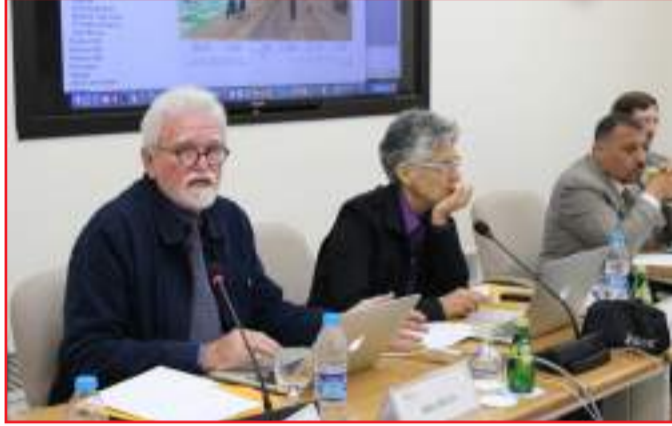
• د. الصياد يتحدث