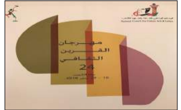
• جانب من الإصدارات

في الكويت ، من شتى المجالات العلمية والأدبية والتاريخية ، وذلك انطلاقا من حرصها على نشر الوعي الثقافي والمعرفي ، ودورها في توفير كل ما هو قيم ومميز في مجاله ، من الكتب و الإصدارات ليكون في متناول يد القراء .