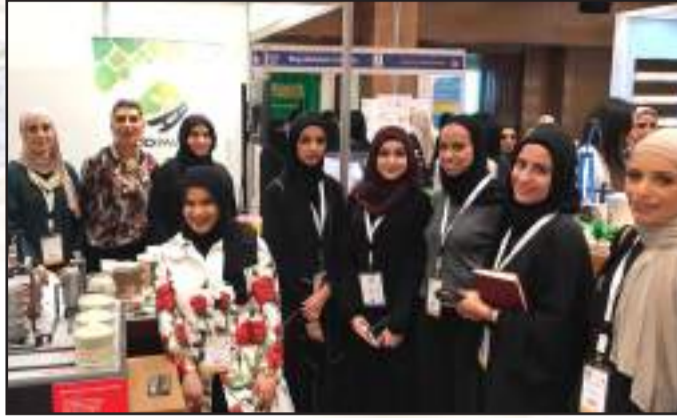
• الجامعة تحصد المراكز الأولى على مستوى جامعات دول الخليج بالملتقى الثقافي العلمي الثاني

• وكرم سمو الأمير الشيخ صباح الأحمد وبمناسبة ذكرى اليوبيل الذهبي لجامعة الكويت بحضور وزير التربية وزير التعليم العالي ومدير الجامعة جيل الرواد الأوائل ممن تركوا بصمة واضحة في تشييد وإرساء دعامة التعليم العالي في دولة الكويت وهم: - د. عبد الفتاح إسماعيل - مدير جامعة الكويت في الفترة من 1966 إلى 1972 - د. عبد العزيز كامل - مدير جامعة الكويت في الفترة من 1972 إلى