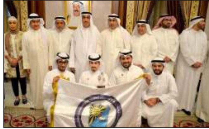
• فوز قسم هندسة الكمبيوتر في تصفيات الجمعية العربية للروبوت

• توقيع كلية الآداب بجامعة الكويت اتفاقية تعاون علمي مع كلية آداب جامعة القاهرة، بهدف تعزيز التعاون العلمي بين الكليتين في شتى تخصصات الأقسام العلمية بهما، وتشمل الاتفاقية تبادل