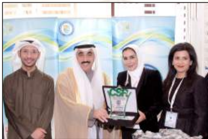
• مشاركة الجامعة بمعرض الكويت الثاني للمسؤولية الاجتماعية

المعرفة، ليساهموا في نهضة الوطن العزيز وتنميته ورفقيه وازدهاره.