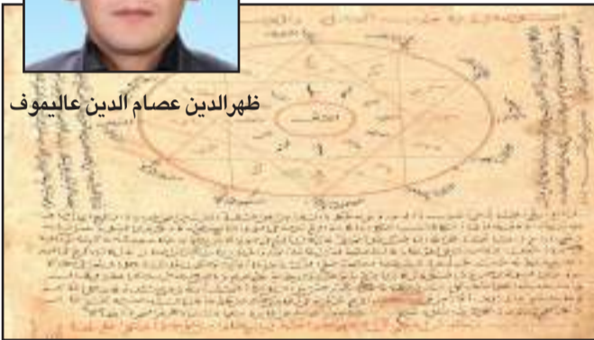
• الاجرام السماوية