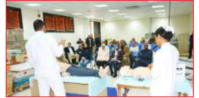
• شرح طريقة إسعاف المصابين

الورشة التدريب العملي للعاملين على استخدام مطفآت الحريق. وأضاف أن قسم السلامة - (العيادات الطبية) نفذ الورشة وعرف بأنواع حالات الإغماء ودرجاته واعراضه وكيفية عمل الإسعافات الأولية له كما تم التعريف بخطوات الإسعاف لفاقد الوعي وكيفية التصرف أثناء الحالات الطارئة التي قد تحدث لا قدر الله أثناء فترة العمل، كما تم عمل تمرين عملي للمشاركين بورشة العمل عن الإسعافات الأولية.