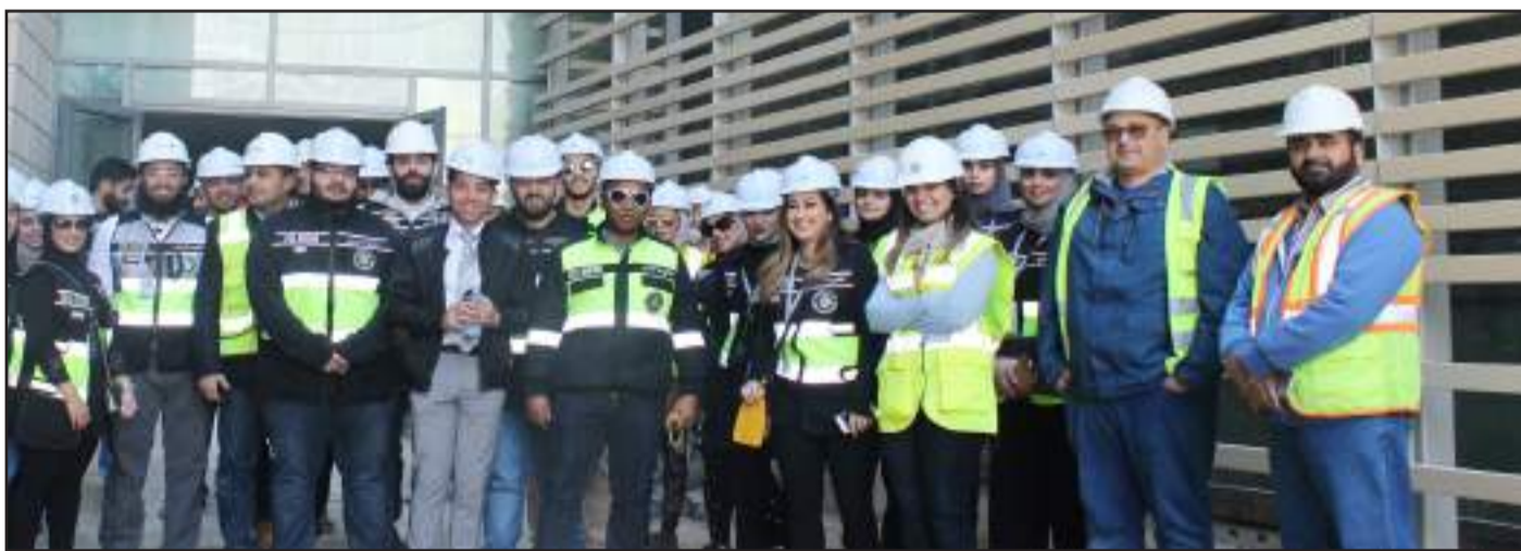
د. مهندسو الطيران لدى زيارته مدينة صباح السالم الجامعية