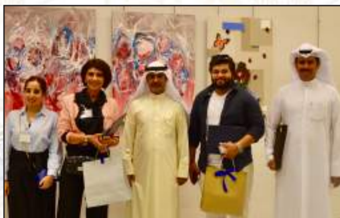
• المعرض الفني المشترك

• يذكر أن المنتدى يعتبر منصة رائدة على مستوى المنطقة لتبادل المعرفة والتواصل مع الخبرات العالمية في مجال الأبحاث والمعرفة، ويهدف المنتدى لدراسة الاستراتيجيات الحديثة حول دمج التكنولوجيا في التطوير وآليات نقل المعرفة إلى حلول فعالة للتحديات المعاصرة، كما يسلط الضوء على أهمية تكامل الأبحاث والابتكار والتكنولوجيا الحديثة في التطوير الاستراتيجي للعمل.