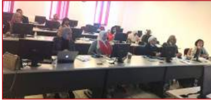
• أعضاء هيئة التدريس يتابعون

وفي الختام ذكرت مشير أن المشاركين يمكنهم الاستفادة من الدورات المجانية التي تقدمها لهم شركة مايكروسوفت مع اختباراتها بحيث ترسل لهم إيميل به الشهادة المعتمدة من الشركة خلال ساعات قليلة بعد النجاح في الاختبارات