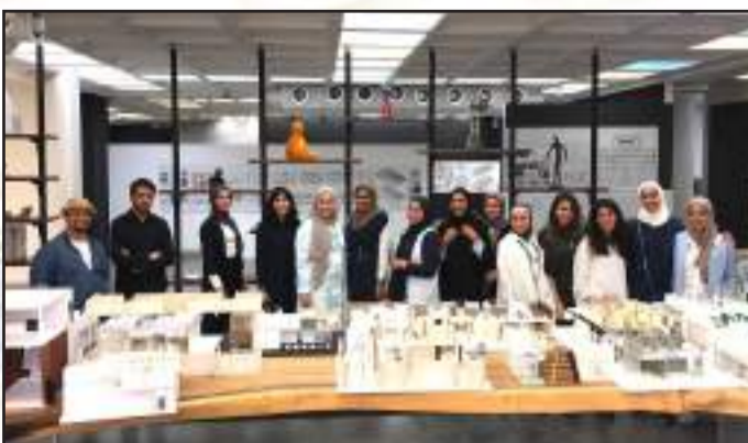
• الترميم الداخلي لجمع الصوابر مع طلبة كلية العمارة

• وتهدف الورشة لتمكين المشاركين في مختلف مراحلهم المهنية ومجالات تخصصهم للتعرف على أحدث أساليب ومناهج التعليم المتميز وتضمنت مواضيع عدة منها تحديد مخرجات التعلم وأهدافه، وتصميم المناهج، وتقييم الطلبة، وتعزيز التفكير النقدي، والجانب الأخلاقي والقيم التعليمية، ودور التكنولوجيا في التعليم.