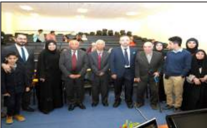
• الطالب مع الأساتذة المشرفين