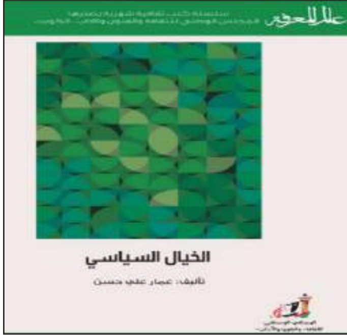
• غلاف الكتاب

المعلومات والاستهانة بها ، والجهل بالتاريخ ، وتقديس الموروث ، والتفكير بالتمني ، وسطوة الأيدولوجيا . كما يطرح ما بين هذا وذاك ، مجالات عدة لتوظيف الخيال السياسي ، ككيفية عبور الأزمات ، وبناء الخطط والإستراتيجيات ، والخرب ، ومكافحة الفساد ، ومواجهة الإرهاب ، وتعزيز الحس الأمني ، وتقدير المواقف ، وتقادي سلبيات الديموغرافيا السياسية ، والبحث عن المثل العليا ، والفضائل الاجتماعية والسياسية ، وتكوين الجماعات المتخيلة ، او اختراع الهويات القومية ، وتوظيف الصناعات الإبداعية ، في خلق التماسك الاجتماعي وصناعة الدور ، واخيرا ، يستعرض الكاتب نماذج تطبيقية ، قدمها أفراد ومؤسسات للتخيل السياسي .