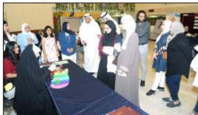
• معرض مواهب الطلبة في الصحة العامة