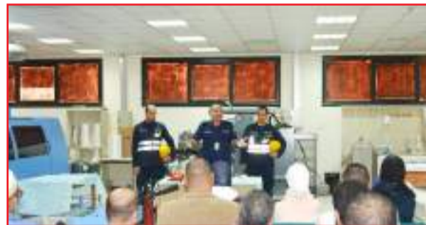
• رجال الإطفاء يشرحون كيفية التعامل مع الحريق

الورشة التدريب العملي للعاملين على استخدام مطفآت الحريق. وأضاف أن قسم السلامة - (العيادات الطبية) نفذ الورشة وعرف بأنواع حالات الإغماء ودرجاته واعراضه وكيفية عمل الإسعافات الأولية له كما تم التعريف بخطوات الإسعاف لفاقد الوعي وكيفية التصرف أثناء الحالات الطارئة التي قد تحدث لا قدر الله أثناء فترة العمل، كما تم عمل تمرين عملي للمشاركين بورشة العمل عن الإسعافات الأولية.