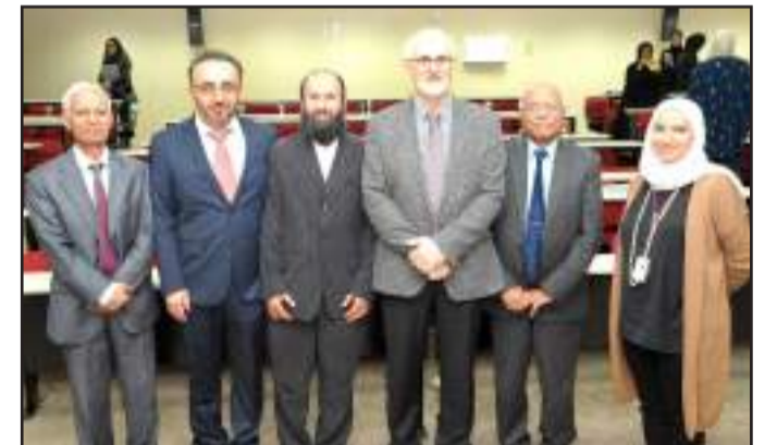
• صورة تذكارية مع المحكم الخارجي

بين العينات السريرية من مجموعات الكانديدا ألبيكازن، كانديدا بارابسيلوسيس و كانديدا غلابراتا لمعرفة طرق انتقال عدوى الكانديدا المكتسبة في المستشفيات، وكذلك إجراء اختبار حساسية الفطريات وتحديد خصوصيتها والأساس الجزيئي لمقاومة الدواء بين أنواع عزلات الكانديدا. وتم إعطاء ملخص للرسالة في إحدى قاعات مركز العلوم الطبية في حضور عدد من الأساتذة المختصين وطلاب الدراسات العليا في قسم علم الجراثيم في كلية الطب.