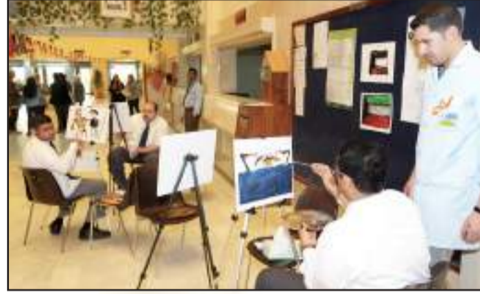
• الصحة العامة اقامت يوم التوحد

• إطلاق كلية العمارة بجامعة الكويت مؤتمرها العلمي الثاني لهذا العام،