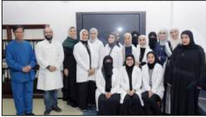
• د. البناء والمشاركين بالدورة