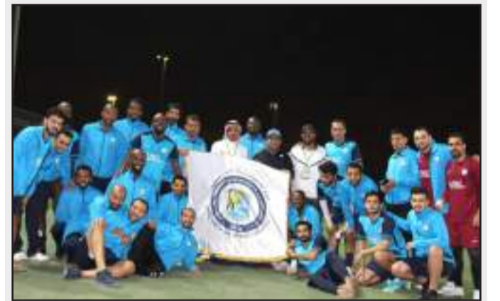
• فريق الجامعة