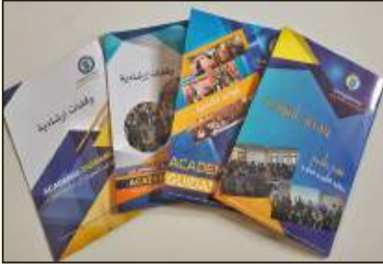
• جانب من المنشورات