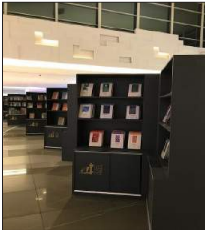
• من إصدارات المجلس الوطني