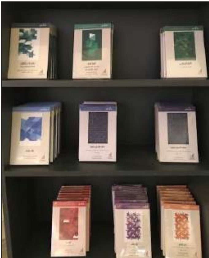
• إصدارات في المعرض