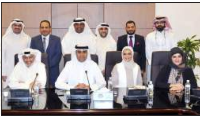
• اعتماد شهادة نظام الجودة الإيزو

• مدير الجامعة د. حسين الأنصاري أكد أن مبادرة مشروع (STARTUP KUWAIT) لريادة الأعمال الذي أطلقته جامعة الكويت بمشاركة الجامعات والكليات في الدولة لدعم وتمكين الشباب، تأتي تبنياً لتصور صاحب السمو الأمير الشيخ صباح الأحمد لرؤية الكويت 2035 كمركز مالي وتجاري إقليمي، والتي أطلقتها الدولة ضمن عدة ركائز أساسية لخطة وطنية فاعلة مرتكزة على تأسيس «رأس مال بشري إبداعي» لرعاية الشباب وتحفيزهم وتعزيز دورهم المجتمعي، وتطوير «اقتصاد متنوع مستدام» ينبع من تأصيل ثقافة ريادة الأعمال والمشاريع الصغيرة وحاضرات الابتكار، مشيراً إلى أنه من هذا المنطلق جاءت فكرة هذا المشروع الذي يترجم الدور الريادي للكويت في