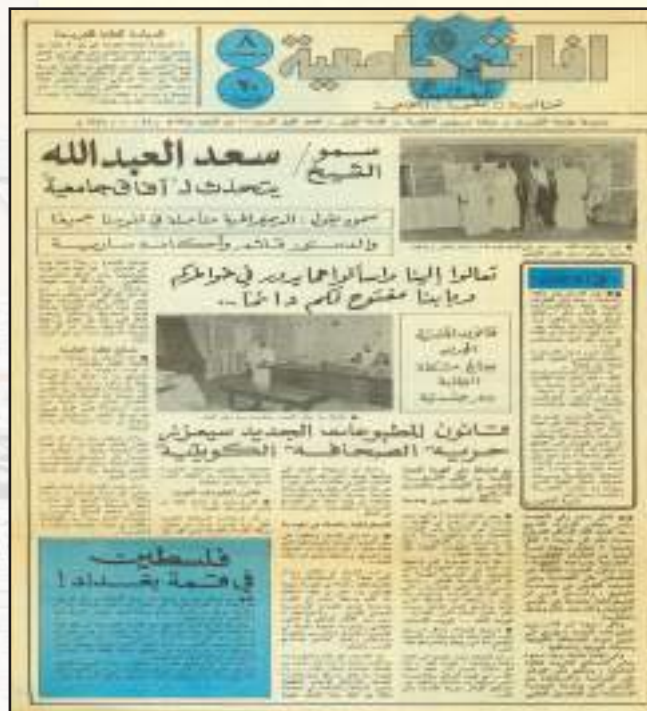
● العدد الأول

القيام بالمهام التي يتوجب القيام بها، هذا وقد أهلت آفاق عدداً من الصحافيين ممن تدرّبوا في الجريدة وهم الآن من محترفي الإعلام في شارع الصحافة ويعملون في المجال الصحفي والإعلامي. ولآفاق استراتيجية أهم عناصرها هي توفير كفاءات صحفية لسوق العمل الكويتي والخليجي للارتقاء بالعمل الصحفي والمحافظة على أخلاقيات المهنة وتطوير العمل فيه وغرس هذه القيم المهنية الإعلامية في المتدربين من خلال الممارسة الصحيحة والعمل من أجل خلق جيل مهني عالي القدرة والكفاءة. وتستمد آفاق قوتها التحريرية من التعاون والاتصال المستمر مع الكليات وبالأخص إدارة العلاقات العامة والإعلام المركزية بشكل يومي ، حيث يتم تزويدنا بالتصاريح والأخبار والمواد الصحافية والفعاليات التي تنظمها الكليات أو مراكز العمل المختلفة، هذا وتعتمد عليهم آفاق اعتماداً كبيراً في العديد من الأخبار اليومية التي يتم نشرها كما تلاقي آفاق دعماً واهتماماً معنوياً ومادياً من الإدارة العليا بالجامعة لتسهيل مهمتها الإعلامية.