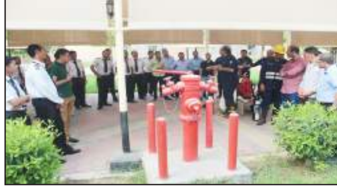
● توضيح آلية اطفاء الحريق

حدثت الحرائق وأنواعها ، وأيضا التعرف على أنواع مطفآت الحريق اليدوية وكيفية استعمالها إضافة إلى معدات السلامة الأخرى وكيفية اخمد الحريق بواسطتها وآلية اخلاء المباني في مثل هذه الحالات.