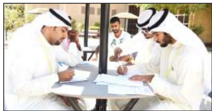
● تجميع الدلائل والبراهين