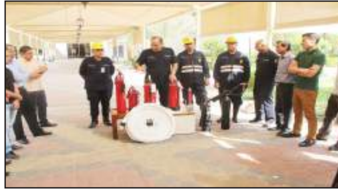
● أثناء التدريب العملي