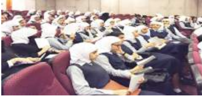
● الطالبات خلال المحاضرة