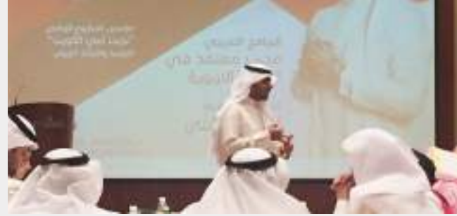
● جانب من حفل التكريم