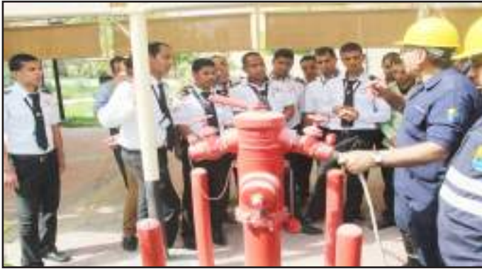
● شرح كيفية التوصيل بمضخات المياه