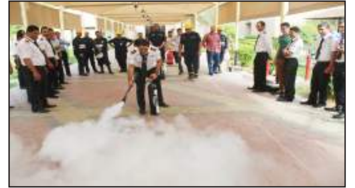
● تدريب أفراد الأمن على الاطفاء