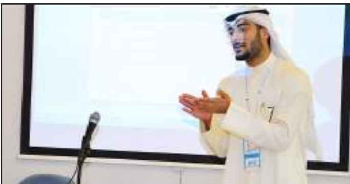
● عرض للحجة والدفاع عنها

المصنف: أشيد بجهود عمادة شؤون الطلبة في إعداد قادة المستقبل