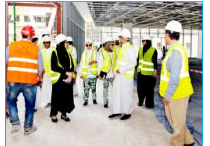
أثناء تفقد المباني