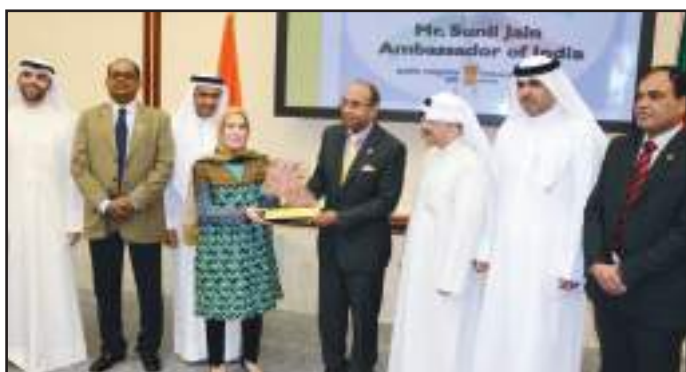
● تكريم السفير الهندي