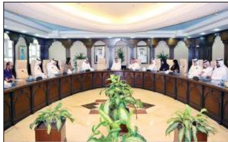
A frontal view of the discussion