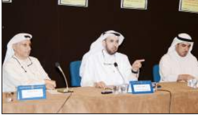
● المتحدثون في الاجتماع مع الطلبة المتفوقين