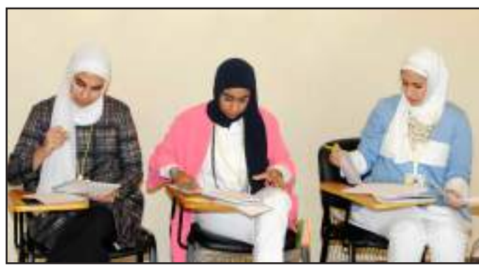
● اثناء التحضير