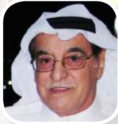
د. سليمان البدر

المغفور له الأمير الوالد الشيخ سعد العبد الله كان ضيفاً على آفاق في عددها الأول قبل 37 عاماً