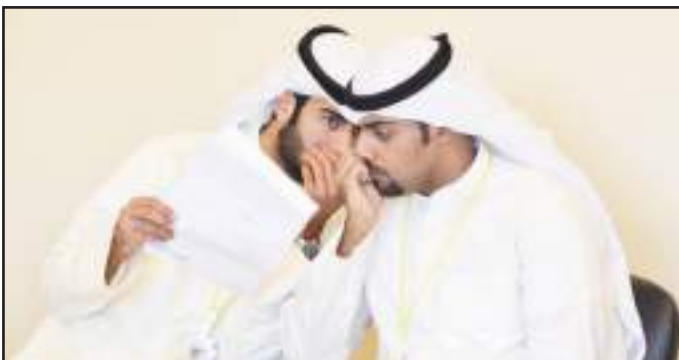
● المناقشات بين اعضاء الفريق الواحد

و قالت عميد كلية التربية د. نجاة المطوع إن فن الحوار هو ظاهرة صحية تساعد على تنمية أساليب التعليم العالي وتجعل الطالب يمتلك قدرات فردية أساسية في حياته المستقبلية