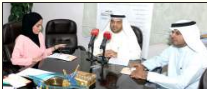
A glimpse of the press conference