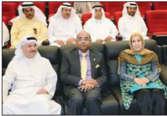
Audience members during the ceremony

how Kuwait and India are developing and in which direction our relationships are progressing," she said. Additionally, the Indian ambassador said he is profoundly proud of the institution, which has a student body of 7,000 and the books on India the embassy, handed over to the college, are only a token. "It was mentioned here that Indian-Kuwaiti relations are historical. The only other Taj Mahal is in Kuwait... We would like all of you to visit India as often as possible to know the historical places of