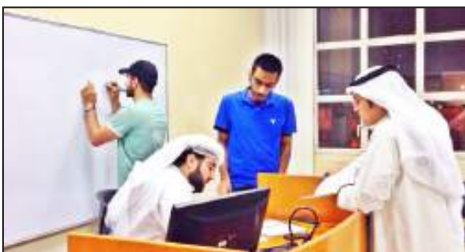
● من النسخة السابقة للدوري