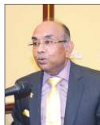
● السفير سونيل جين

الهند الحديثة والتطور القائم بها، ووجود أكبر ديموقراطية بها ووجود الخبرة المعلوماتية، ودعا لزيارة الهند والتعرف على آخر التطورات في البلد. وبين جين أن السفارة تقدم الكثير من التسهيلات للكويين لزيارة الهند حيث تعطى التأشيرة لمدة خمس سنوات، مرحباً بالوقت ذاته بمقترح العميدة حول إقامة يوم مشترك «هندي كويتي» لتبادل الثقافات والمعلومات والتراث.