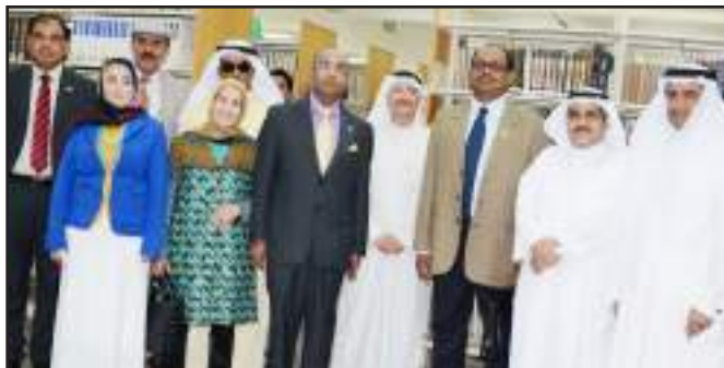
A smile to Afaq's camera lenses