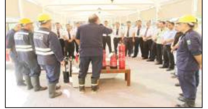
● جانب من المحاضرة

حدثت الحرائق وأنواعها ، وأيضا التعرف على أنواع مطفآت الحريق اليدوية وكيفية استعمالها إضافة إلى معدات السلامة الأخرى وكيفية اخمد الحريق بواسطتها وآلية اخلاء المباني في مثل هذه الحالات.