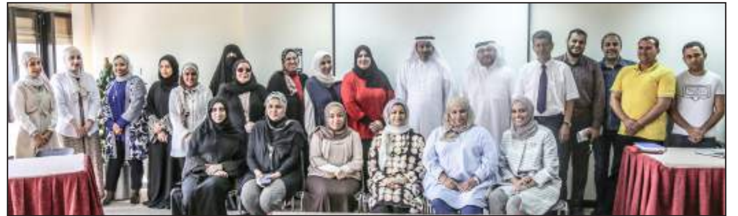
• لقطة تذكارية للحضور