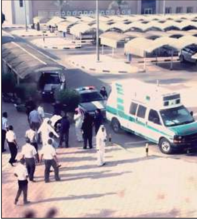
● سيارة الإسعاف تنقل الطالب إلى المستشفى