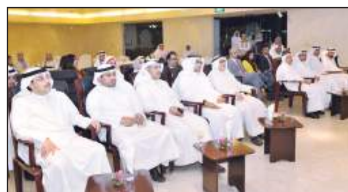
A side view of the audience members during the ceremony

"A college education will serve to propel a graduate into a profession by conferring a degree, which demonstrates academic proficiency in various theoretical and practical examples of ways that a job might be performed.