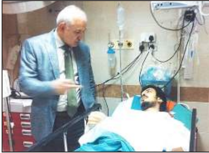
● الوزير العيسى يطمئن على صحة الطالب