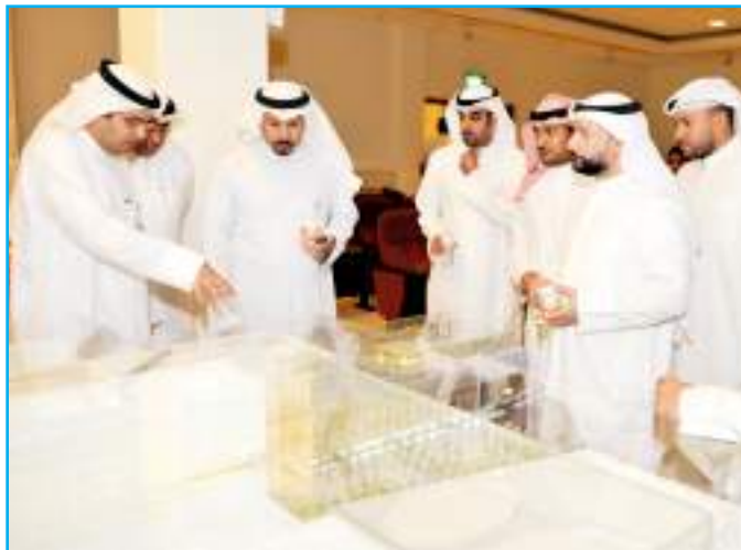
شرح لمكونات المدينة الجامعية