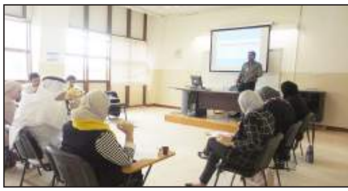
● جانب من المناظرات