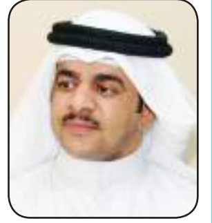
اعداد مهدي العجمي

تغير واضح في الطقس خلال هذه الايام مما يجعل الاجواء أكثر شاعرية لمن يحب الشعر ويكتبه او كل متذوق ومتذوقة حيث ان الجو بكل طقوسه له تأثير كبير وبالغ الأثر على الشعراء والشاعرات فهو من العوامل المساعدة للوجود الشعري. وأكثر الشعراء يكون انتاجهم الشعري مع موسم الامطار والربيع والدليل على