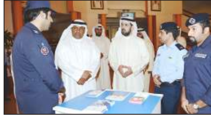
• التعريف بدور رجل الإطفاء