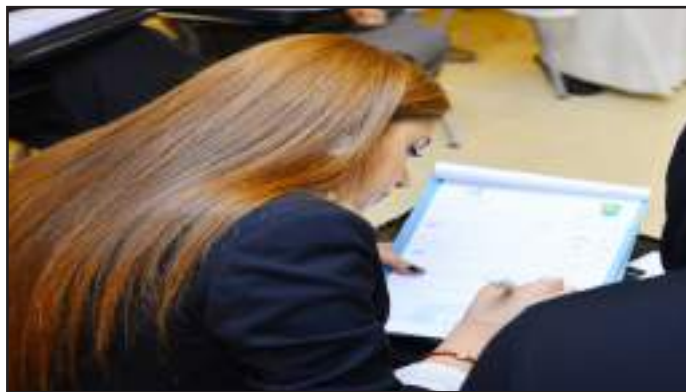
● معايير واضحة للتحكيم

ووجهت العصفور حديثها إلى الطلبة قائلة: نصيحتي لكم يا طلبة جامعة الكويت بأن تخوضوا تجربة المناظرات بنفس شامخة وعين ترى الأمل في كل مجال وتذكروا أن الفوز لا يكمن في الحصول على اللقب، إنما الفوز بحد ذاته هو المشاركة، وأضافت: من يجعل