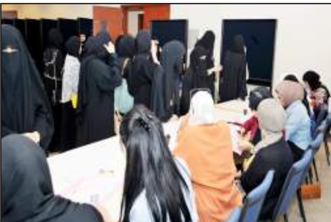
● الطلبة لم يتفقوا مع مقترح إلغاء الانتخابات