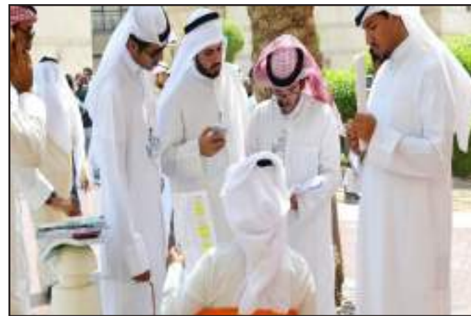
● التنافس يميز انتخابات الجامعة