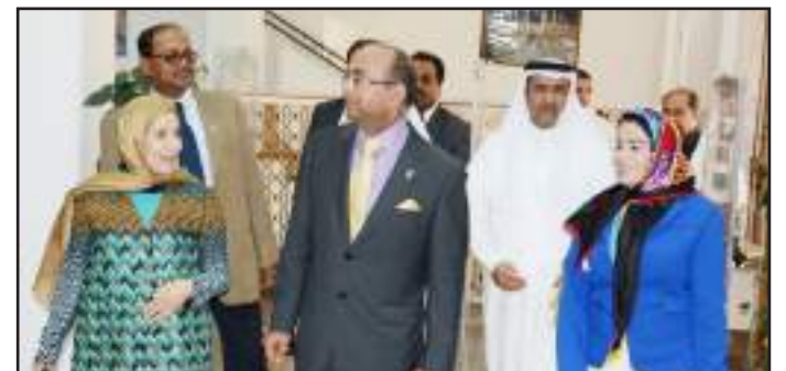
Prof. Al-Hajji discussing the importance of cultural books