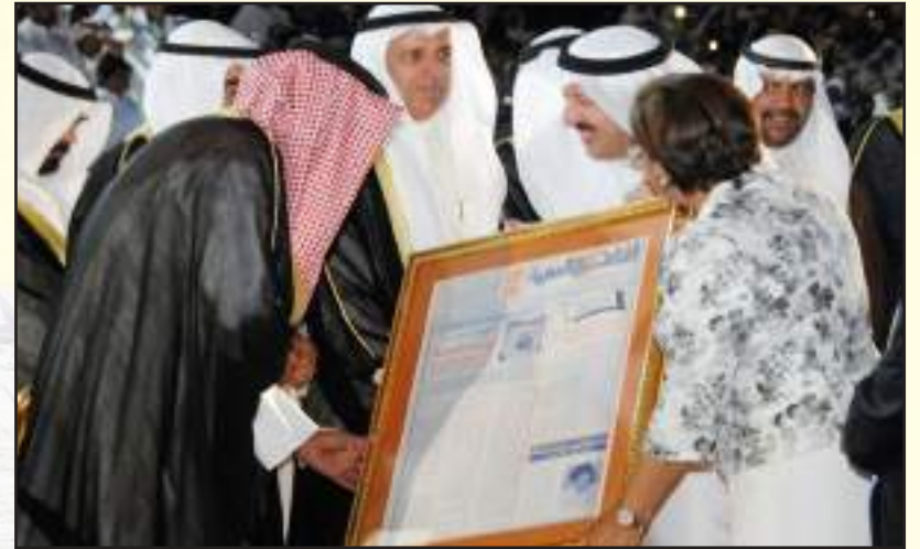
• سمو ولي العهد يتسلم هدية آفاق بحضور وزيرة التربية السابقة موضي الحمود ورئيس التحرير في الحفل السنوي الموحد لخريجي الدفعة ٤٠

المغفور له الأمير الوالد الشيخ سعد العبد الله كان ضيفاً على آفاق في عددها الأول قبل 37 عاماً