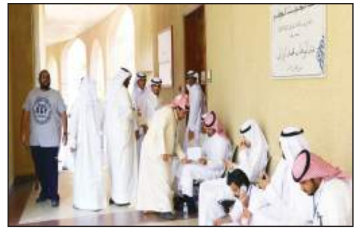
● بعض الطلبة عكس صورة سيئة عن الانتخابات