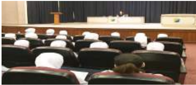
● جانب من المحاضرة

أقام قسم التوعية المجتمعية بالتعاون مع عمادة القبول والتسجيل محاضرة توعوية تعريفية عن جامعة الكويت موجهة لطالبات السنة النهائية من المرحلة الثانوية الحكومية بقسميها العلمي والأدبي ، حيث تم تعريفهم بكليات الجامعة وإعطاءهم نبذة عامة عن كيفية نظام القبول بالجامعة وما هي النسب التقريبية لكل كلية بما يتناسب مع طموحهم وميولهم قبل الالتحاق بالجامعة . وفي نهاية المحاضرة فتح باب النقاش للحضور وتم تقديم كتيبات وأدلة تعريفية للطلبة والطالبات .