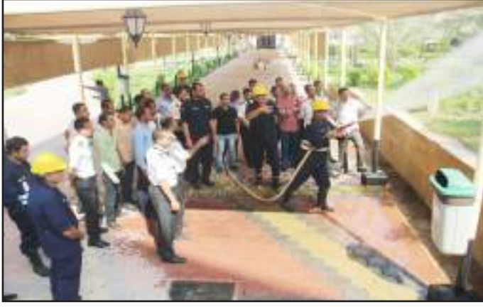
● اخمد الحرائق