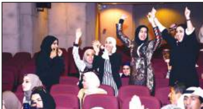
● المناظرات ترسخ روح التنافس