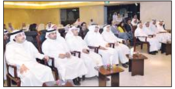
● مقدمة حضور الحفل

الإمارات العربية الشقيقة. وأضاف أن شركة بيكر هيوز قامت من خلال هذه الفترة القصيرة والمكثفة بمساعدة الطلاب في التعرف على طبيعة سوق العمل واحتياجاته مما يجعله قادراً ومؤهلاً على أن يميز ما بين الحقول الغثة والحقول السميكة في تخصصه كما أنه يعطي انطباعاً أولياً للطلاب عن طبيعة الأشخاص الذين سيتعامل معهم بعد تخرجه فمن يعملون في سوق العمل يختلفون اختلافاً جديراً وكلياً عن من كان يحتك بهم أثناء فترة دراستهم سيجعله قادراً على النجاح في عمله مستقبلاً.