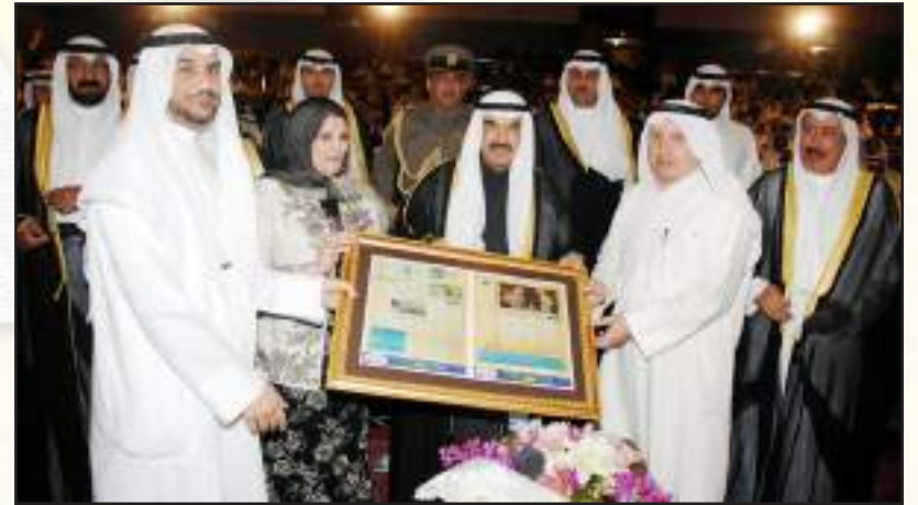
• نسخة من العدد الأول لجريدة آفاق الجامعية إهداء إلى سمو رئيس مجلس الوزراء بمناسبة مرور ٤٤ عاماً على انشاء جامعة الكويت